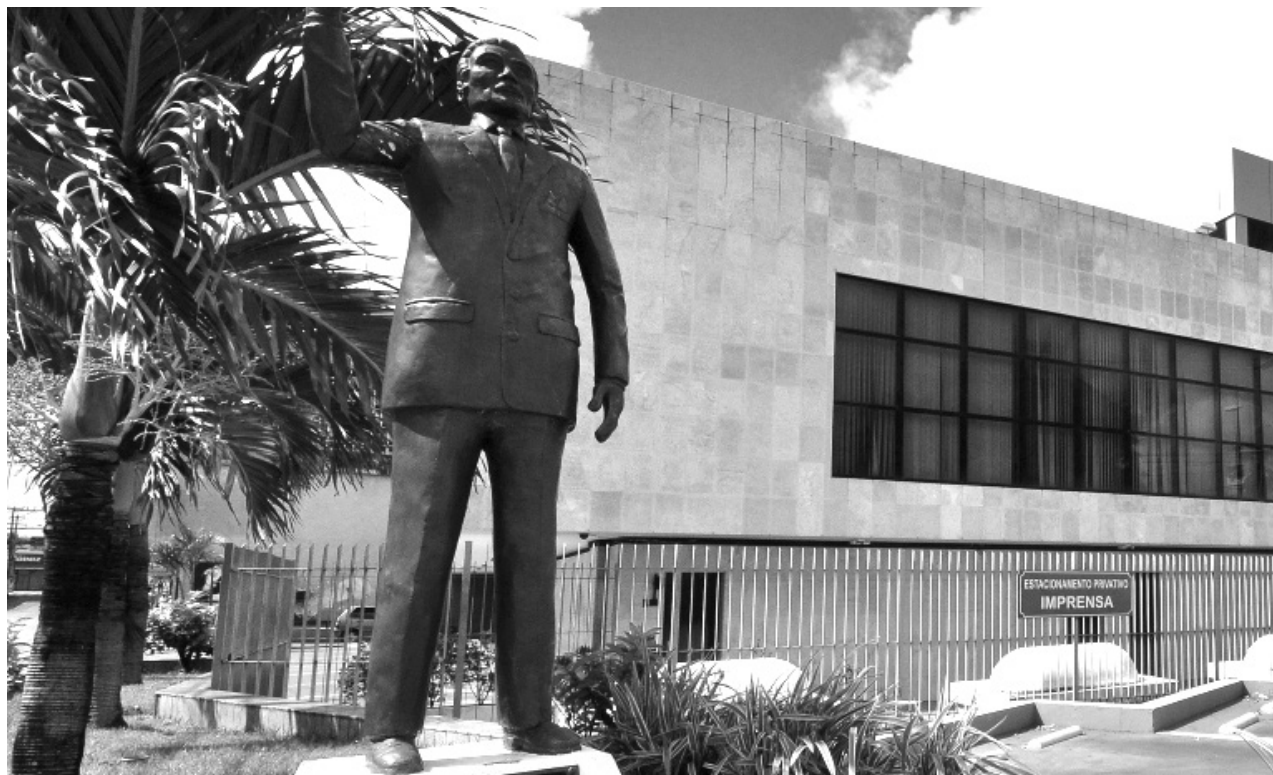
Seguindo os protocolos estabelecidos em razão da pandemia do novo coronavírus, a sessão de abertura dos trabalhos do Legislativo continuará em formato híbrido.

A sessão de abertura dos trabalhos legislativos poderá ser acompanhada pela imprensa e sociedade civil ao vivo pela Tv Assembleia, canal 10.3, pelo portal al.rn.leg.br e pelas redes sociais no @assembleiarn.