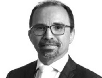
SANDRO PIMENTEL (PSOL)

“É com enorme expectativa e responsabilidade que vamos reiniciar os trabalhos em mais uma Sessão Legislativa. Tenho certeza que este parlamento continuará assíduo nas suas atribuições e atividades mesmo em um momento atípico em que vivemos, sempre com. O objetivo é promover o debate e o bem estar social do povo potiguar, cumprindo assim nosso papel institucional”.