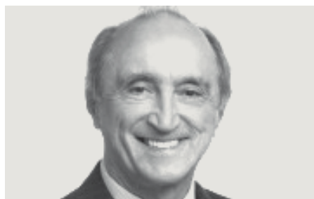
GETULIO RÉGIO (DEM)

"2021 será um ano de retomada e oportunidade aos estados sobreviventes e economia. Aqui no Rio Grande do Norte, o objetivo será o reconhecimento e a adoção das mesmas atitudes em relação à saúde. Cobraremos produtividade e eficiência".