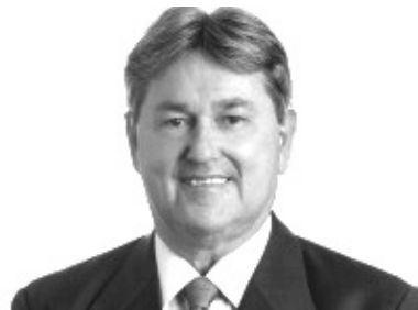
TOMBA FARIAS (PSDB)

“Vamos reforçar o trabalho pela Segurança e na fiscalização dos gastos públicos, em especial na vacinação contra a Covid-19. Além disso, a defesa pelos servidores públicos estaduais e buscar atender aos pleitos dos municípios potiguares em áreas como saúde, educação, segurança, infraestrutura, turismo e desenvolvimento econômico”.