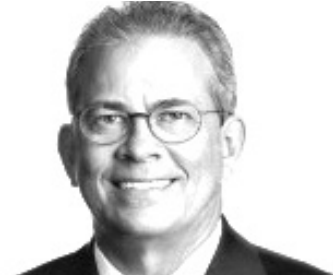
HERMANO MORAIS (PSB)

“Daremos início a mais um ano legislativo onde daremos continuidade ao nosso trabalho como parlamentar, tendo as ações voltadas para o desenvolvimento do RN e, sobretudo, ações voltadas para a saúde do povo potiguar como a nossa principal linha de atuação. Ressaltando ainda que o nosso Estado enfrenta a pandemia bem como os seus reflexos e por este motivo deve contar com o trabalho e dedicação de seus parlamentares”.