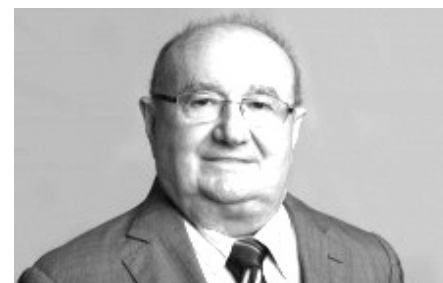
JOSÉ DIAS (PSDB)

"2021 começou com um sopro de esperança com a chegada da vacina contra a Covid, mas muita luta precisa ser feita a fim de garantirmos vacina para todos. Teremos também muito trabalho pela frente para recuperar o RN econômica e socialmente dos efeitos da pandemia. Seguimos na resistência e determinação para que o RN possa ser do tamanho dos sonhos do povo potiguar".