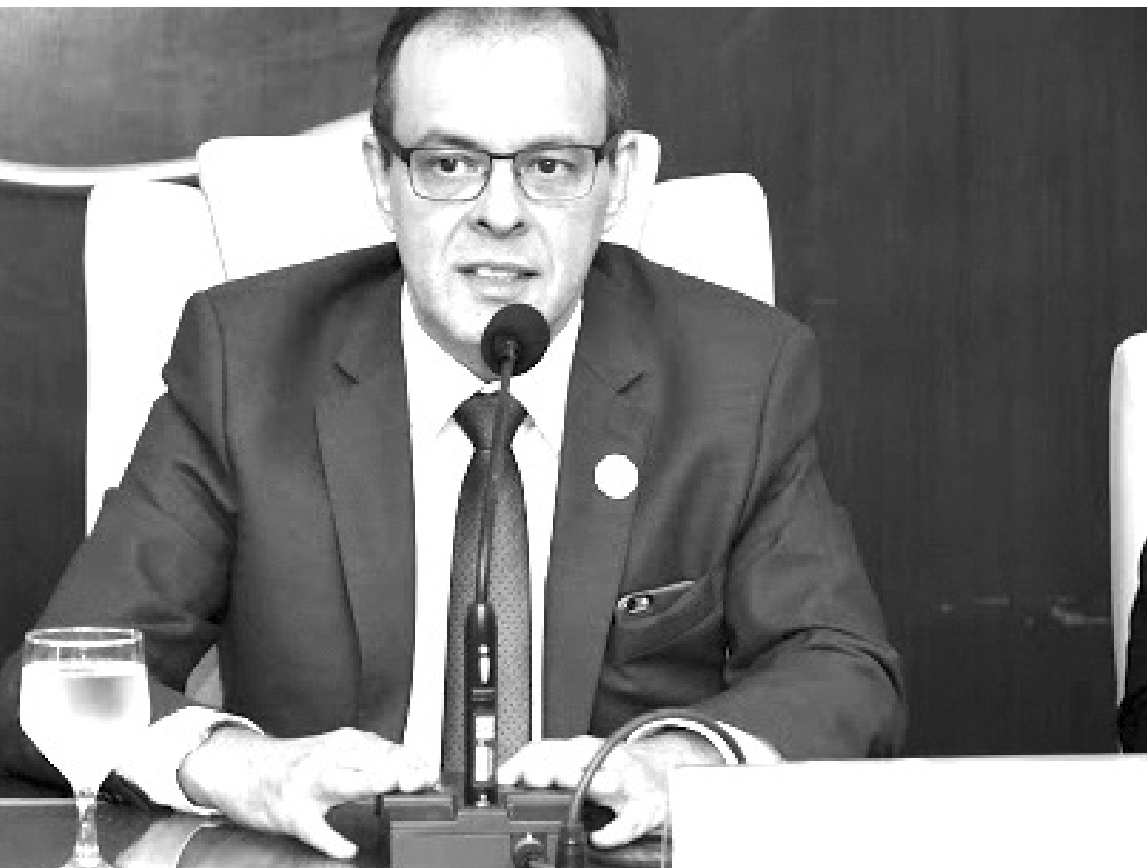
Proprietário do grupo de trabalho para a atualização da Constituição: “A essência da PEC foi a compatibilização da Constituição Estadual com a Constituição Federal”

que limita os poderes e funções do Estado. Ao longo do tempo, o documento precisou passar por modificações e intervenções foram feitas por meio de Propostas de Emendas Constitucionais, que resultaram em quatro Emendas