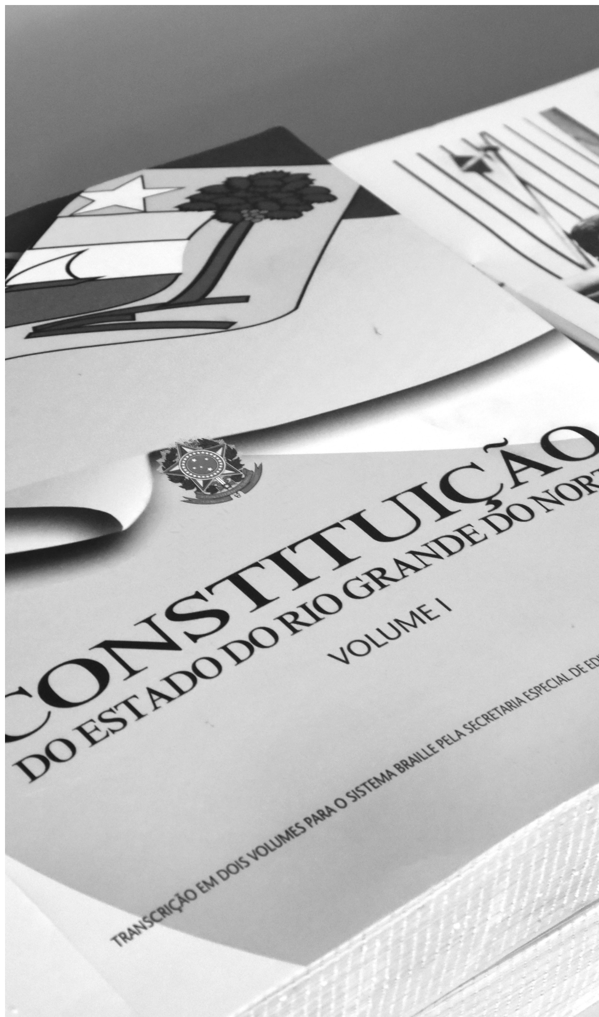
A Constituição do Rio Grande do Norte, que foi promulgada em 1989, também sofreu alterações pertinentes ao ordenamento jurídico estadual