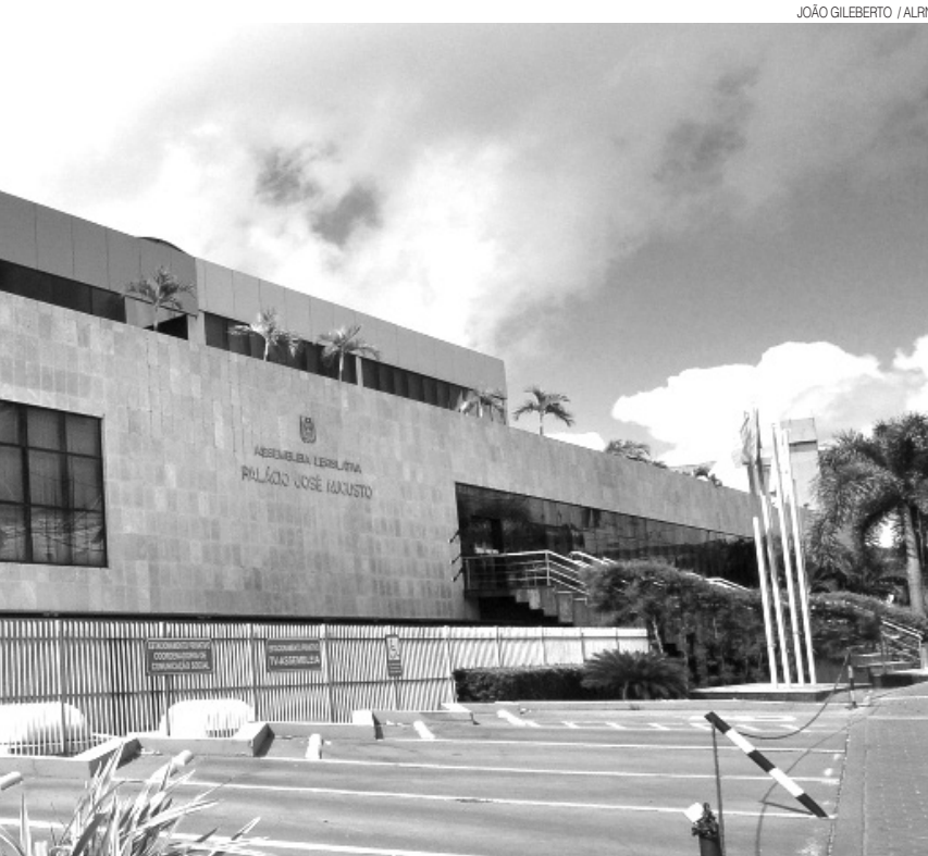
JOÃO GILBERTO / ALRN

id-19, a sessão de abertura será realizada de forma híbrida. Alguns atos tradicionais foram suspensos para evitar aglomerações. Casa deve manter seu ritmo de atividades em 2021