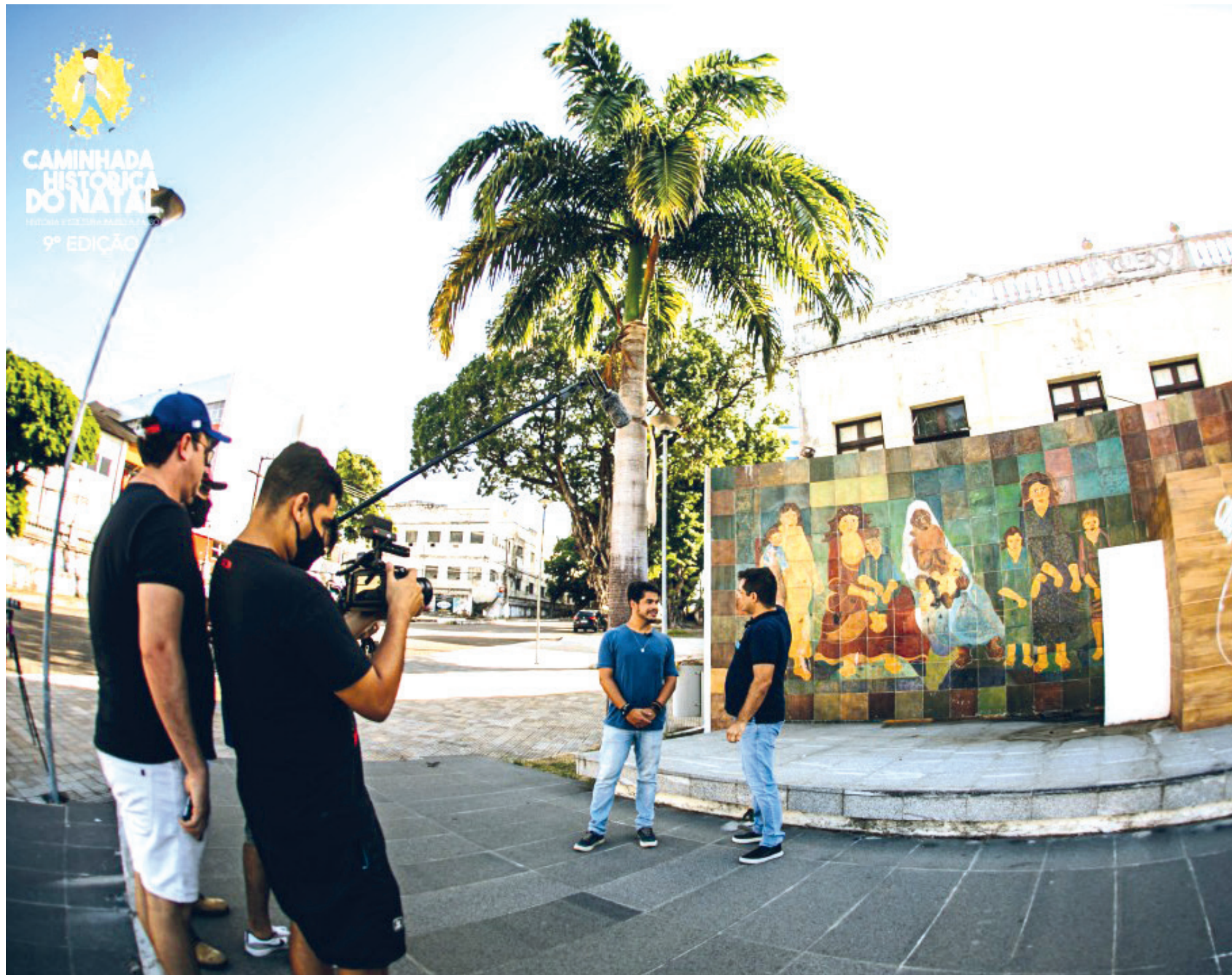
A 9ª edição da Caminhada Histórica de Natal aconteceu no último domingo, dia 31 de janeiro, e por causa da pandemia da Covid-19 foi realizada em formato inédito, com a exibição de um vídeo