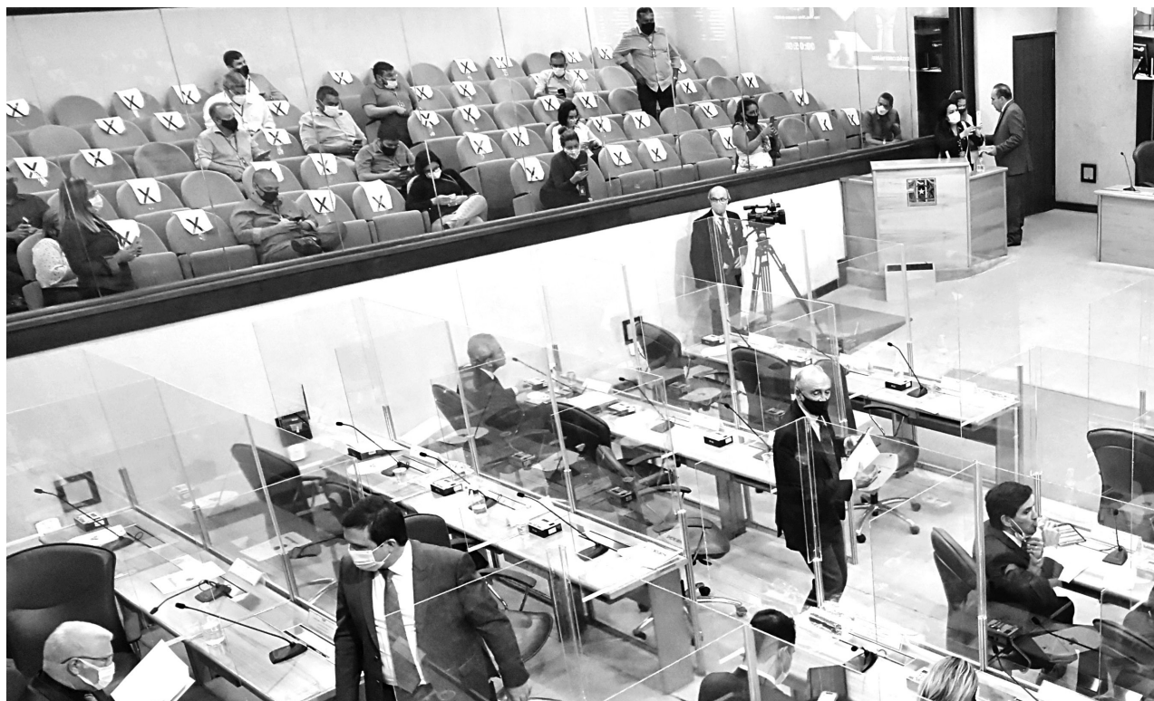
Sessão de abertura dos trabalhos legislativos poderá ser acompanhada pela imprensa e sociedade civil ao vivo pela Tv Assembleia, canal 10.3, pelo portal al.rn.leg.br e pelas redes sociais no @assembleiarn.