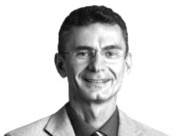
FRANCISCO DO PT

ar do ano atípico e dos andemia, a Assembleia do exemplo para outras inovações adotadas. Em bate ao coronavírus, a ndo a sua contribuição. des, o Legislativo será ortantes para o RN”.