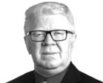
UBALDO FERNANDES (PL)

“O ano de 2021 continuará sendo um ano de desafios para todos os potiguares. Com o início da vacinação contra a Covid-19, surge uma luz no fim do túnel e a renovação da esperança por dias melhores. Continuaremos na Assembleia, focado na defesa dos municípios, discutindo e aprovando projetos voltados para o desenvolvimento do Estado, e trabalhando pela valorização do Poder Legislativo junto à opinião pública”.