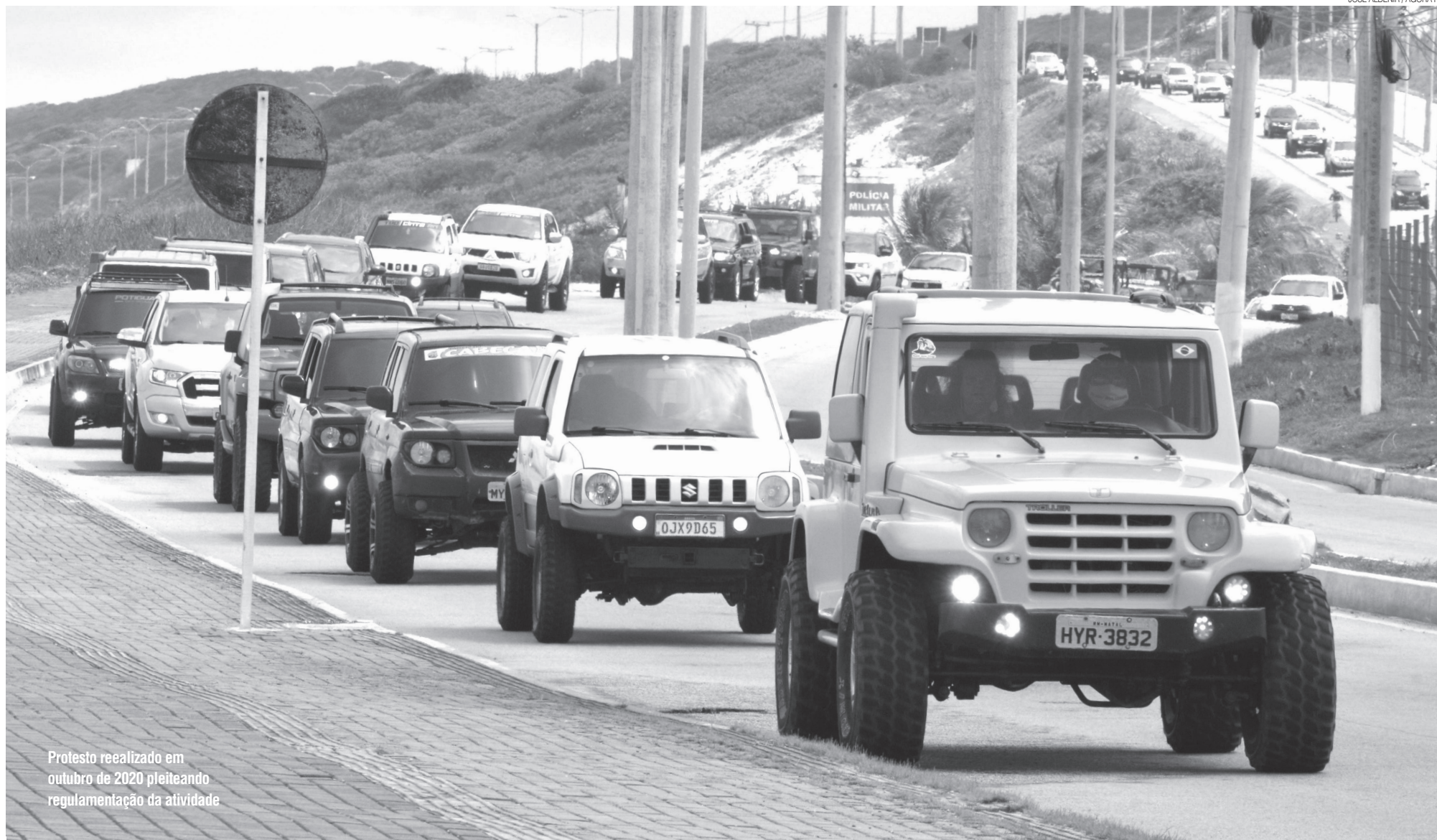
Protesto realizado em outubro de 2020 pleiteando regulamentação da atividade