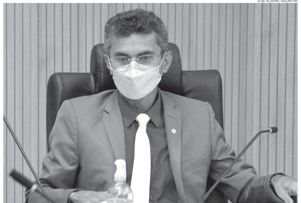
Deputado Francisco do PT foi designado como relator