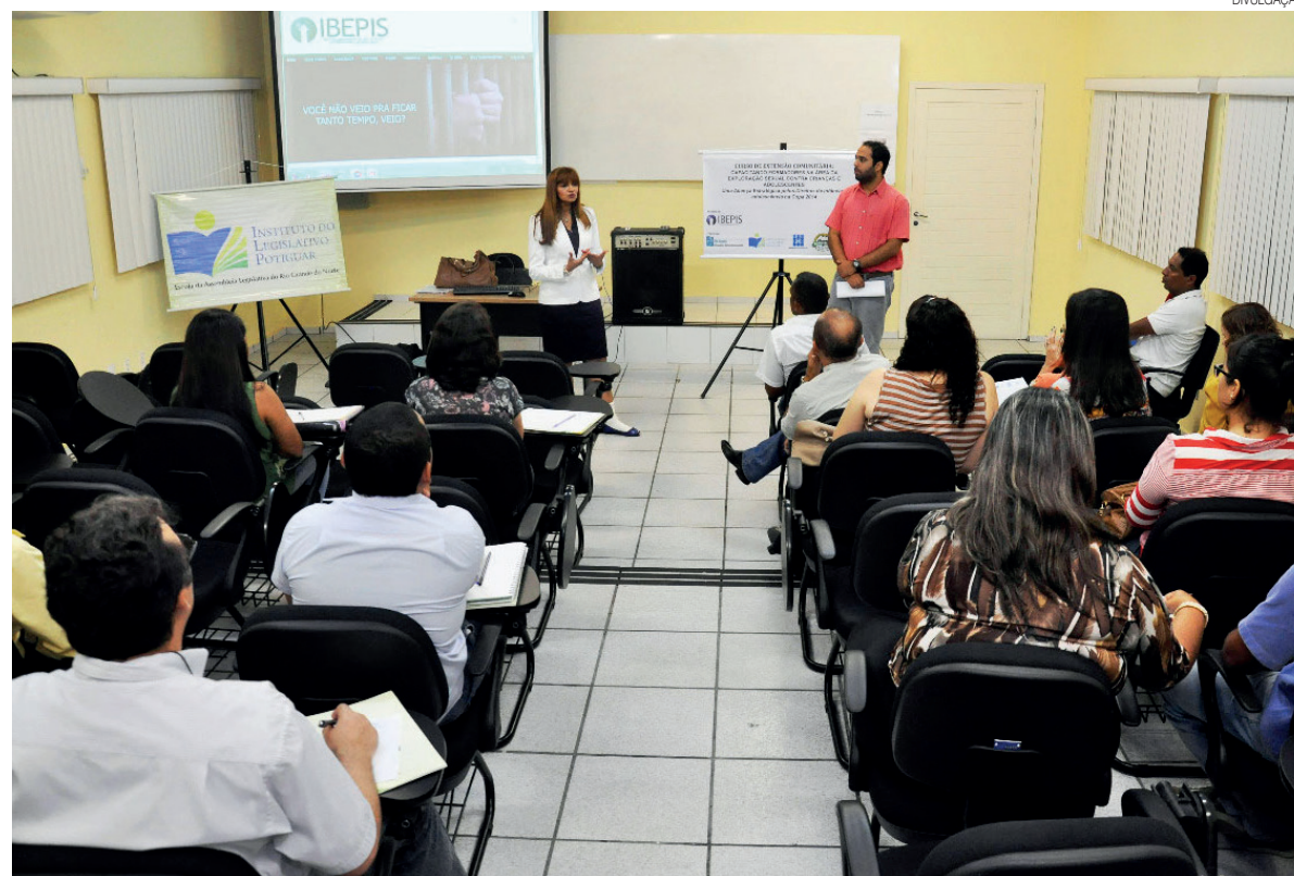
Após um período extenso de aulas online, a Escola da Assembleia retorna com aulas presenciais começando por Guamaré

Entre os cursos exclusivos para servidores da Assembleia, serão