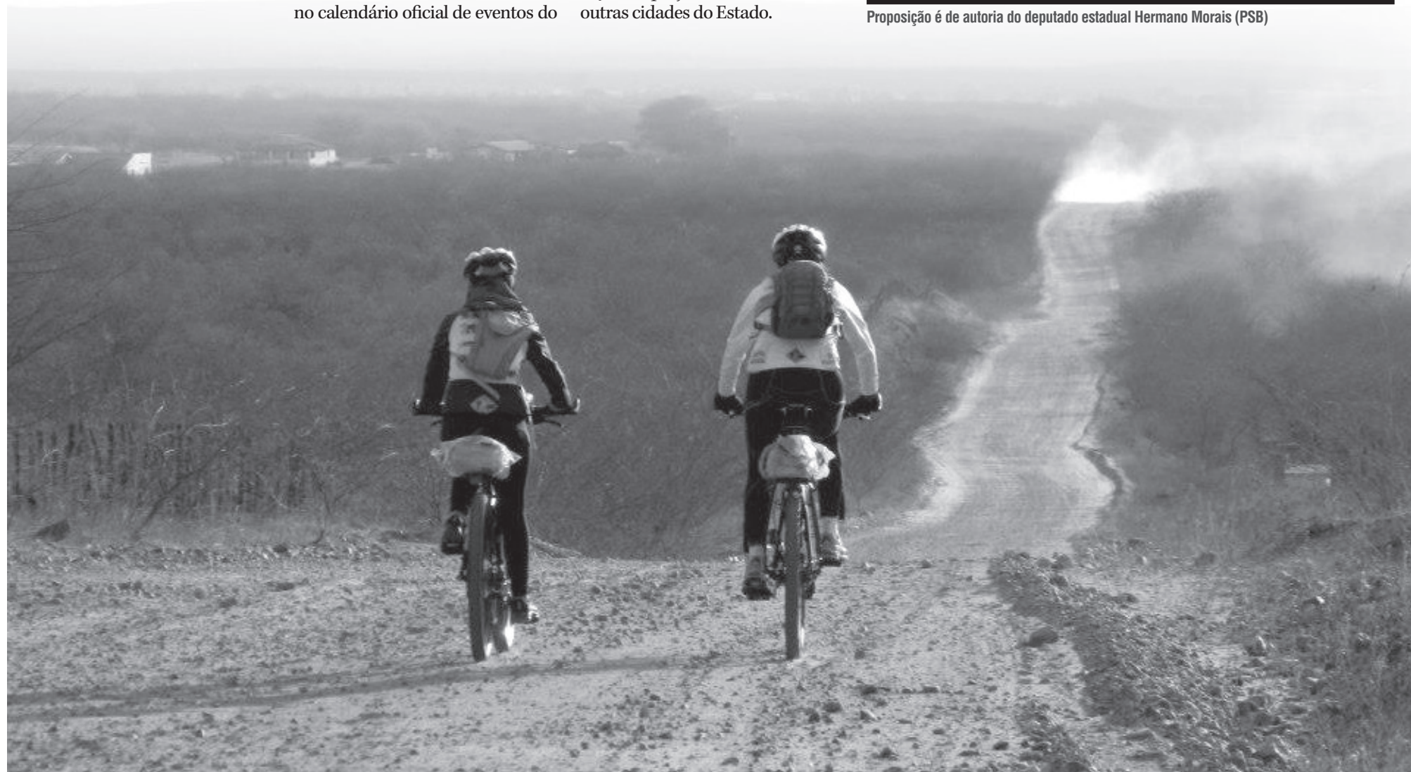
Proposição é de autoria do deputado estadual Hermano Morais (PSB)