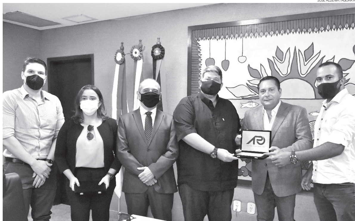
Grupo de jipeiros integrantes de entidades representativas do movimento celebraram o fomento à economia

A lei deverá ser aplicada em conjunto e consonância ao código de trânsito brasileiro, com as resoluções do CONTRAN e no que couber as normas técnicas da Associação Brasileira de Nor-