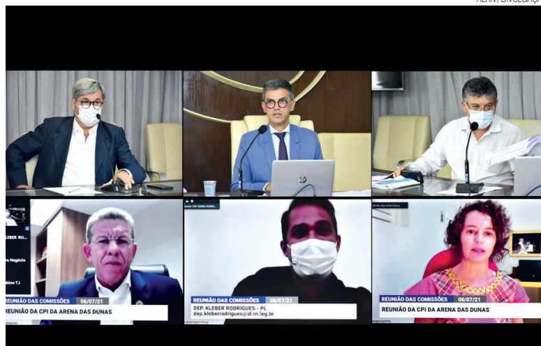
Retomada se deu ainda em julho último, com apenas uma parte presencial

“É um momento importantíssimo para se apurar e investigar os gastos com a obra que foi alvo de polêmicas. A população precisa de esclarecimentos, de uma resposta. Não pode passar despercebida