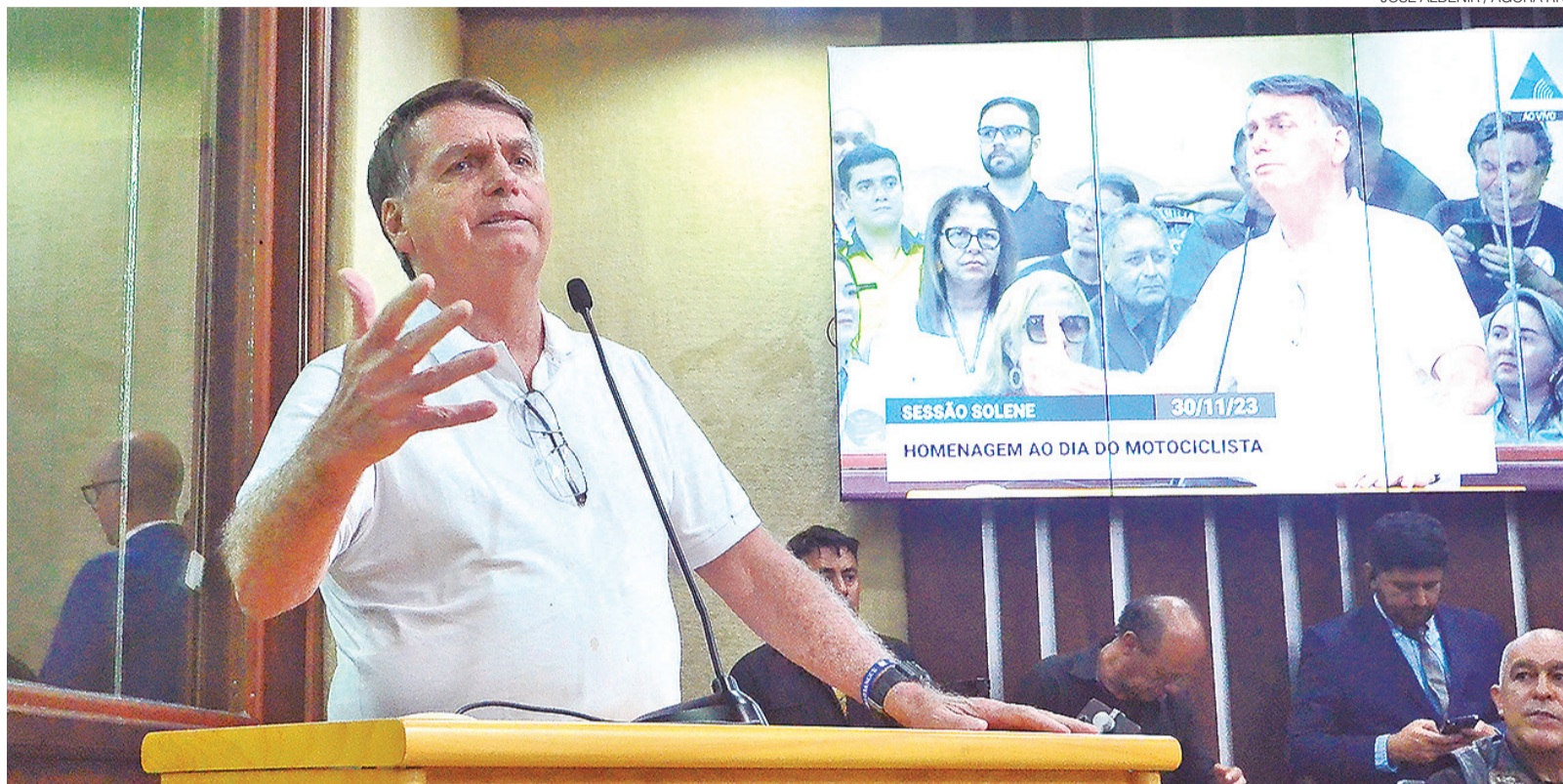
Ex-presidente Jair Bolsonaro (PL) durante evento na Assembleia Legislativa do Rio Grande do Norte em novembro do ano passado: homenageado na Casa

Os demais indiciados pela PF foram Bento Costa Lima Lei-