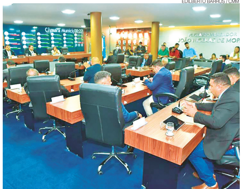
Plenário da Câmara Municipal de Mossoró vai abrigar audiência no dia 11

Na recomendação, o procurador da República Emanuel de Melo Ferreira destaca que o golpe militar não restaurou a lei e a ordem, mas, na verdade, iniciou uma ditadura que cometeu graves crimes contra a humanidade. Relatório Final da Comis-