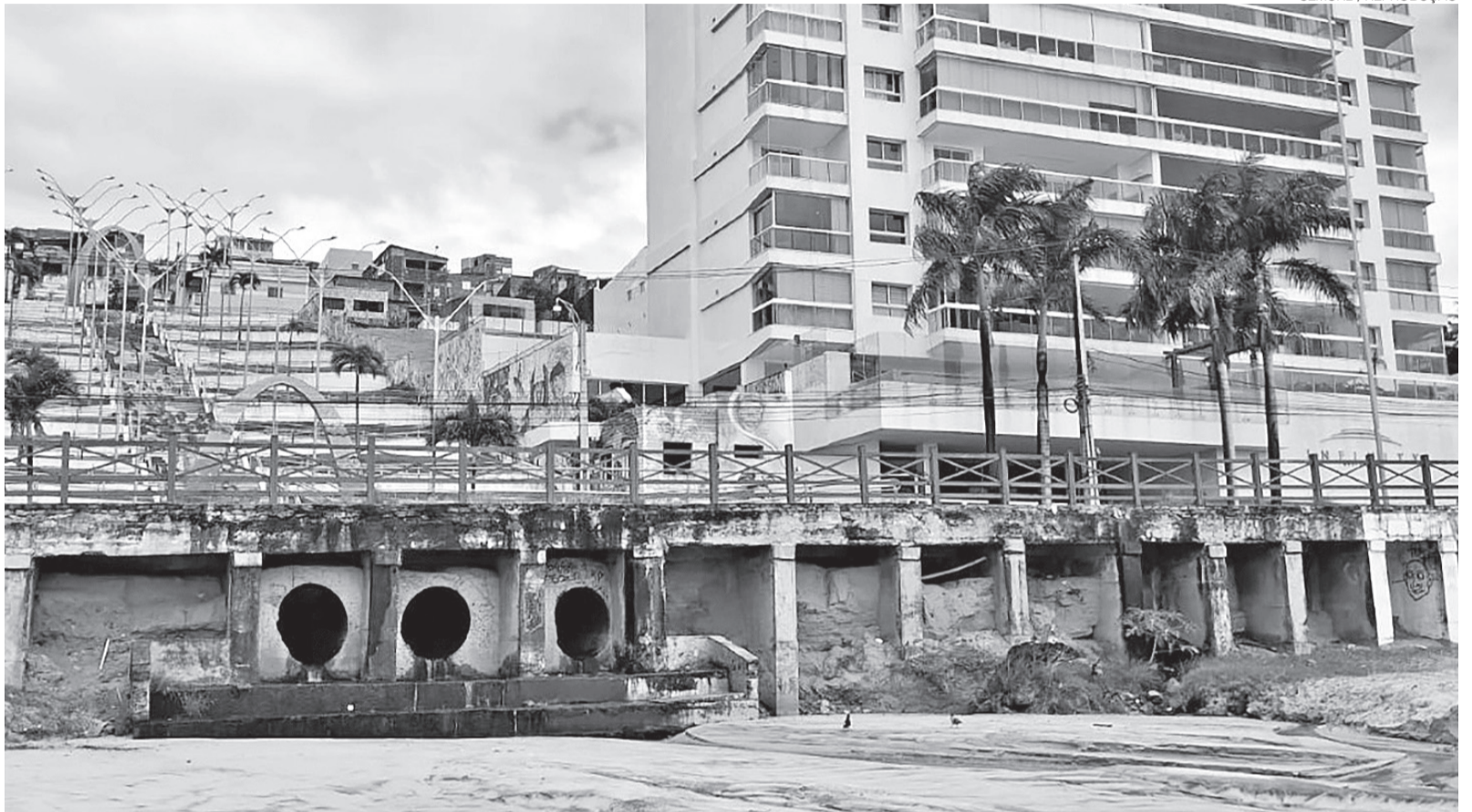
Na última terça-feira 2, a prefeitura multou três empreendimentos nos bairros de Areia Preta e Mãe Luiza: um condomínio, um motel e um restaurante

As praias de Areia Preta e Ponta Negra têm tido trechos impróprios para banho em função de poluentes. Além disso, foram encontradas contribuições de esgotos na rede de drenagem que está sendo substituída pela empresa contratada