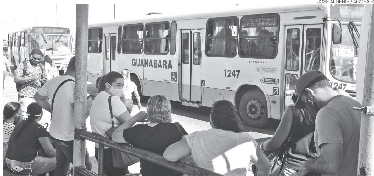
Usuários aguardam transporte coletivo em parada no Igapó, Zona Norte de Natal: ônibus lotados e que demoram

A consulta pública tem por objetivo reunir contribuições e informações que poderão auxiliar na modelagem jurídica, téc-