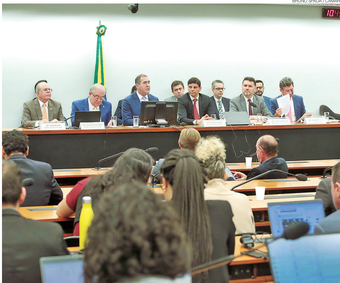
Deputados federais integrantes do grupo de trabalho que discute regulamentação da reforma tributária

O relatório prevê ainda que carros elétricos e jogos de azar estarão no grupo do “imposto do pecado”, ou seja, que pagarão uma alíquota seletiva, maior. Absorventes higiênicos foram incluídos na lista de pro-