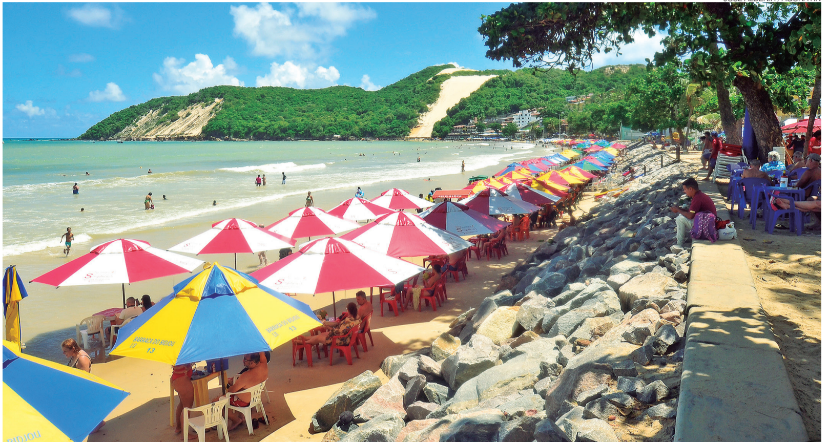
Licença precisa ser emitida até hoje porque há uma “janela ambiental” aberta de julho até o fim de outubro para a realização da obra, segundo a prefeitura

No consórcio contratado pela Prefeitura de Natal, uma das integrantes é a empresa DTA Engenharia, que pretende iniciar a obra até esta sexta-feira 5. A draga que será usada no serviço já está em Natal. No entanto, a obra não tem autorização para começar. O custo operacional do equipamento é de R$ 500 mil por dia – ou seja, se houver mais