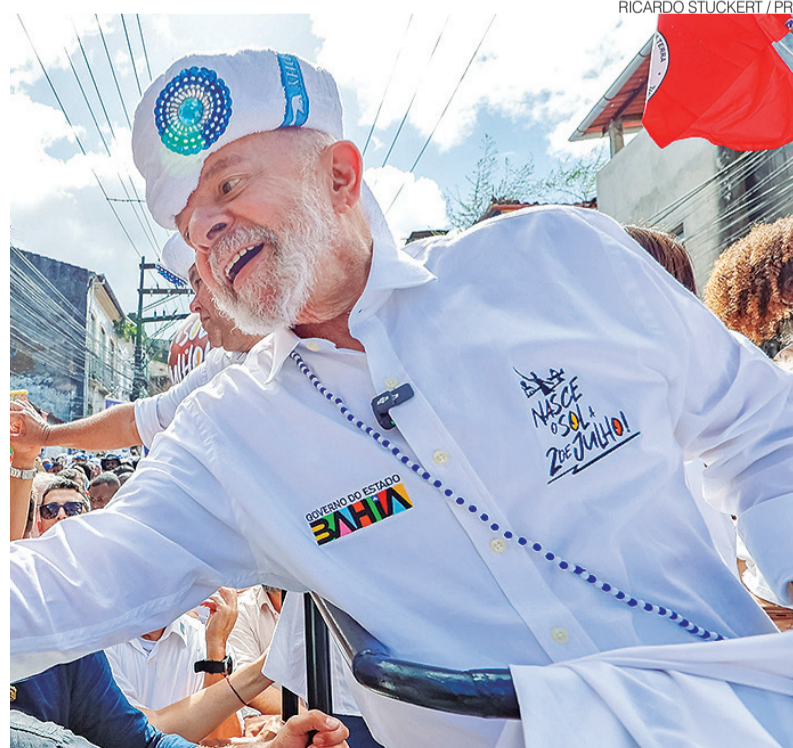
Presidente Luiz Inácio Lula da Silva durante comemoração do 2 de Julho em Salvador

Para a PF, o ex-presidente utilizou a estrutura do governo federal para desviar presentes de alto valor oferecidos a ele por autoridades estrangeiras. ●