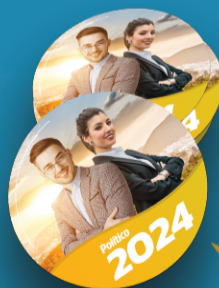
Adesivo redondo p/ carro