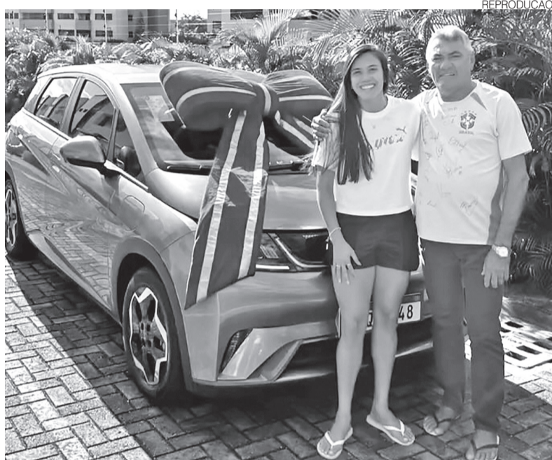
Atleta potiguar presenteou o seu pai com um carro novo antes de ir para Paris

Figurinha carimbada nas convocações do time brasileiro,