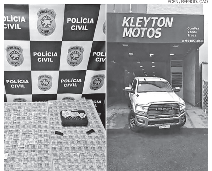
Foram apreendidos dinheiro, munição, carros de luxo e motos adulteradas

A operação de busca e apreensão contou com o apoio do Grupo Tático Operacional (GTO), do 14º Batalhão de Polícia Militar. ●