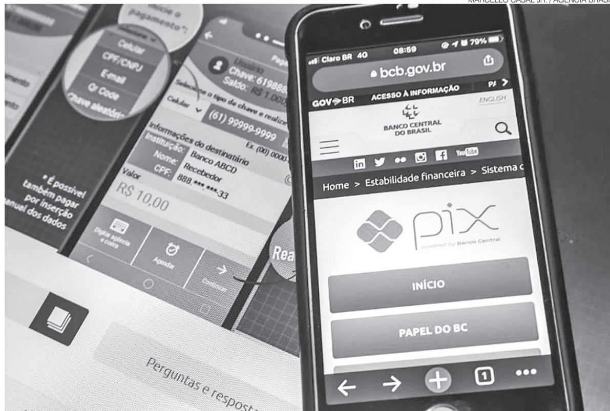
Lançamento da nova funcionalidade de pagamentos está previsto para 28 de fevereiro de 2025, segundo o BC

“A mudança abrirá espaço para a realização de pagamentos por aproximação com o Pix, permitindo que o usuário realize a transação sem a necessidade de acessar o aplicativo de sua instituição financeira”, acrescentou. ●