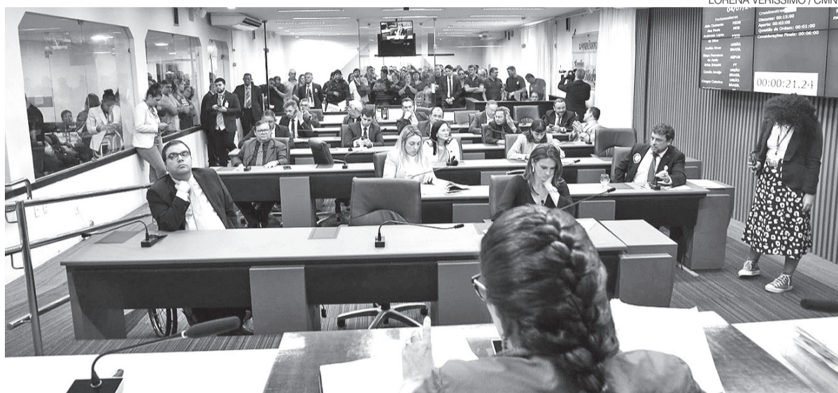
Sessão desta quinta-feira 4 que aprovou projeto para mudar regime previdenciário de parte dos servidores de Natal

Com a saída do grupo de aposentados do Funfipre, a prefeitura deverá ter um alívio mensal estimado em R$ 9 milhões – dinheiro que não precisará mais ser tirado do Tesouro para pagar aposentadorias.