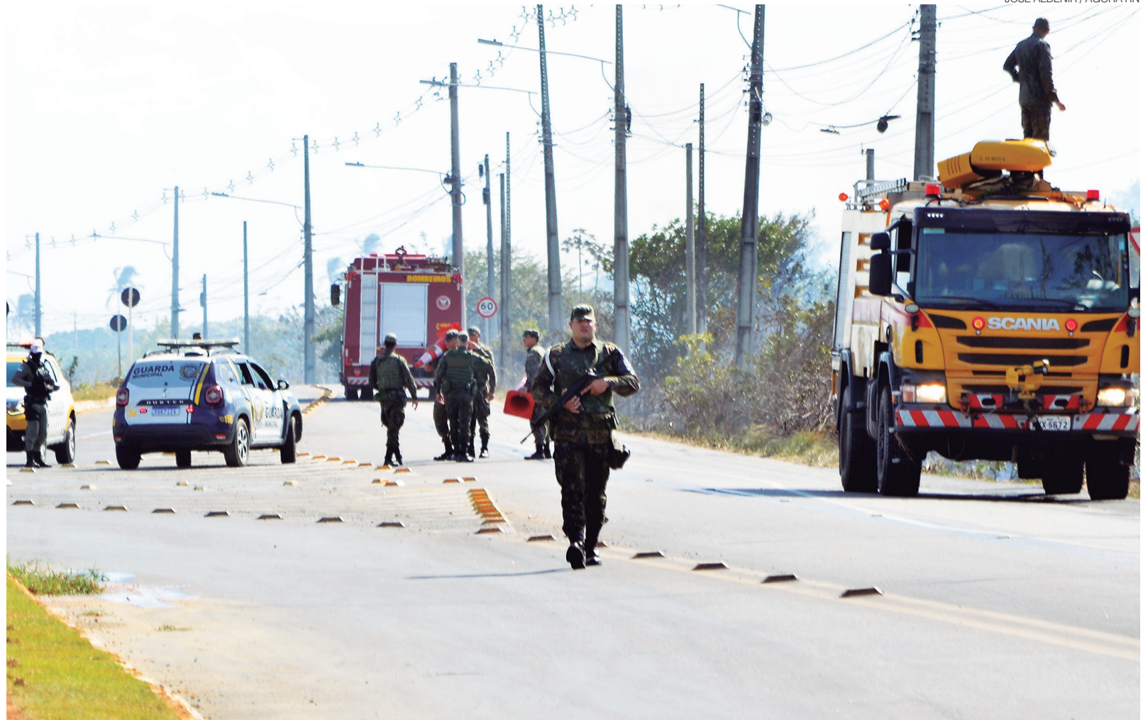
Militares interditam trecho da RN-313, próximo à Coophab, após queda de caça da FAB na tarde desta terça-feira em Parnamirim; piloto conseguiu escapar

Um morador de um condomínio próximo relatou que não encarou o acidente com sur-