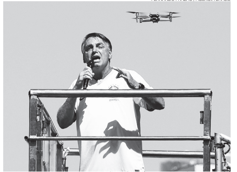
Ex-presidente Jair Bolsonaro em manifestação política na orla de Copacabana

Sobre a comunicação com outros investigados, o ministro do STF disse que a proibição de contato – seja pessoalmente, por telefone, e-mail ou qualquer outro método, inclusive por intermédio de terceira pessoa – é necessária para que não haja “indevida interferência” nas investigações.