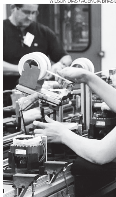
Economia deve crescer além das expectativas

Somente em 3 de dezembro, o Instituto Brasileiro de Geografia e Estatística (IBGE) divulgará o PIB do terceiro trimestre. No segundo trimestre, a economia brasileira