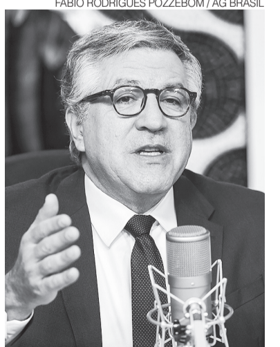
Ministro Alexandre Padilha (SRI)

O evento será às 14h, no auditório da Governadoria, no Centro Administrativo do Estado, Av. Senador Salgado Filho, s/n, Lagoa Nova, no