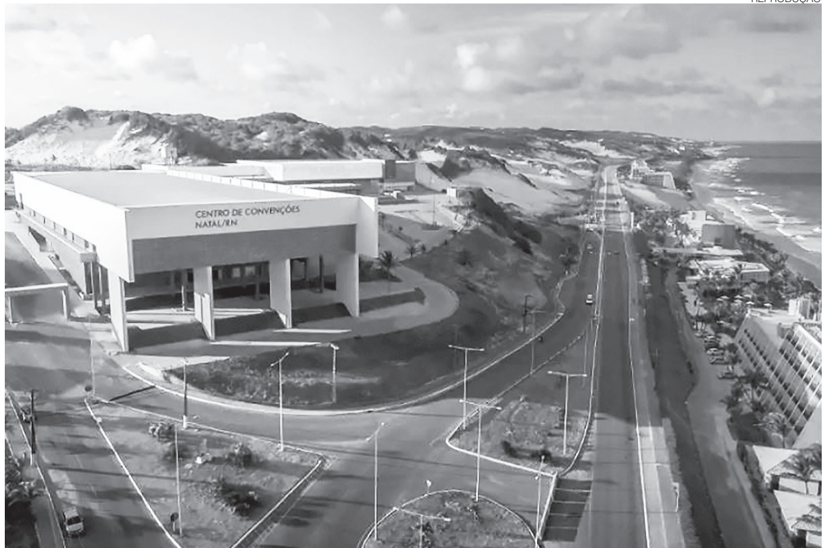
Vista aérea do Centro de Convenções de Natal, um dos principais equipamentos do RN para realização de eventos