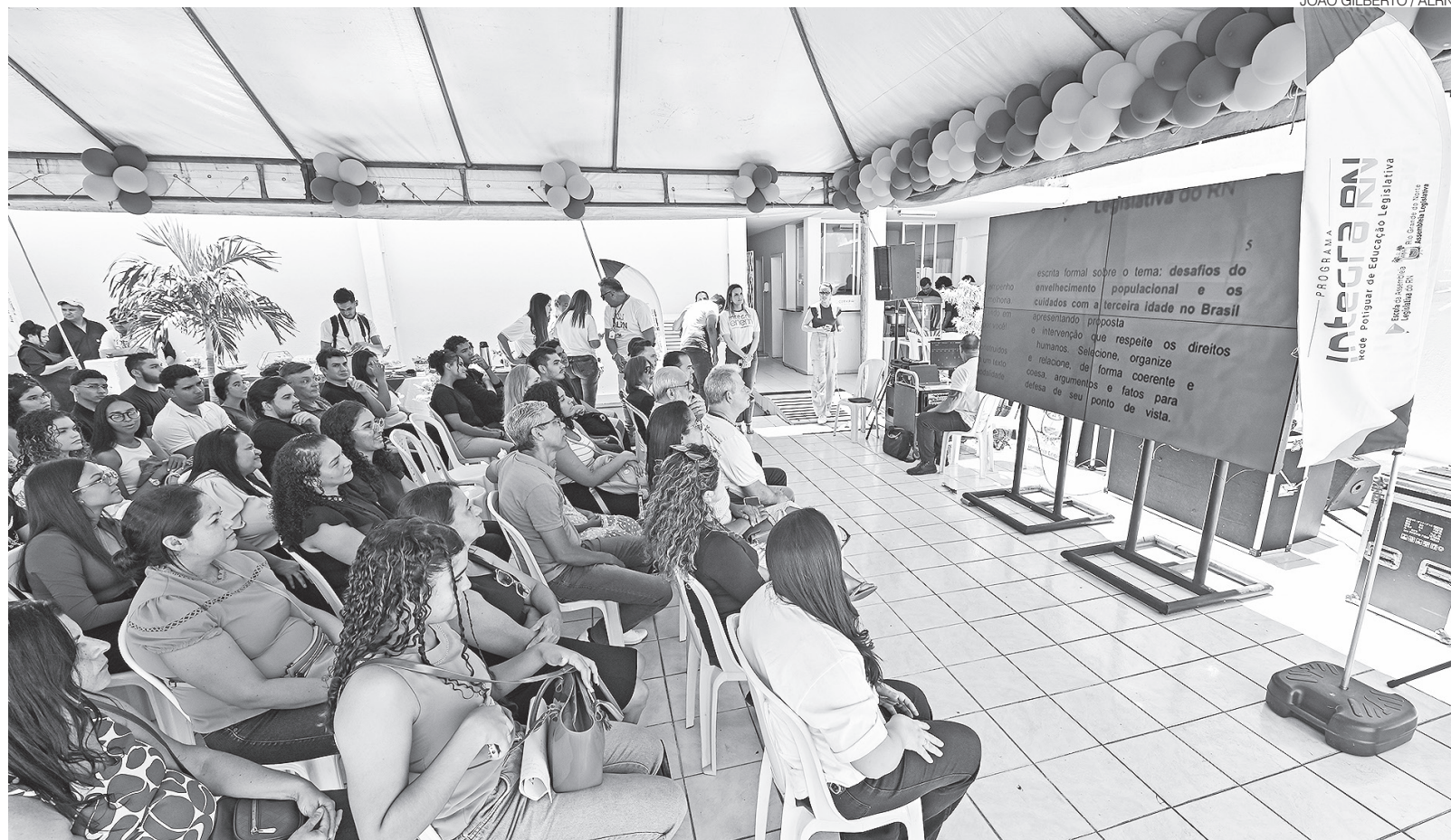
Aulão de encerramento do Integra Enem após vários fins de semana de atividades; mais de 2,5 mil alunos acompanharam o projeto em 65 municípios do RN

A preparação contou com docentes do IFRN, selecionados pela Funcern. No aulão de encerramento, realizado no dia 15, a programação incluiu revisões de Física, Química e Biologia, em um clima de confraternização.