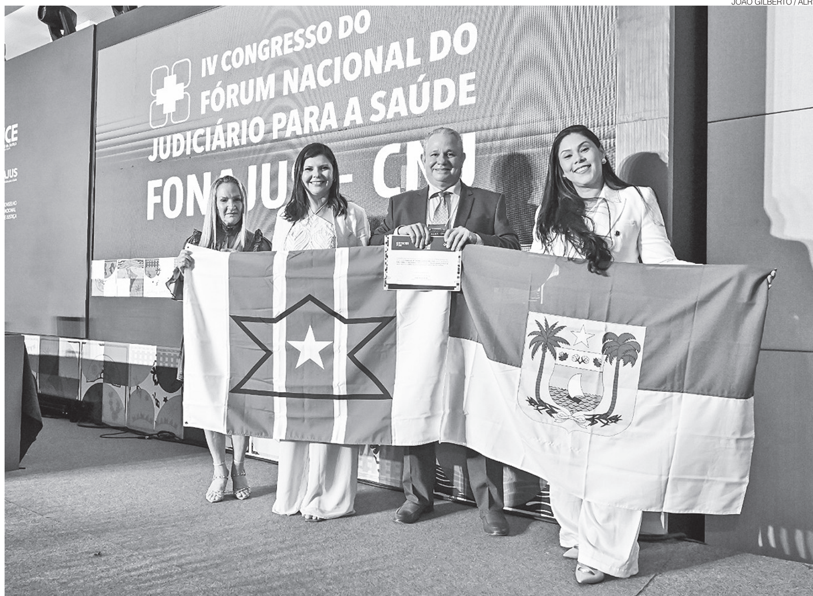
Entre as ações reconhecidas estão ambulâncias e leitos de UTI neonatal entregues; ALRN também foi destacada pela interiorização dos serviços de cidadania

Ações como a entrega de 141 ambulâncias aos municípios, equipamentos de Proteção In-