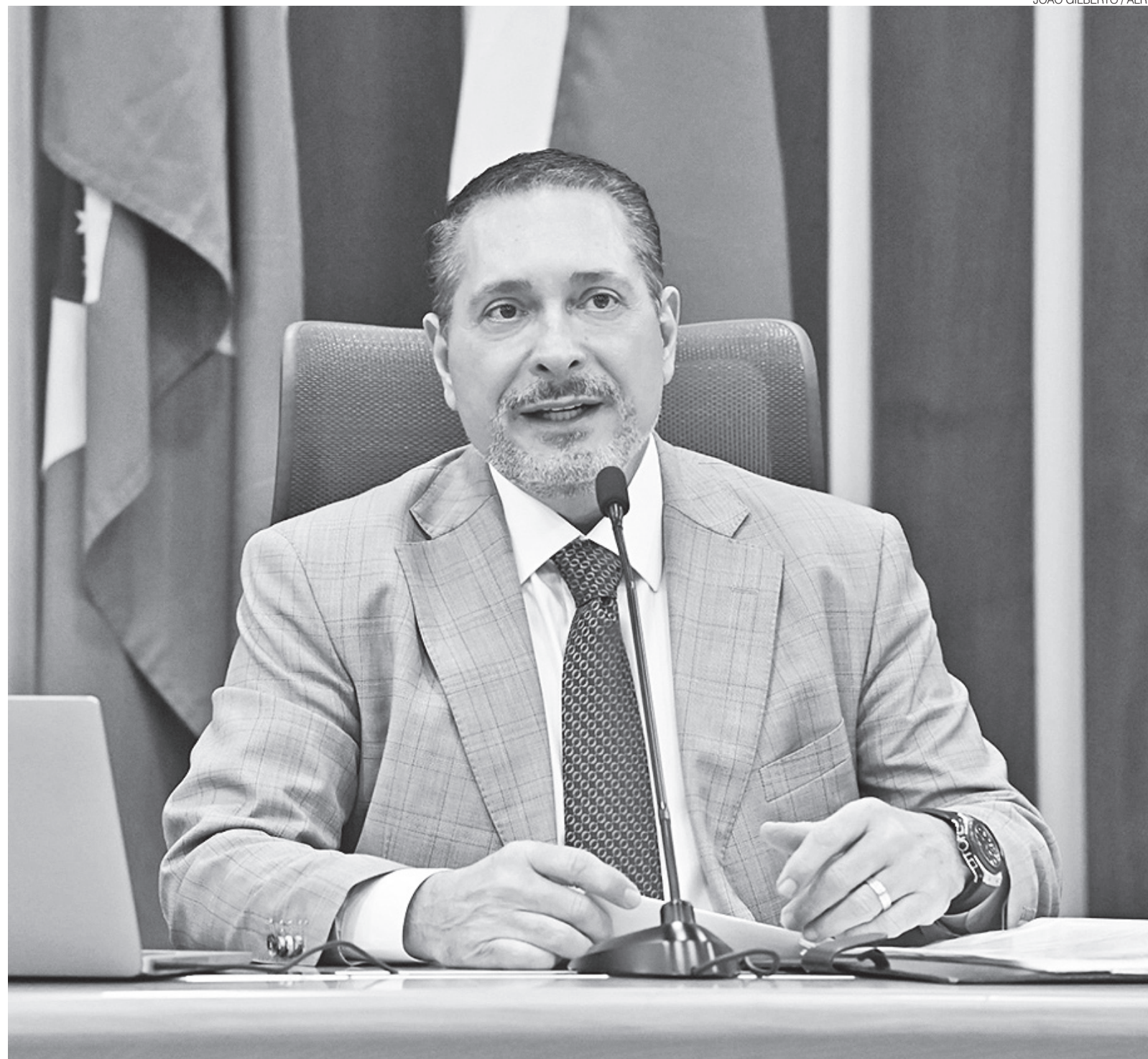
Presidente da ALRN, Ezequiel Ferreira (PSDB) apresenta iniciativas que reforçam a organização urbana e a preservação ambiental do Rio Grande do Norte

Complementando o conjunto de ações legislativas sancionadas, a Lei 12.526, também de 14 de novembro de 2025, confere o reconhecimento de Patrimônio Natural, Ambiental, Histórico, Turístico e Paisagístico do Estado do Rio Grande do Norte à Lagoa de Jacumã. Situada no município de Ceará-Mirim, a lagoa passa a ter seu valor in-