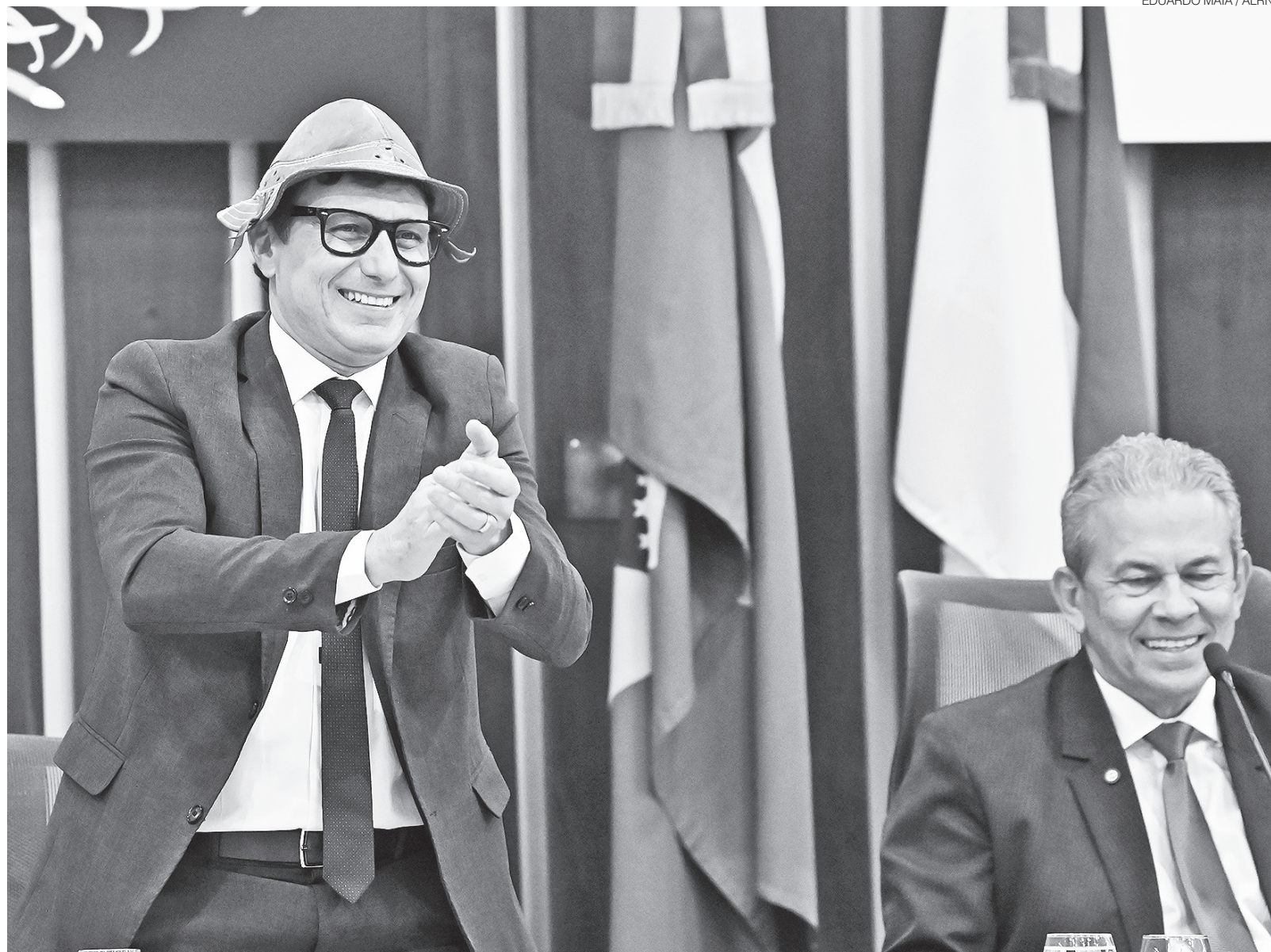
Humorista Mução recebe o Título de Cidadão Norte-Rio-Grandense em sessão marcada por emoção e casa cheia na Assembleia Legislativa do Estado

“Estamos aqui para homenagear uma pessoa que faz o Brasil inteiro rir com o melhor do humor nordestino”, afirmou. Mução agradeceu a honraria emocionado e ressaltou o vínculo afetivo com o estado: “Eu me considero potiguar. Sempre que me perguntam onde eu nasci, eu digo que foi no RN”.