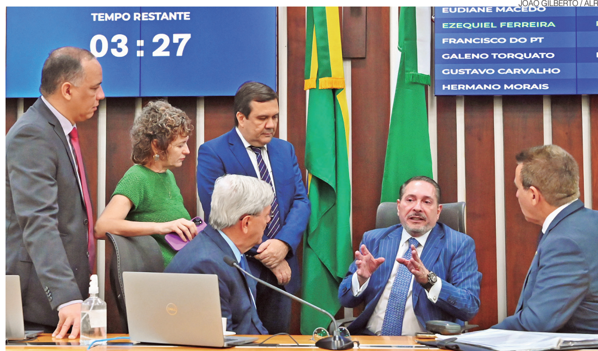
Deputados durante sessão na Assembleia, onde foram aprovadas as novas leis de reconhecimento patrimonial

Entre os destaques está a Lei 12.532/2025, que reconhece o Monumento Natural Cavernas de Martins (MONA Martins) como Patrimônio Natural, Am-