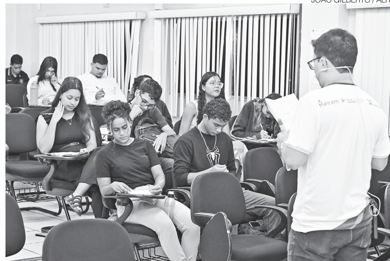
Transmissão ao vivo levou revisão do Enem a municípios de todas as regiões