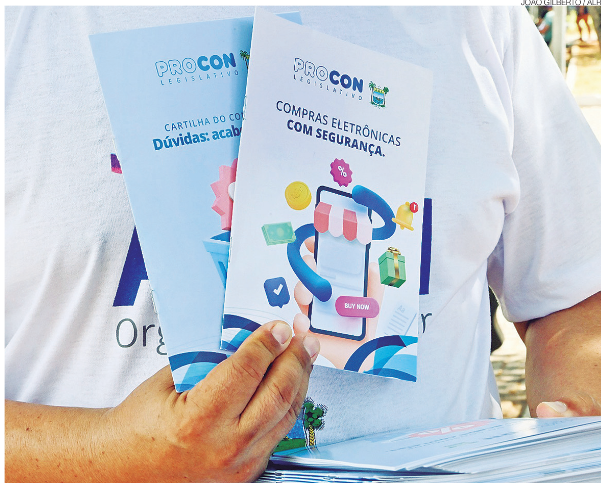
Descontos reais e preços “maquiados” convivem na Black Friday; orientação do Procon Legislativo é comparar valores

Esse quadro é coerente com o que outros Procons do Estado estão observando. Em Natal, por exemplo, o Procon municipal alerta para golpes envolvendo links falsos (phishing), sites que imitam grandes varejistas, cancelamento indevido de compras online e maquiagem de preços, que é quando a loja aumenta o