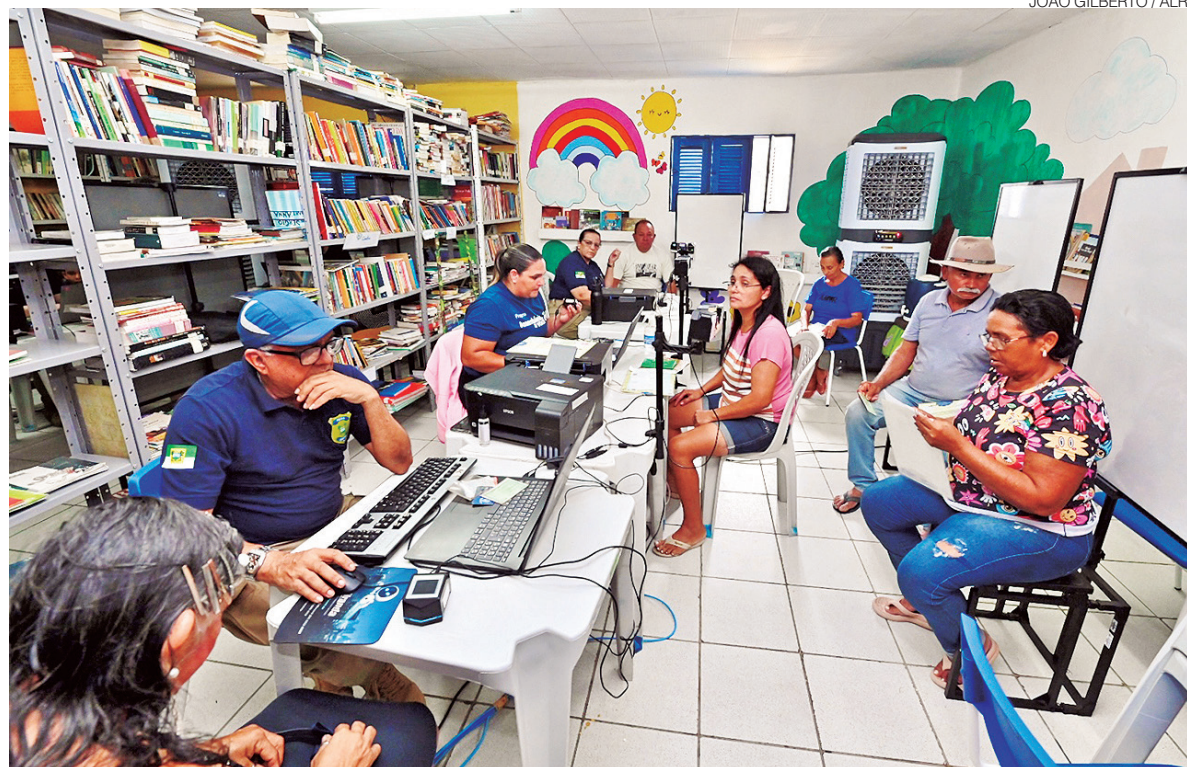
Ações de cidadania facilitam o acesso a documentos e serviços essenciais para moradores de municípios do interior

Complementando essa frente, o programa Em Ação, conduzido pela Diretoria de Representação Institucional da Casa, atua como uma força-tarefa de acolhimento. Com foco na prestação de serviços sociais e de saúde, a iniciativa chega aos bairros e municípios com uma abordagem ágil, reforçando o elo de cooperação entre o Parlamento e as comunidades locais.