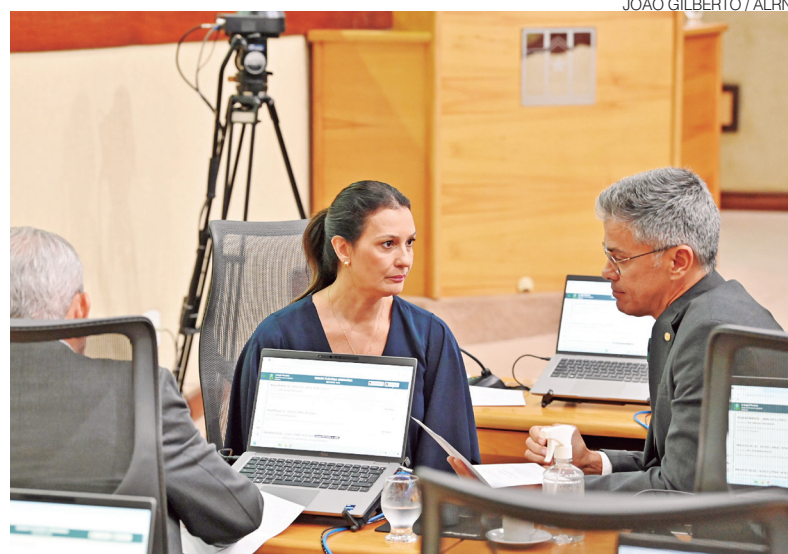
Deputados reforçam importância da identidade do RN em múltiplas vertentes

Com os novos reconhecimentos, o Estado amplia seu inventário cultural, histórico e ambiental, fortalecendo políticas de preservação e reafirmando a importância da identidade potiguar em suas múltiplas expressões.