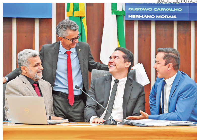
Deputados da Mesa acompanham projetos que ampliaram o acervo cultural