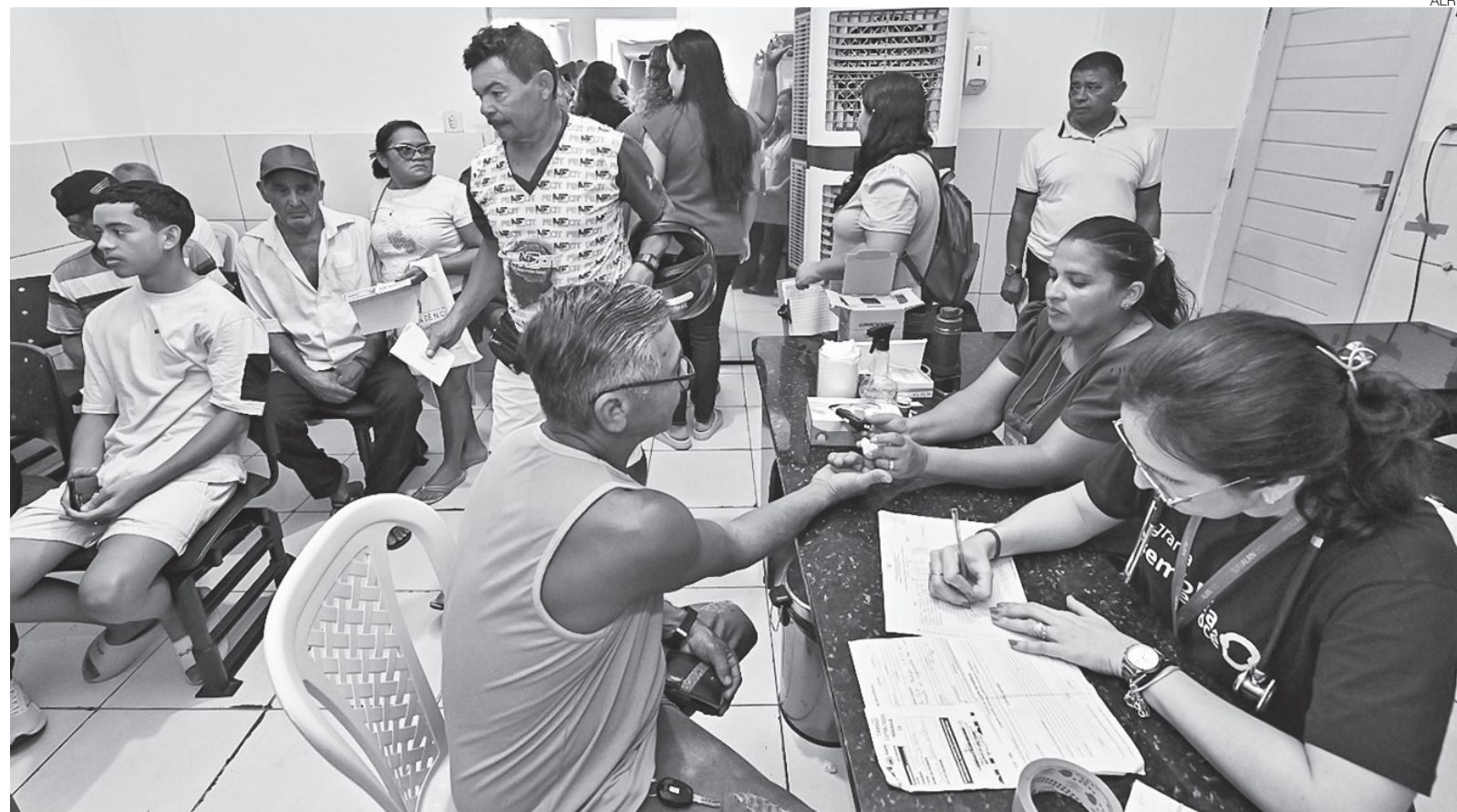
Atendimento integrado em saúde, cidadania e educação marcou todas as edições da iniciativa realizadas ao longo deste ano em diversos municípios potiguaros

propósito maior do programa que é ressignificar a presença do Estado, garantindo que as ações públicas não fiquem restritas à capital, mas cheguem a quem mais precisa, longe dos holofotes, mas no coração do Rio Grande do Norte.