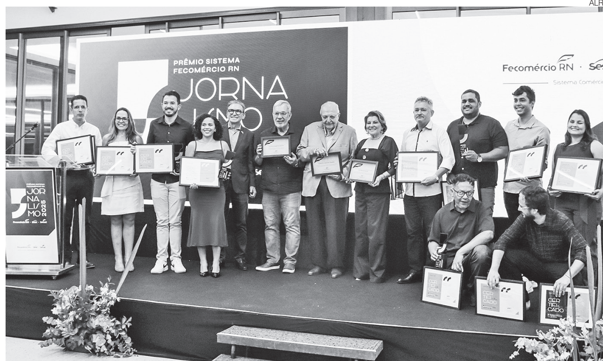
Reportagem especial de Lamonier Araújo venceu na categoria Telejornalismo e destaca a relação entre fé e economia

Exibida no Jornal da Assembleia 1ª edição, no dia 30 de outubro de 2025, a reportagem mostra como a fé do povo potiguar se conecta ao empreendedorismo e contribui para movimentar a economia do estado, a partir de iniciativas apoiadas pelo Sistema Fecomércio. Este é o segundo ano em que Lamo-