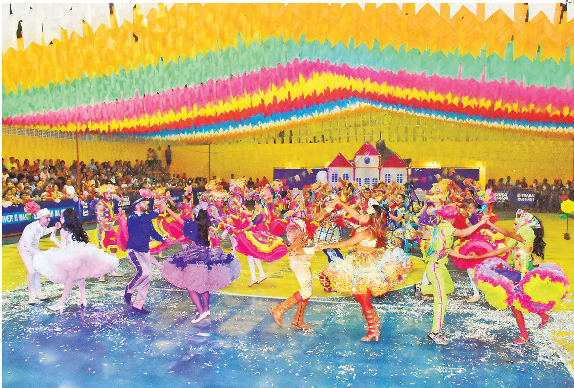
Grupos culturais, orquestras e quadrilhas juninas receberam título de patrimônio do Rio Grande do Norte; reconhecimento fortalece a cultura produzida nas cidades do interior e na capital potiguar