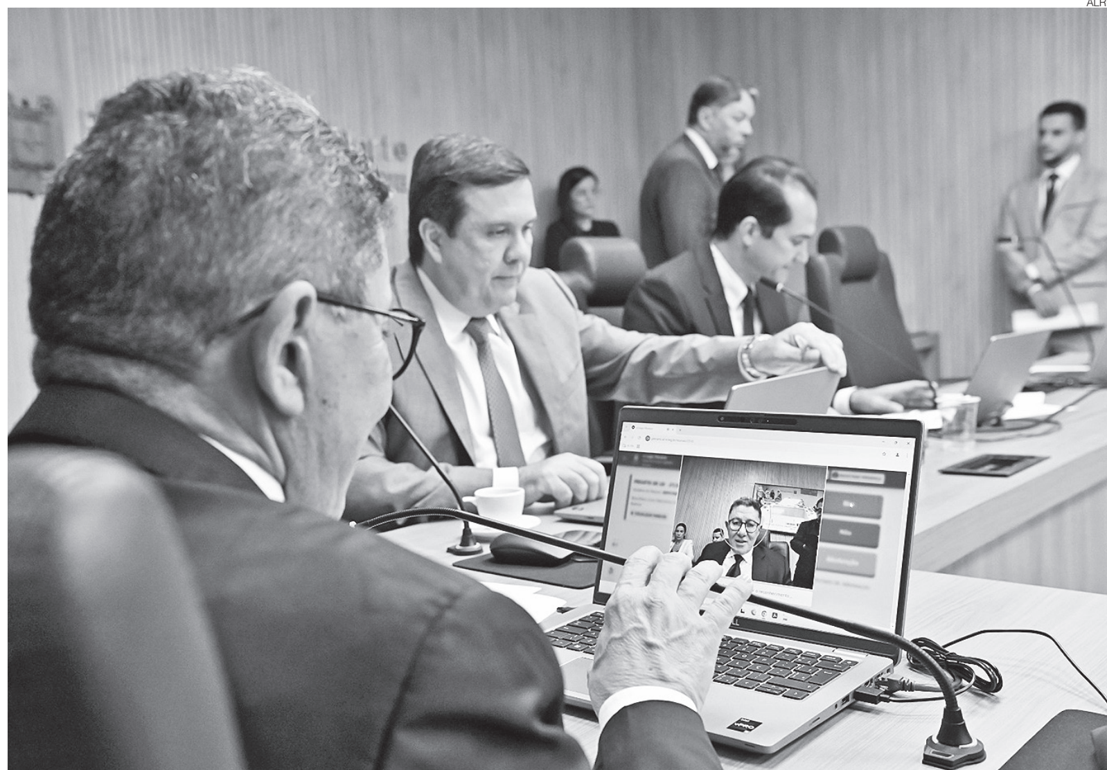
Produtividade dos deputados do RN: a atuação das Comissões inclui análise de projetos, fiscalização do Executivo e visitas técnicas a unidades públicas

“Seja na análise criteriosa dos projetos de leis, agora otimizada pelo avanço tecnológico no gerenciamento das reuniões das comissões e pela constante atualização do e-Legis, ou no suporte à fisca-