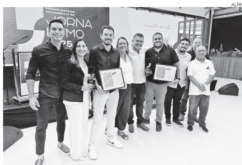
Premiação reconhece a qualidade do jornalismo produzido pela TV Assembleia

A matéria contou com produção de Alysson Bala, imagens de Cristiano Bezerra, edição de texto de Sérgio Farias e edição e finalização de Arison Silvino.