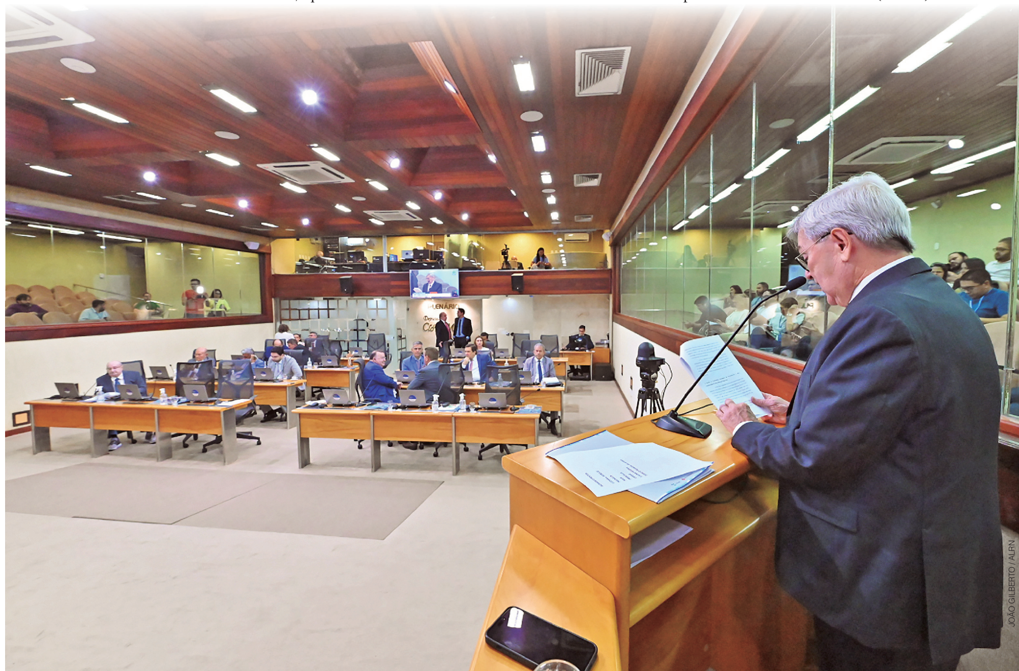
Deputados estaduais aprovam, em plenário, a Lei Orçamentária Anual, que estima receitas de R$ 25,67 bilhões; LOA define prioridades e limites para a aplicação dos recursos públicos do RN em 2026

centradas, sobretudo, na Previdência Estadual, seguida pelos gastos com Educação, Saúde e Segurança Pública. O texto aprovado aponta que essas áreas consomem a maior parte do orçamento e contribuem para a limitação da capacidade de investimento do Rio Grande do Norte, que permanece com nota C na Capacidade de Pagamento (CAPAG).