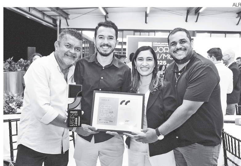
Equipe da TV Assembleia acompanhou a premiação e celebrou mais um título