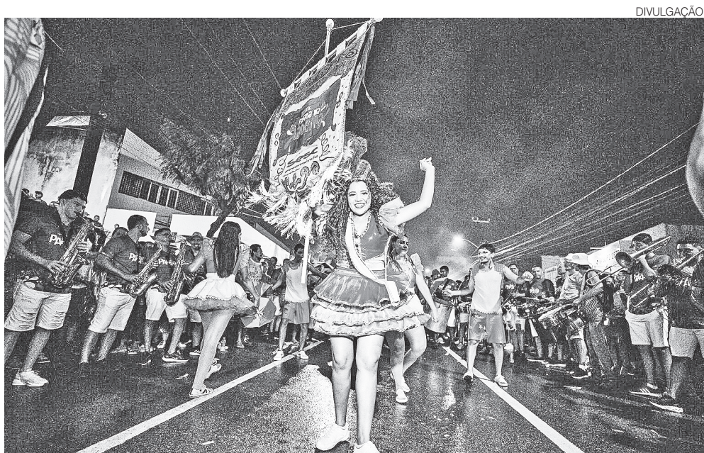
Cortejo percorre cerca de 1 km pelas ruas do centro, com muito frevo, samba e bonecos gigantes