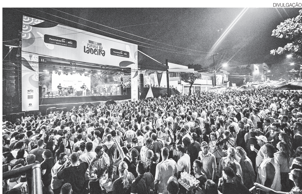
Foliões ocupam o centro da capital potiguar em edição passada da prévia Sesc Parada na Ladeira