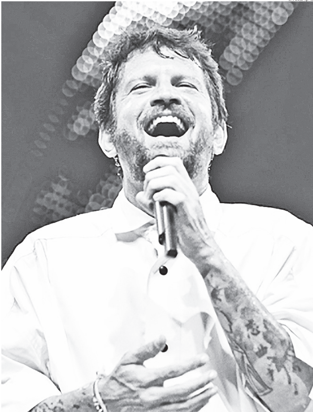
Shows reúnem foliões após a dispersão do bloco, com apresentações da Orquestra do Papão e de Saulo Fernandes

O bloco de rua percorre cerca de 1 km pelas ruas do Centro, animado pelo Frevo do Xico, pela Escola de Samba Balanço do Morro e por um encontro de bonecos gigantes. A dispersão acontece na Rua Ulisses Caldas, mas a programação segue no Sesc Rio Branco, onde ocorrem os shows da Orquestra do Papão e de Saulo