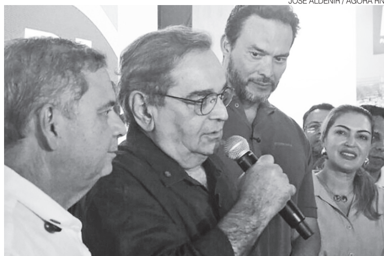
JOSÉ ALDENIR / AGORA RN

blogdodiogenes.com.br | fcodiogenes@hotmail.com