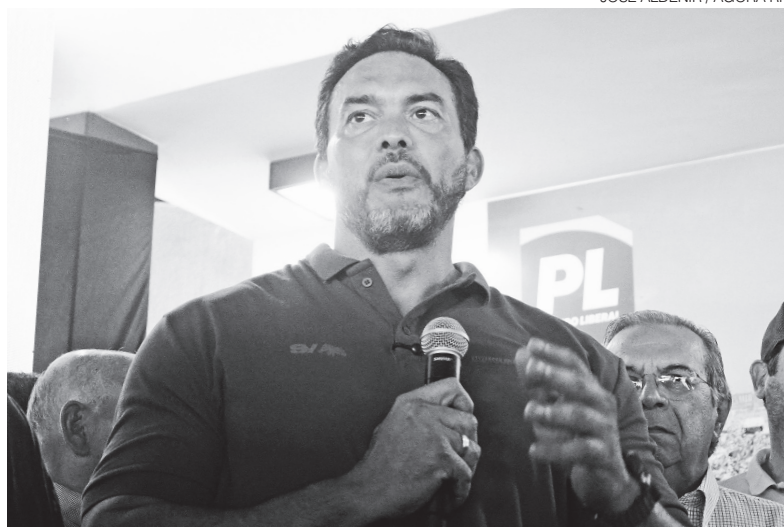
Senador se comprometeu a enviar recursos para eventual governo Álvaro Dias

O senador ressaltou que os municípios vivem situação financeira crítica. “São 167 municípios com 167 prefeitos que hoje não têm condições. Fazem uma mágica para pagar a folha”, disse. Ele citou dificuldades para financiar ações básicas. “Eles não têm condições de pagar cirurgia, fazer exame, fazer uma pavimentação, fazer uma reforma da escola. Coisa simples porque o dinheiro é bem contado”, afirmou.