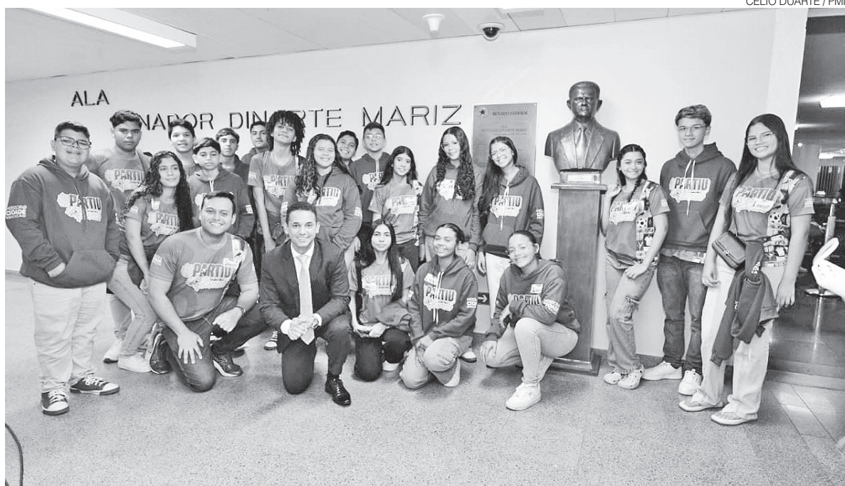
Prefeito de Mossoró, Allyson Bezerra (União), com estudantes na Ala Senador Dinarte Mariz, no Congresso Nacional

Nesta quarta-feira 21, os estudantes primeiro conheceram o Congresso Nacional. Depois, foram levados para conhecer a Câmara Legislativa de Brasília e