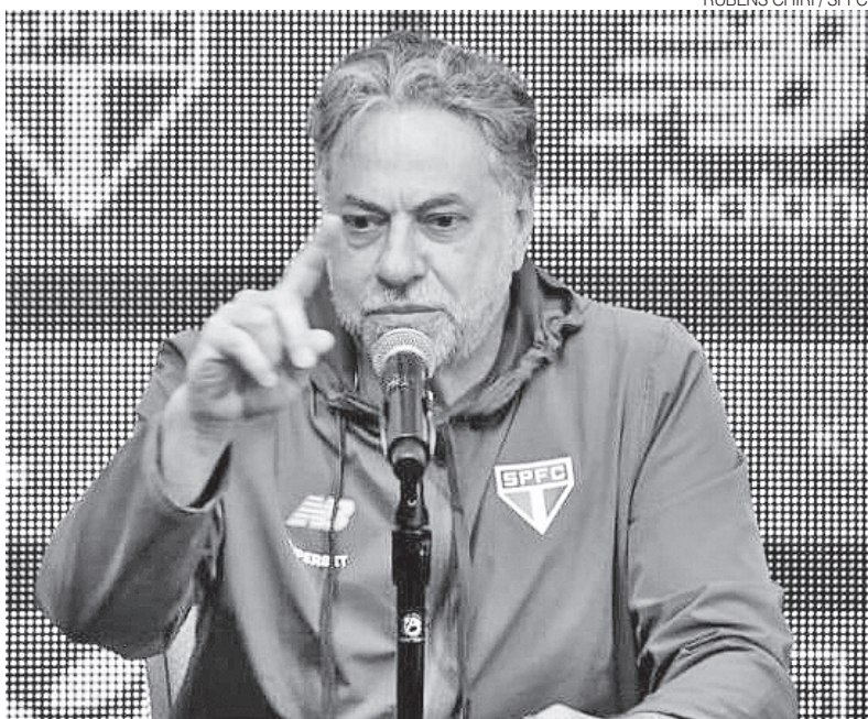
Dirigente afirma que acusações às quais responde iniciaram com “versões frágeis”