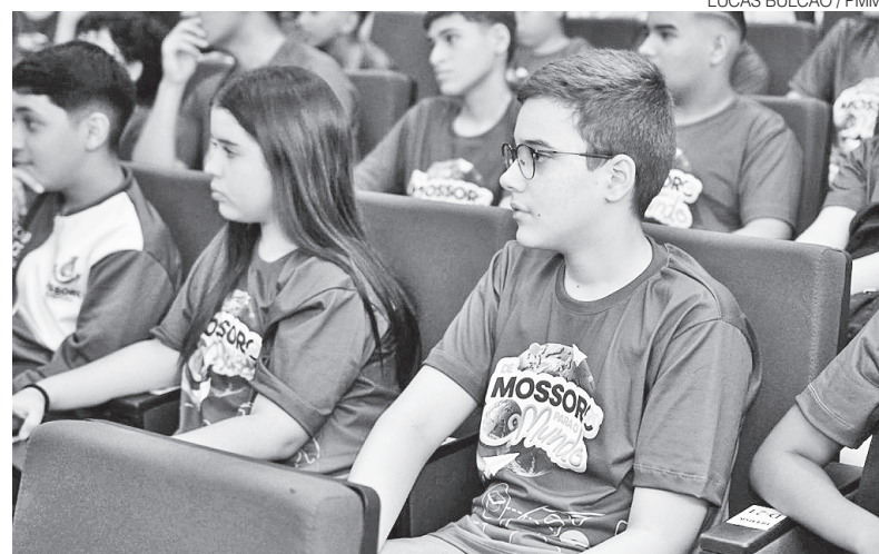
Alunos selecionados já estão cursando inglês com aulas direcionadas

A seleção dos estudantes aconteceu por etapas. Primeiro, era preciso ter o mínimo de 85% de frequência escolar e média superior a 7. Na primeira fase, houve uma prova objetiva com 30 questões de múltipla escolha, com duração de 2 horas, abrangendo as áreas de conhecimento da Base Nacional Comum Curricular (BNCC). A segunda fase foi de análise de desempenho escolar, com caráter eliminatório. ●