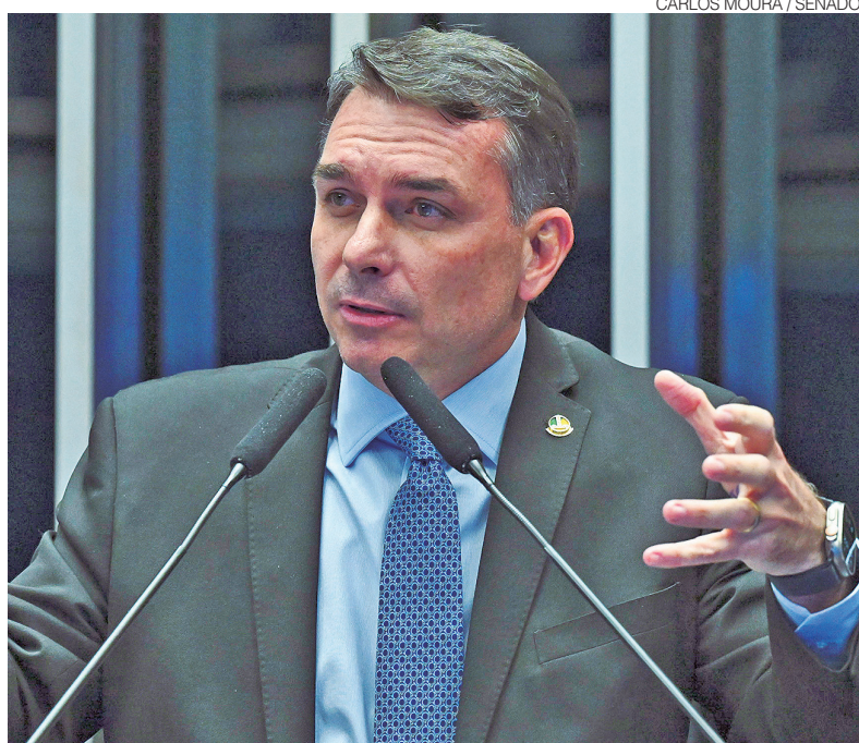
Senador Flávio Bolsonaro (PL-RJ), pré-candidato à Presidência em 2026

No conteúdo, Flávio Bolsonaro falou diretamente aos potiguares e comentou a atuação política de Rogério Marinho. “Eu quero dar os parabéns a vocês, porque o Rio Grande do Norte entregou ao País um dos