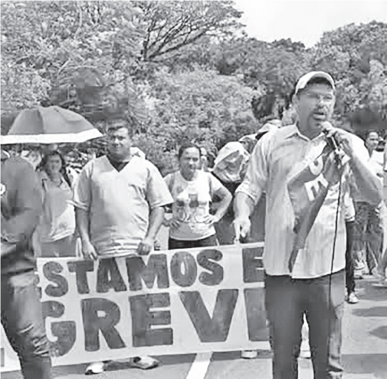
Manifestação deixou trânsito lento nas imediações do Hospital Walfredo Gurgel

que os pagamentos às empresas só poderão ser liberados após a abertura do orçamento, prevista para ocorrer entre o fim desta semana e o início da próxima. O Sipern afirma que continuará adotando medidas para garantir que os direitos dos trabalhadores sejam respeitados, ressaltando que o trabalho desses profissionais é essencial para o funcionamento da rede pública de saúde. ●