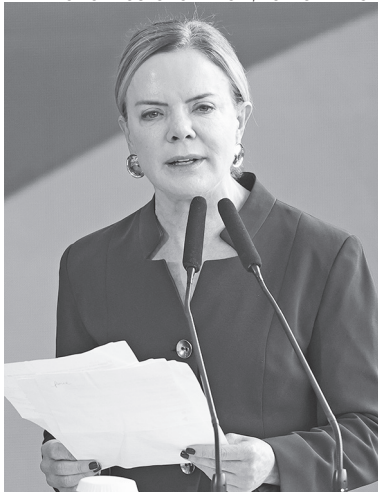
Gleisi vai disputar o Senado no PR