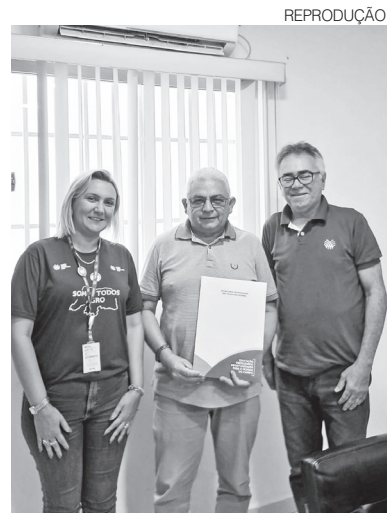
Técnicos do Programa Agrinho, do Senar

Com foco na formação cidadã de crianças e adolescentes, o Agrinho tem como meta alcançar cerca de 10 mil estudantes no Rio Grande do Norte em 2026. O programa é voltado a alunos do Ensino Fundamental, do 2º ao 9º ano, e propõe a abordagem de temas como cidadania, sustentabilidade, educação ambiental e valorização do campo, estimulando mudanças de hábitos e