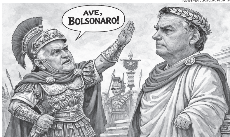
IMAGEM CRIADA POR IA

blogdodiogenes.com.br | fcodiogenes@hotmail.com