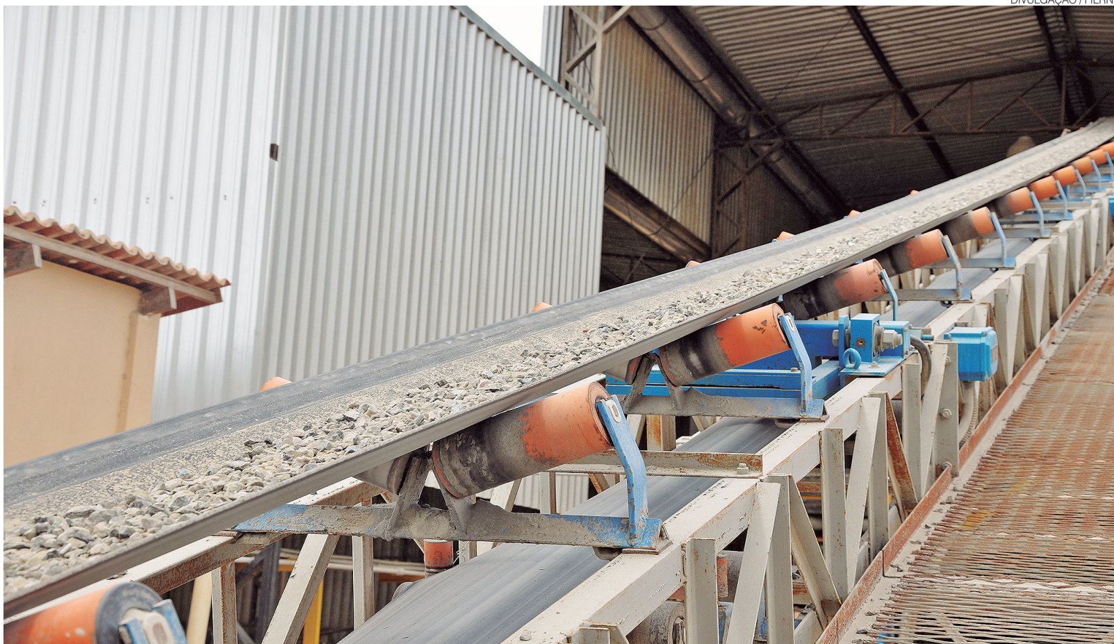
Seridó potiguar concentra hoje grande parte dos pegmatitos mapeados pelo estudo do Serviço Geológico do Brasil, com potencial para lítio e terras raras

De acordo com o presidente do Sindicato da Indústria da Extração de Metais Básicos e de Minerais Não Metálicos do RN