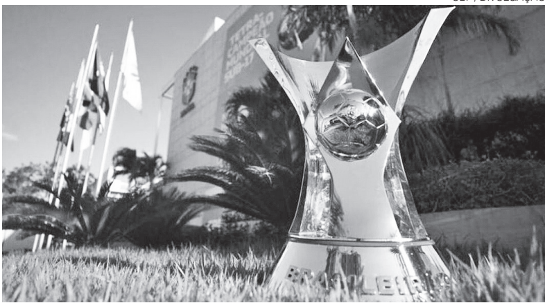
Plano é debater torneio com três em vez de quatro clubes rebaixados

Se os clubes aprovarem a redução no número de rebaixamentos de quatro para três, os dois últimos cairiam direto. E o que sobrou jogaria com o terceiro colocado da Série B. É assim