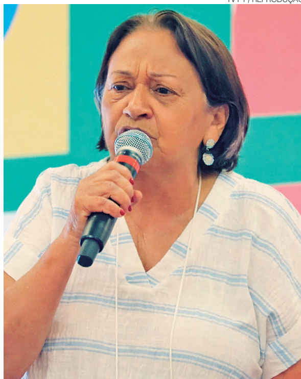
Governadora Fátima Bezerra: “Meu nome está à disposição”

Norte se torna ainda mais importante em razão de ser o estado de origem do senador Rogério Marinho (PL), líder da oposição no Senado e coordenador da candidatura do senador Flávio Bolsonaro (PL) à Presidência da República. “Não é uma questão menor, não, porque lá está o centro do bolsonarismo”, afirmou o deputado cearense, ao se referir ao RN.