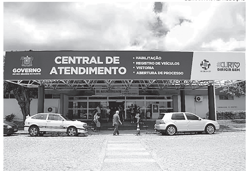
Detran contará com 80 vagas para preenchimento imediato, além de cadastro reserva

O concurso deverá seguir um modelo inspirado no Concurso Nacional Unificado , permitindo que os candidatos concorram a cargos nos três órgãos da administração estadual. O contrato firmado com o Instituto Avalia tem