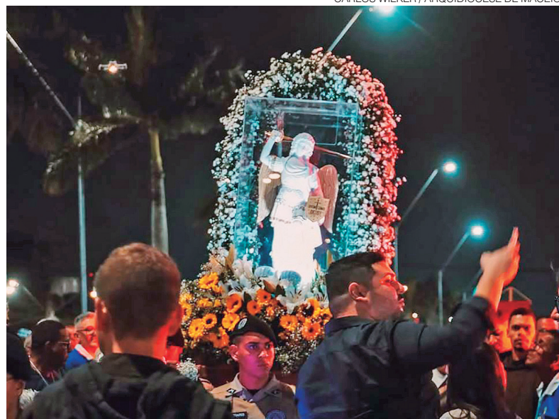
Instituto Hesed deu início à peregrinação com a imagem em julho de 2025

O evento será gratuito e é aberto a quem deseja participar. Paróquias de várias regiões do Estado já estão organizando caravanas para participar da vigília. Para ajudar a custear as despesas com a organização da visita da imagem de São Miguel, a Arquidiocese de Natal disponibilizou a venda de uma camiseta, que pode ser adquirida na Catedral Me-