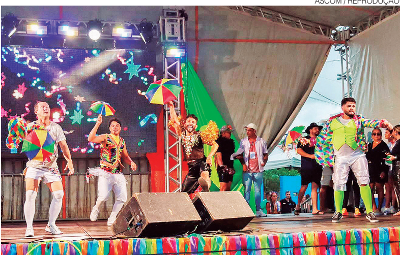
Palco na Praça São Sebastião é uma das atrações do Carnaval do Povo em Pirangi