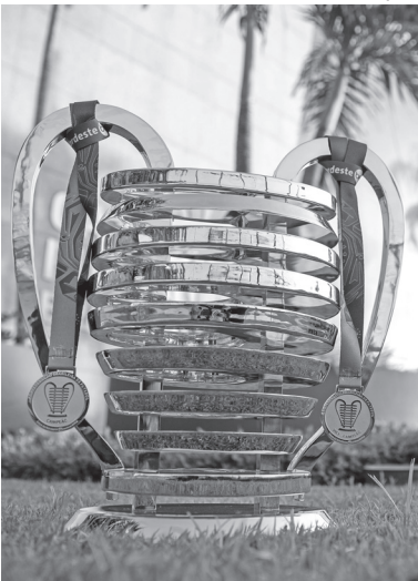
Torneio da CBF terá final em 7 de junho

A Confederação Brasileira de Futebol (CBF) divulgou detalhes da disputa da Copa do Nordeste 2026. O torneio vai iniciar no dia 25 de março, com a final marcada para o dia 7 de junho. Na edição desta temporada, a competição contará com 20 clubes. Na primeira fase, eles serão divididos em quatro grupos. As chaves serão definidas através de sorteio, em data a definir pela CBF. O Rio Grande do Norte terá dois representantes na competição: ABC e América. Esta edição da Copa do Nordeste será a primeira após as mudanças realizadas pela CBF para o calendário do futebol nacional.