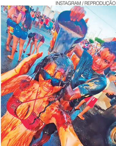
Melaço será distribuído em menor quantidade

um no início e outro no fim do trajeto — com duração total de aproximadamente 40 minutos. Além disso, o produto será diluído na proporção de três litros de água para cada litro de melaço, com o objetivo de reduzir a concentração de matéria orgânica. Outra medida prevê o tamponamento do sistema de drenagem pluvial durante o evento, para impedir que resíduos escorram para o sistema hídrico. Após a festa, a limpeza do pavimen-