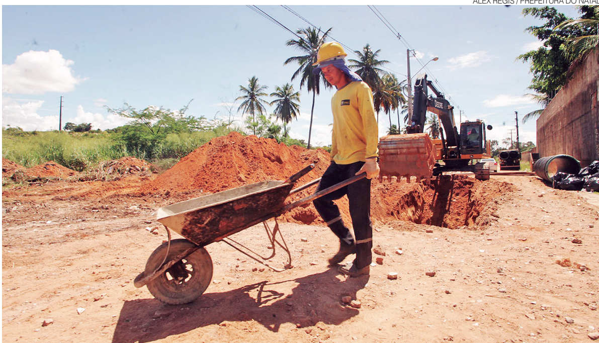
Obras avançam no bairro Parque das Colinas, incluído no plano de investimentos da gestão que prioriza a drenagem

Outras iniciativas contempladas envolvem a urbanização da Pedra do Rosário, a segunda etapa do Santuário Nossa Senhora de Fátima, a implantação de um pórtico monumental na Avenida da Alegria, na Redinha, e a ampliação de espaços públicos voltados ao esporte e ao lazer, como quadras cobertas, arelinhas e áreas de convivência. ●