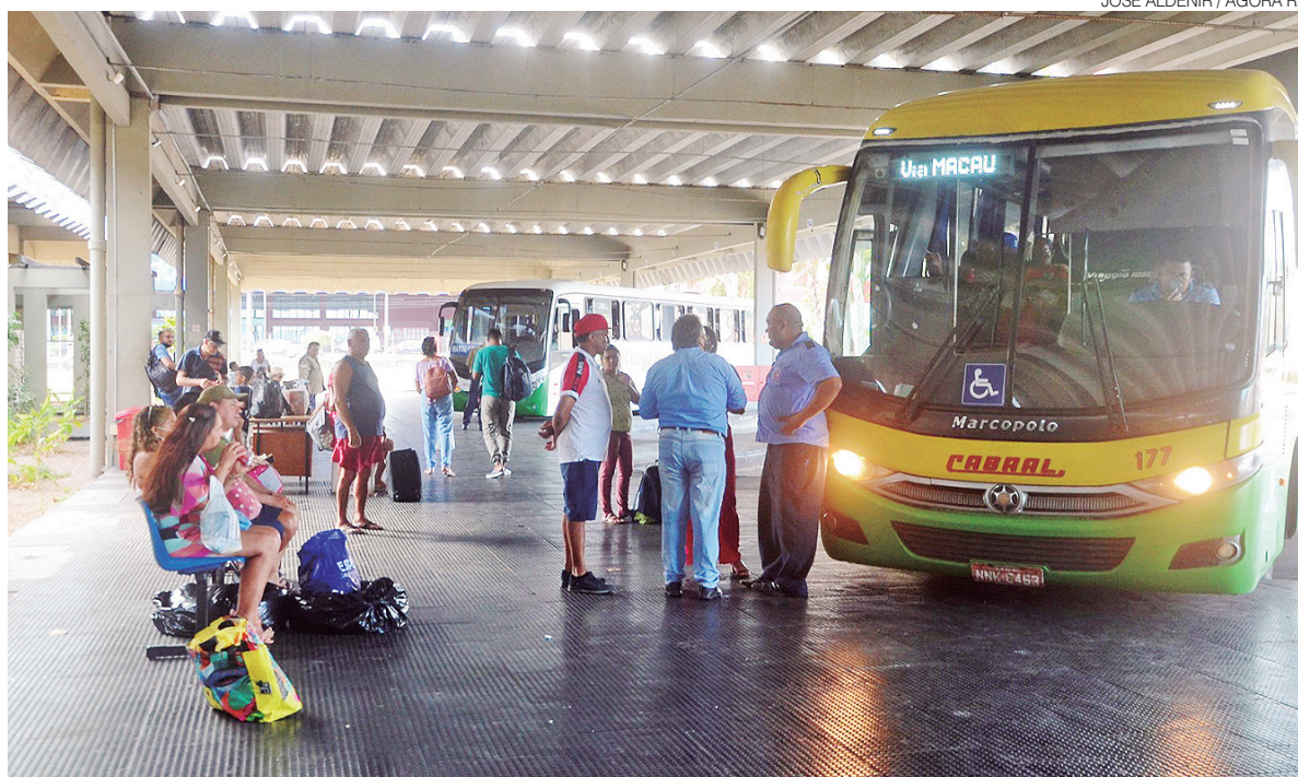
Com 40%, Estado é o 3º do País com maior proporção de universitários que estudam fora do município de origem

Mesmo não estando em um município distante da capital,