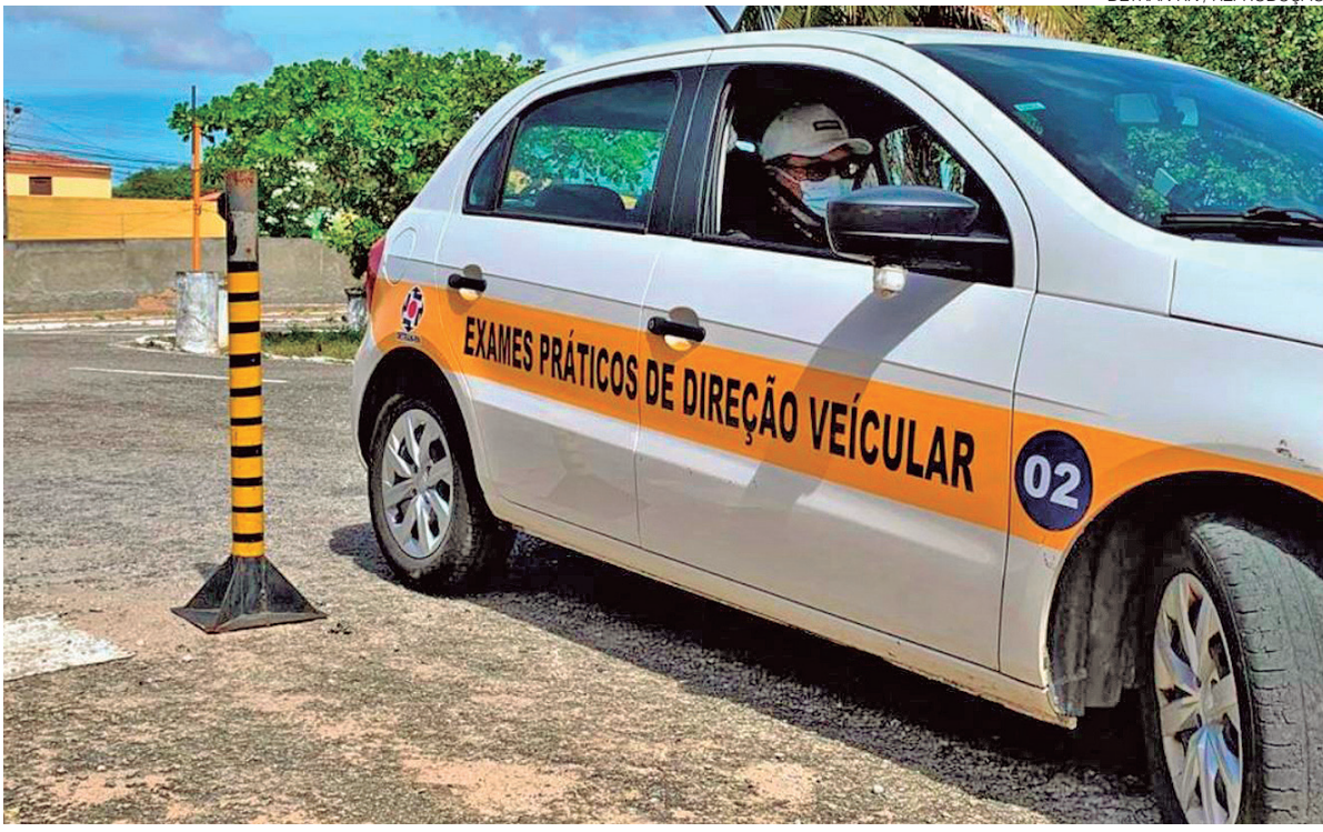
Nas aulas práticas, candidatos agora só precisam cumprir 2 horas de atividades, que podem ser com instrutores autônomos

Após concluir o curso teórico on-line, o candidato formaliza o processo no Detran (Renach), re-