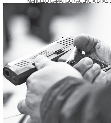
Decisão da comissão foi unânime

A proposta não detalha quais os termos dos incentivos. Um decreto