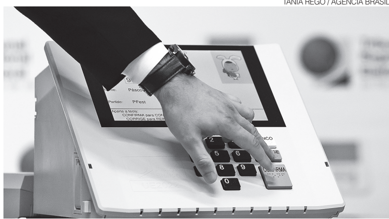
Eleições vão acontecer em 17 de maio, para eleger prefeitos e vice-prefeitos

As irregularidades apontadas estão relacionadas aos eventos Dia das Mães Itauenses e XVI Arraiá do Zé Padeiro , promovidos