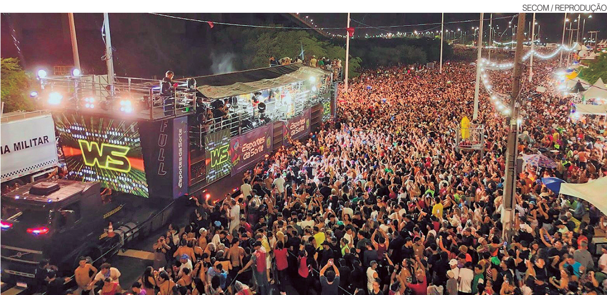
Prévia realizada na semana passada na Avenida da Alegria atraiu público de cerca de 180 mil pessoas, diz Prefeitura