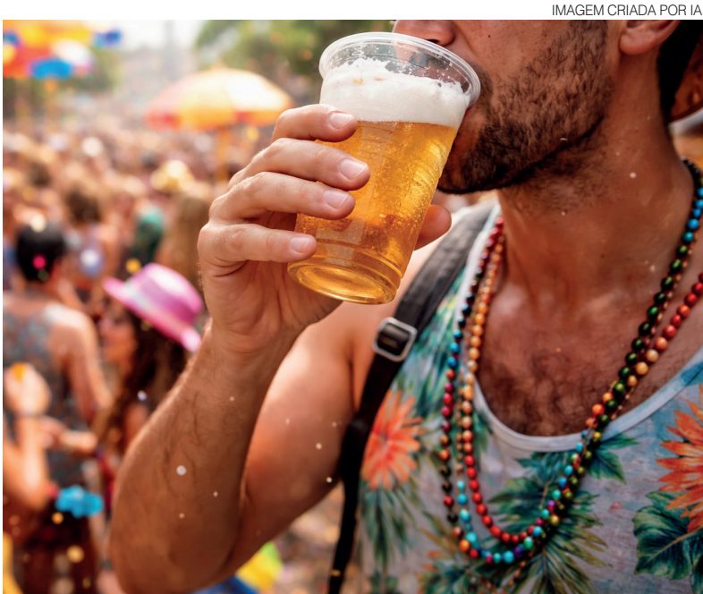
Para quem não abre mão da bebida alcoólica, a regra de ouro é intercalar com água