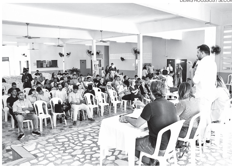
Reuniões são na Ass. Moradores dos Parques Res. de P. Negra e Alagamar (Ampa)

A audiência será aberta ao público. Haverá espaço para manifestações orais, mediante inscri-