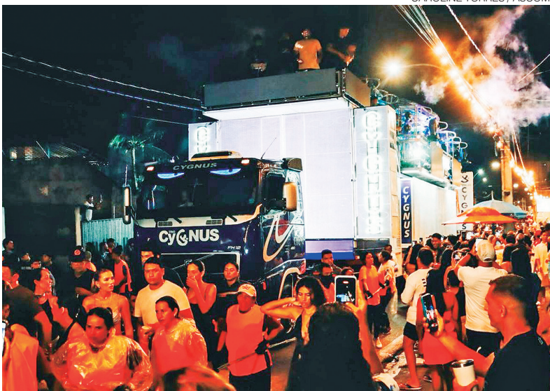
Em Parnamirim, expectativa é de grande público seguindo trios em Pirangi

O Carnaval toma conta da Grande Natal com uma maratona de shows gratuitos, reunindo artistas locais e nacionais em diferentes polos de Natal e em Pirangi do Norte. A programação se espalha por quatro dias de festa, com destaque para nomes consagrados e uma agenda pensada para públicos diversos.●