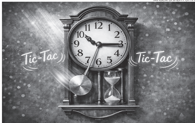
IMAGEM CRIADA POR IA

blogdodiogenes.com.br | fcodiogenes@hotmail.com