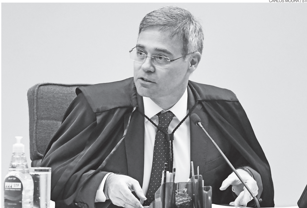
André Mendonça foi sorteado para o caso após Dias Toffoli decidir deixar o posto em meio à crise aberta por relatório da PF

Mendonça foi sorteado na quinta-feira 12 como novo relator do caso envolvendo o Master,