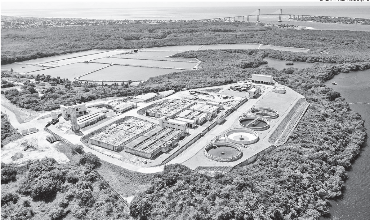
Estação Jaguaribe, que está em fase de testes, custou R$ 280 milhões e vai tratar o esgoto de toda a Zona Norte