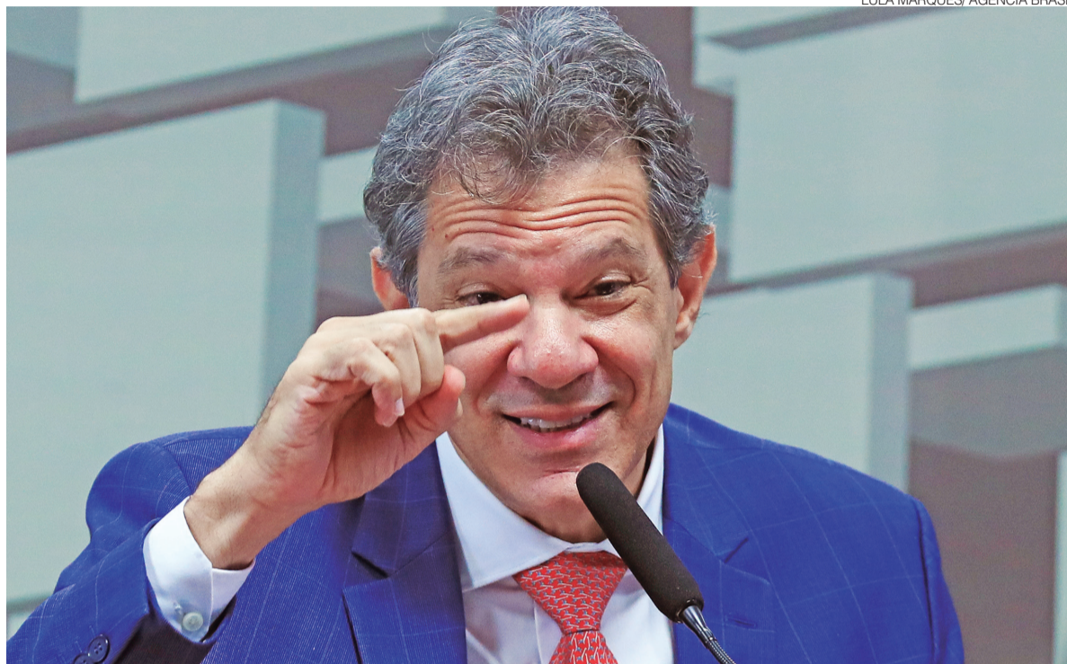
Ministro comemora, mas não está claro se tarifas de 40% no Brasil serão abarcadas pela decisão da Suprema Corte americana

“Acreditou no diálogo, acreditou na disputa pelos canais competentes. Na contestação pelos canais competentes. Tanto na OMC quanto no judiciário americano. Estabeleceu uma relação diplomática, uma conversa direta para falar de temas relevantes”, explicou. “Então, o Brasil, do ponto de vista da sua relação bilate-