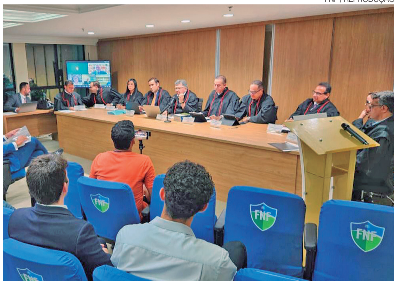
Pleno do TJD durante julgamento na última quinta-feira que salvou América

Ainda segundo o documento, “quando uma norma construída coletivamente deixa de produzir os efeitos nela previstos, cria-se um cenário de insegurança jurídica e abre-se margem para interpretações que podem comprometer a estabilidade do atual regulamento e dos regulamentos futuros”. O recurso deve ser encaminhado ao Superior Tribunal de Justiça Desportiva (STJD), o que pode implicar na suspensão da retomada do campeonato.