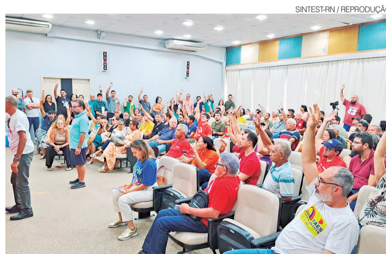
Categoria de servidores reclama do descumprimento do acordo de greve de 2024

Durante a assembleia, servidores relataram que, embora o RSC seja apontado como uma das maiores conquistas recen-