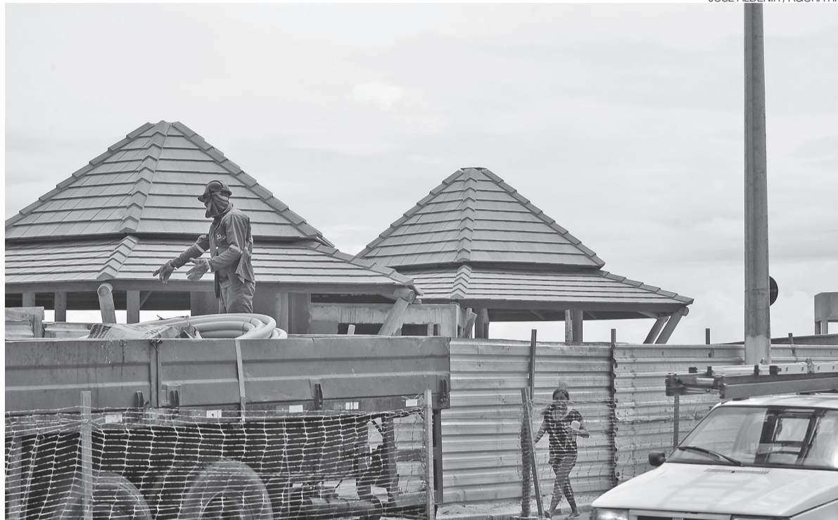
Para que a obra seja concluída, ainda faltam R$ 8 milhões de verba federal. Serviços avançam lentamente no local

A requalificação da orla da Zona Leste de Natal tem recursos assegurados a partir