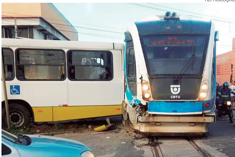
Motorista do ônibus afirmou que não ouviu o alerta sonoro antes da colisão

De acordo com a Secretaria Municipal de Mobilidade Urbana (STTU), pelo menos seis pessoas tiveram ferimentos leves. A ambulância atingida não tinha paciente no momento do acidente.