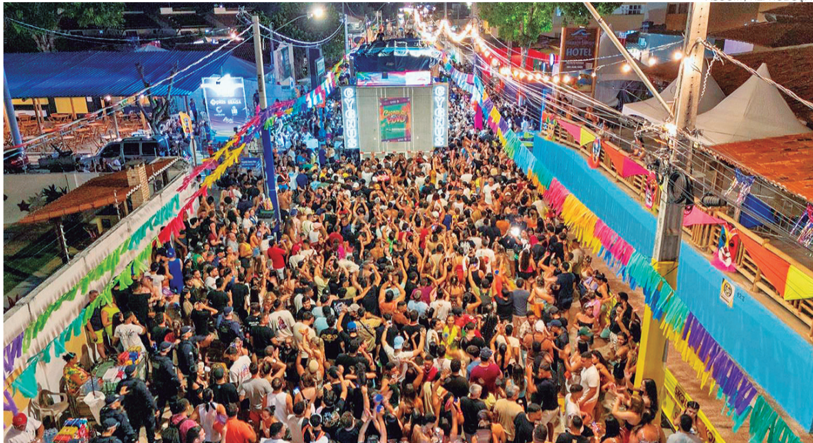
Grande público prestigiou Carnaval em Pirangi e multidão acompanhou trio elétrico pela Avenida Márcio Marinho

A Prefeitura informou que realizou ações de segurança, atendimento de saúde, atuação da assistência social e a campanha de conscientização Não é Não , voltada à proteção de mulheres. As equipes