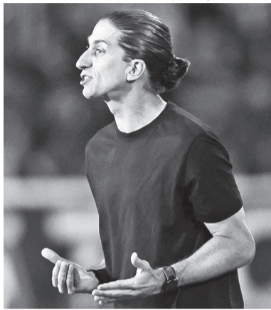
Técnico do Flamengo, Filipe Luís

Ao citar experiências pessoais positivas no país e tratar o episódio