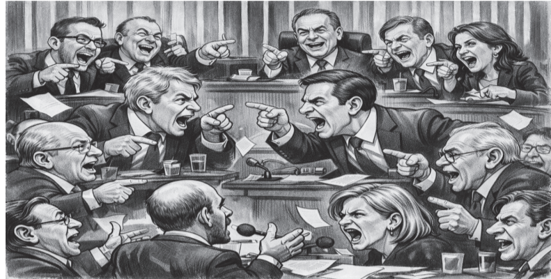
IMAGEM CRIADA POR IA

blogdodiogenes.com.br | fcodiogenes@hotmail.com