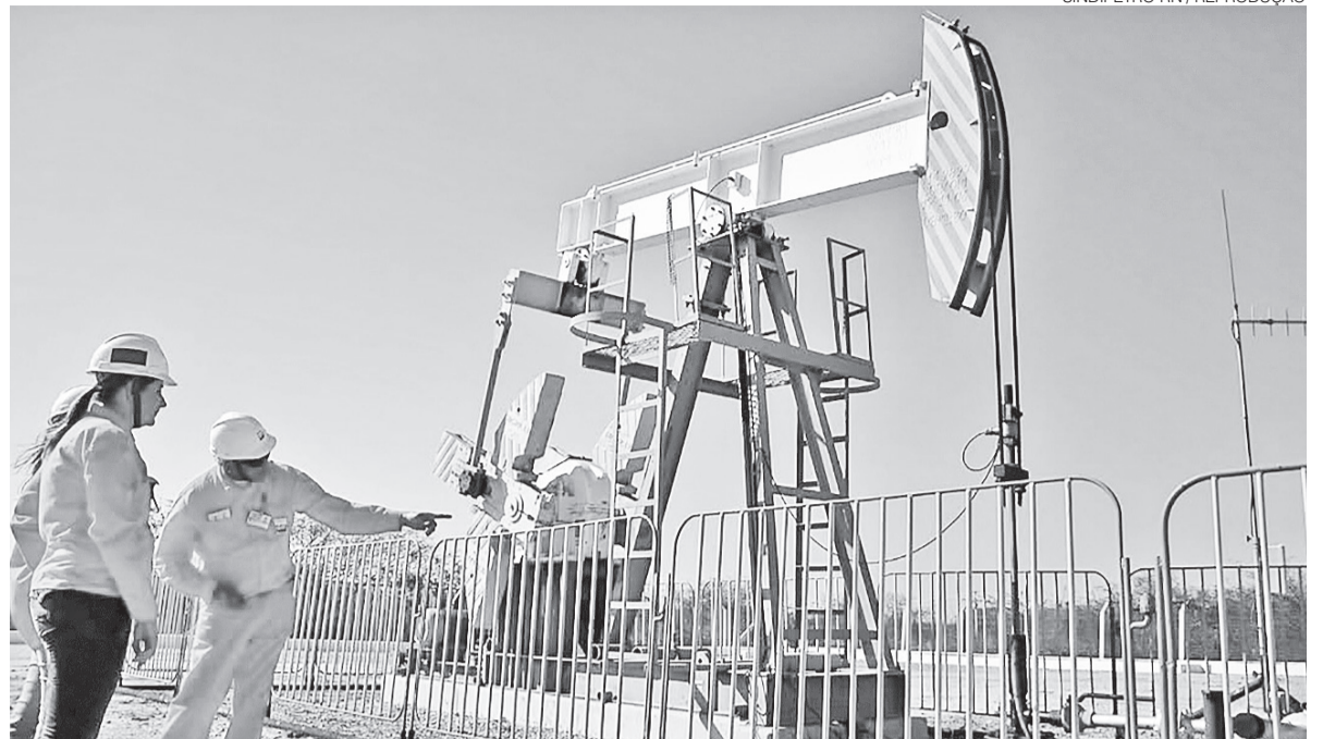
Há dez anos, produção era praticamente o dobro da atual; Novas operadoras têm reduzido ritmo de investimentos, aponta Sindipetro

O América escapou do rebaixamento do Campeonato Potiguar após reviravolta na votação do TJD-RN.