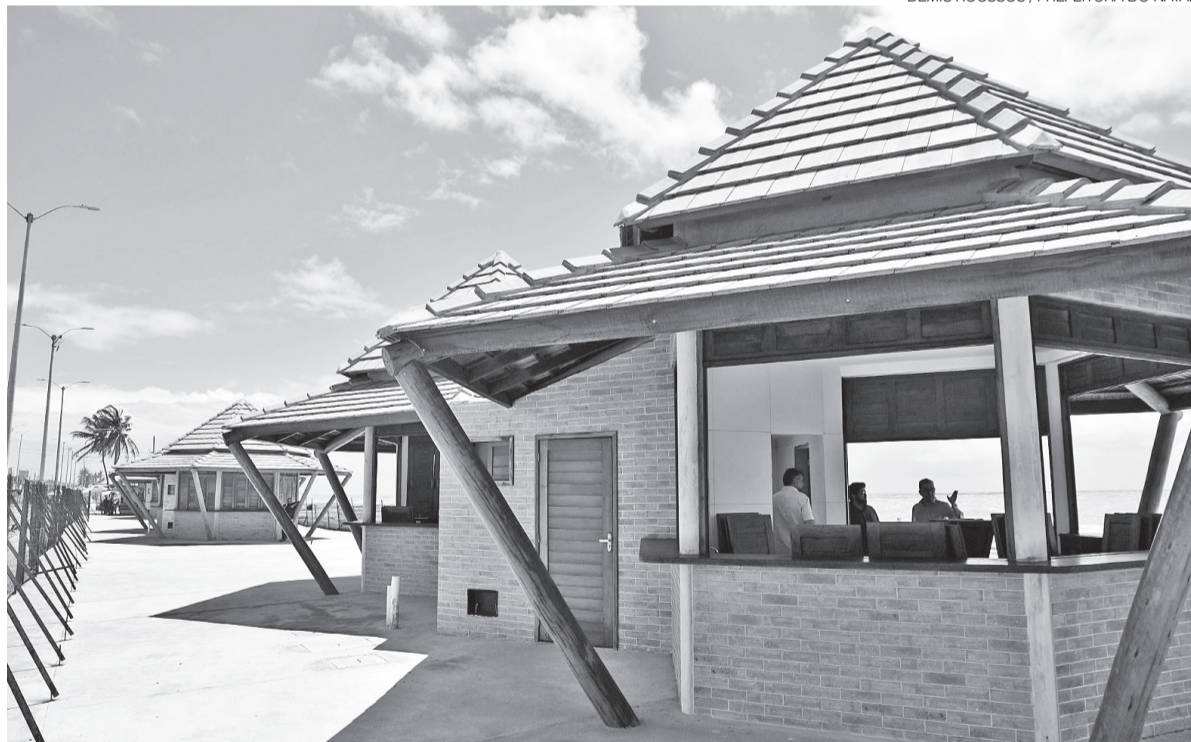
Requalificação na Zona Leste faz parte de um pacote de intervenções da Prefeitura do Natal na orla da cidade

de um convênio com o Ministério das Cidades, do Governo Federal. A origem da verba é uma emenda parlamentar da modalidade RP-9 – rubrica das chamadas emendas de relator, que deram origem ao que ficou conhecido como orçamento secreto e cujo pagamento sofreu restrições do Supremo Tribunal Federal (STF).