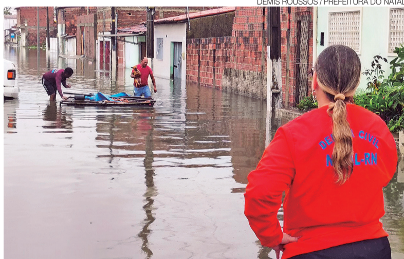
Defesa Civil de Natal auxiliou em resgates e na avaliação de segurança estrutural dos imóveis

Em ação conjunta com a Seinfra, a Companhia de Serviços Urbanos de Natal (Urbana) mobilizou 50 profissionais por