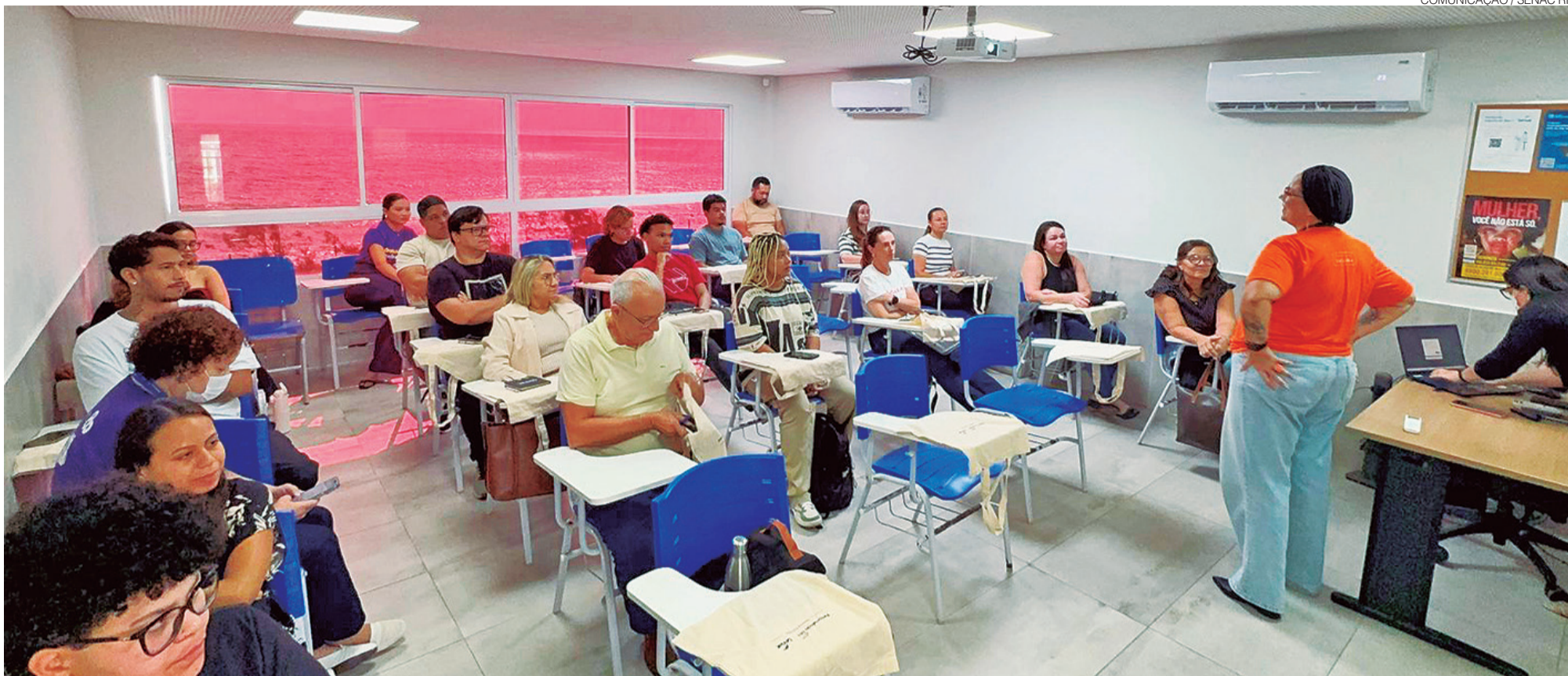
Com nota máxima no Ministério da Educação (MEC), a instituição amplia oferta de graduação e MBA em 2026; Faculdade Senac RN iniciou o período letivo de 2026 com novas turmas de graduação