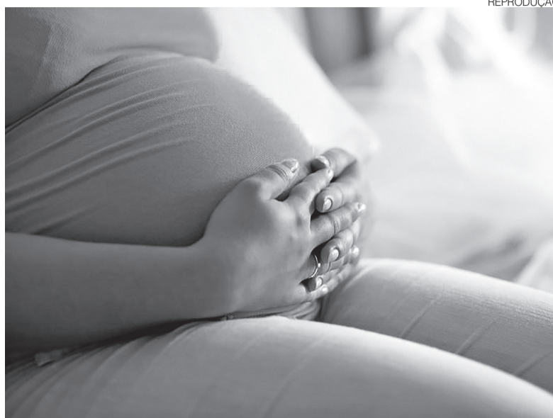
Gestação precoce aumenta ocorrência de complicações para a mãe e o bebê

Estudos do Ministério da Saúde também indicam maior taxa de mortalidade infantil entre filhos de mães com até