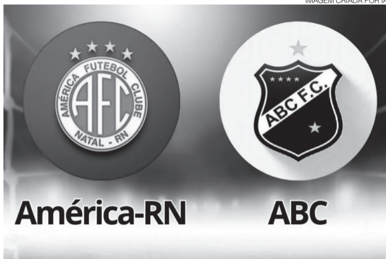
América-RN estreia em casa e ABC viaja ao RJ para enfrentar o Madureira

O América sabe que a Copa do Brasil costuma equilibrar forças e que o adversário, mesmo sem ser empurrado pela torcida, deve apostar na in-