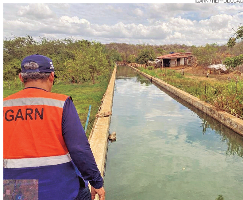
Canal recebe águas da Barragem Armando Ribeiro Gonçalves, em Assú