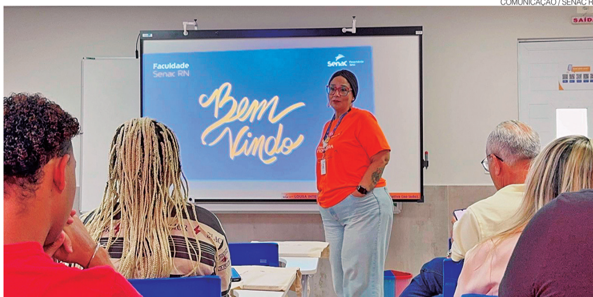
Formação é voltada às demandas do mercado e alia teoria e prática; pós em gastronomia começa no próximo mês

cursos de Gastronomia e Gestão Comercial, com duração de dois anos, além de Análise e Desenvolvimento de Sistemas, com dois anos e meio de formação. As graduações priorizam atividades prá-