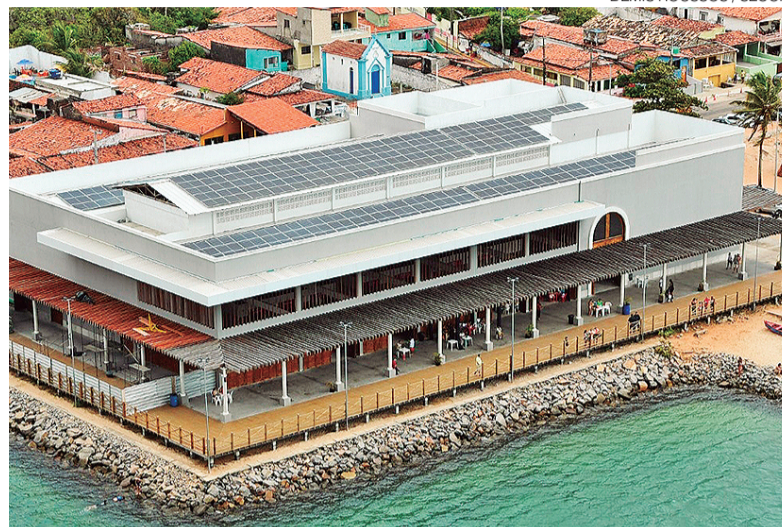
Mercado da Redinha recebeu obras de quase R$ 30 milhões e reabriu em 2025

des suspensas, em 22 de dezembro de 2025 o espaço foi reaberto para uma operação temporária de dois meses. A gestão está a cargo da Prefeitura do Natal, em parceria com o Sistema Fecomércio – que ofereceu capacitação aos permissionários e está levando atividades de cultura e