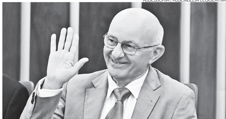
ASSESSORIA / ASSEMBLEIA LEGISLATIVA

blogdodiogenes.com.br | fcodiogenes@hotmail.com