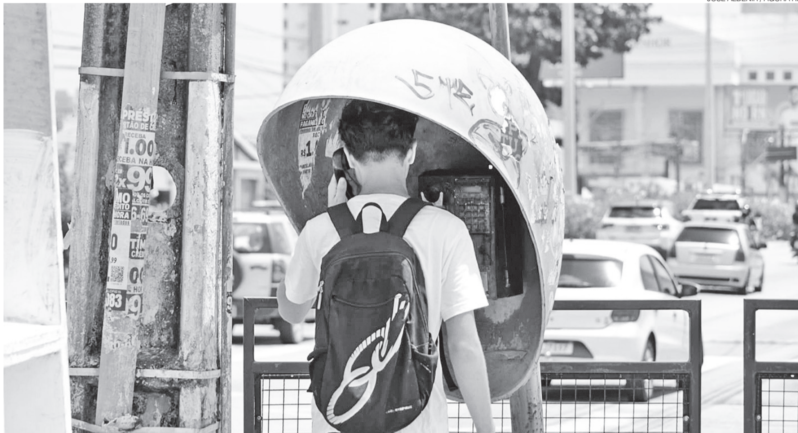
Maior parte dos orelhões que ainda restam no RN pertence à Oi, herança de um modelo de telefonia fixa que foi perdendo espaço com a popularização dos celulares

Mesmo com o avanço da tecnologia, alguns orelhões ainda