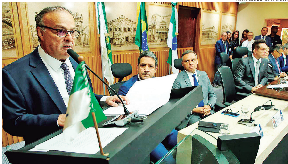
Prefeito de Natal, Paulinho Freire, em mensagem anual à Câmara: ajuste fiscal e anúncio de investimentos para a cidade

O prefeito afirmou que houve economia com controle permanente da folha de pagamento e ressaltou que o crescimento das despesas foi mantido abaixo da inflação, mesmo com concessão de direitos represados. Também mencionou projeto de lei de reorganização de cargos e a implantação de um sistema in-