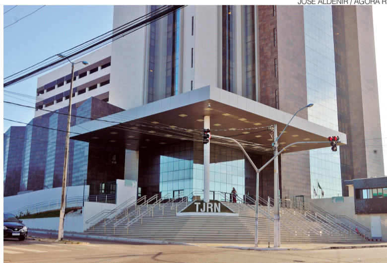
Tribunal de Justiça do RN destina 57% do seu orçamento para pagar folha

Outro ponto abordado pelo estudo é a evolução dos gastos. Em 11 estados, o crescimento do orçamento do sistema de Justiça entre 2023 e 2024 foi maior do que o crescimento do orçamento geral do Estado. O relatório aponta que essa tendência pressiona as contas públicas, já que o aumento da