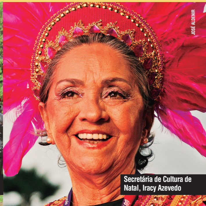
Secretária de Cultura de Natal, Iracy Azevedo