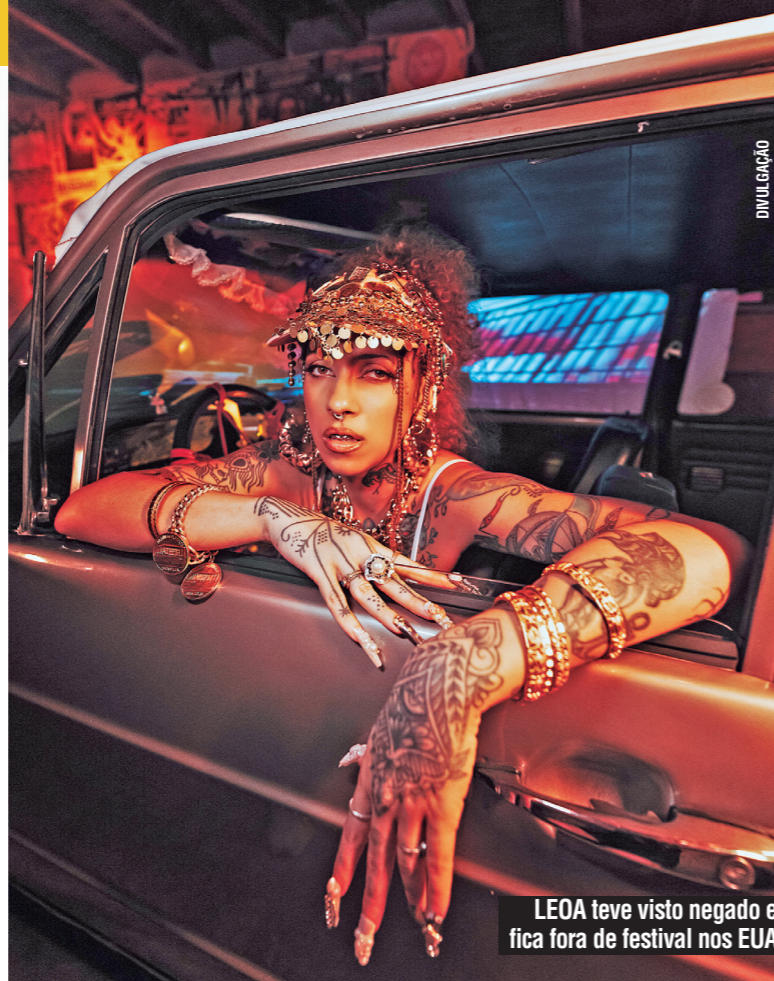
LEOA teve visto negado e fica fora de festival nos EUA

“Essa é uma situação complexa, porque a gente estava