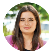
Nathallya Macedo Editora

Ainda assim, o que se viu neste ano foi um sinal importante de virada. Talvez seja cedo para afirmar que Natal entrou definitivamente no mapa dos grandes carnavais do país. Mas algo mudou, isso que importa.