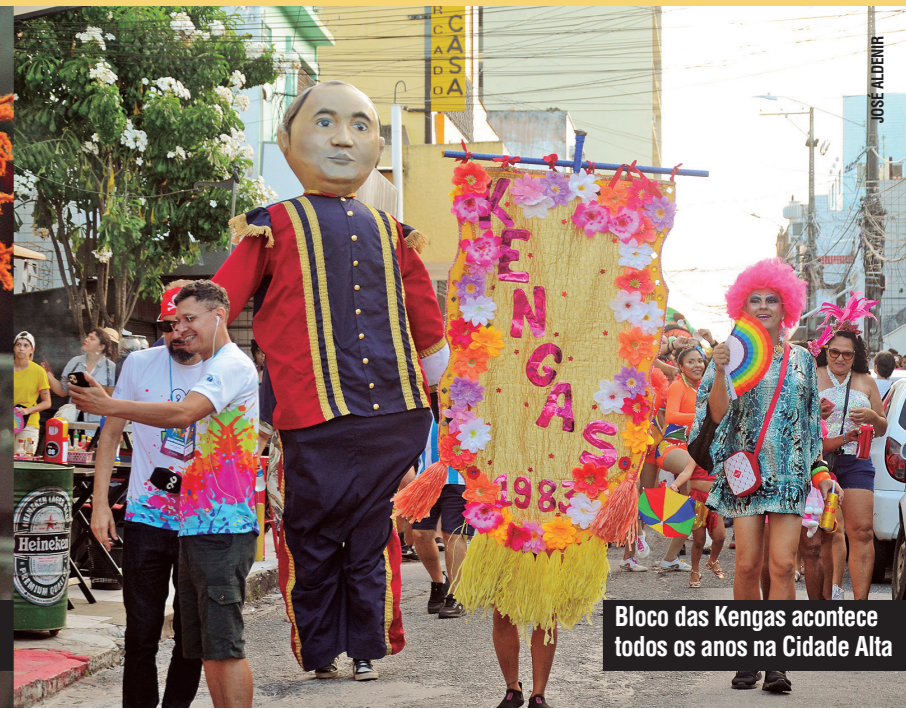
Bloco das Kengas acontece todos os anos na Cidade Alta