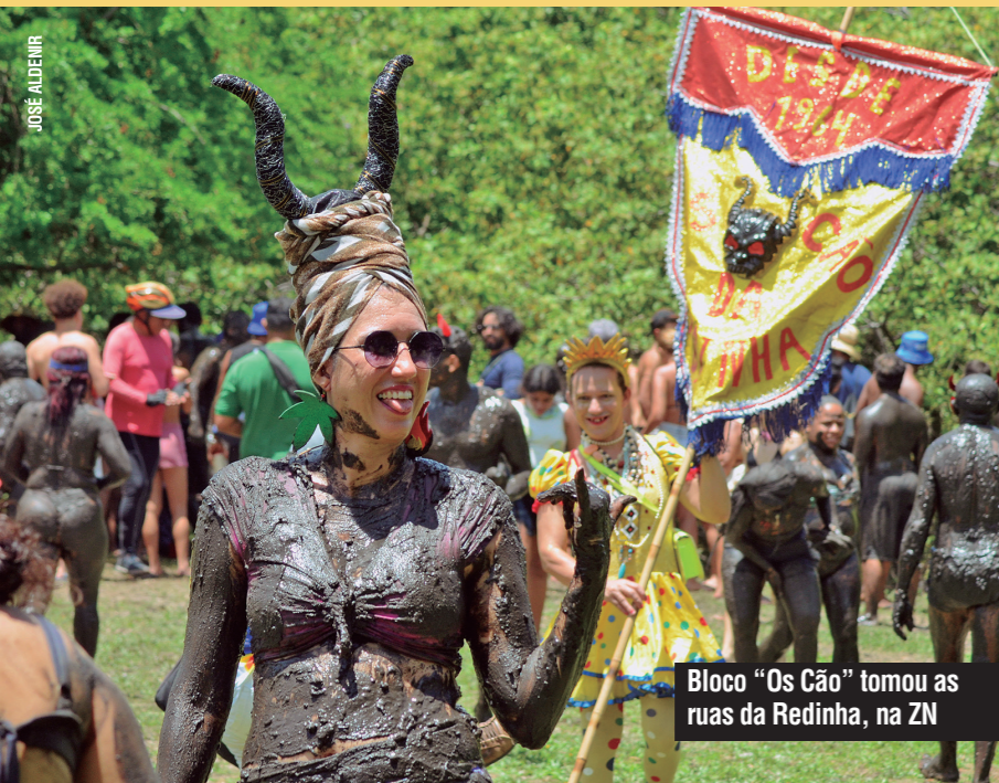
Bloco “Os Cão” tomou as ruas da Redinha, na ZN

O Carnaval de Natal 2026 teve patrocínio de Esportes da Sorte.