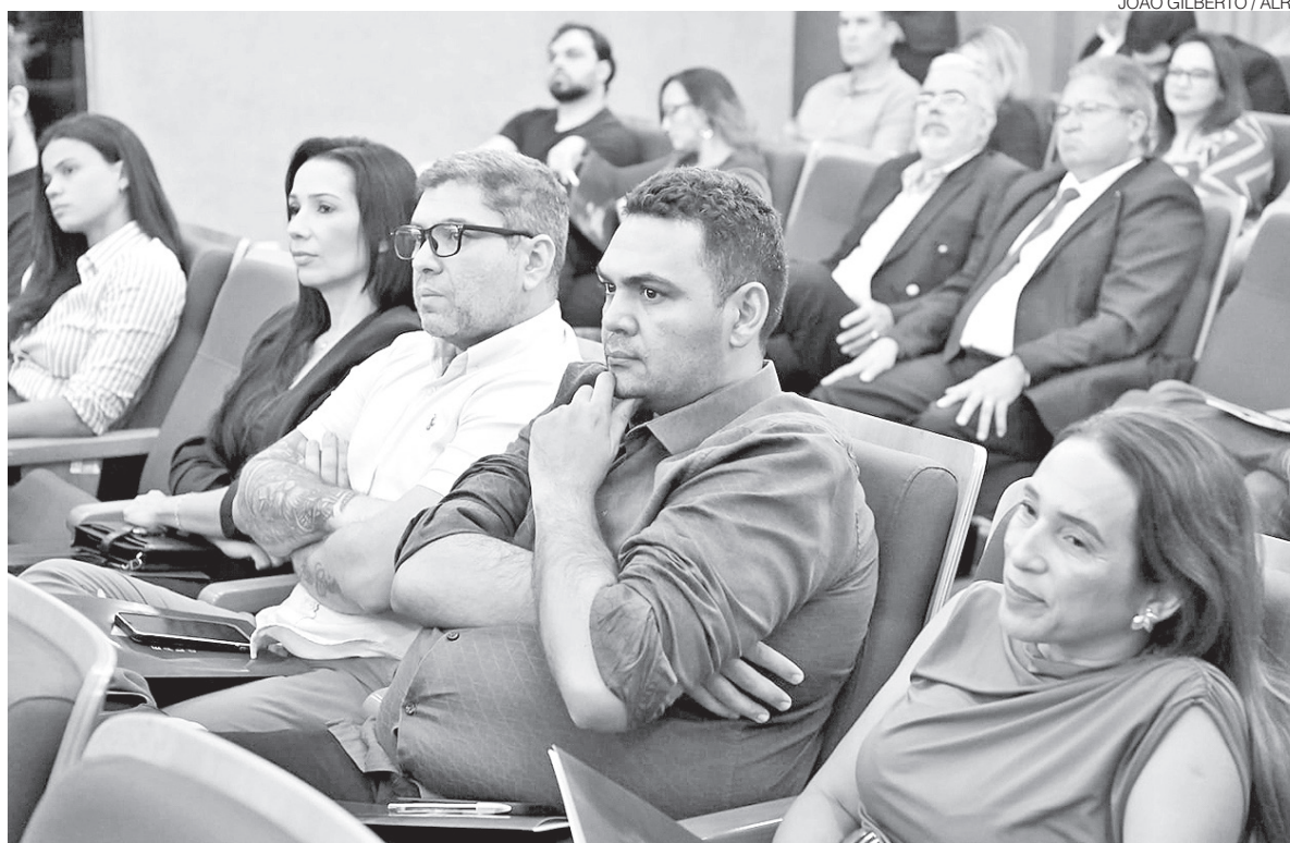
Especialização reúne 44 alunos e já capacitou 156 profissionais das forças de segurança no Rio Grande do Norte

Com mais de duas décadas de atuação, a Escola da Assembleia se consolidou como referência nacional na formação e qualificação de agentes públicos. Pioneira entre as escolas legislativas do país, a instituição já formou 156 profissionais em cursos de Gestão da Segurança Pública e busca reforçar a rede de profissionais preparados para contribuir com políticas públicas mais eficientes e uma sociedade mais segura.