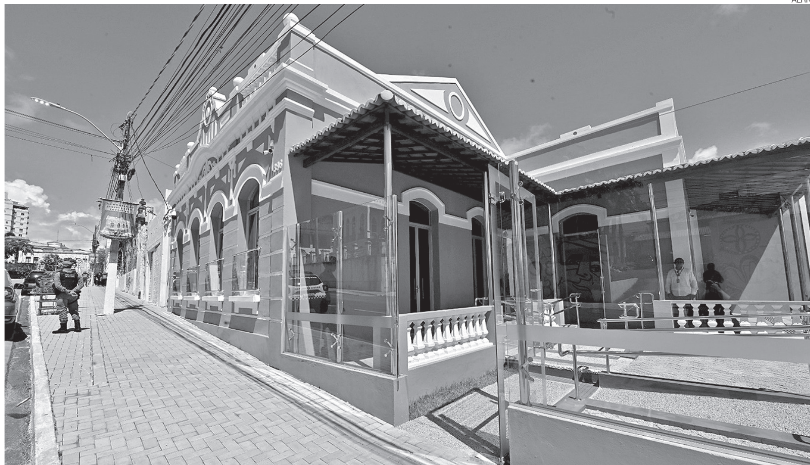
Iniciativa da Assembleia Legislativa do Rio Grande do Norte amplia ações de preservação da memória e de valorização cultural no Centro da capital potiguar

Construída originalmente como Armazém Real da Capitania do Rio Grande, a casa foi posteriormente adaptada para residência e atravessou diferentes períodos da história da cidade. A edificação é uma das poucas remanescentes do século XVII erguidas em alvenaria de pedra e cal na capital po-