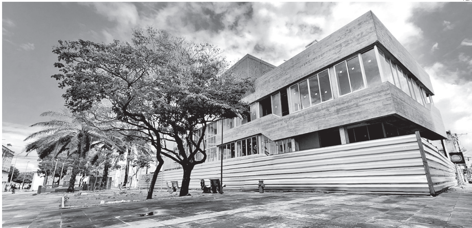
Conjunto de prédios históricos do Centro de Natal que passam a receber investimentos de preservação e uso cultural pela Assembleia Legislativa do RN

emblemáticos desse trabalho é o Memorial do Legislativo Potiguar, instalado no casarão que pertenceu ao ex-governador Augusto Tavares de Lyra. O imóvel foi restaurado e transformado em espaço de memória, reunindo documentos, exposições e registros da história política do Rio Grande do Norte.