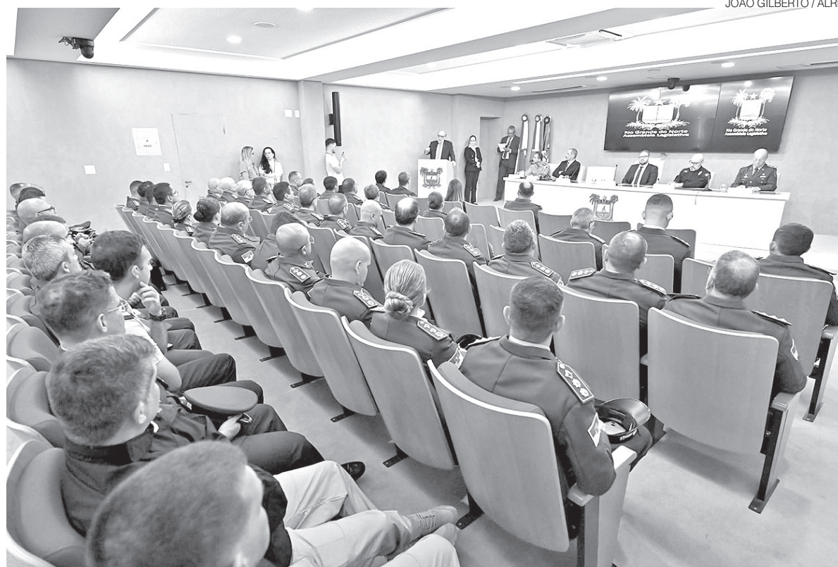
Nova turma da especialização em Gestão em Segurança Pública é promovida pela Escola da Assembleia do RN