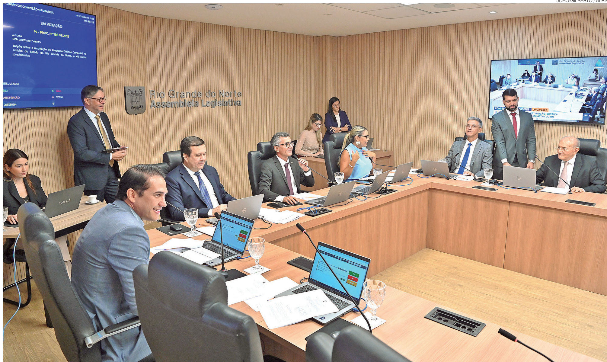
Parlamentares instalam comissões temáticas da Assembleia Legislativa do Rio Grande do Norte, responsáveis pela análise técnica dos projetos antes da votação geral em plenário