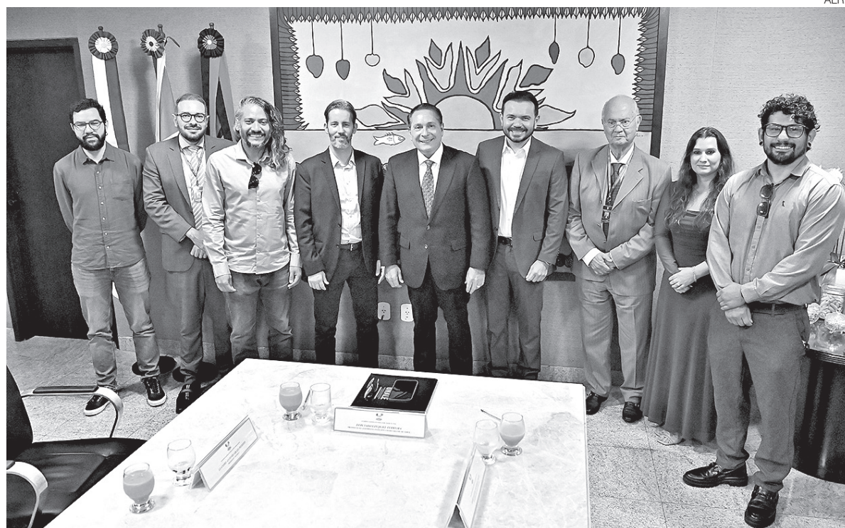
Representantes do Iphan destacam a importância da parceria e das ações de preservação e ocupação cultural