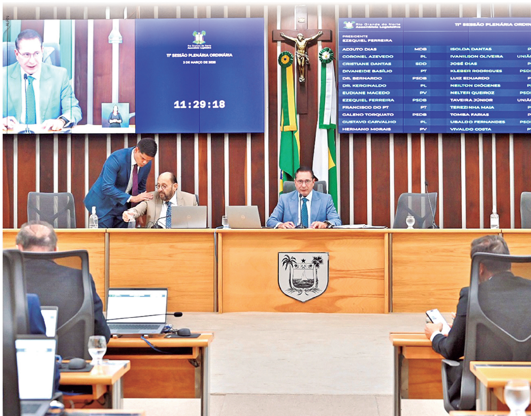
Sessão plenária da Assembleia Legislativa do Rio Grande do Norte em que os deputados analisaram os projetos que estabelecem os procedimentos para eleição indireta no Executivo estadual

Projetos definem prazo de até 30 dias para votação e posse e estabelecem votação aberta no plenário