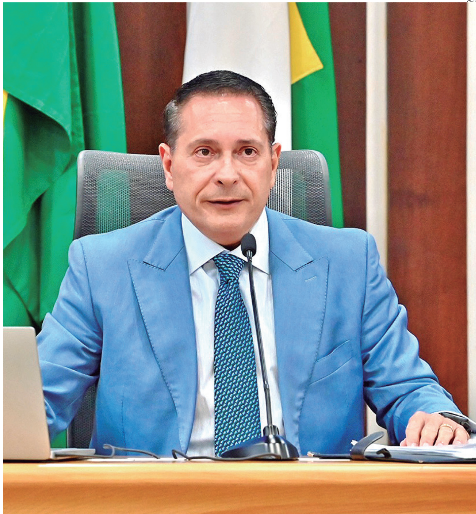
Presidente da Assembleia Legislativa do Rio Grande do Norte, deputado Ezequiel Ferreira, conduziu a tramitação das matérias apresentadas pela Mesa Diretora

A resolução detalha etapas administrativas como publicação do edital de convocação, inscrição das chapas e análise das candidaturas, além dos procedimentos