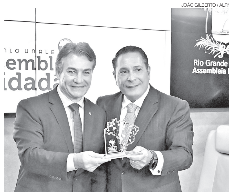
Presidente da ALRN, Ezequiel Ferreira recebe o troféu de premiação nacional

Ele também ressaltou que o reconhecimento é resultado do trabalho coletivo do Legislativo estadual. “Mas este prêmio não pertence a uma pessoa, ele pertence a um time, e esse time são todos que fazem a Assembleia Legislativa do Estado do Rio Grande do Norte. Pertence aos servidores desta Casa, profissionais que trabalham todos os dias com dedicação, competência e espírito público”, declarou.