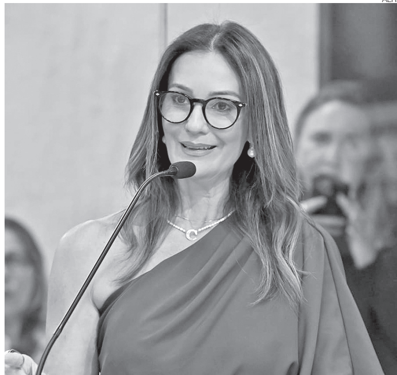
Deputada Cristiane Dantas é procuradora especial da mulher da Assembleia

começar com Respeito”, realizado em parceria com o Ministério Público do Rio Grande do Norte e a Ouvidoria do MP, voltado à capacitação de assistentes sociais e profissionais que atuam em Centros de Referência de Assistência Social (CRAS) e Centros de Referência Especializados de Assistência Social (CREAS).