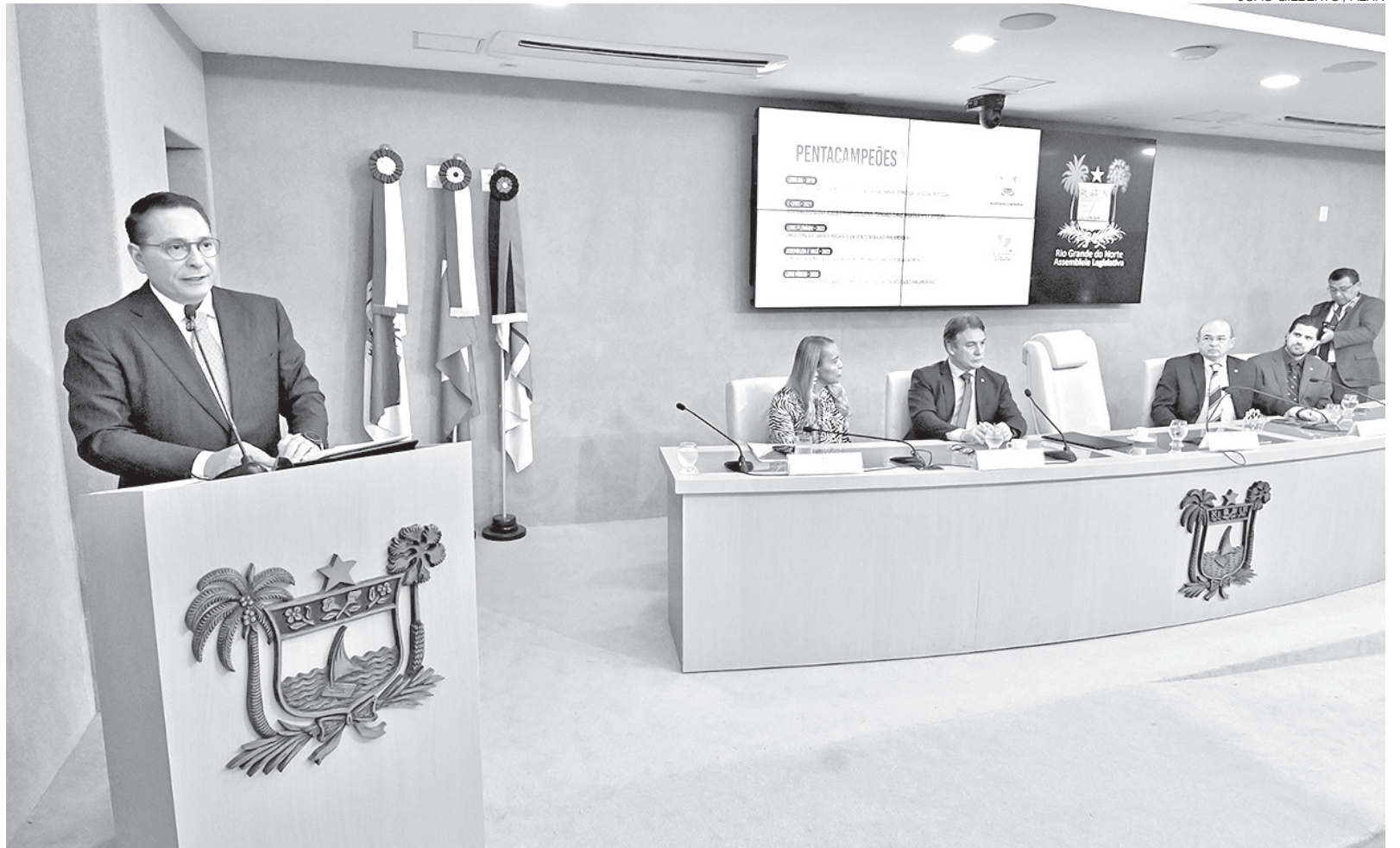
Autoridades e servidores participam da cerimônia de entrega do Prêmio Assembleia Cidadã à Assembleia Legislativa do RN, reconhecida pelo Legis Vídeos