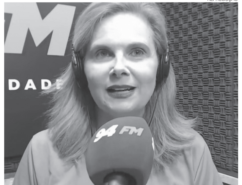
Endocrinologista destaca que 42% da população do RN vive com obesidade

Durante a ação, também serão oferecidos serviços de avaliação de saúde para o público presente. A ideia é facilitar o acesso a orientações iniciais e a exames simples de triagem, que podem indicar a necessidade de acompanhamento médico. “Se você tem dúvida se é obesidade ou não, a gente vai estar fazendo essa avaliação. Inclusive, a gente vai estar com bioimpedância. A gente vai estar fazendo avaliação para apneia do sono e aferindo sua pressão”. ●