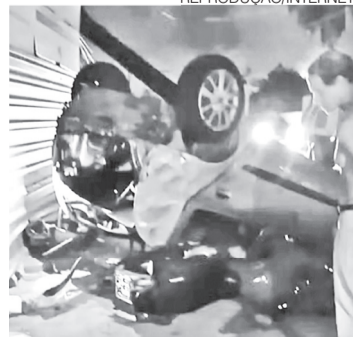
Motorista estava embriagado

Federação de Cooperativas da Agricultura Familiar e Economia Solidária do Estado do Rio Grande do Norte – FEDERAÇÃO UNICAFES/RN Endereço: Rua Jaguarari, 2454, Lagoa Nova, Natal/RN Cep: 59.062-500 CNPJ: 19.776.912/0001-88, Inscrição do NIRE sob o nº 24400005913