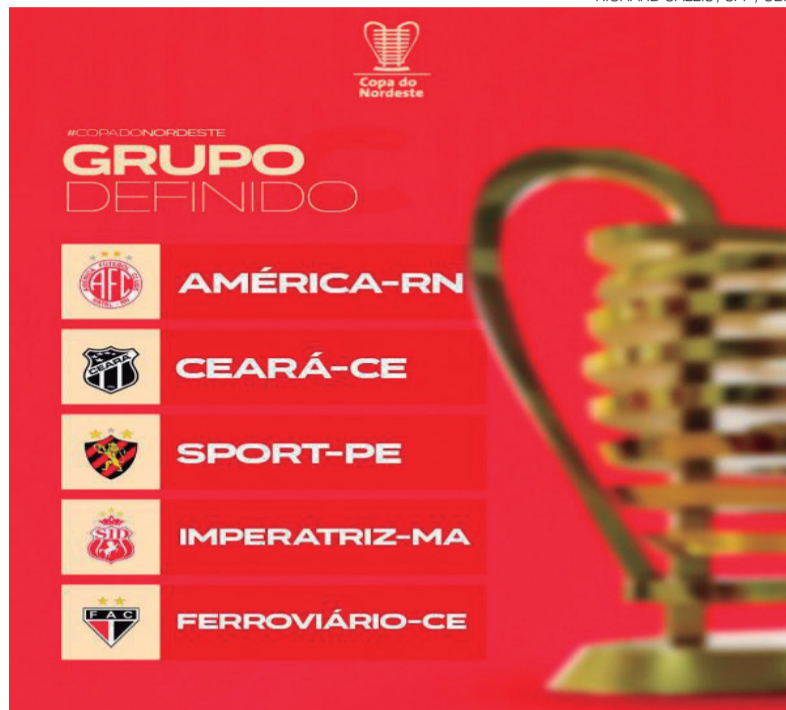
Grupo do América tem Ceará e Sport, que caíram para série B deste ano

O América foi sorteado no Grupo C, ao lado de clubes tradicionais como Ceará Sporting Club, Sport (PE), Imperatriz (MA) e Ferroviário (CE). Nessa chave, os adversários enfrentarão os integrantes do Grupo D na fase inicial, numa fórmula cruzada em turno único que promete confrontos