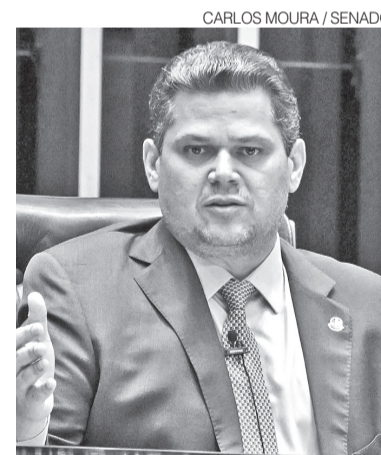
Pres. Senado, Davi Alcolumbre

Viana, porém, registrou apenas sete votos contrários e declarou aprovados os requerimentos. Mesmo admitindo que o número de parlamentares levantados poderia chegar a 14, argumentou que esse total não seria suficiente para formar maioria, já que o