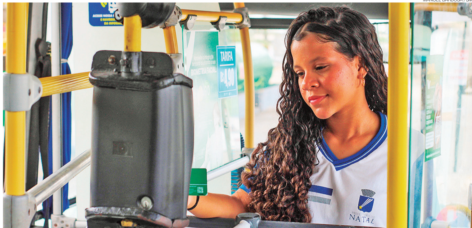
MANOEL BARBOSA / SME

ABC e América já têm adversários definidos para o Nordeste 2026