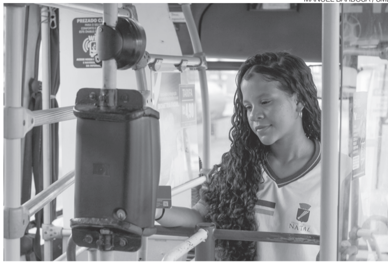
Prefeitura estima investir R$ 3,7 milhões em 2026 para beneficiar estudantes

O gerenciamento do Passe Livre é realizado pela Secretaria Municipal de Educação, por meio do Departamento de Atenção ao Educando (DAE), responsável pelo acompanhamento da frequência escolar e pela validação das informações dos estudantes aptos a receber a gratuidade. Já as recargas mensais dos créditos de passagem são operacionalizadas pelo Sindicato das Empresas de Transportes