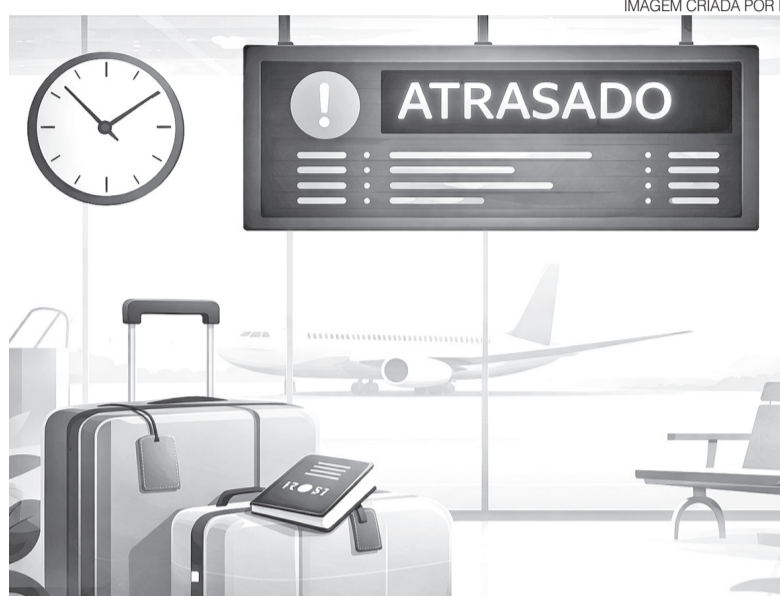
Companhias têm obrigação de prestar assistência aos passageiros mesmo com guerra

Os impactos não atingem apenas passageiros que viajam para o Oriente Médio, mas tam-