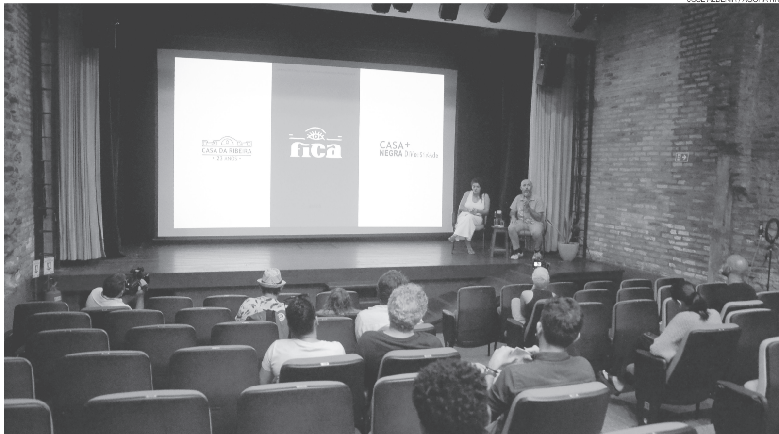
Casa da Ribeira inicia programação comemorativa com o Festival Verão Aquilombado, em Natal, e reúne mais de 30 atrações LGBTQIAPN+ e antirracistas

A mobilização para restaurar o imóvel resultou na aprovação do projeto nas leis de incentivo Lei Rouanet e Lei Câmara Cascudo. A captação de cerca de R$ 819 mil contou com ações culturais abertas ao público, como o projeto “Na Rua da Casa”, iniciado em 11 de julho de 1999, que ocupou as ruínas do casarão e a rua Frei Miguelinho com apresentações gratuitas de música, teatro, dan-