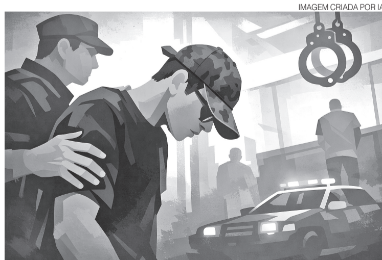
Um dos investigados chegou de cabeça baixa, óculos e boné à delegacia

Segundo o inquérito da 12ª DP (Copacabana), a vítima foi convidada por um adolescente, colega de escola, para ir ao apartamento de um amigo dele, na noite de 31 de janeiro, em Copacabana, na Zona Sul do