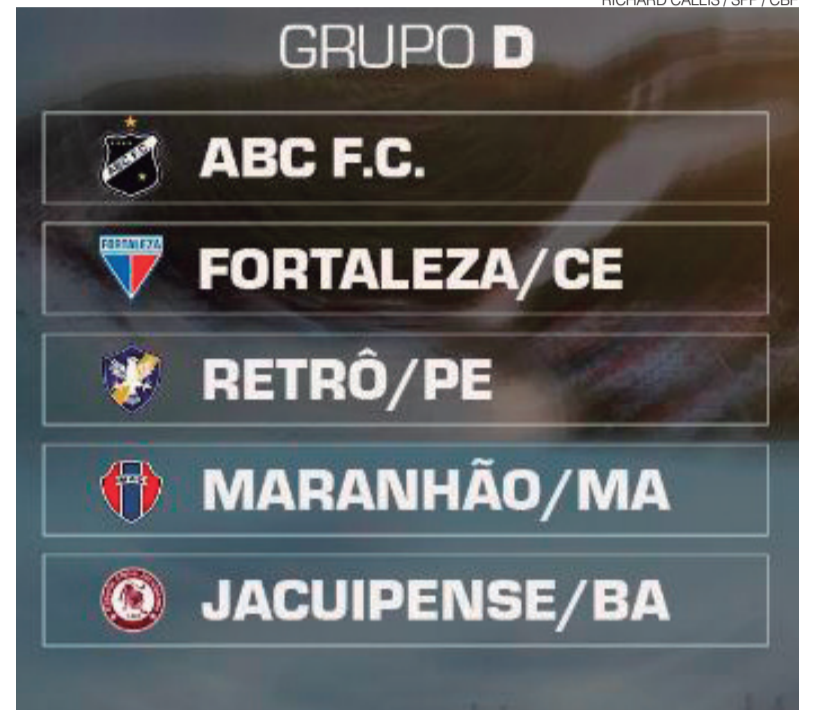
ABC, aparentemente, caiu em grupo com mais chance de classificação

A Copa do Nordeste 2026 está marcada para começar no dia 25 de março e seguir até 7 de junho, com jogos de fase de grupos em turno único e confrontos eliminatórios a partir das quartas de final. O campeão garantirá participação na terceira fase da Copa do Brasil, aumentando a importância da competição não só na