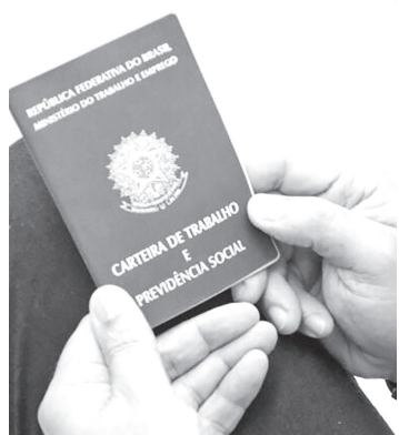
Índice é de 19,4% nessa faixa etária