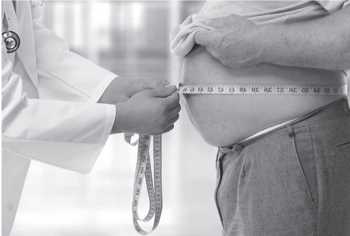
Circunferência abdominal acima de 102 cm em homens e 88 cm em mulheres indica aumento do risco à saúde

Segundo ela, a condição está relacionada a outras doenças e aumenta o risco de mortalidade. “O paciente obeso, muitas vezes, é um paciente hipertenso. Esse paciente obeso é um paciente que tem diabetes. Muitas vezes, é um paciente que tem colesterol aumentado. Esse paciente obeso é um paciente que aumenta o risco cardiovascular, que é a principal causa de mortalidade, que é o infarto e o AVC isquêmico”.