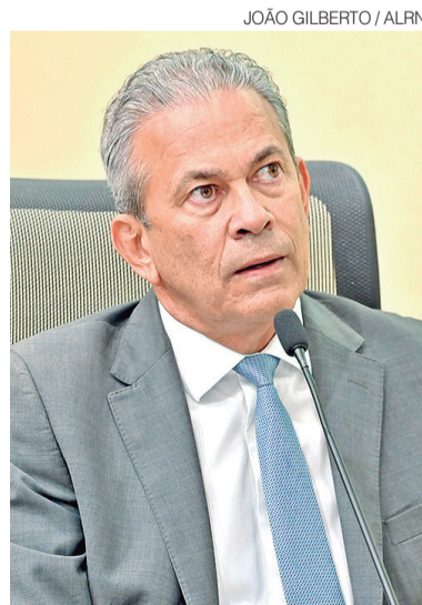
Deputado estadual Hermano Moraes

Segundo o deputado, atualmente há três campos políticos