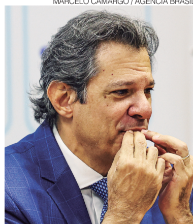
Ministro vai disputar o governo de SP

O prazo para desincompatibilização do cargo para a disputa eleitoral é 4 de abril. Dos 38 minis-