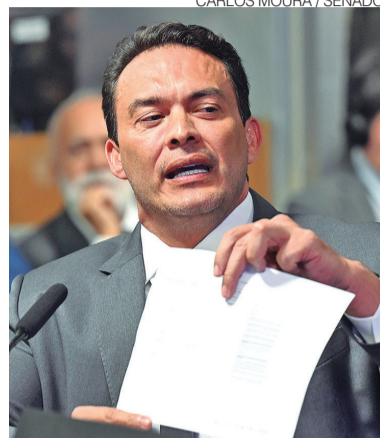
Senador Styvenson Valentim (PSDB)

financeiros em fundos ligados ao resort Tayayá, do qual uma empresa da família de Toffoli foi sócia, e pretende avançar nas investigações com análises de quebras de sigilo e identificação de eventuais irregularidades.