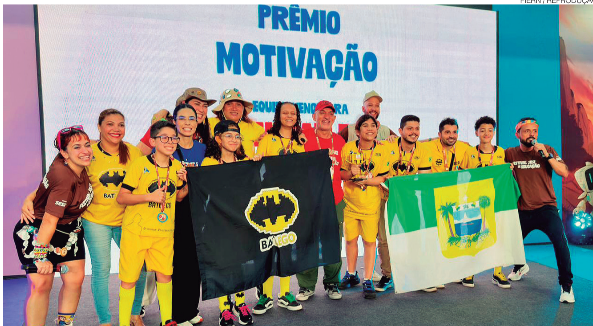
Equipe Sesi Batlego recebeu o Prêmio Motivação; no festival, estudantes desenvolvem soluções em robótica