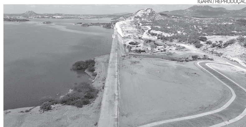
Oiticica tem capacidade para armazenar 742,6 milhões de metros cúbicos

No total, 40 reservatórios públicos receberam recargas. Em Serra Negra do Norte, o sistema de abastecimento gerido