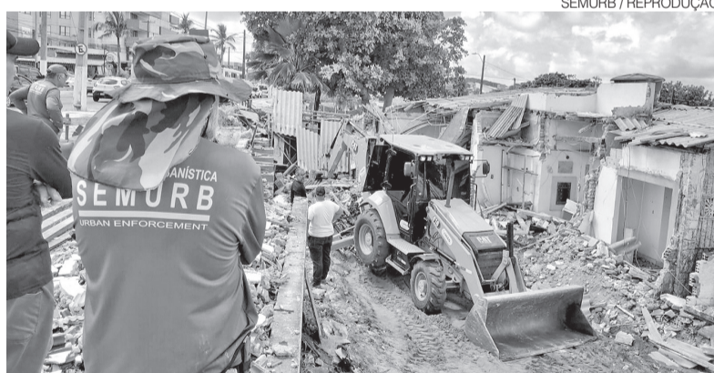
Imóveis estavam acima do nível da via e prejudicando visão do Morro do Careca

la Fiscalização Urbanística, havia sido iniciada na última quinta-feira 5 e teve continuidade na sexta-feira 6, com a demolição de dois imóveis. A ação foi concluída na manhã desta segunda-feira 9, com a retirada das últimas estrutu-