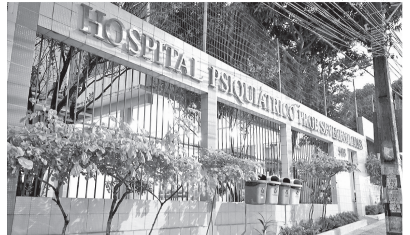
Hospital Professor Severino Lopes fica localizado na Av. Romualdo Galvão

No comunicado, a Sociedade Professor Heitor Carrilho, entidade beneficente que mantém a unidade de saúde, afirma também que ocorrerá a formalização de um novo contrato com a Secre-