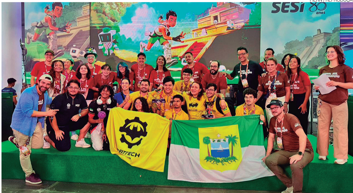
Equipe Sesi Bat Tech obteve o primeiro lugar no Prêmio Conexão e o segundo lugar na categoria Bússola em evento em SP