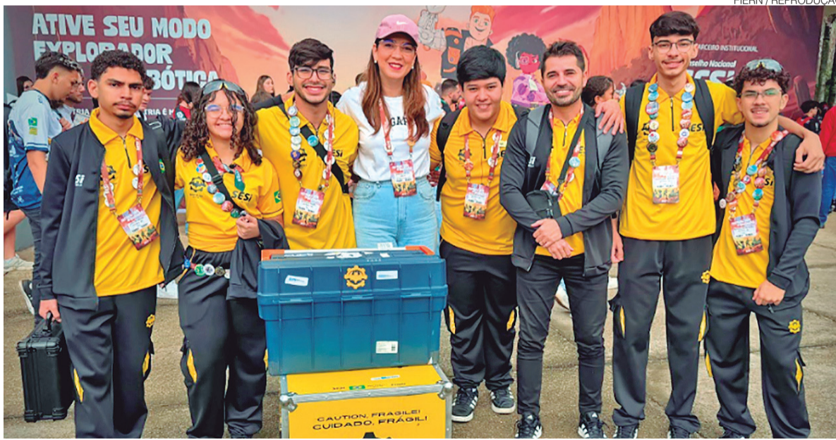
Sistema FIERN destaca que reconhecimento obtido reforça potencial dos jovens para desenvolvimento tecnológico e científico

segundo lugar no Prêmio Bússola, que destaca o time cujo técnico se sobressaiu ao orientar os alunos com excelência ao longo da temporada. Um dos técnicos