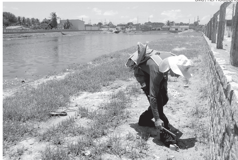
Entorno da lagoa de captação ficou submerso com transbordamento após chuvas

“Um dos pilares dessa gestão é o compromisso com a saúde da população. Já foram desenvolvidas várias ações aqui há cerca de 15 dias, e a gente volta novamente para incrementar e avaliar o que foi feito. Estamos aqui com a equipe de controle vetorial fazendo visitas domiciliares, descobrindo foco e orientando a população quanto à proliferação de criadouros e uma equipe com o UBV matando a fase adulta. Realizamos várias ações voltadas