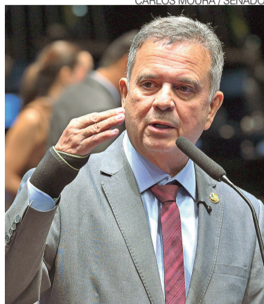
Senador Rogério Marinho (PL)

Apesar disso, senadores têm driblado a decisão de Alcolumbre com iniciativas próprias que miram apurar o caso Master em três frentes: a CPI mista do INSS, o grupo de trabalho da Comissão de Assuntos Econômicos (CAE) e a CPI