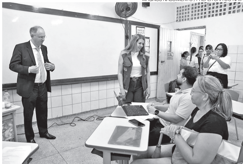
Mutirão de conciliação aconteceu na Escola Municipal José de Andrade Frazão

tipos de indenização. Nos casos de imóveis alugados, os proprietários podem solicitar ressarcimento referente aos danos estruturais causados ao imóvel. Já os inquilinos têm direito de pleitear indenização pelos prejuízos relacionados à perda ou dano de bens móveis atingidos pelo alagamento.