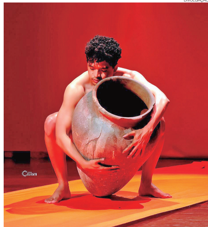
Programação reúne espetáculos solo, intercâmbios artísticos e formativos

O 1º Fest RN – Festival de Solos Teatrais do Rio Grande do Norte é uma realização da S.E.M. Cia. de