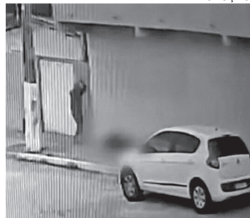
Câmera registra flagrante do crime