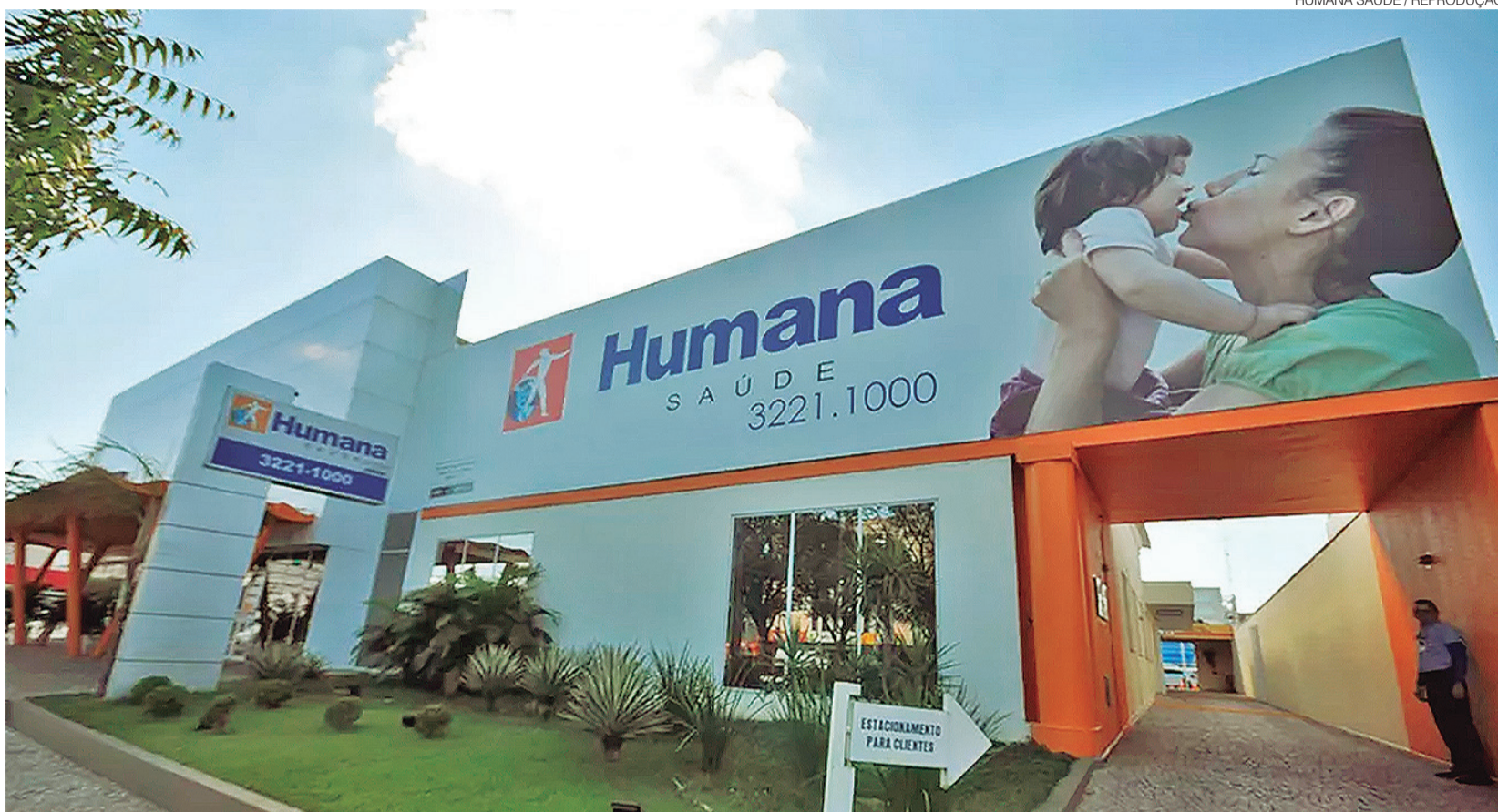
Operadora Humana Saúde ampliou significativamente sua presença no Nordeste, tornando-se uma marca reconhecida no segmento de planos de saúde da região

Nesse cenário, o crescimento da operadora reflete uma tendência observada em todo o setor de saúde suplementar brasileiro: a necessidade de oferecer cada vez mais