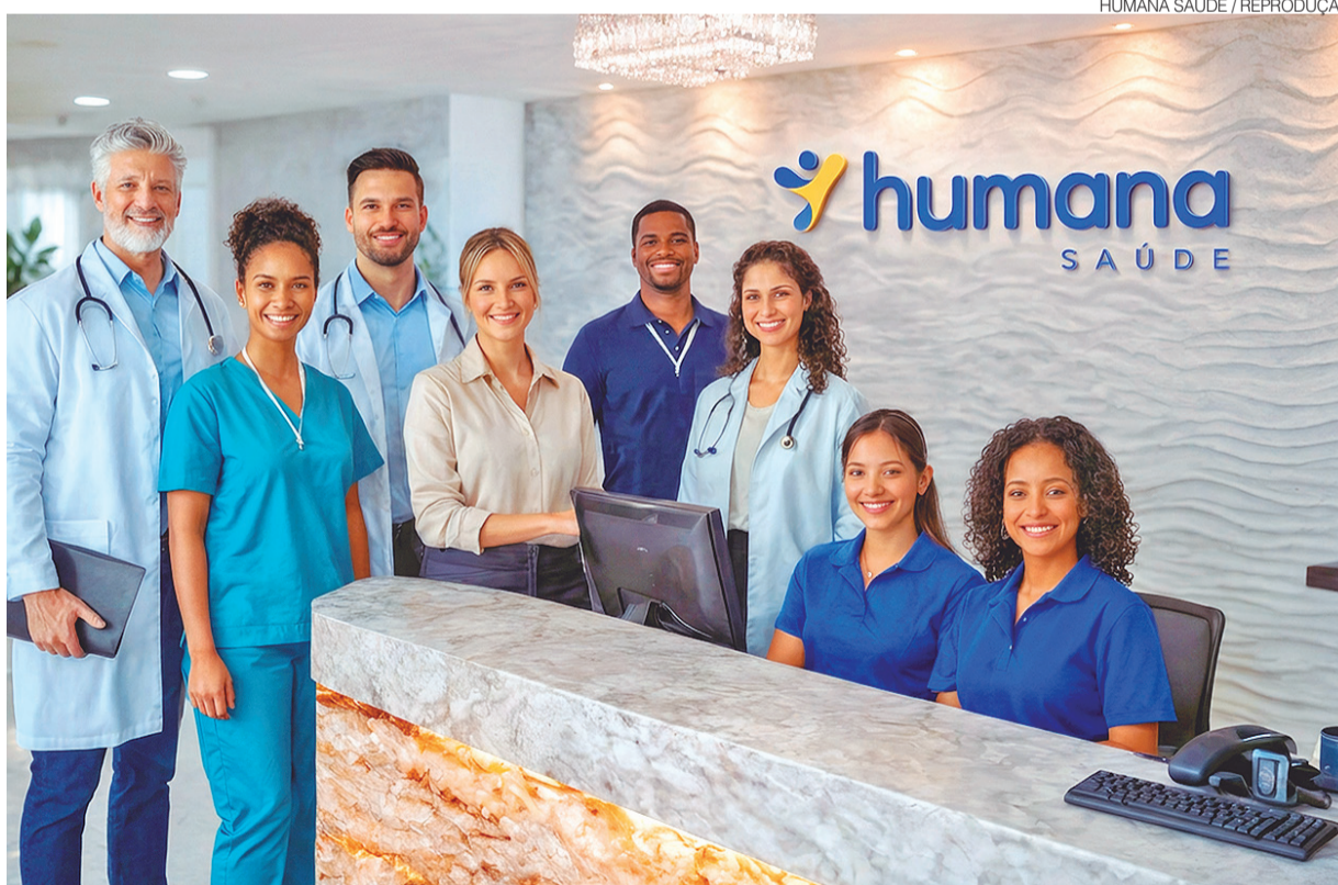
Humana aposta em proximidade com beneficiários e na busca por soluções que acompanhem necessidades dos usuários

eficiência, acesso e qualidade em um sistema pressionado por custos crescentes, aumento da demanda assistencial e envelhecimento populacional. Ao longo dos últimos anos, a Humana Saúde passou a investir de forma mais intensa em so-