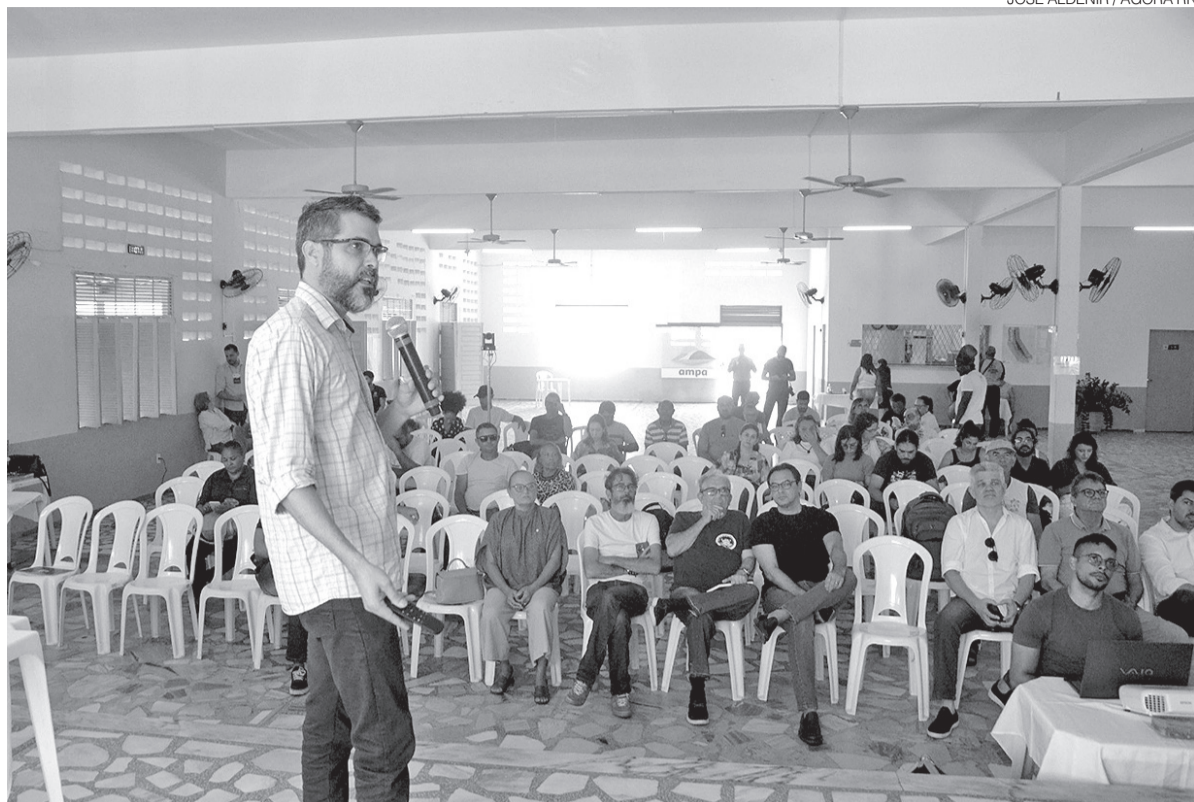
Participação popular indicou acessibilidade, drenagem e preservação do Morro do Careca como prioridades do projeto