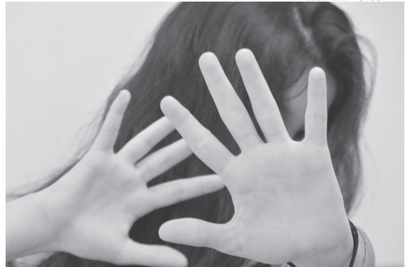
Rede de proteção inclui medida protetiva, patrulha e casas-abrigo no RN

Ela orientou que o pedido pode ser feito por diferentes caminhos, devendo ser realizado pela própria vítima ou por instituições. “A medida protetiva pode ser pedida pelo Ministério Público, pela própria mulher, pela dele-