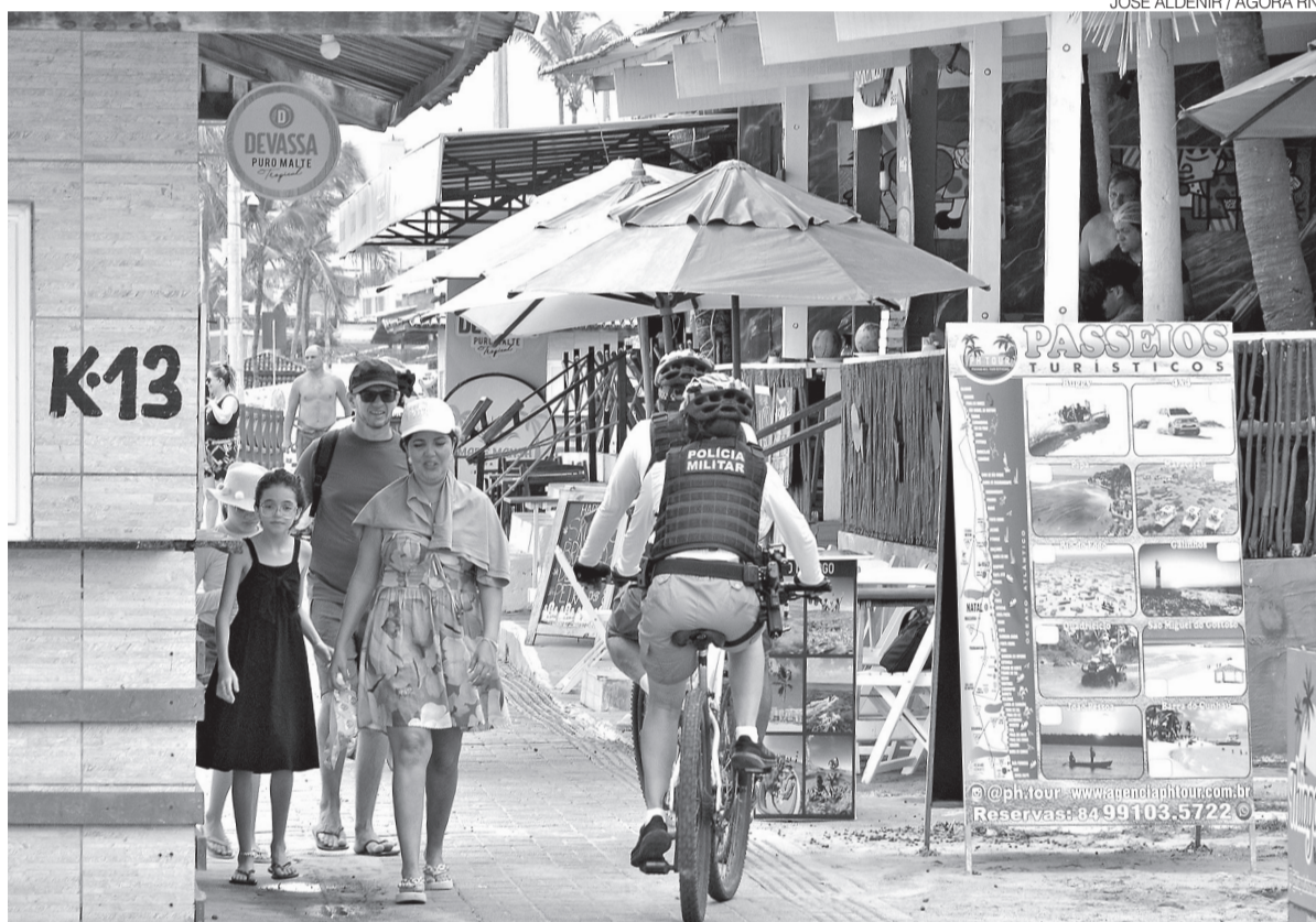
Estudo indica necessidade de ampliar e requalificar o calçadão para atender ao crescimento de atividades na orla

o material produzido foi sistematizado e ficará disponível no site oficial do Projeto Orla. “Todos os documentos, tudo o que foi produzido por esse grupo de trabalho está disponível no site do Projeto Orla. Lá você vai poder encontrar todo o acervo de documentos, estudos e materiais de apoio ao longo de todo esse processo”, afirmou.