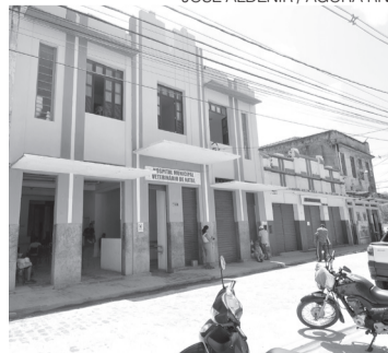
Hospital Público Veterinário de Natal