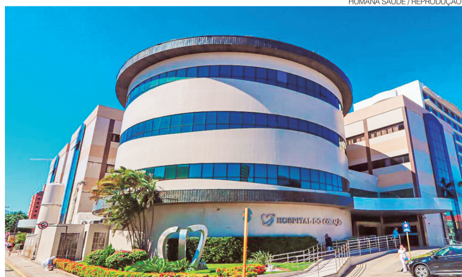
Operadora firmou parcerias estratégicas com instituições hospitalares de referência em Natal

A presença dessas unidades também faz parte de uma estratégia cada vez mais adotada pelas operadoras de saúde no país: a verticalização parcial dos serviços, modelo que busca integrar diferentes etapas da assistência médica dentro