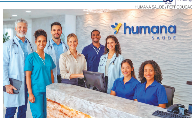
30 anos humana

Expansão da rede e presença consolidada no Nordeste são marcas da Humana