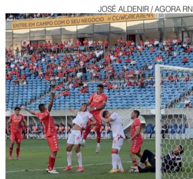
Lance de Potiguar x América, na Arena

O Campeonato Carioca, vencido pelo Flamengo pela 40ª vez,