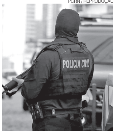
Operação contra facções criminosas no RN

A posição foi apresentada por um porta-voz do Departamento de Estado em resposta a questionamentos da imprensa sobre o andamento das discussões dentro da administração do presidente Donald Trump. O representante do governo americano