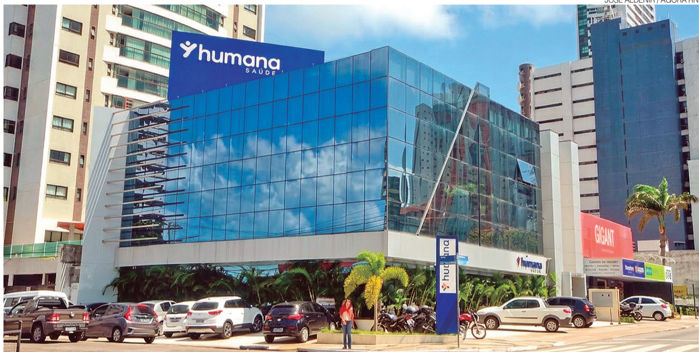
Humana Saúde mantém sede e clínicas próprias que ampliam a capacidade de atendimento aos beneficiários da Região Metropolitana de Natal