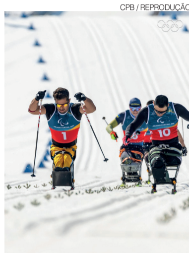
Brasil está pela 4ª vez na competição

representando o Brasil me deixa muito orgulhoso”, disse.