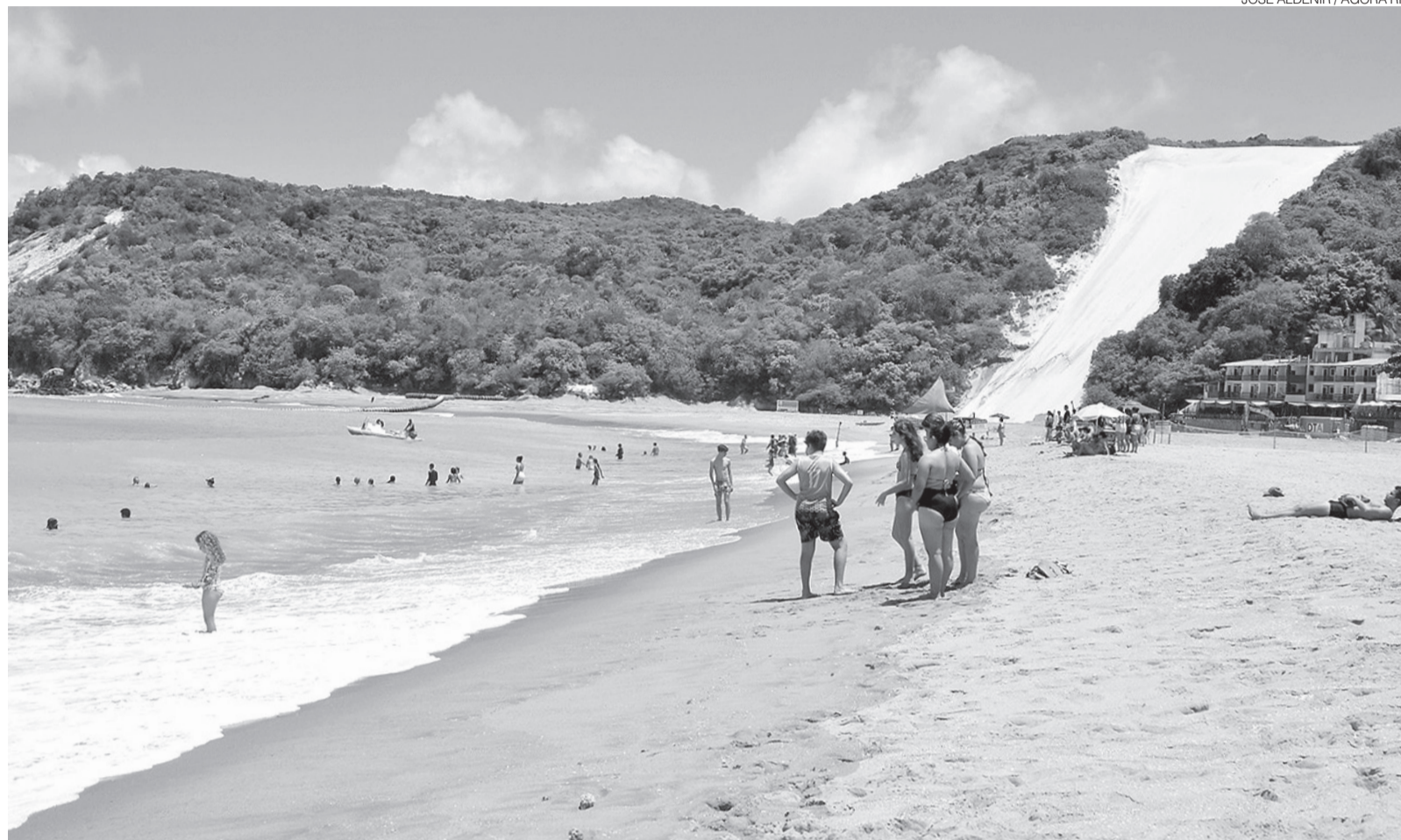
Projeto da nova orla de Ponta Negra será definido por concurso nacional após quase 200 sugestões apresentadas por moradores e setor turístico de Natal

A audiência foi realizada na sede da Associação dos Moradores dos Parques Residenciais Ponta Negra e Alagamar (Ampa), com transmissão pela internet. O encontro marcou o encerramento da etapa de escuta pública que reuniu moradores,