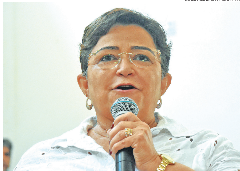
Secretária afirma que aumento só depende agora de aprovação de lei na ALRN

A secretária também comentou a ampliação da rede de educação profissional no Estado. Ela destacou que o governo já concluiu e colocou em funcionamento 10 unidades do Instituto Estadual de