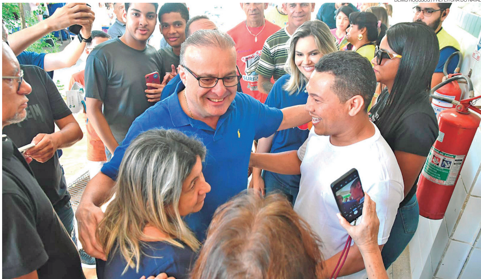
Prefeito de Natal, Paulinho Freire destaca que o programa possibilita à Prefeitura conhecer de perto as demandas da população em cada região da cidade

O prefeito Paulinho Freire reitera a essência do programa, de possibilitar à Prefeitura conhecer de perto as demandas da população em cada região da cidade. “Esse programa permite à Prefeitura estar perto das comunidades para