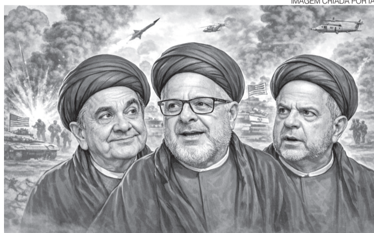
IMAGEM CRIADA POR IA

blogdodiogenes.com.br | fcodiogenes@hotmail.com