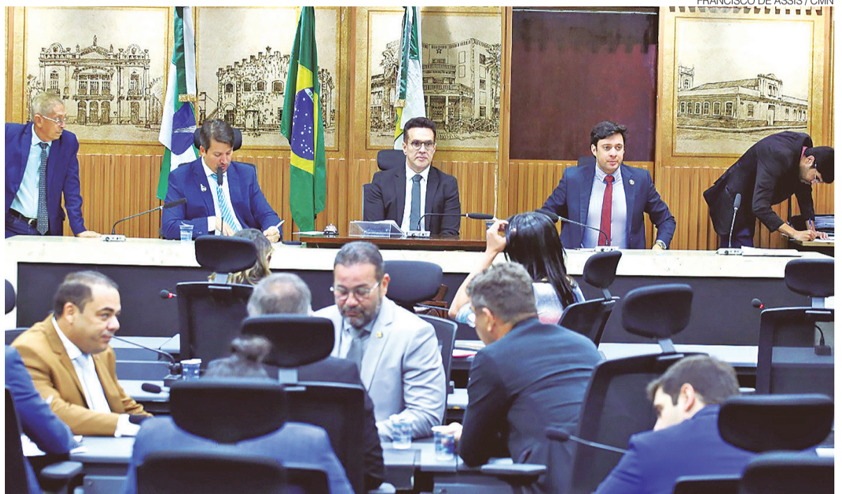
Iniciativa aprovada pelos vereadores da capital busca ampliar acompanhamento de mulheres com câncer de mama

“Com isso, vamos estender o selo para instituições públicas e privadas que ofereçam condições de trabalho adequadas às necessidades da mulher. Em sessões solenes, fazemos este reconhecimento com a entrega do selo”, explicou o parlamentar. ●