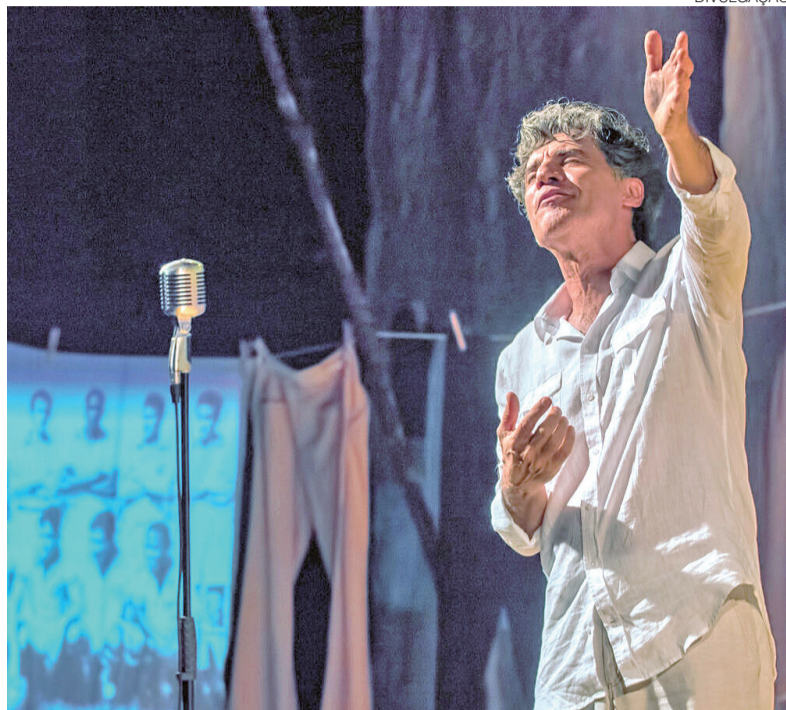
Ator Paulo Betti apresenta o monólogo Autobiografia Autorizada no teatro

Um dos destaques da programação é o espetáculo nacional Autobiografia Autorizada , protagonizado pelo ator Paulo Betti. A montagem será apresentada nos dias 13, 14 e 15 de março, sempre às 19h. No monólogo, o artista revisita episódios de sua trajetória pessoal e profissional, conduzindo o público por histórias marca-