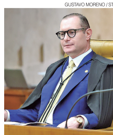
Ministro do STF Cristiano Zanin

Ao analisar o caso, o ministro entendeu que o pedido não trouxe elementos suficientes para comprovar a suposta omissão da presidência da Câmara. Segundo