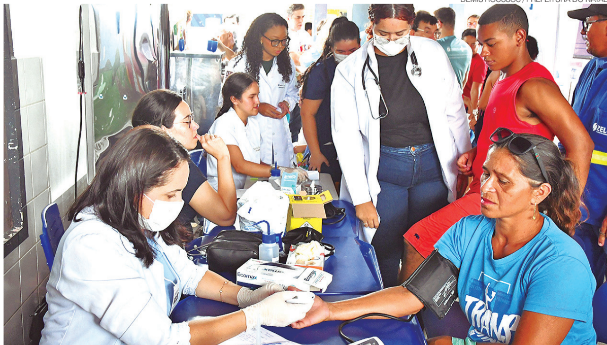
Em 2025, projeto realizou mais de 14 mil atendimentos em mais de 100 serviços em áreas como saúde e assistência

Da mesma forma acontece com atendimentos ligados ao Cadastro Único, orientações sobre programas habitacionais e regularização fundiária, e informações sobre iluminação pública. ●