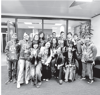
Turma voltará no dia 11 de abril

TRANSCOOP – COOPERATIVA DOS PROPRIETÁRIOS DE CAMINHÕES, CAÇAMBAS, TRATORES, MÁQUINAS E SIMILARES CNPJ: 07.721.951/0001-07 NIRE: 244000468-2