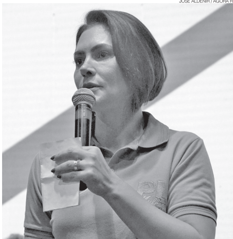
Nota da ex-primeira dama afirma que Jair Bolsonaro não teve acesso a celular

A reação ocorre após declaração de Eduardo durante a CPAC, nos Estados Unidos, no sábado. Ao discursar antes do senador Flávio Bolsonaro, ele afirmou que gravava um vídeo para mostrar ao pai e sustentar que o ex-presidente não poderia ser contido por uma prisão que classificou como injusta.