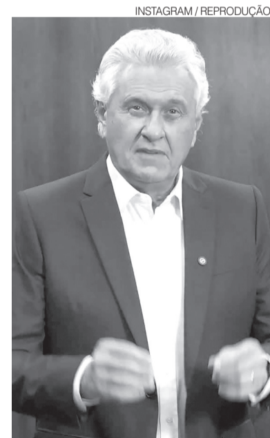
Pré-candidato Ronaldo Caiado (PSD)

O governador acrescentou que, apesar de reconhecer a legitimidade institucional da escolha, a decisão tende a reforçar a divisão política no país. “O Brasil está cansado, muito cansado