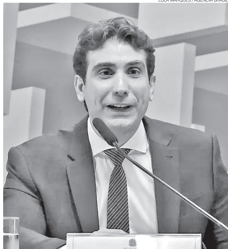
Galípolo prevê um crescimento menor do País este ano e inflação maior

Apesar da avaliação positiva sobre a posição relativa do Brasil, Galípolo alertou para os efeitos macroeconômicos do choque de oferta no petróleo. Para ele, a alta dos preços tende a pressionar a inflação e reduzir o ritmo de crescimento econômico em 2026. “Temos uma visão de que provavelmente é inflação para cima e crescimento para baixo”, afirmou, ao diferenciar o atual cenário de episódios anteriores, quando a alta do petróleo estava associada ao aumento da demanda global e podia impulsionar o Produto Interno Bruto. ●