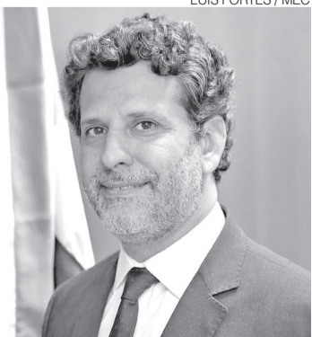
Novo ministro Leonardo Barchini