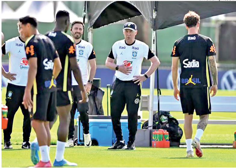
Seleção brasileira terá cinco mudanças no jogo contra a Croácia na noite de hoje

As alterações mais imediatas ocorrem por necessidade. O lateral Wesley e o atacante Raphinha foram cortados após lesões na coxa, abrindo espaço para as entradas de