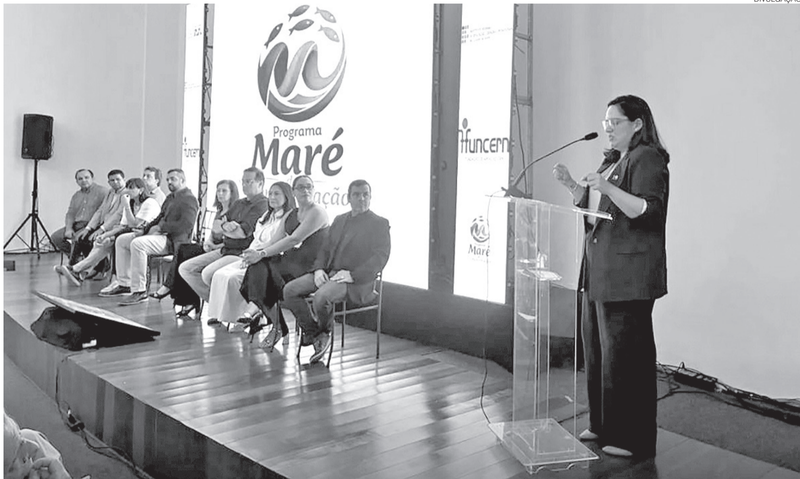
“Maré da Transformação” foi lançado no Museu da Rampa, em parceria com o IFRN, no valor de R$ 3,2 milhões e vai beneficiar 4,5 mil pescadores no RN

ursos de alfabetização e capacitação profissional para pescadores e marisqueiras, qualificação no beneficiamento do pescado e estímulo à pesca esportiva e ao turismo associado à atividade. A proposta também inclui investimentos em infraestrutura, como a instalação de sistemas de ener-