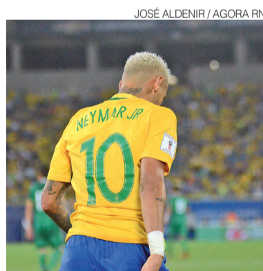
Neymar Jr quer jogar esta Copa

Na avaliação do jogador, a condição física recente apresentou oscilações. Ele destacou bom desempenho contra o Vasco, quando atuou sem dores, mas admitiu receio de lesão no clássico diante do Corinthians. Já na partida contra o Internacional,