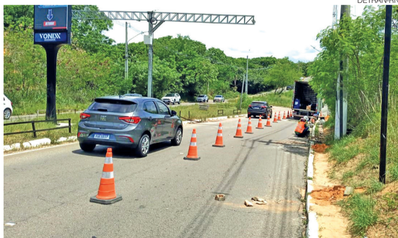
Postes para câmeras já foram instalados; sistema deve operar em até 60 dias

Segundo o Detran, o prazo para funcionamento envolve etapas como adequação da sinalização, instalação das câmeras, ligação