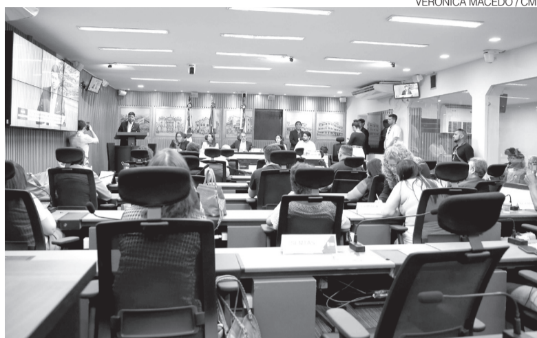
Audiência pública na Câmara Municipal discutiu políticas públicas para a juventude

Os dados apresentados durante a audiência revelaram que 45,7% dos jovens de Natal deixam a escola para trabalhar, enquanto o Estado registra cerca de 8.700 aprendizes, número considerado