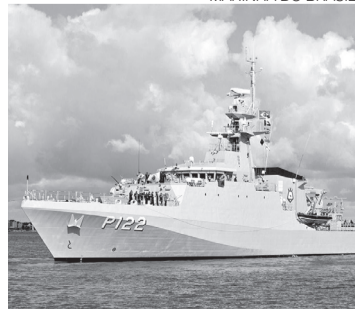
Navio da marinha brasileira