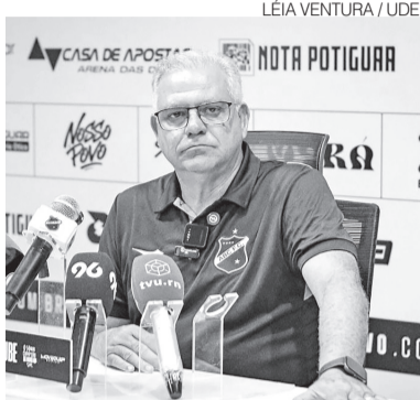
ABC perdeu em casa para o Sport