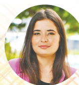
Nathallya Macedo Editora

Titina representa uma trajetória que nasce no teatro, atravessa o audiovisual e retorna à sua origem com força renovada. Sua própria fala, em vida, aponta o caminho: “Porque só no coletivo é que a gente consegue produzir e resistir e mostrar nossa força”. Há, nessa afirmação, uma síntese do que está em jogo. Teatro é coletivo. E, sem coletividade, ele não se sustenta.