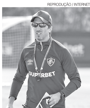
Zubeldía deu aquela 'liga' ao tricolor

o confronto tende a refletir o momento atual das equipes. O Coritiba aposta na força do Couto Pereira para reagir, enquanto o Fluminense chega com leve favoritismo, apoiado no desempenho mais estável e na sequência positiva recente.