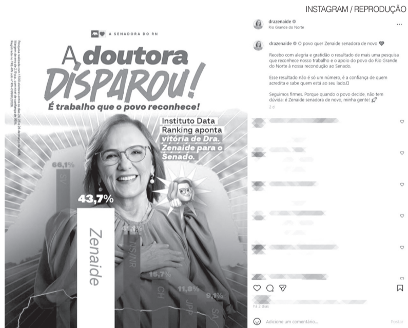
Senadora Zenaide Maia divulgou números da pesquisa em seu Instagram