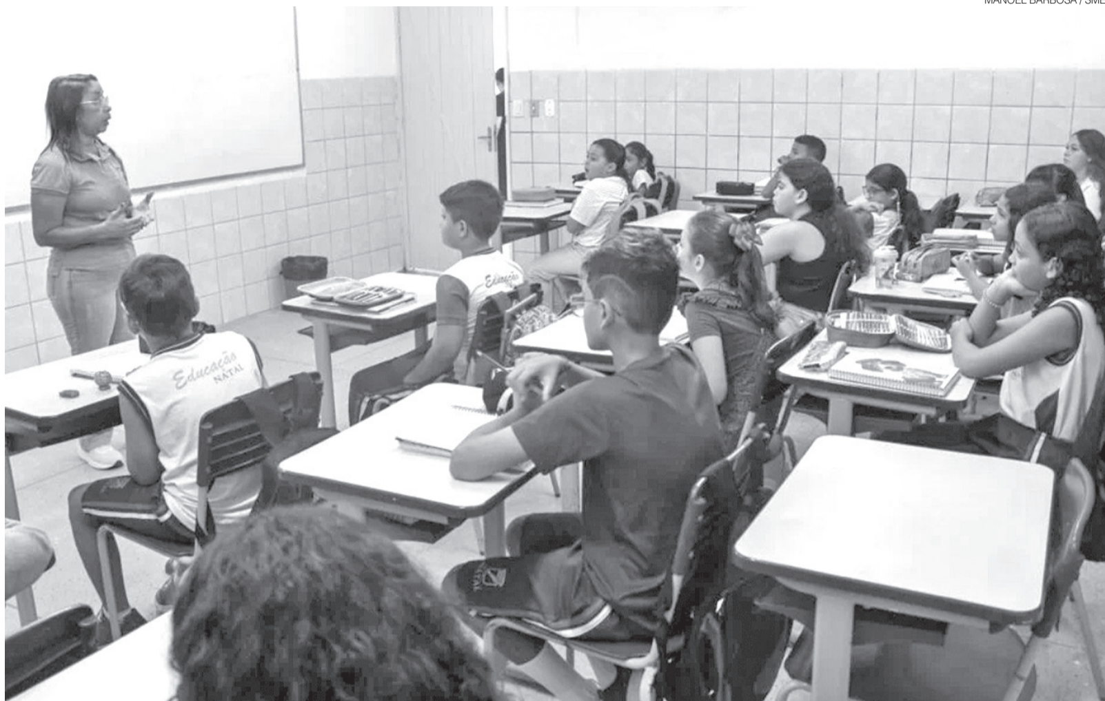
Levantamento do Inep revela desigualdade entre municípios do RN, com índices que variam de 9% a 97% de crianças alfabetizadas no tempo adequado

Ele destaca que, entre as medidas adotadas, está o regime de colaboração, com formações continuadas, novas estratégias, metodologias de desenvolvimento da aprendizagem e melhor aproveitamento do tempo em sala de aula.