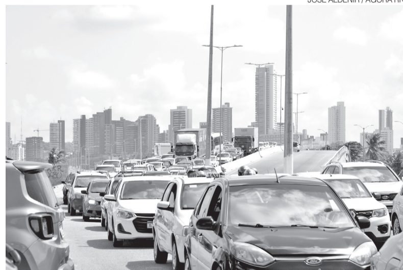
Projeto de Lei foi aprovado na Câmara e agora está em discussão no Senado

Especialistas do setor automotivo e jurídico apontam que a proposta pode trazer maior pre-