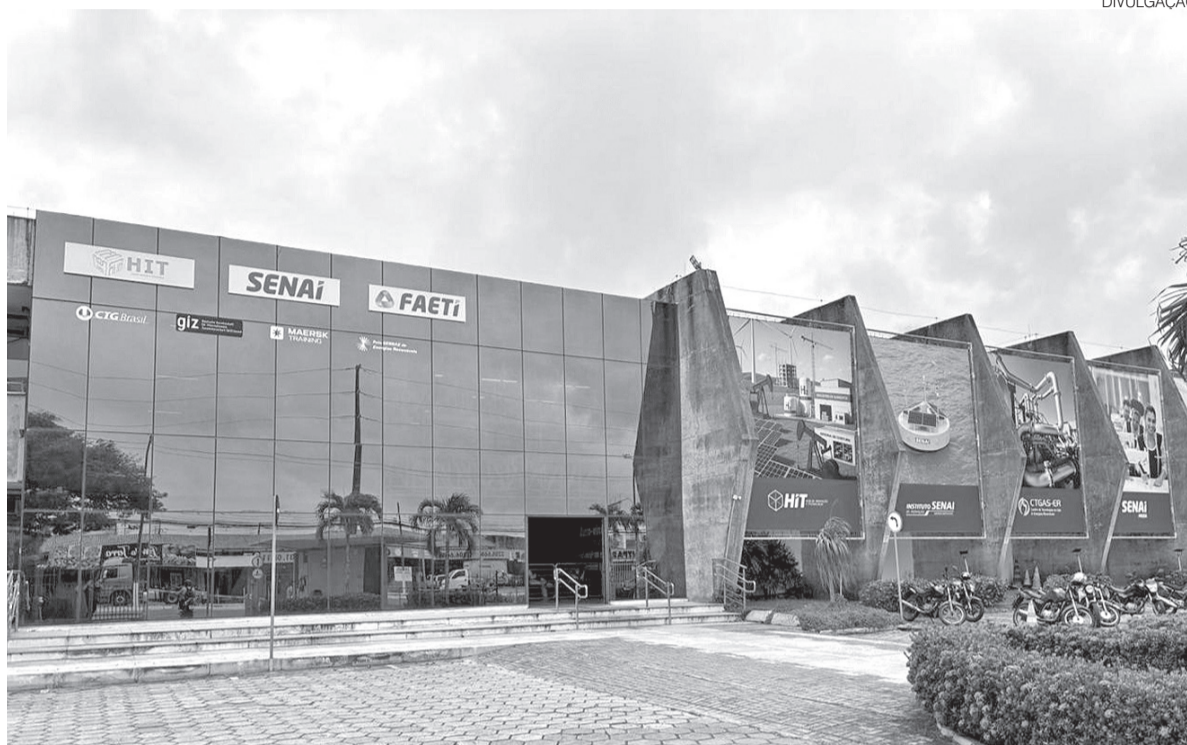
Faeti, que fica localizada em Lagoa Nova, oferece cursos voltados à operação e inovação em energias renováveis

O diretor também destacou a competitividade da fonte. “Hoje nós podemos dizer com muita