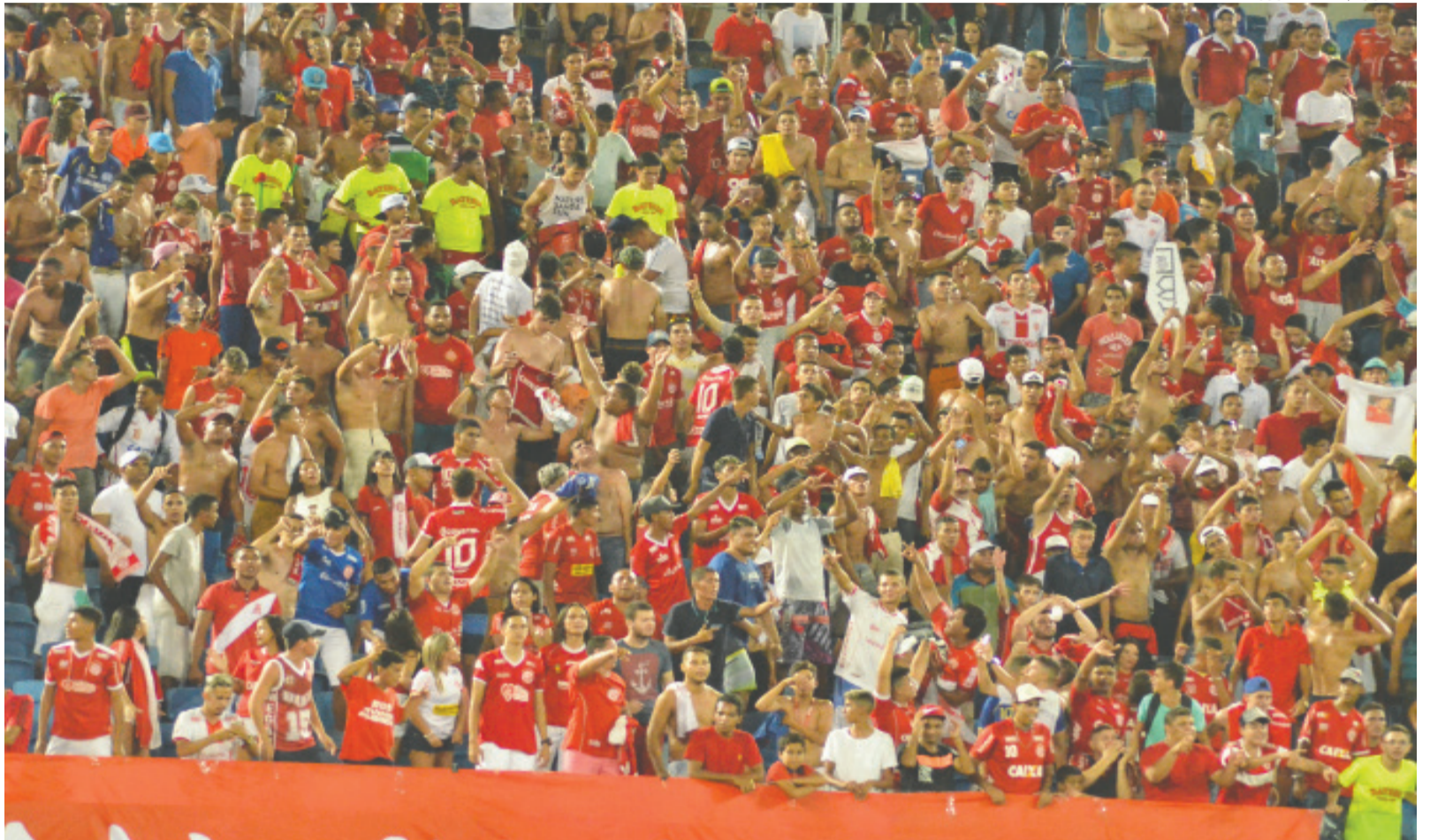
Torcida do América está mais confiante no time após o título estadual e o bom começo na Copa do Nordeste; estreia no Brasileiro será diante do Sousa

Como parte das ações para ampliar a presença do público, o clube anunciou uma iniciativa inédita de incentivo à compra antecipada. A cada mil ingressos vendidos, serão sorteados brindes exclusivos entre os torcedores. Para o jogo de estreia, o prêmio será uma camisa do tetracampeonato autografada por