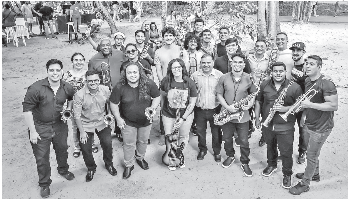
Som da Mata retorna com show da Big Band Jerimum Jazz; banda de música instrumental é formada por estudantes da UFRN

Com linguagem acessível e interativa, o espetáculo propõe uma abordagem lúdica de temas