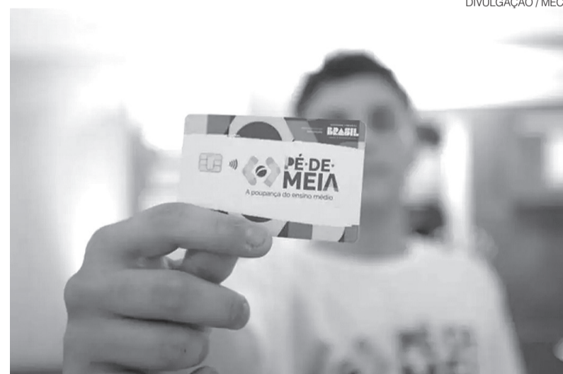
Pé-de-Meia contribui para queda da evasão escolar no Rio Grande do Norte

As parcelas mensais podem ser utilizadas imediatamente, auxiliando nas despesas cotidianas. Já os valores anuais são deposita-