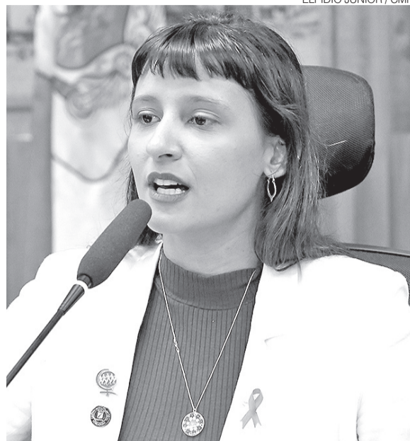
Brisa: 'Cidade que respeita vítimas não pode celebrar algozes'

údos na TV Câmara, entre outras iniciativas voltadas a garantir espaço e visibilidade ao processo de reconstrução da memória e da verdade sobre a história do país.