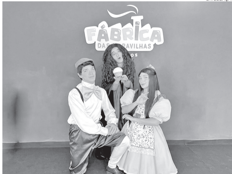
Espectáculo “João e Maria na Floresta da Coelhândia” abre temporada para crianças

No período da tarde, às 16h30, o Som da Mata retoma sua programação com o show da Big Band Jerimum Jazz, grupo formado por estudantes da Escola de Música da Universidade Federal do Rio Grande do Norte (EMU-FRN). Com trajetória consolidada na cena local, a banda se destaca por unir performance artística e caráter formativo, aproximando o público da música instrumental.