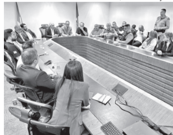
Reunião com cúpula da Sesed ontem