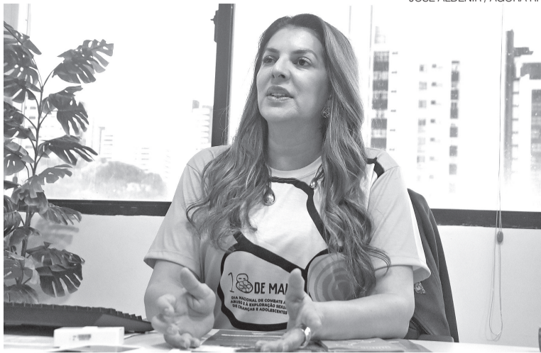
Primeira-dama de Natal deverá retomar mandato de vereadora na segunda