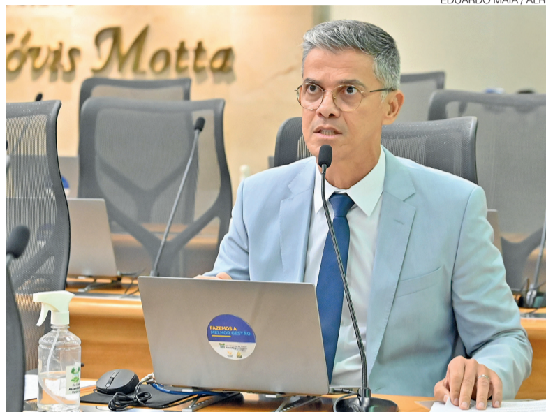
Deputado estadual minimizou fala e falou que declaração foi tirada de contexto