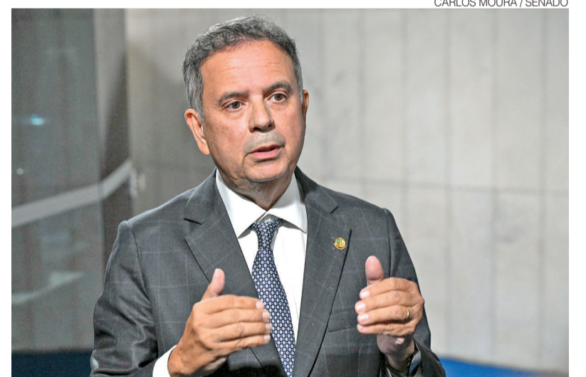
Marinho disse que o atual governo não tem um projeto estruturado para o País

Para Marinho, o aumento da dívida pública terá impacto dire-