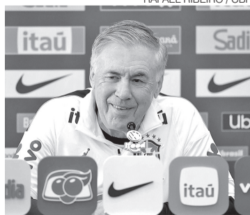
Carlo Ancelotti tem 99% do time

O ataque, por sua vez, já tem uma base definida, com Vini Jr., Raphinha, Gabriel Martinelli e outros nomes consolidados. A possível ausência de Neymar, hoje considerada improvável pela comissão técnica, também influencia o desenho final da lista. Entre desempenho recente e pressão externa, Endrick surge como o principal ponto de interrogação de Ancelotti, cuja decisão final tende a refletir o equilíbrio entre renovação e experiência na seleção. ●