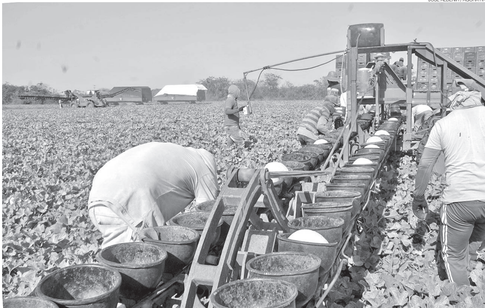
Entressafra do setor de fruticultura proporcionou baixas na geração de emprego no setor agrícola e este deve ser revertido até o meio deste ano, com a safra

“O resultado contrasta com o crescimento observado no Brasil, indicando um descolamento em relação ao cenário nacional e sugerindo menor capacidade de