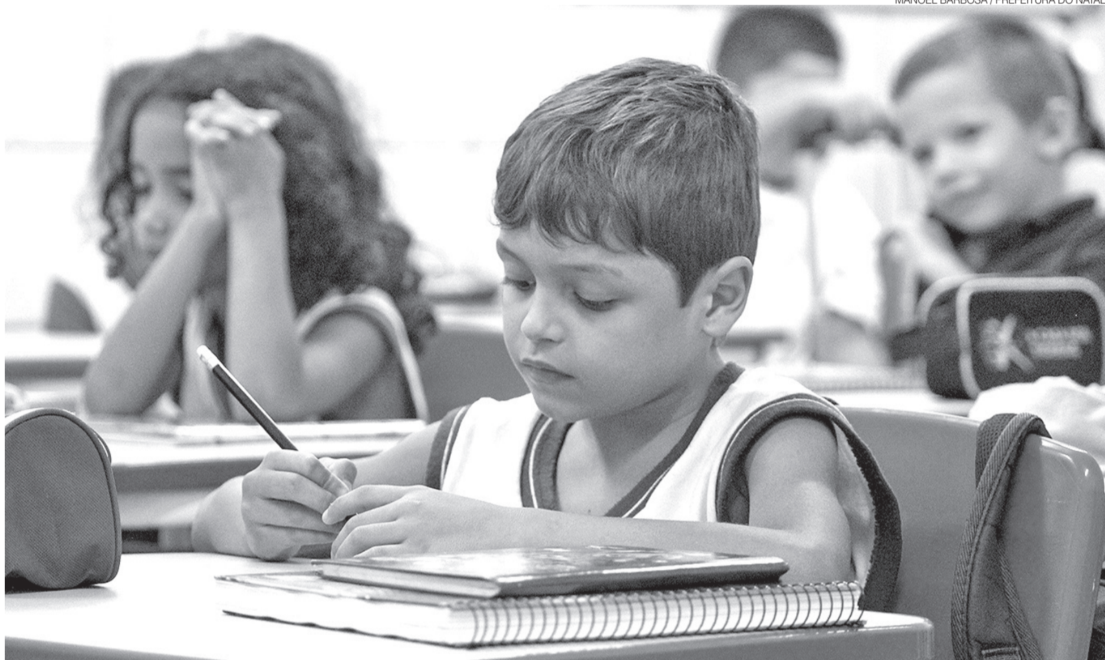
Esta é a primeira vez que Natal aparece no levantamento sobre alfabetização. Por isso, não é possível saber se houve evolução ou regressão no índice educacional

Entre as capitais brasileiras, Natal está na vice-lanterna, à frente apenas de Porto Alegre (27%). A avaliação na capital gaúcha, porém, foi afetada pelas enchentes, o que leva pesquisadores a relativizarem os dados. Sem Porto Alegre, Natal estaria na última posição entre as capitais.