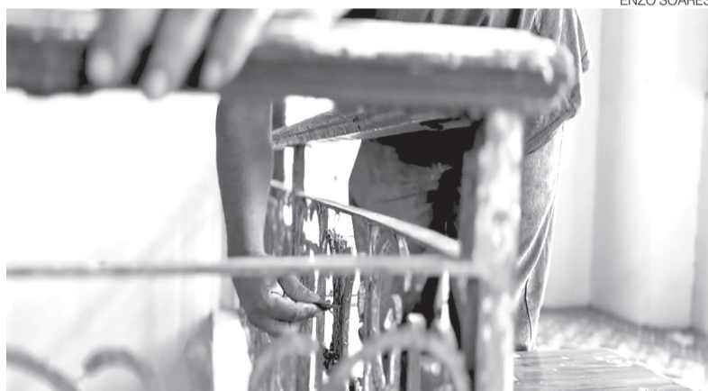
Móveis e peças centenárias passam por processo de restauração no IFRN

tiga”, diz. Enquanto lixa portas centenárias ou reconstrói molduras corroídas pelo tempo, ele entende que também restaura uma forma de olhar do passado.