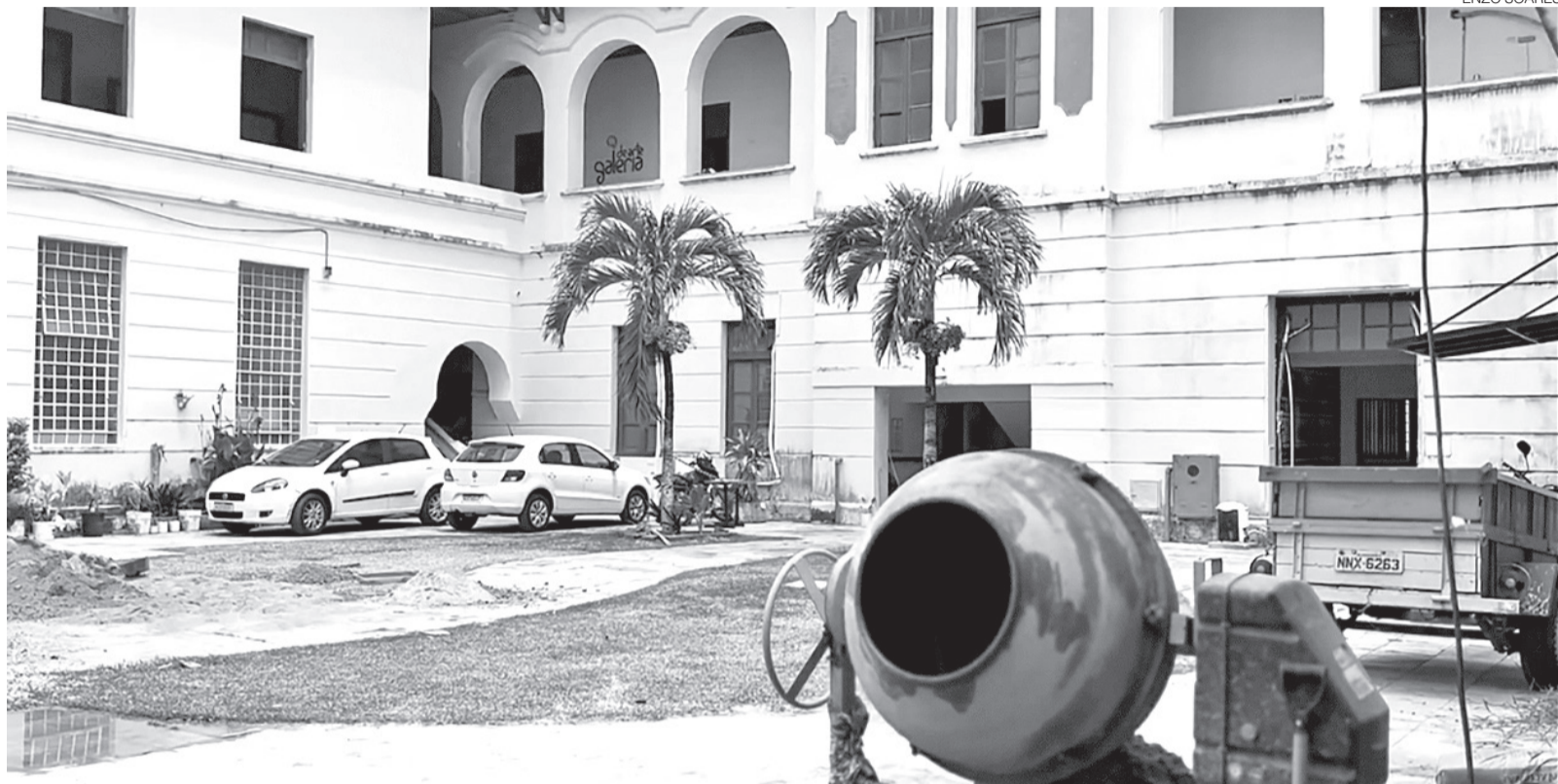
Antigo prédio do IFRN, na Cidade Alta, em Natal, passa por processo de restauração para abrigar o Centro de Tecnologia e Cultura Luzia Vieira de França

Para o artista, cada gesto de restauração ultrapassa o ofício manual - é também um ato de resistência à pressa e ao esquecimento. “A cultura está justamente nisso, em a gente preservar para mostrar aos jovens a preservação da cultura an-