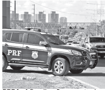
PRF fará fiscalização nas estradas