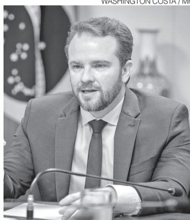
Min. da Fazenda, Dario Durigan

Pacote inclui incentivo ao diesel e gás de cozinha e desoneração do querosene de aviação; impacto pode superar R$ 10 bilhões