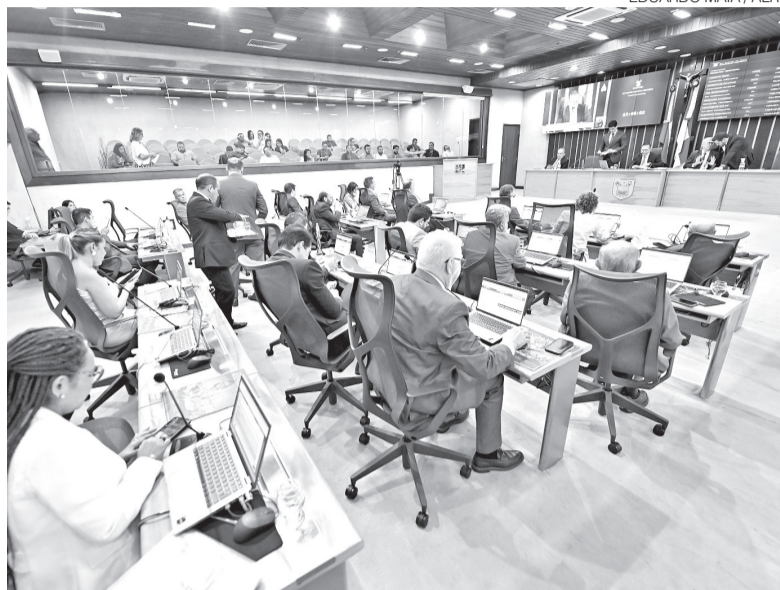
EDUARDO MAIA / ALRN

Em 2026, por ser ano de eleições gerais, a regra benefi-