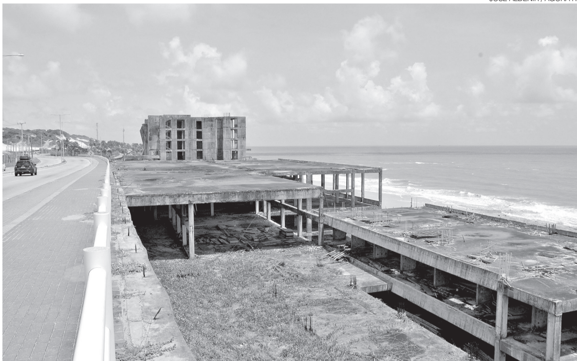
Exemplo clássico de entraves jurídicos e concessões irregulares que deixaram Natal atrás de outras capitais

Além do impacto direto no setor, a expansão da infraestrutura