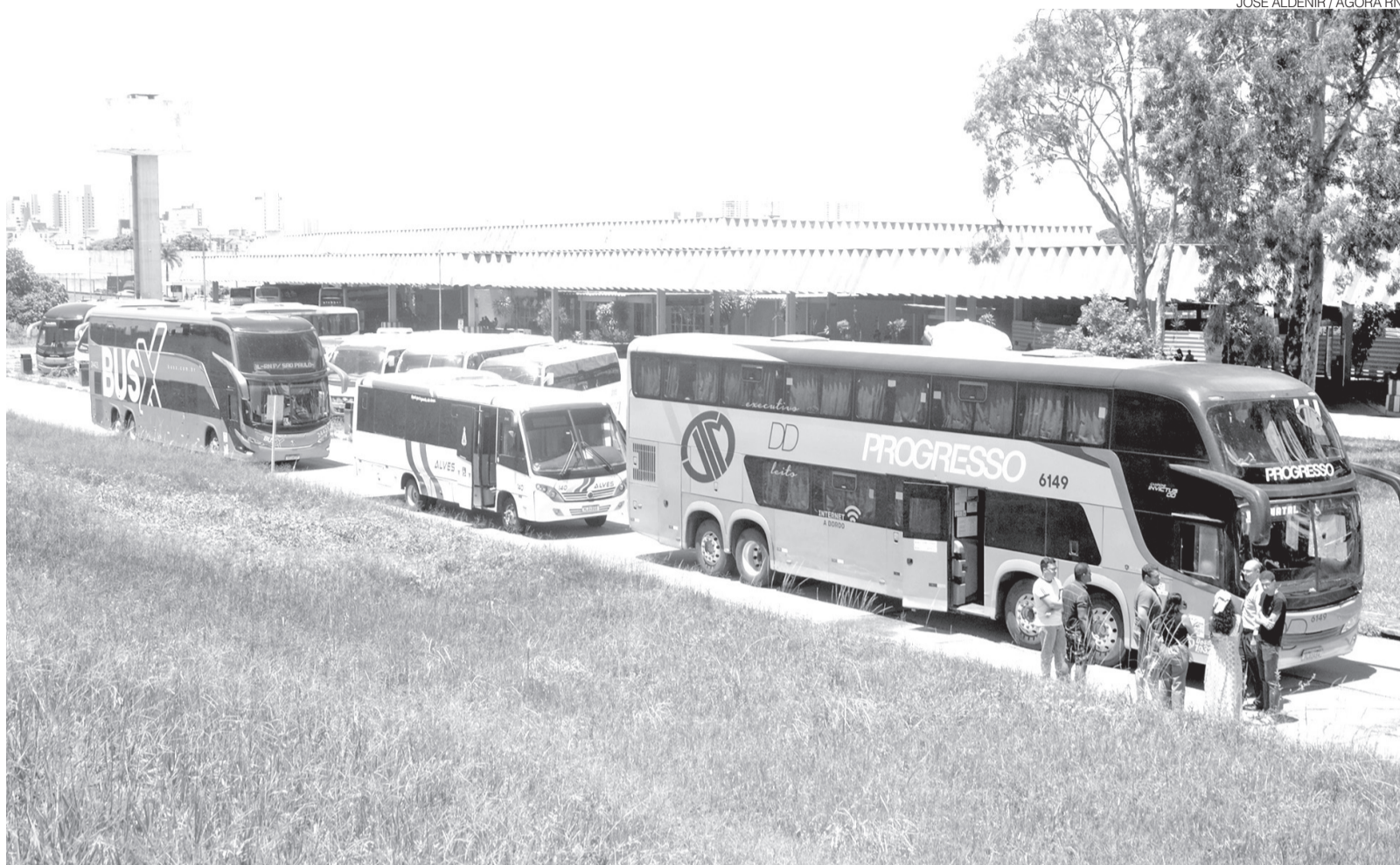
Paralisação do transporte intermunicipal no Rio Grande do Norte interrompe viagens e afeta deslocamentos entre Natal e cidades do interior

“O Estado não possui débitos referentes às gratuidades. A legislação que criou as gratuidades é omissa quanto ao modelo de compensação e isso precisa ser melhor discutido. O Governo já possui políticas de apoio ao setor e vai estudar, junto com