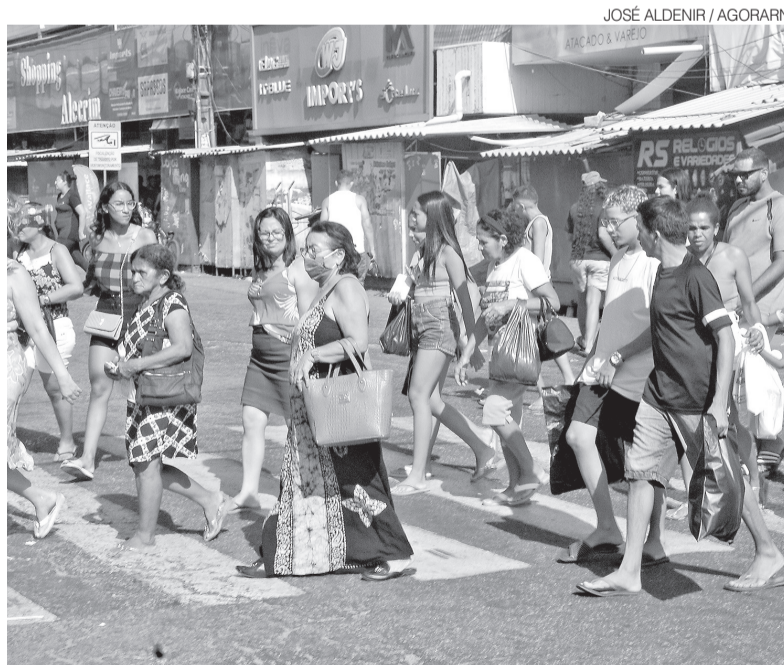
Pequenos comércios, como o do Alecrim, geram muitos empregos em Natal

Os dados indicam que os negócios de menor porte mantêm contribuição consistente para a