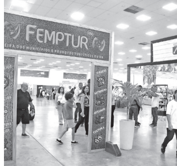
Femptur tem entrada gratuita