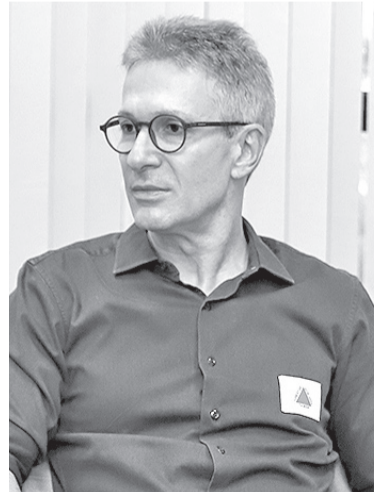
Ex-governador de Minas Romeu Zema

pessoal ao candidato, sem vínculos com grupos políticos robustos. Nesse contexto, o nome de Zema passou a ser visto por esses aliados como uma alternativa mais simples, justamente por não representar um bloco partidário amplo como o Centrão.