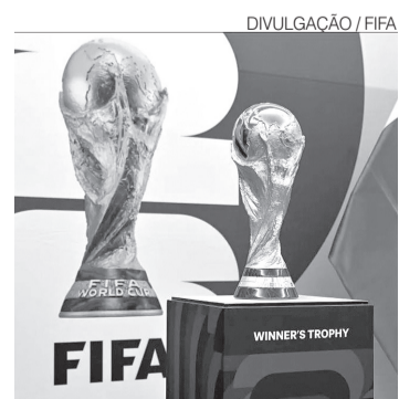
Brasil vai em busca do hexa

A sequência de compromissos marca a etapa final de ajustes da equipe brasileira para a Copa de 2026, que contará com novo formato e maior número de seleções participantes. ●