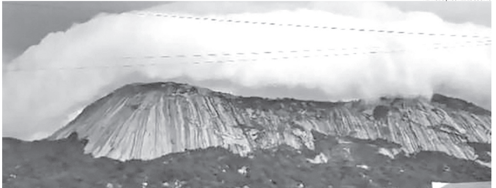
Nuvem em formato de rolo chama atenção na Serra do Lima, em Patu, fenômeno associado a condições específicas de umidade, relevo e vento no local

processo ocorre quando a umidade evaporada de uma superfície — neste caso, a encosta da serra — se eleva e encontra camadas de ar com temperaturas mais baixas. Esse encontro provoca a condensação da umidade, dando origem à nuvem.