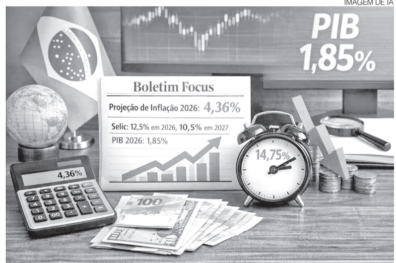
Novas previsões apontam para elevação da inflação e leve queda nos juros

O próximo encontro do Copom está marcado para os dias 28 e 29 de abril. As projeções do Focus indicam que a Selic deve encerrar 2026 em 12,5% ao ano,