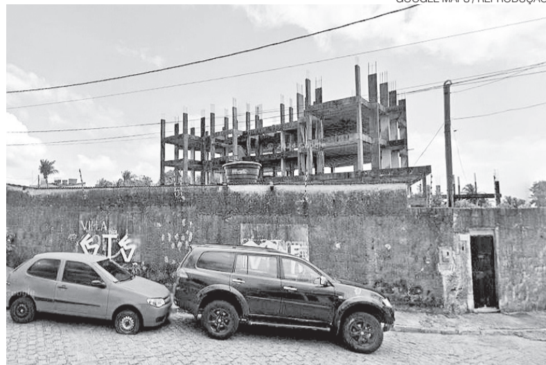
Villa Del Sol teve obras iniciadas em fevereiro de 2005 e interrompidas em outubro de 2006

O que está em debate agora em uma Ação Rescisória — protocolada pela Prefeitura em 2024, na gestão do então prefeito Álvaro Dias — é como calcular esse valor. Há um debate sobre se o valor deve ser fixado com base em projeções de vendas do empreendimento ou apenas no que