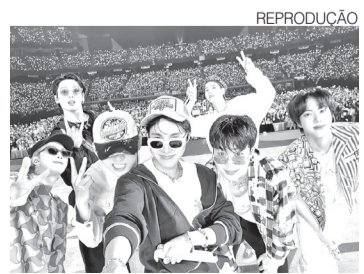
BTS faz show no País em outubro