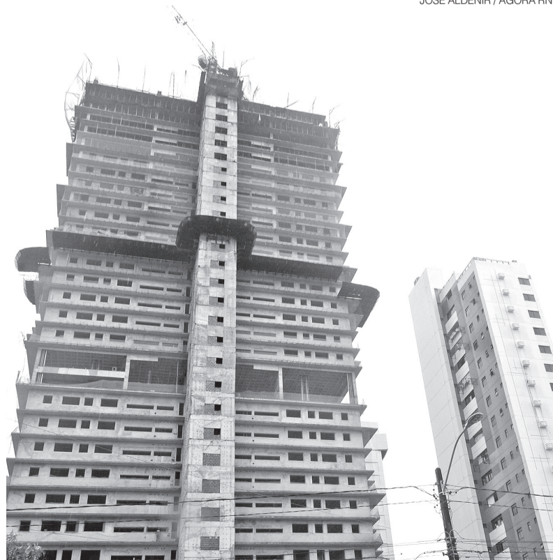
Construir no RN está ficando cada vez mais caro, segundo estudo do IBGE

O movimento indica uma retomada gradual dos custos após um início de ano mais contido, com pressão concentrada nos insumos, enquanto a mão de obra segue com menor impacto na composição final do preço. ●