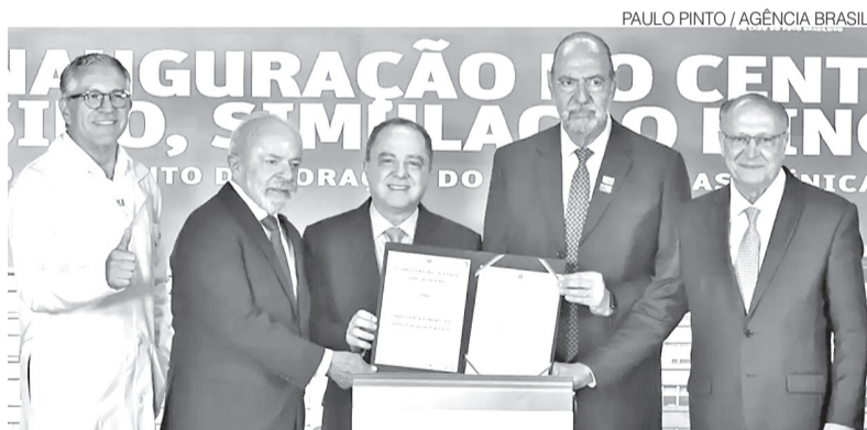
Presidente Lula (PT) anuncia nova lei para ampliar acesso a tratamentos no SUS

A sanção ocorreu durante a inauguração do Centro de Ensino, Simulação e Inovação (Cesin), no Instituto do Coração (InCor), ligado ao Hospital das Clínicas da Faculdade de Medicina da USP. O evento contou com a presença dos ministros Alexandre Padilha e Guilherme Boulos, além da primeira-dama Janja Silva e do vice-