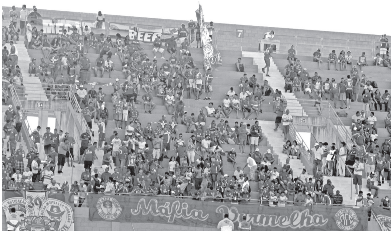
Arena América, em Parnamirim, não tem capacidade para jogos da CBF

Clube afirma ter esgotado alternativas para evitar transferência da partida; estádio em Natal enfrenta conflito com evento e exigências da CBF