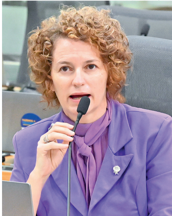
EDUARDO MAIA / ALRN

Contas do partido de 2022 foram desaprovadas, e legenda terá de efetuar devolução de R$ 246 mil ao erário.