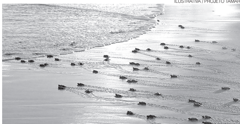
Trecho entre Ponta Negra e Via Costeira é uma área de desova de tartarugas

Das cinco espécies de tartarugas marinhas registradas no Brasil, três utilizam esse trecho para de-