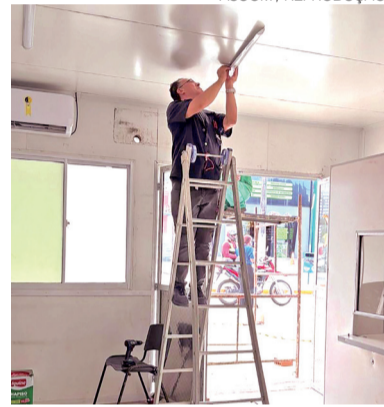
Funcionários abrem novo acesso na UPA