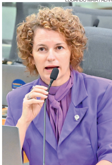
Deputada estadual Isolda Dantas

Os dados mais recentes apontam que o Rio Grande do Nor-