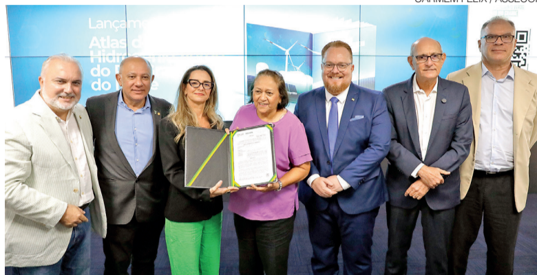
Evento também marcou concessão da 1ª licença do RN para produção de H2V

“O mercado brasileiro é, num primeiro momento, mais atraente do que o de exportação. Embora o país tenha uma das ma-