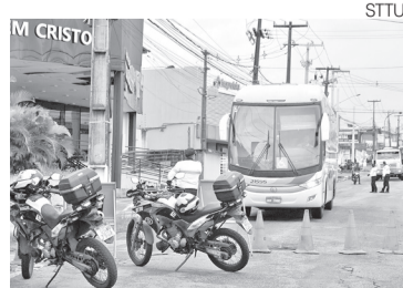
Agentes da STTU orientam trânsito