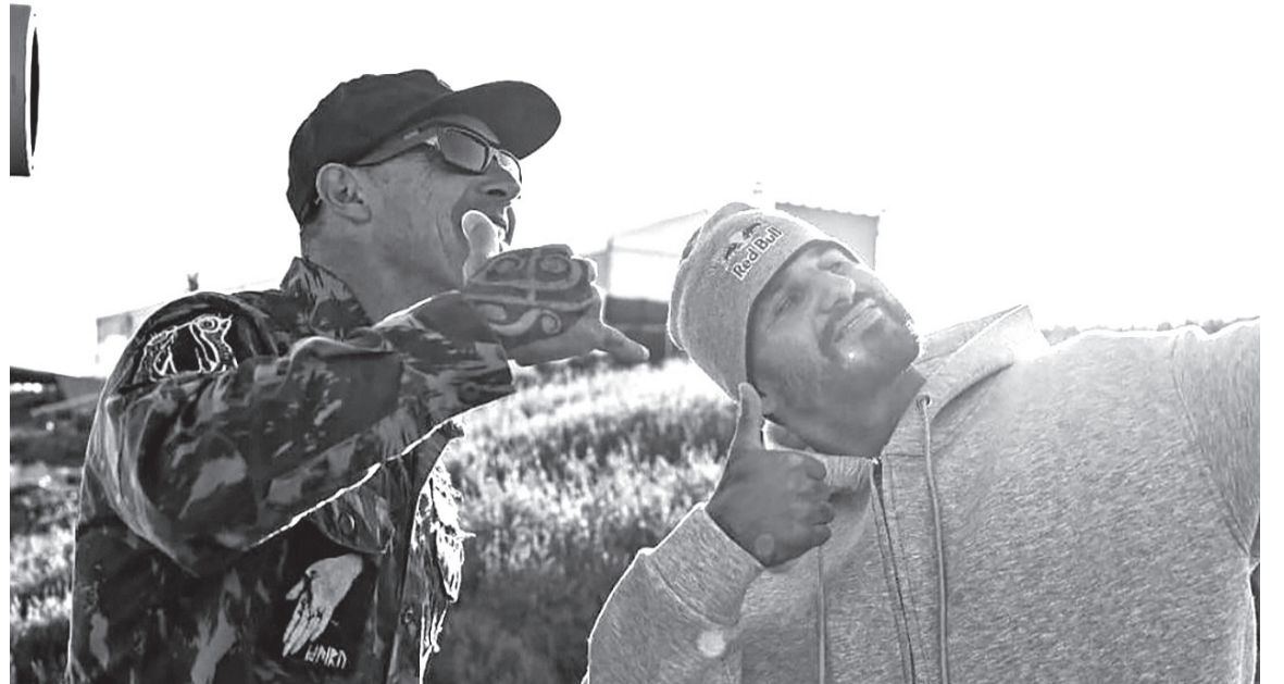
Objetivo da parceria é recuperar protagonismo no circuito mundial de surf após o modesto 4º lugar ano passado