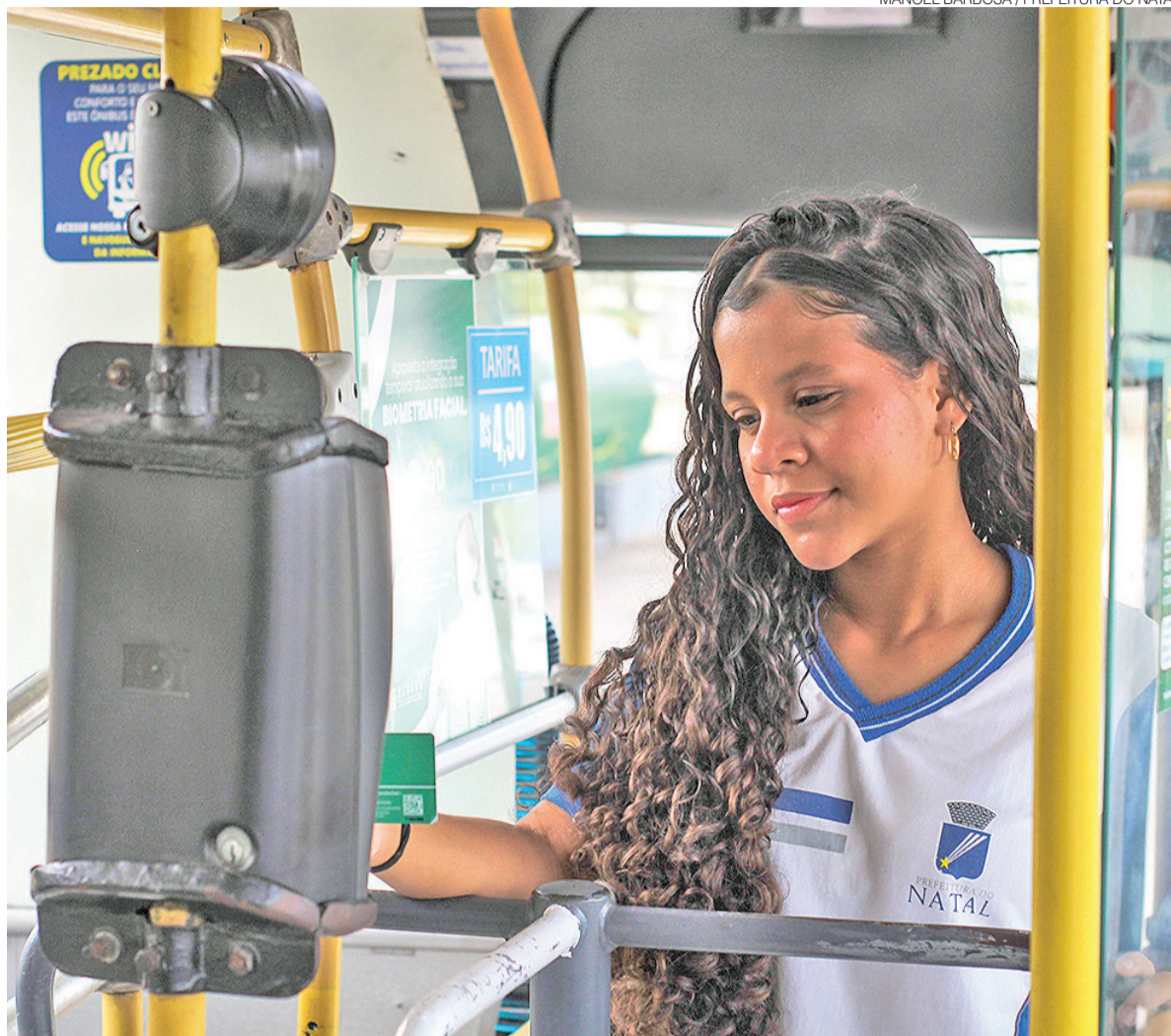
Estudantes das redes municipal e estadual terão passe livre no sistema de transporte, mediante frequência mínima de 75%

Além disso, o projeto mantém a meia-passagem para estudantes de outras instituições públicas e privadas, incluindo ensino superior, cursos técnicos e de idiomas, fortalecendo a perma-