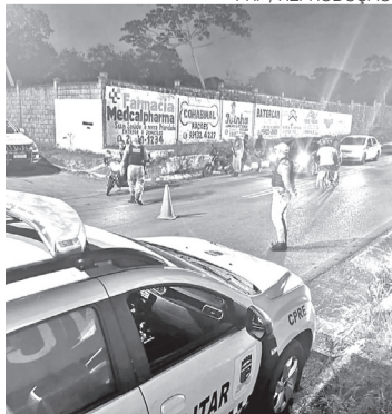
PRF deu flagrante em mulher