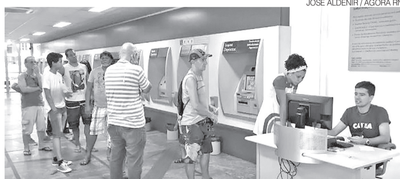
Governo quer mais transparência para os empréstimos consignados

das operações. A medida foi estabelecida pela Portaria MGI nº 984/2026, publicada pelo Ministério da Gestão e da Inovação em Serviços Públicos, e busca coibir fraudes, práticas abusivas e o superendividamento. Entre as principais mudanças, está a limitação