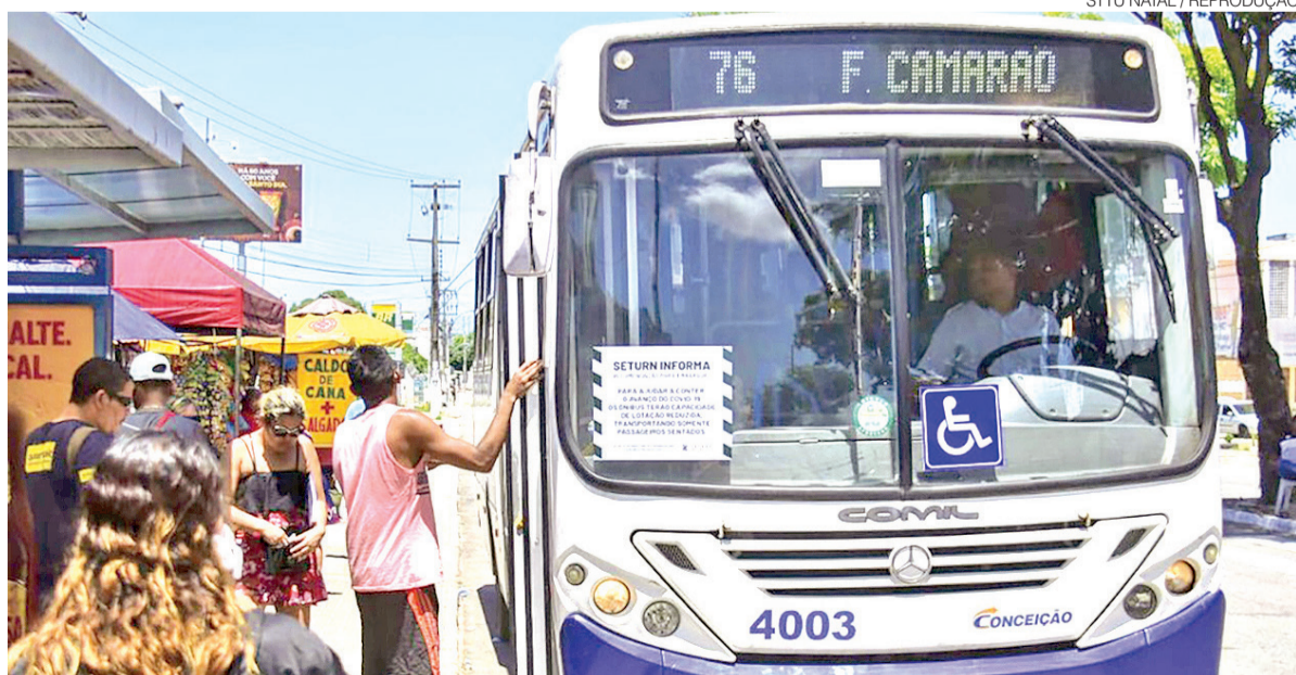
Entre outras medidas, linhas para o Alecrim e o Centro Histórico serão gratuitas no primeiro sábado após 5º dia útil

- Redução de 50% na tarifa social em feriados; - Gratuidade em dias de eleição e realização do Enem; - Gratuidade para pessoas com deficiência e com doenças crônicas, mediante critérios de renda e comprovação médica, podendo incluir acompanhante quando necessário; - Possibilidade de concessão de benefícios tarifários em datas e eventos específicos. ●