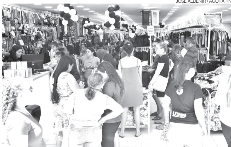
Setores de comércio e serviços vão ‘segurar a onda’ na economia do RN

As estimativas setoriais reforçam o cenário de instabilidade. Enquanto o Produto Interno Bru-