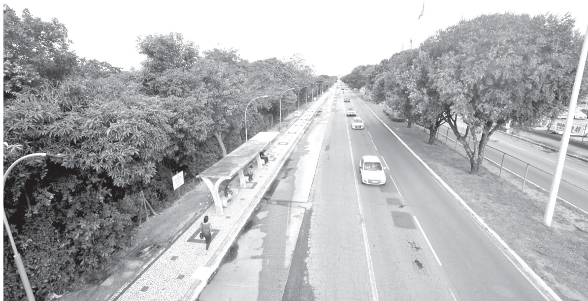
Prefeitura planeja implantar parque com lazer, esporte e educação ambiental na marginal da Av. Roberto Freire