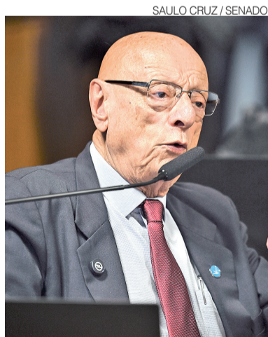
Senador Esperidião Amin (PP-SC)

A ofensiva é liderada principalmente por parlamentares da oposição que apoiaram o pare-