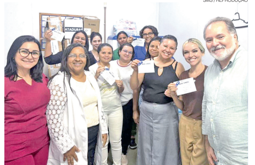
Ao todo, processo seletivo contempla a contratação de mais de 1 mil profissionais

felizes com a chegada dos novos servidores. Já estamos recebendo inicialmente enfermeiros e técnicos e, com isso, teremos principalmente uma melhora na organização e segurança do atendimento, pois estaremos compondo o quadro de lotação de servidores. Acompanharemos de perto cada um, para facilitar a adaptação, aumentando assim a confiança de quem está chegando, como também dos colegas que já estão na unidade.”