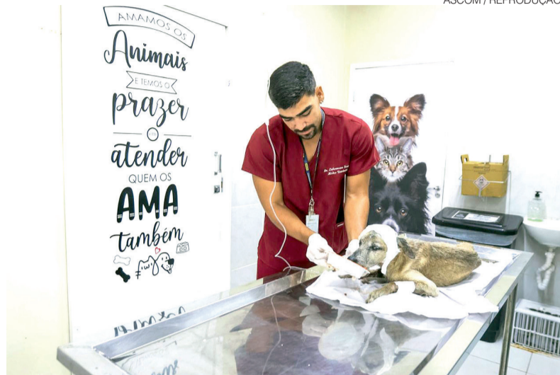
Centro de Zoonoses passou a incluir suporte clínico além das ações tradicionais

Para a gestão, a redução no número de casos ao longo dos