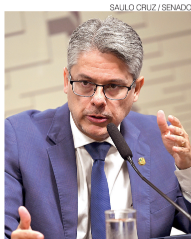
Senador Alessandro Vieira (MDB-SE)

Nesse contexto, o presidente da Comissão de Constituição e Justiça (CCJ), Otto Alencar (PSD-BA), designou o senador Esperidião Amin (PP-SC) como relator de uma Proposta de Emenda à Constituição (PEC) que torna