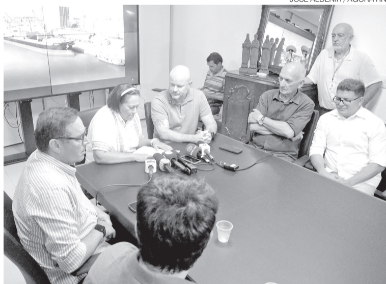
Governadora, secretários e diretores da Codern em reunião sobre dragagem

ção, a expectativa é ampliar a frequência de embarques e reduzir a dependência de outros portos da região, como os do Ceará. A infraestrutura também abre espaço para diversificação de cargas, incluindo minério e exportação de gado vivo.