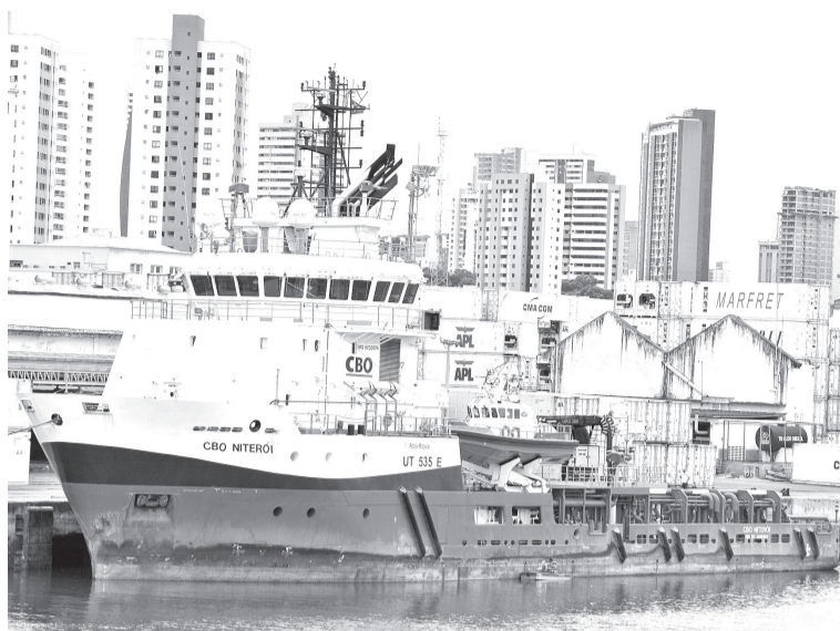
Profundidade será de 12 metros em um percurso de 7,2 km ou 4 milhas

Entre os setores mais beneficiados está o agronegócio, especialmente a fruticultura, tradicional base das exportações do estado. Com a nova configura-