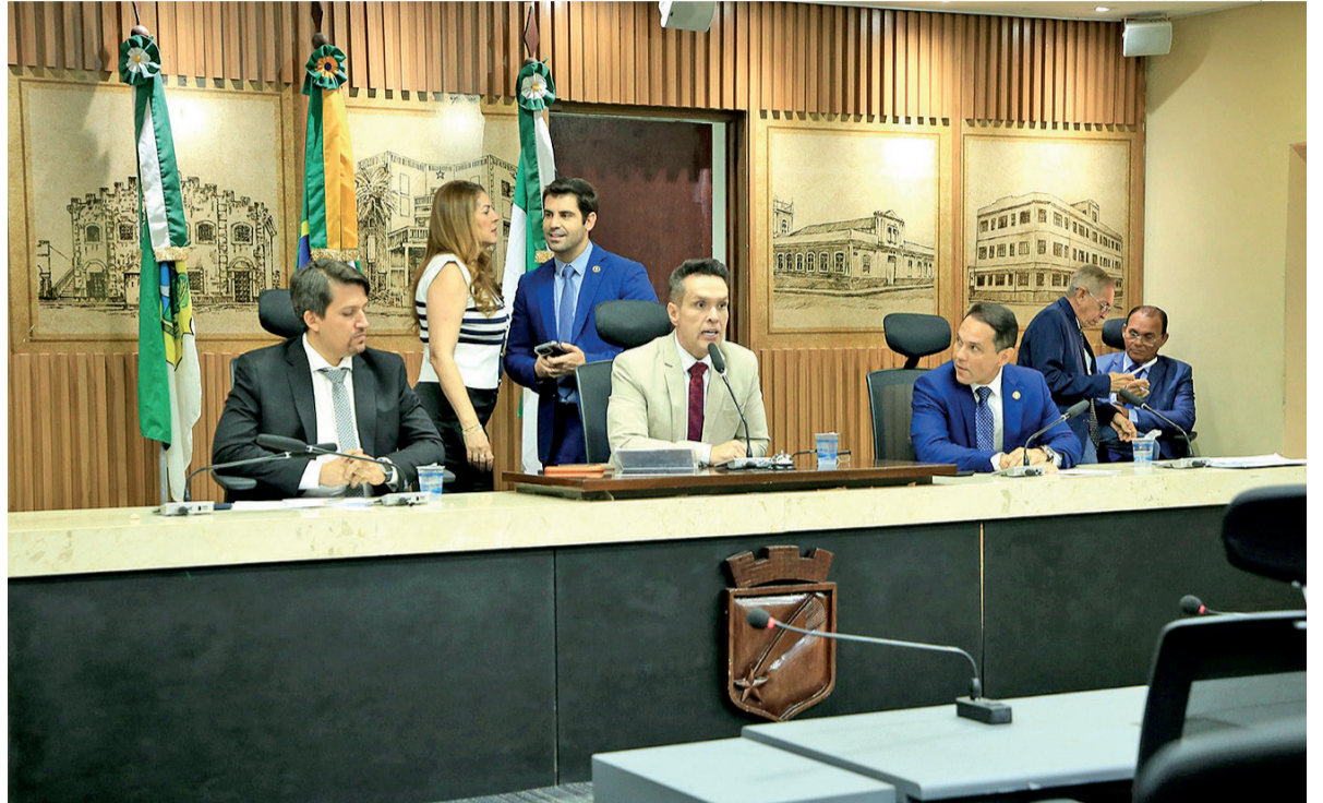
Pacote de projetos aprovados inclui veículos adaptados, cabeamento subterrâneo e novos investimentos sociais