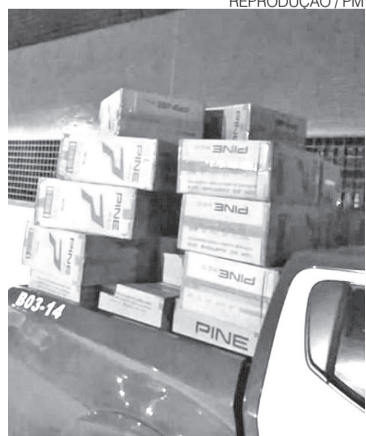
Quase dois mil pacotes de cigarros

Segundo dados da Polícia Federal, em 2024, mais de R$ 7 milhões foram desviados por organizações envolvidas com o contrabando de cigarros. ●