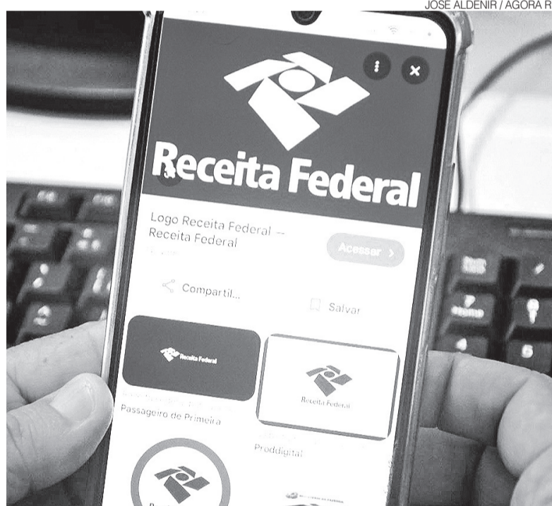
Sistema "Meu Imposto de Renda" também está disponível via aplicativo

Estão obrigados a declarar contribuintes que receberam rendimentos tributáveis acima de R$ 35.584 no ano passado,