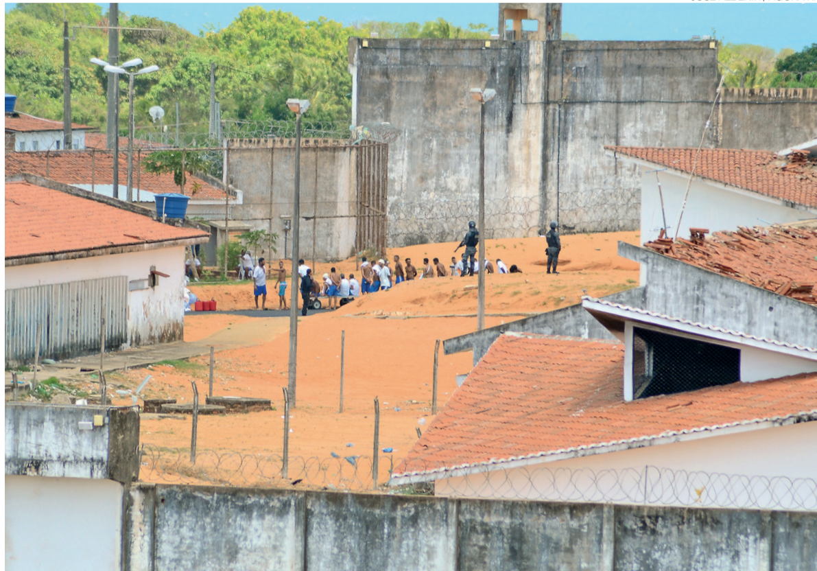
Massacre de Alcaçuz, em 2017, é citado pelo MPF como exemplo de falhas no sistema prisional do Rio Grande do Norte

de Combate à Tortura e o Mecanismo Nacional de Prevenção e Combate à Tortura (MNPCT) tenham sido instituídos por lei em 2013, o Rio Grande do Norte ainda não conta, mais de uma década depois, com um grupo próprio de peritos para realizar inspeções regulares e independentes.