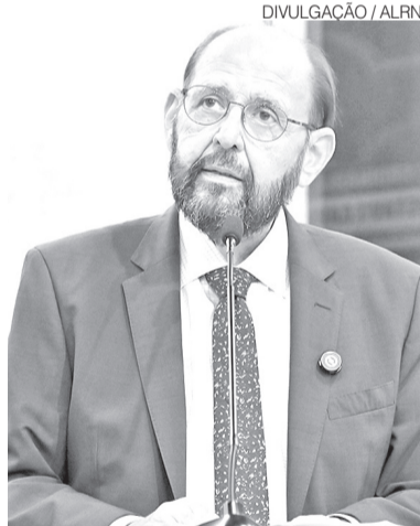
Deputado Gustavo Carvalho (PL)

Segundo o parlamentar, produtores rurais e empresários de diversos setores têm aplicado recursos próprios, muitas vezes elevados, na instalação de sistemas de energia solar com o objetivo de reduzir custos e contribuir com a transição energética. No entanto, relatou que a prática tem se transformado em prejuízo. “Energia efetivamente gerada não está sendo registrada, créditos legítimos simplesmente desaparecem,