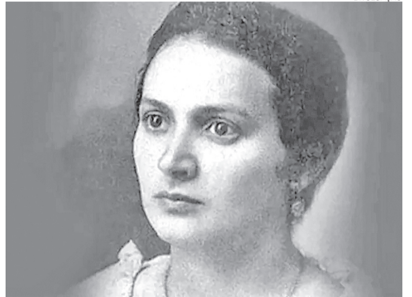
Alzira Soriano foi uma figura histórica da política, sendo a 1ª mulher eleita prefeita

Educação. A iniciativa inclui ainda concurso de roteiro para curtas-metragens e curso de roteiro para documentários.