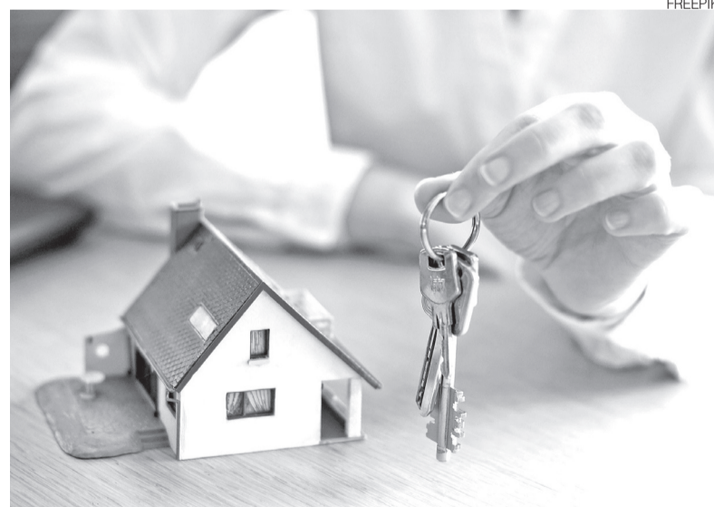
Construtoras têm recorrido à pandemia e crise de insumos para explicar atrasos

Especialistas em direito civil alertam para a complexidade desses contratos e para a necessidade de análise técnica antes de qualquer acordo. Propostas apresentadas pelas construtoras, muitas vezes, ficam abaixo do que é reconhecido pela Justiça, o que pode levar o consumidor a prejuízos relevantes caso aceite