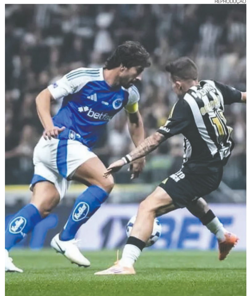
No último confronto, quem se deu bem foi o Cruzeiro, com o título mineiro

Com objetivos distintos, mas igualmente pressionados por desempenho, Cruzeiro e Atlético Mineiro entram em campo em mais um capítulo de uma das rivalidades mais intensas do futebol brasileiro, em duelo que pode influenciar os rumos das equipes na temporada. ●