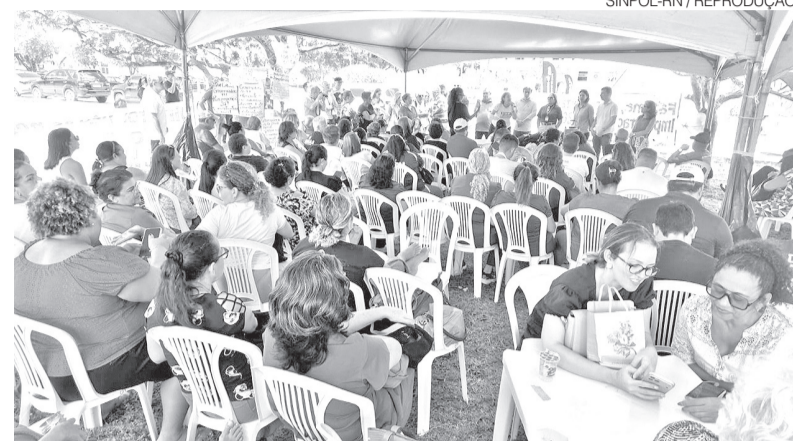
Servidores do Estado fizeram ato em frente à Governadoria nesta terça-feira

Em nota, o Executivo afirmou que a medida “considera o atual cenário fiscal, impactado por frustração de receitas e oscilações na arrecadação, que limitam o pagamento integral imediato”. O governo também destacou que a decisão foi apresentada pelo Comitê Gestor aos sindicatos e que a política salarial permanente busca conciliar a valorização dos servidores com o equilíbrio das contas públicas.