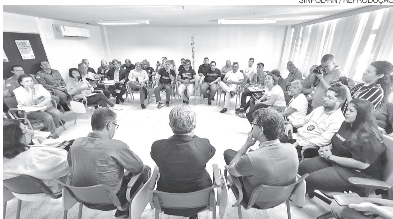
Reunião no Centro Administrativo entre representantes do governo e sindicalistas

vembro, os servidores terão um reajuste total de 4,97% nos contracheques — somando o índice regular com a fração do retroativo. Em dezembro, o percentual volta ao patamar de 4,26%.