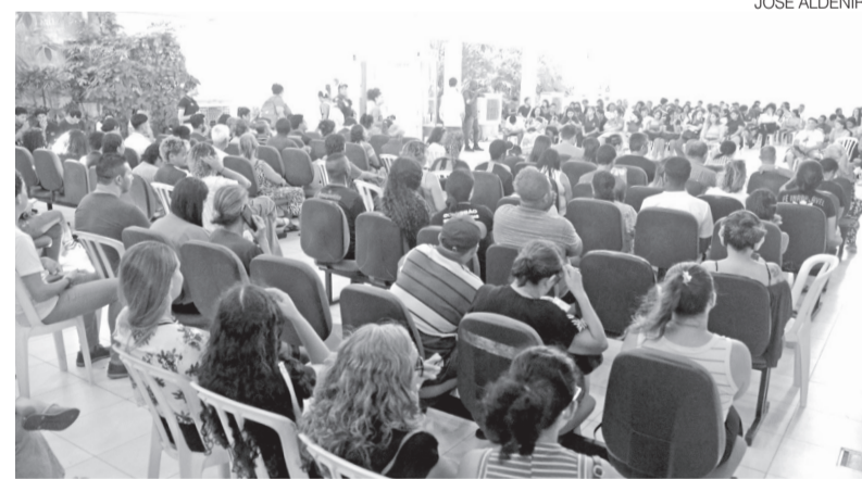
Eleitores encaram longa espera no prédio das Zonas Eleitorais, em Natal

A Justiça Eleitoral ressalta, porém, que grande parte dos serviços pode ser resolvida de forma online, por meio do portal da Tri-