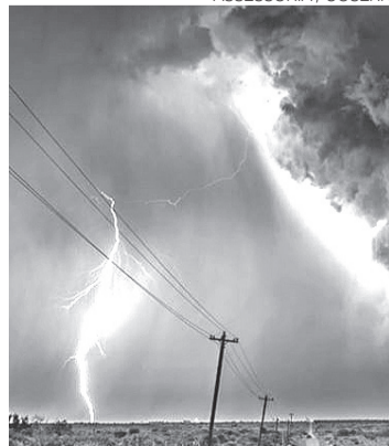
Incidência de raios aumenta no RN