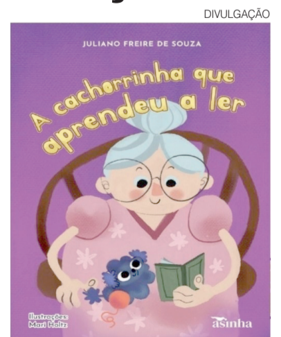
“A cachorrinha que aprendeu a ler”