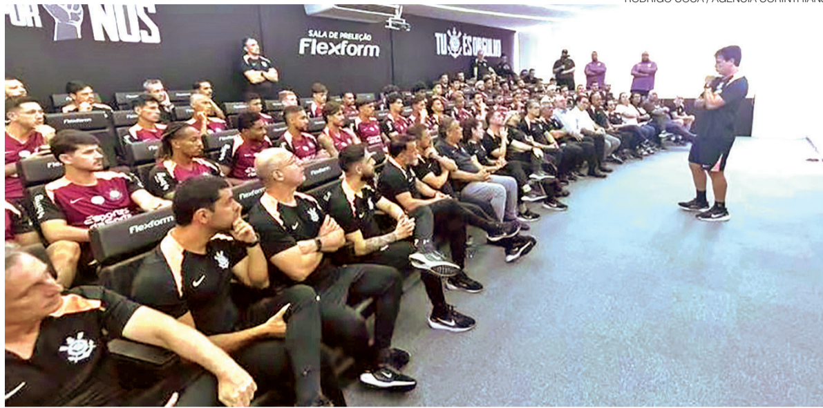
Técnico Fernando Diniz em palestra com o elenco corinthiano durante período de preparação para a partida de hoje

Líder isolado do Grupo E, o time brasileiro soma três vitórias em três jogos, com seis gols marcados e nenhum sofrido, desempenho que o coloca entre os mais consistentes da competição até aqui. Sob comando de Fernando Diniz, o Corinthians chega ao