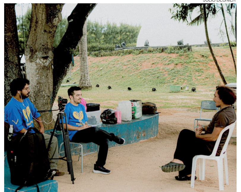
Produção reúne depoimentos de moradores e valoriza a memória cultural

Ela também afirma que espera que a iniciativa inspire outras cidades. “Se o projeto for bem recebido, a expectativa é que outras