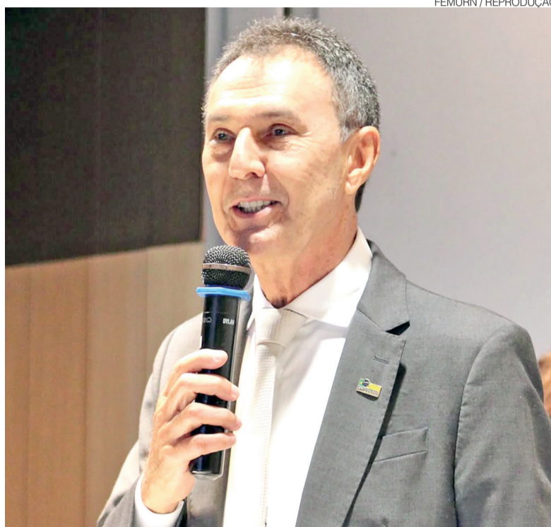
Presidente da Femurn diz que evento "é momento de fortalecimento do municipalismo"

A preocupação com a sustentabilidade financeira das cidades é um dos pontos recorrentes nas falas do presidente da Femurn. Ele destacou que a maioria dos municípios do Estado depende quase exclusivamente de transferências constitucionais e enfrenta dificuldades crescentes para manter serviços básicos. "Os municípios estão passando por dificuldades. A cada dia mais diminuí as arrecadações, e a maioria vive exclusivamente de repasses. Isso torna a recupe-