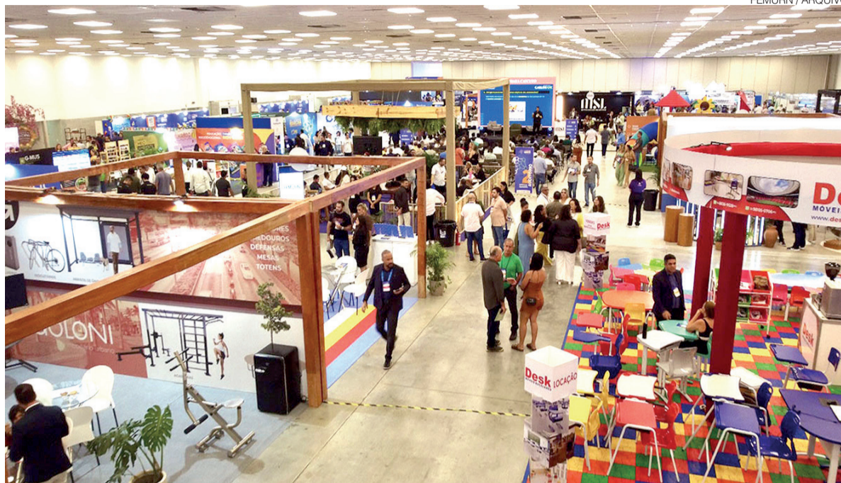
Estandes vão reunir gestores e instituições em ambiente de troca de experiências e apresentação de soluções para a administração pública

A estrutura do evento foi ampliada para comportar o cresci-