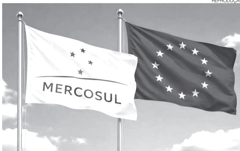
Acordo com a União Europeia vai destravar pauta exportadora do Estado

“Nós temos que citar aqui, por exemplo, a questão da pesca,