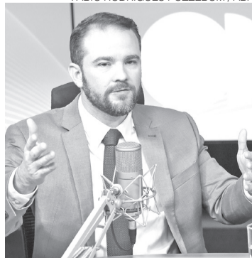
Ministro Dario Durigan (Fazenda)