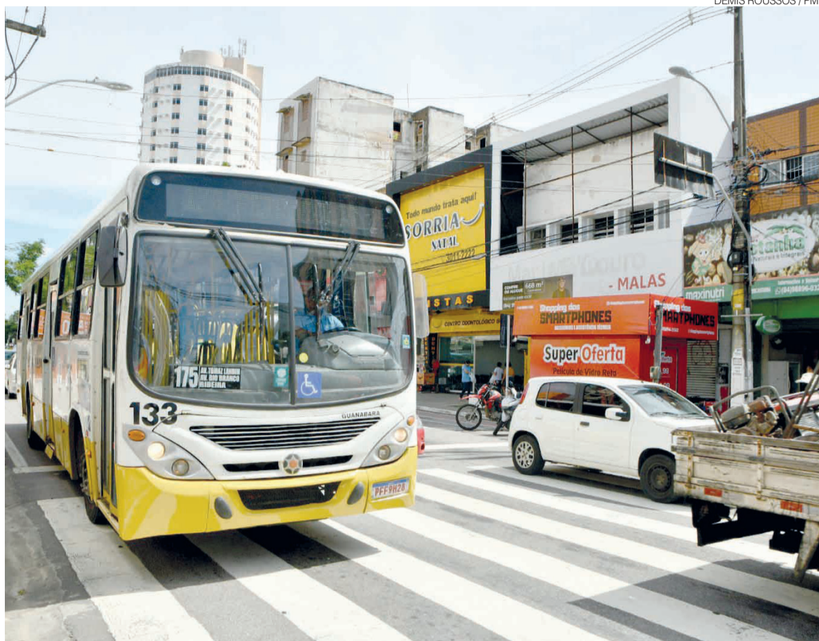
Prefeitura inicia neste sábado sistema de cashback passageiros que se deslocarem ao Alecrim e à Cidade Alta

“Estamos integrando o transporte público à rotina de consumo da população, criando um incentivo direto para que as pessoas circulem mais e utili-