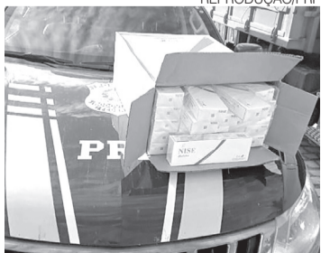
PRF e PM deram prejuízo no crime