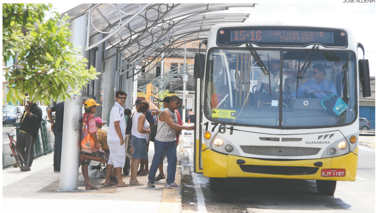
STTU ampliou em 24% a frota de ônibus aos domingos para atender crescimento da demanda após início da tarifa zero

A ideia, segundo a pasta de mobilidade urbana, é assegurar o deslocamento para os principais polos geradores de demanda aos domingos. ●