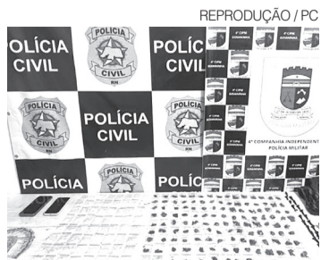
PC corta ponto de drogas em Pipa

A Operação Liberdade vem sendo utilizada pelas forças de segurança do Estado em ações voltadas à repressão do crime organizado em municípios turísticos e áreas urbanas consideradas estratégicas para o tráfico de entorpecentes. ●