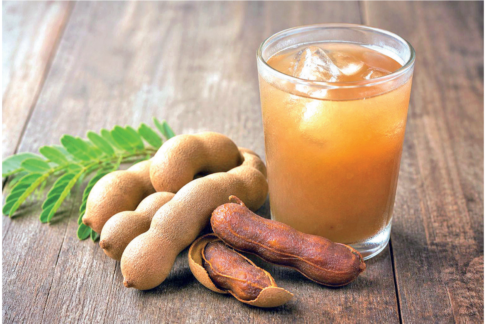
Pesquisa da UFRN identificou composto natural da semente de tamarindo com potencial para auxiliar no controle da glicemia em pessoas com diabetes

“Esses resultados revelam o potencial funcional de compostos naturais aplicados à nutrição e à saúde”, afirma a professora