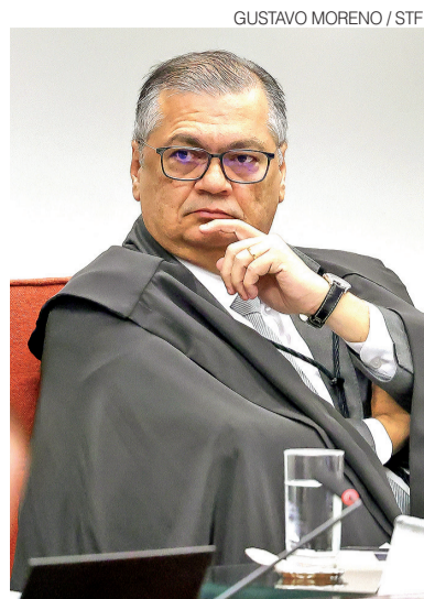
Ministro do Supremo Flávio Dino

Na prática, porém, a sistemática ainda permite remunerações significativamente su-