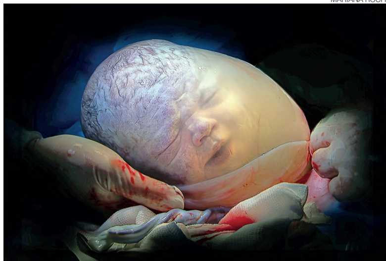
Fotógrafas especializadas acompanham gestantes durante os nascimentos

“Para captar todos aqueles instantes que vão emocionar, é necessário ter um olhar muito preciso e apurado do que registrar, sem fugir da ética da conduta médica nem da conduta do hospital, e entregar um trabalho 100% fidedigno àquele