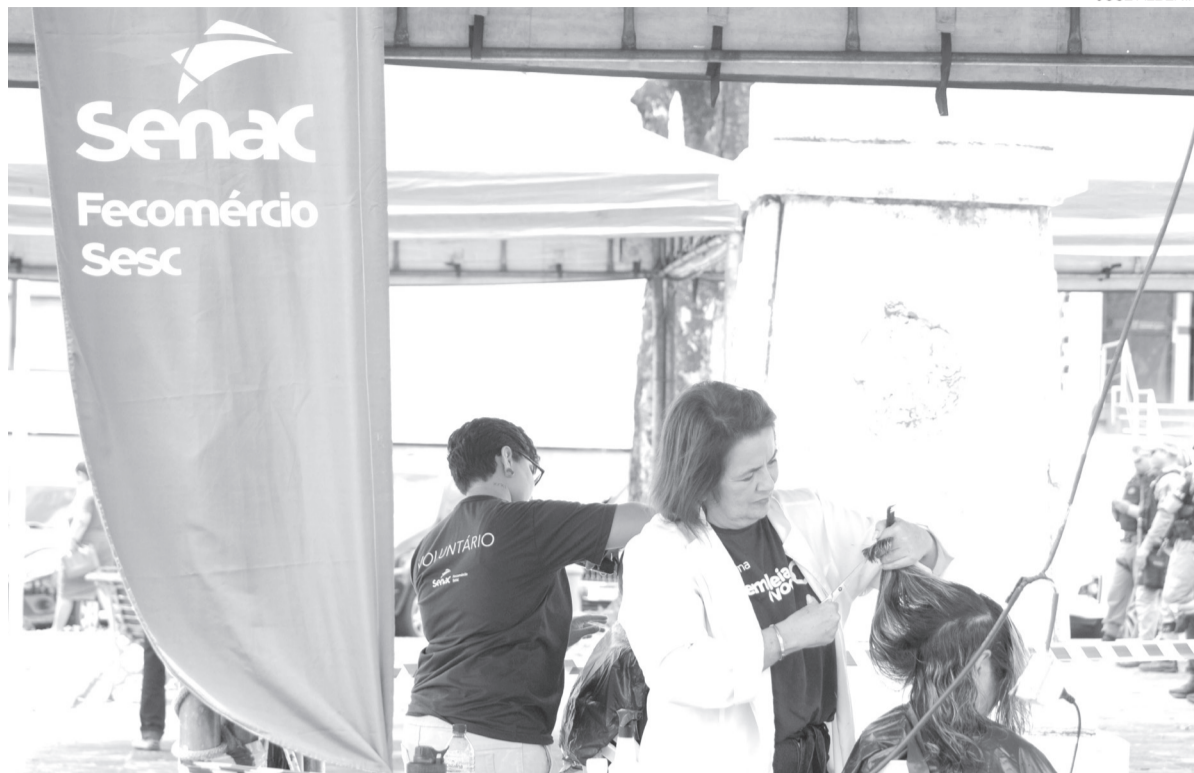
Cursos na área de estética, como de cabeleireiro, barbeiro e manicure também fazem parte da lista da Semana S no RN