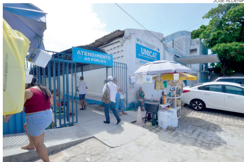
Apenas 60% dos remédios da Unicat estão disponíveis na rede pública

“Também vamos exigir transparência, para que a popula-