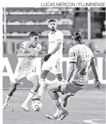
Bernal em jogo contra o Bolívar

O Fluminense chega para a rodada após empate diante do Independiente Rivadavia, na última quarta-feira 6, pela Copa Libertadores da América. No Campeonato Brasileiro, a equipe ocupa a terceira colocação, com 26 pontos conquistados. ●