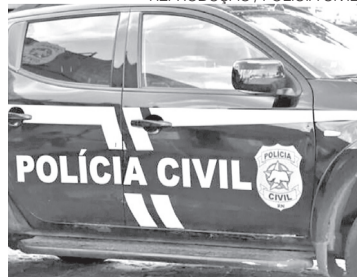
PC prendeu assaltante da praia