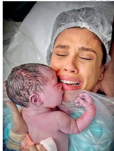
Fotografia de parto exige preparo