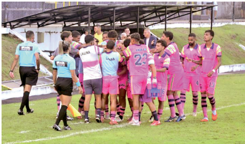
Equipe do Laguna está em situação mais difícil e precisa vencer urgentemente

O ABC visita o Central (PE), em Caruaru, no interior pernambucano, no domingo 10, às 16h, em um momento de alta