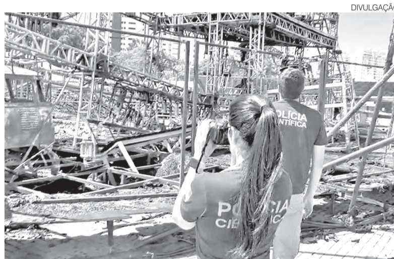
Equipes da Polícia Científica realizam perícia na estrutura atingida pelo fogo

Em nota, a Casa de Apostas Arena das Dunas confirmou que não houve feridos. “Assim que acionado, o Corpo de Bombeiros Militar chegou rapidamente ao local e atuou de forma eficiente no controle da ocorrência, evi-