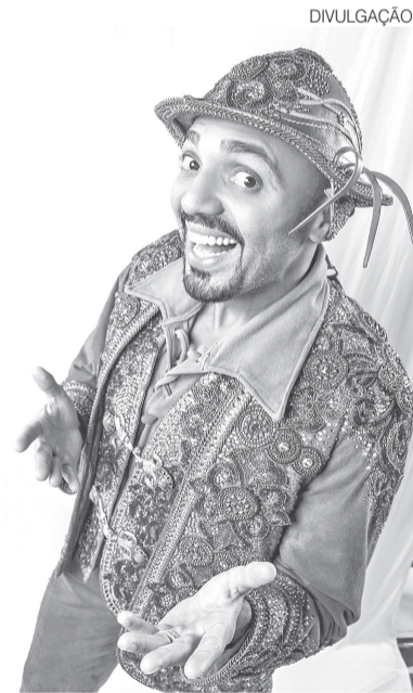
Tirullipa lamentou: “picadeiro em luto”

rência foi encerrada após aproximadamente 60 minutos entre o combate às chamas e o trabalho de rescaldo.