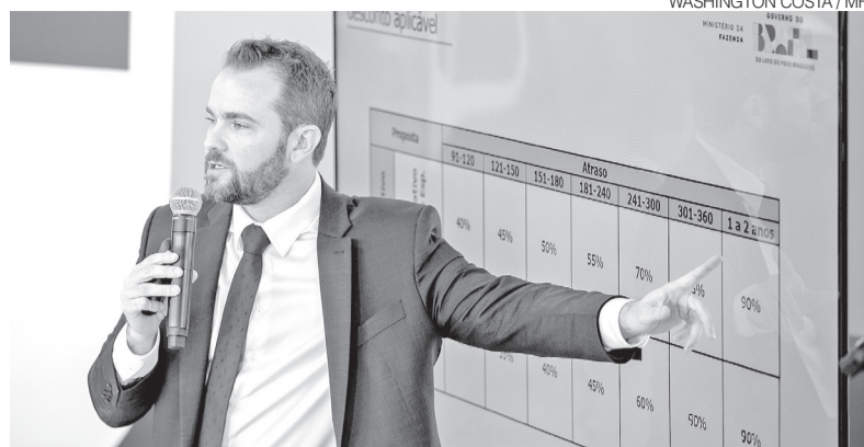
Ministro da Fazenda, Dario Durigan, durante apresentação das regras do Desenrola

A primeira edição do Desenrola foi lançada em julho de 2023, quando o Ministério da Fazenda era comandado por Fernando Haddad. Na ocasião, a Federação Brasileira de Bancos informou que, em cerca de duas semanas, R$ 2,5 bilhões em dívidas haviam sido renegociados pelas instituições financeiras. ●