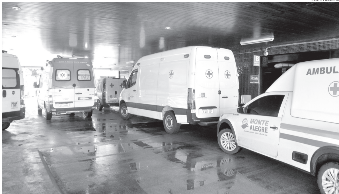
Elevador do Clóvis Sarinho voltou a funcionar após quase uma semana de falha no Hospital Walfredo Gurgel

Em vídeo divulgado nas redes sociais do sindicato, a dire-