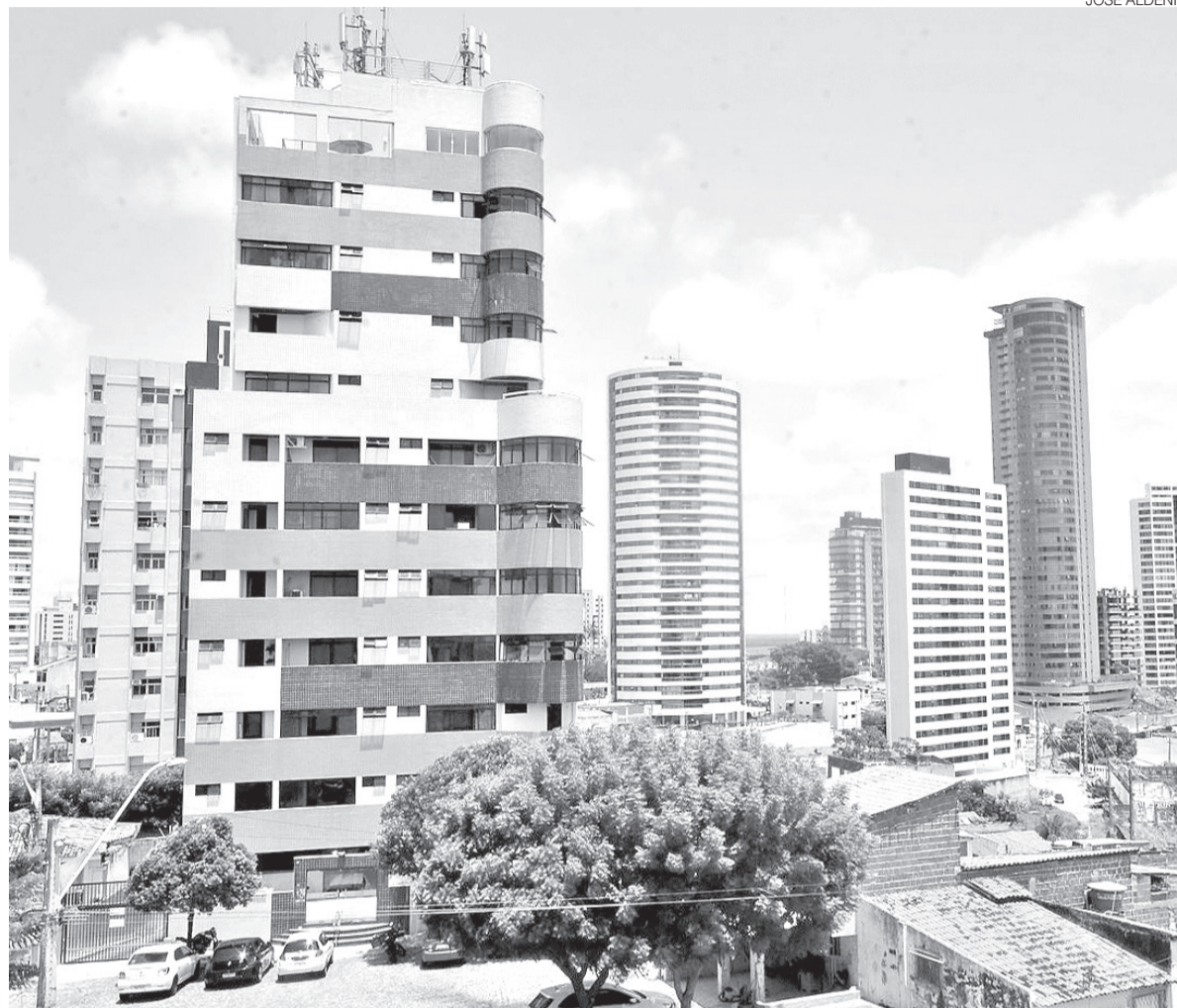
Cada tipo de aluguel tem uma forma diferente de declarar, para a Receita Federal, quando é pessoa física ou jurídica

Mesmo quem deixou de preencher o Carnê-Leão ao longo