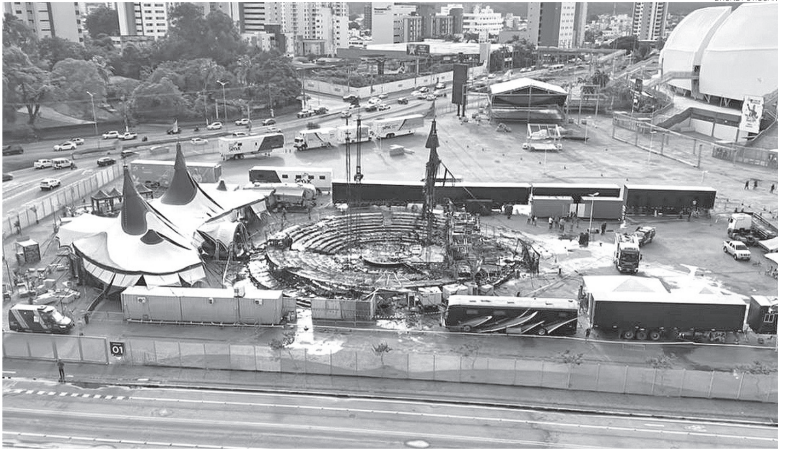
Incêndio consumiu parte da estrutura principal do Circo do Tirú na madrugada desta segunda-feira 11; Bombeiros atuaram no combate às chamas em Natal

Após vistoria, foi constatado que os equipamentos estavam desligados e não ofereciam riscos adicionais à operação. Segundo o Corpo de Bombeiros, a ocor-