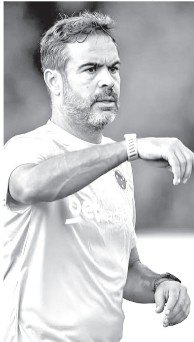
Técnico Artur Jorge terá time completo

vio; Fagner (Kauã Moraes), Fabrício Bruno, Jonathan Jesus e Kaiki; Lucas Romero, Gerson (Lucas Silva) e Matheus Pereira; Christian, Arroyo e Kaio Jorge.