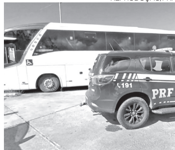
Onibus foi retirado de circulação