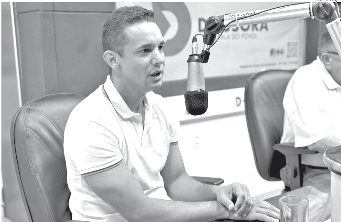
Ex-prefeito de Mossoró registrou que mais de 80% dos que atuam nas escolas públicas do Estado foram formados pela Uern

“Para mim, a Uern é negociável, para que ela continue sendo pública e gratuita para o cidadão”, declarou, citando que o gasto