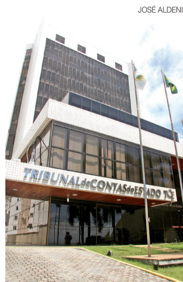
Documento do TCE será enviado a órgãos

A fiscalização identificou ainda dificuldades na integração tecnológica entre os sistemas utilizados no estado. Enquanto parte das ocorrências é gerenciada pelo Sinesp CAD, Natal e Mossoró operam o sistema próprio CAD/RN, que não possui integração nativa com a plataforma nacional.