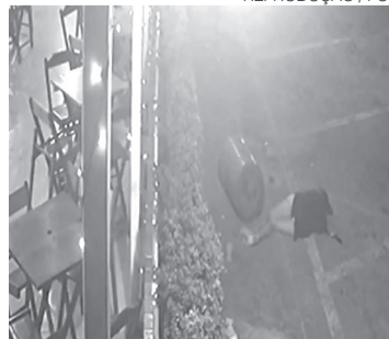
Centenas de disparos foram feitos