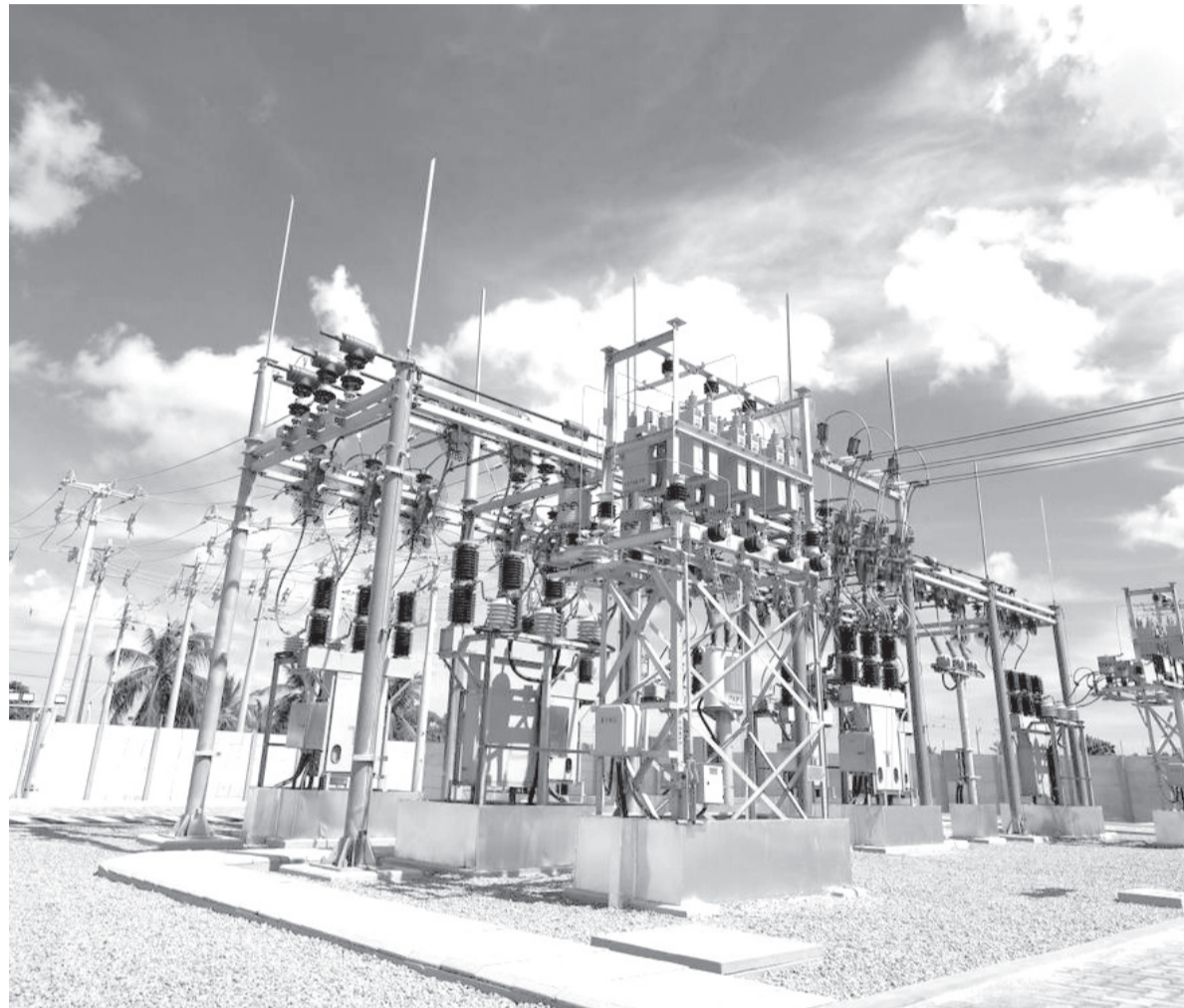
Entre as principais obras, estão a construção 10 novas subestações de energia e ampliação de outras 16 por todo RN

Do total previsto, 37,36% serão destinados à expansão da rede elétrica, enquanto 26,43% irão para projetos de modernização e digitalização da operação. Outros 36,21% serão aplicados em ações de combate a perdas e fortalecimento da infraestrutura de suporte, incluindo tecnologia da informação, sistemas operacionais