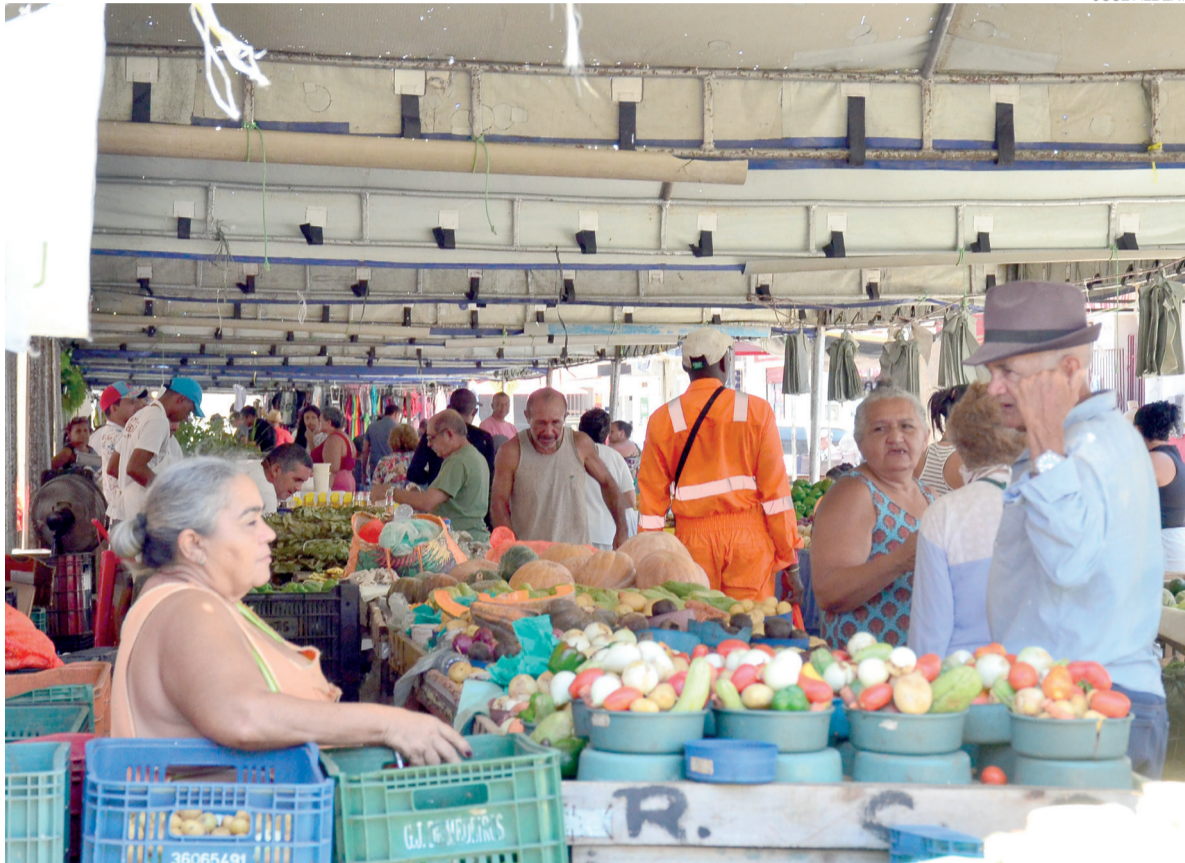
Objetivo é atualizar dados das 18 feiras livres existentes na capital potiguar e avançar em melhorias estruturais

“Nós iniciaremos a partir da segunda-feira este levantamento, que tem como objetivo nós termos o retrato das atuais feiras de Natal e dos próprios feirantes. O último levantamento que foi feito se deu em 2020. Ou seja, seis anos atrás. Ele já está desatualizado. De lá para cá houve pandemia, por exemplo, que mudou a realidade das feiras e, ao mesmo tempo, nós temos a pretensão de trazer avanços para as feiras de Natal”, afirmou, em entrevista à TV Band.