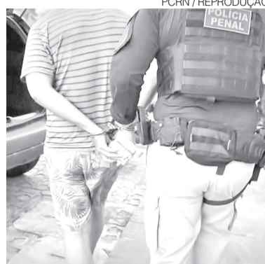
Ação foi realizada nesta terça-feira

De acordo com as investigações, o grupo instalava dispositivos adulterados em caixas eletrônicas para reter cartões dos clientes. Em seguida, os criminosos se aproximavam das vítimas oferecendo ajuda e trocavam os cartões sem