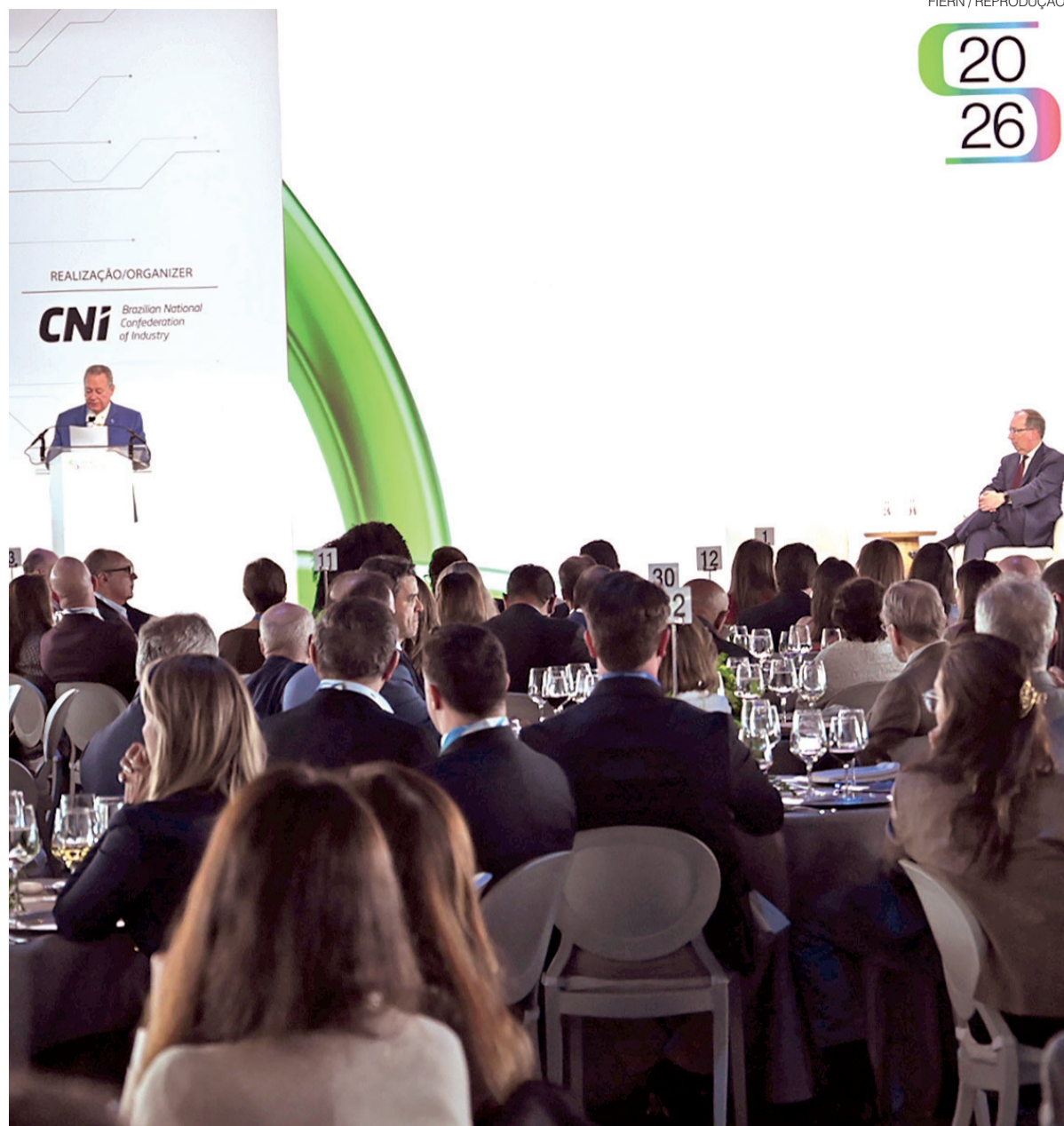
Durante a Brazilian Week, empresários, investidores e autoridades do Brasil e dos EUA participaram do Brazil-U.S. Industry Day