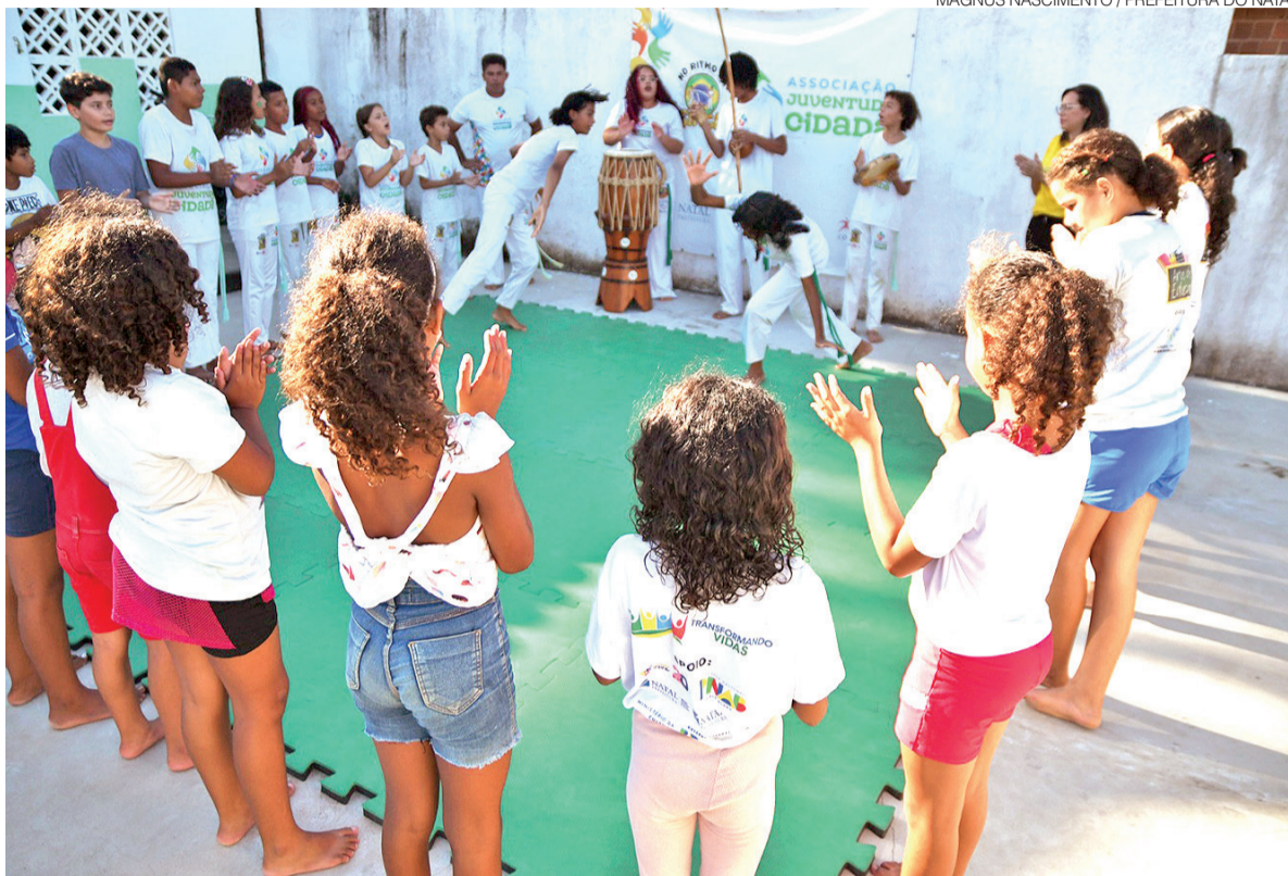
Recursos arrecadados em declaração do IR ajudam instituições a manter atividades educativas, culturais, esportivas e de convivência

Na prática, os recursos ajudam instituições a manter atividades educativas, culturais, esportivas e de convivência, além de fortalecer ações de acolhimento e proteção social. São iniciativas que fazem diferença no cotidiano de crianças, adoles-