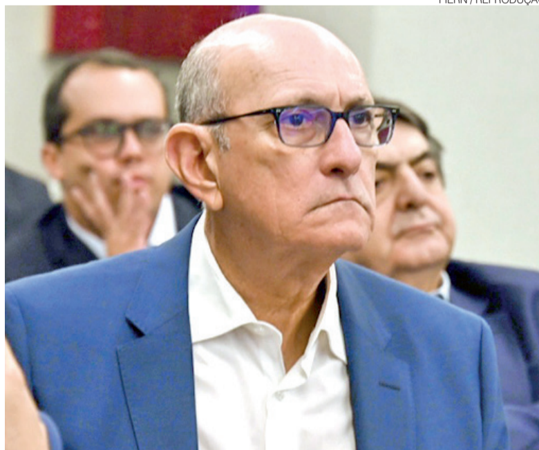
Presidente da FIERN diz que parcerias podem abrir novos mercados para o Brasil