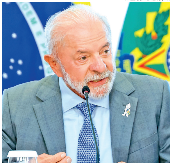
Presidente Lula tem vantagem sobre Flávio Bolsonaro no RN

Na média da pesquisa estimulada para Presidência, Lula lidera no Estado com 46,51% das intenções de voto, contra 33,33% de Flávio Bolsonaro (PL). Mas o recorte por sexo revela uma diferença importante: entre as mu-