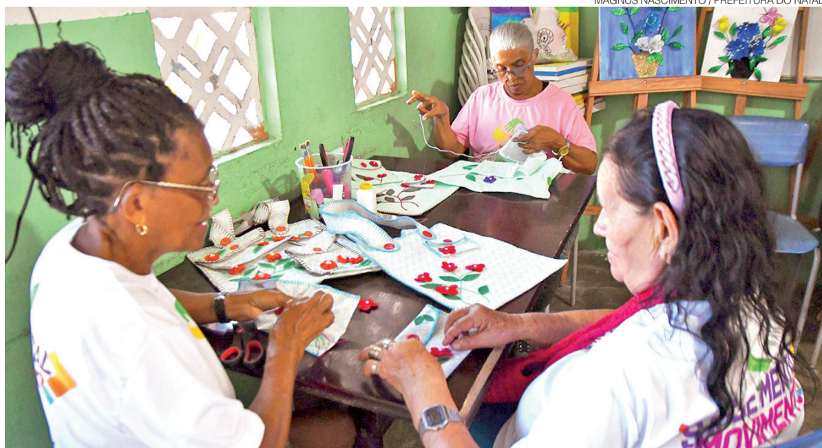
Recursos do FUMAPI permitem ampliar alcance de instituições que atuam em Natal no atendimento aos idosos

Segundo ele, uma das instituições beneficiadas é o Juvino Barreto, que recebeu recursos para ações voltadas à saúde mental, estrutura e acessibilidade. “O Juvino Barreto recebeu R$ 350 mil do fundo municipal da pessoa idosa graças à Restituição Solidária. Atualmente, a campanha do município é a principal responsável por fortalecer essa arrecadação para o fundo”, afirma. ●