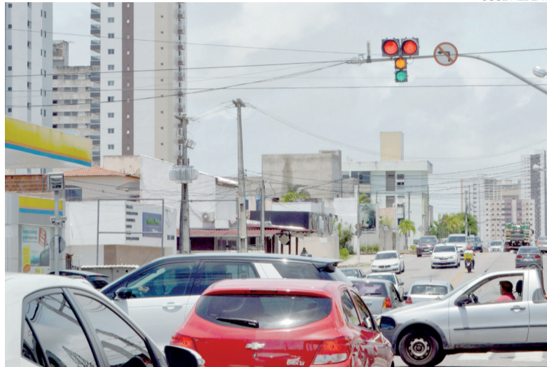
Semáforos terão tecnologia capaz de adaptar tempo dos sinais conforme o fluxo

Entre as medidas previstas, a secretária destacou a instalação