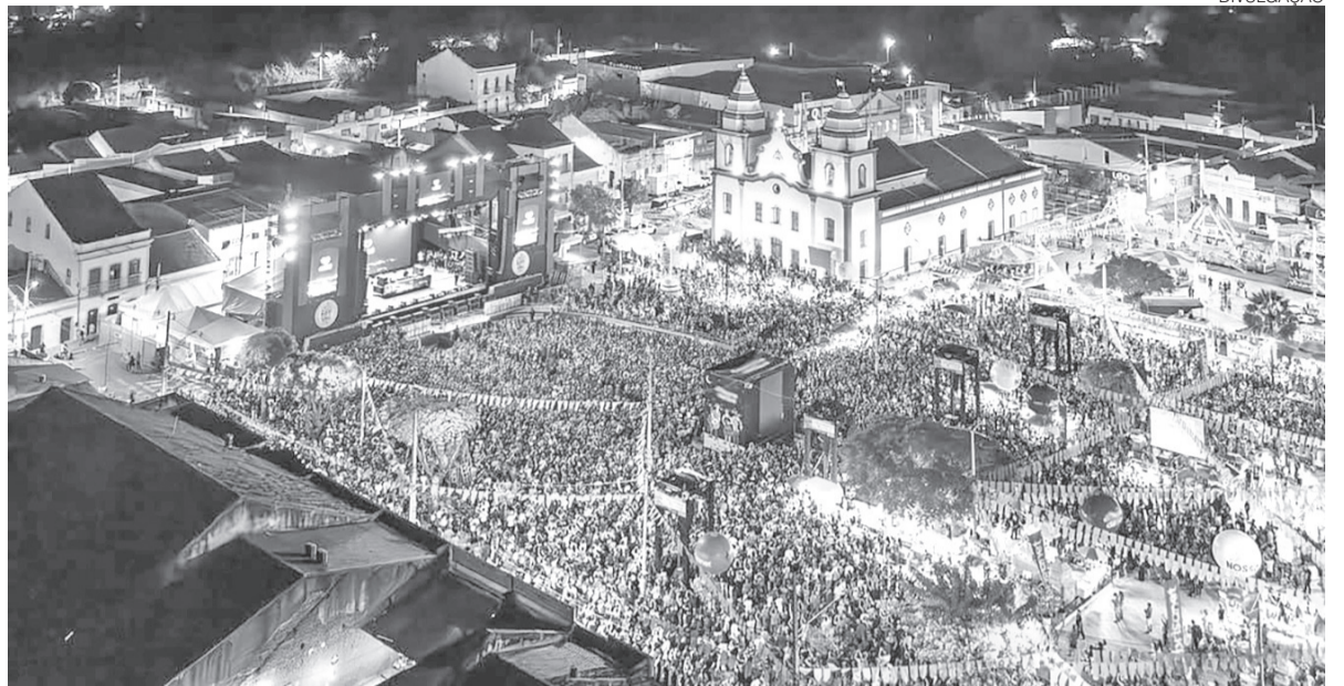
Festa dos 300 anos do São João de Assú reunirá atrações como Matheus & Kauan, Zé Vaqueiro, Grafith e padre Fábio

O Governo do Estado publicou, nesta quarta-feira 13, a revisão das tabelas salariais dos servidores públicos estaduais, com reajuste de 4,26%, correspondente à inflação de 2025. A implantação será em maio. O retroativo a abril será parcelado em 6 vezes.