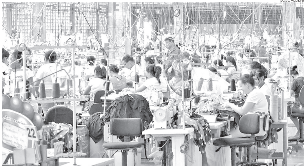
Indústria têxtil fez a diferença no RN, de acordo com pesquisa do IBGE e outros setores cresceram de forma tímida

Os dados fazem parte da Pesquisa Industrial Mensal – Produção Física Regional (PIM-PF Regional), divulgada nesta terça-fei-