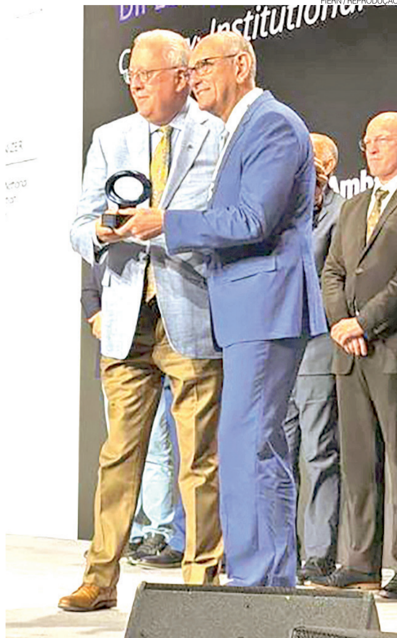
Serquiz em solenidade no evento, realizado por CNI e U.S. Chamber of Commerce