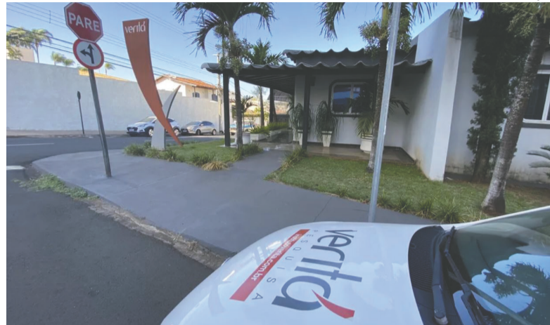
Equipe do Instituto Veritá durante aplicação de pesquisa pelo País afora

A legenda também questionou a distribuição por renda, sus-