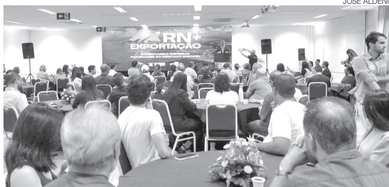
Empresários e especialistas do setor produtivo discutiram modelos de exportação