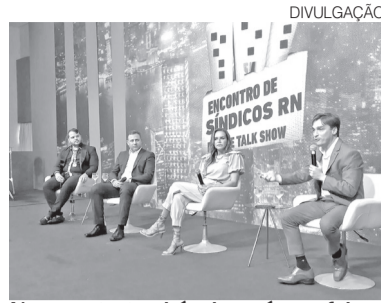
No encontro também haverá uma feira

O encontro será dividido em seis blocos de talk show ao longo dos dois dias, reunindo 25 especialistas