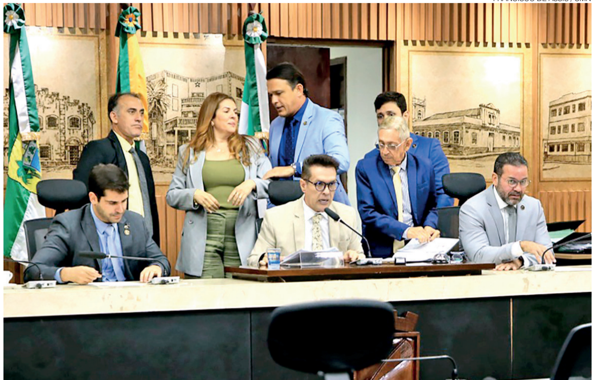
Vereadores aprovaram projeto que prevê pagamento da tarifa de ônibus por Pix no transporte da capital potiguar