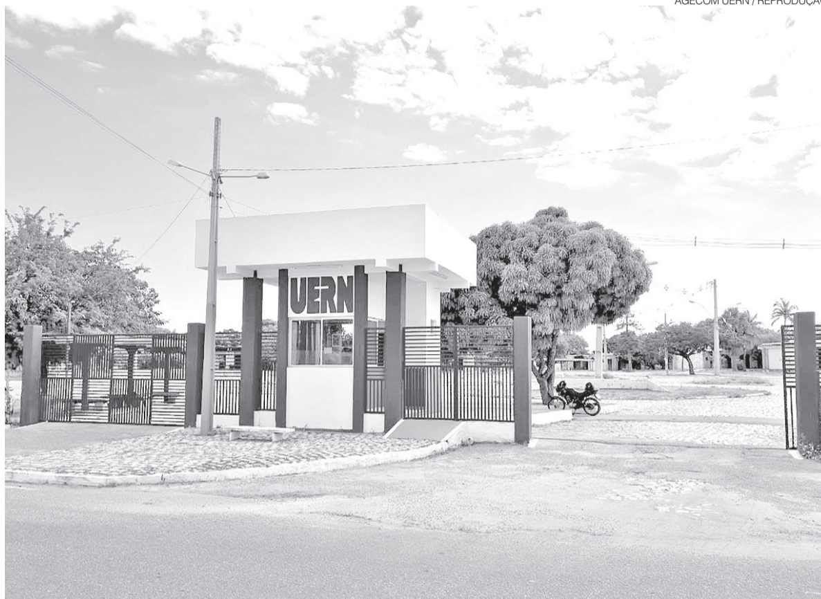
Entrada do Câmpus Mossoró da Universidade do Estado do Rio Grande do Norte; instituição de ensino tem 57 anos

Os seis campi presenciais da universidade estão localizados em Mossoró (Sede), Natal, Assú,