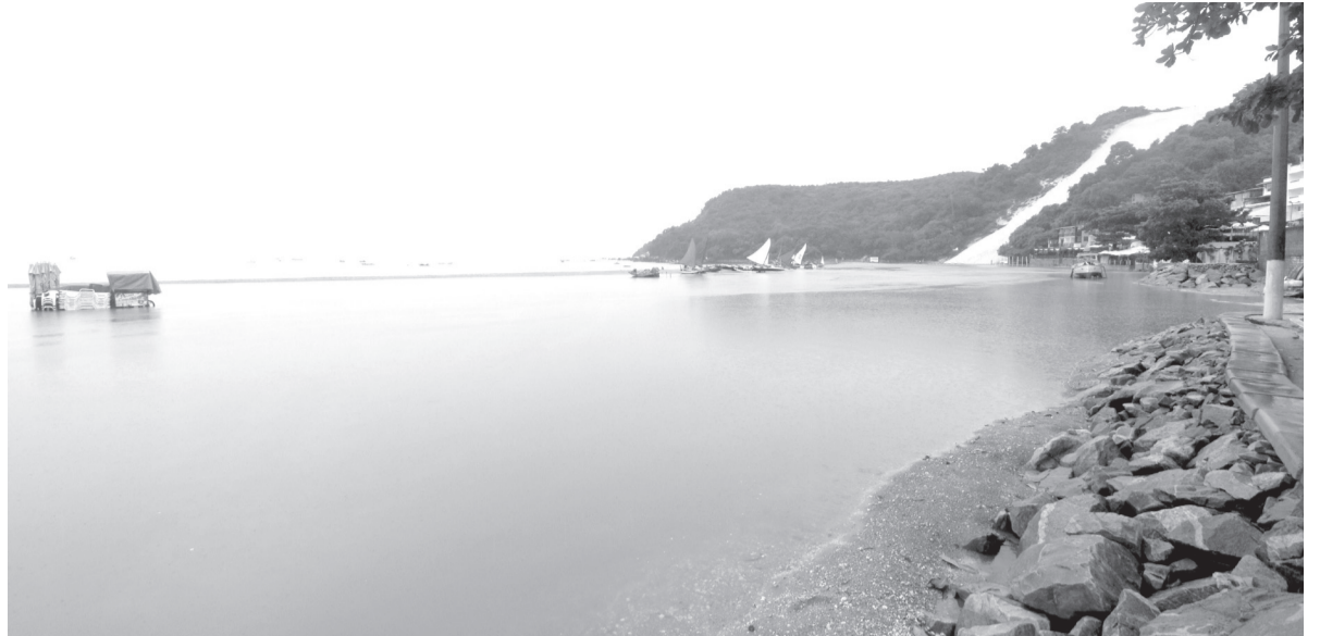
Prefeitura prepara obras de reservatórios subterrâneos para tentar reduzir alagamentos após a engorda de Ponta Negra

A Prefeitura do Natal lançou 320 vagas em cursos gratuitos profissionalizantes na Semtas da Ribeira, em frente ao Banco do Brasil, além de turmas na Rua Bariri, S/N, próximo ao Ginásio Nélio Dias.