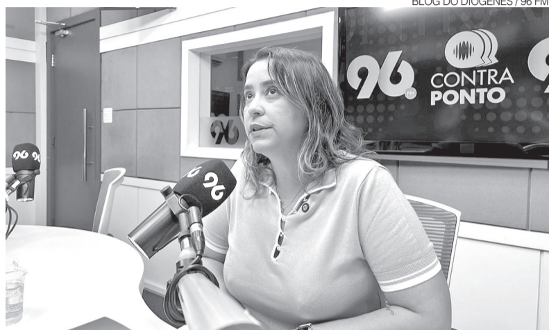
BLOG DO DIÓGENES / 96 FM

blogdodiogenes.com.br | fcodiogenes@hotmail.com