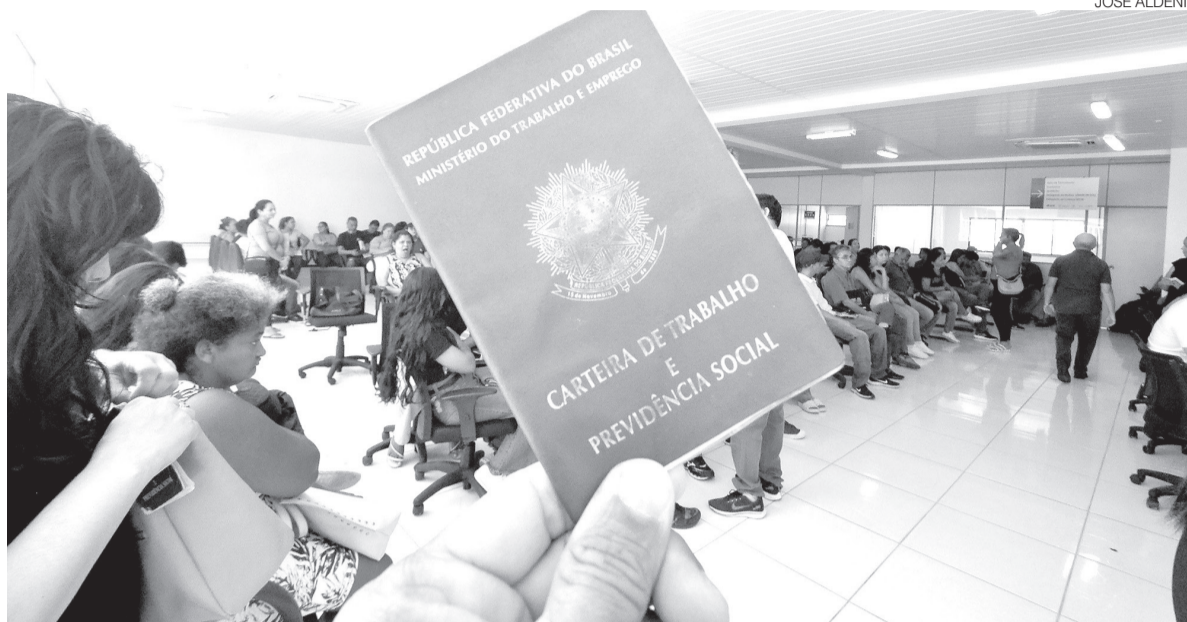
Entre os ocupados no Estado, 444 mil possuíam carteira assinada no setor privado no fim de março, aponta IBGE

“Muito embora a taxa de desocupados tenha caído, essa geração de emprego é de baixíssima renda e produtividade. Isso é fruto de um estado que precisa melhorar o seu nível educacional, a qualificação dos seus trabalhadores, e, agregado