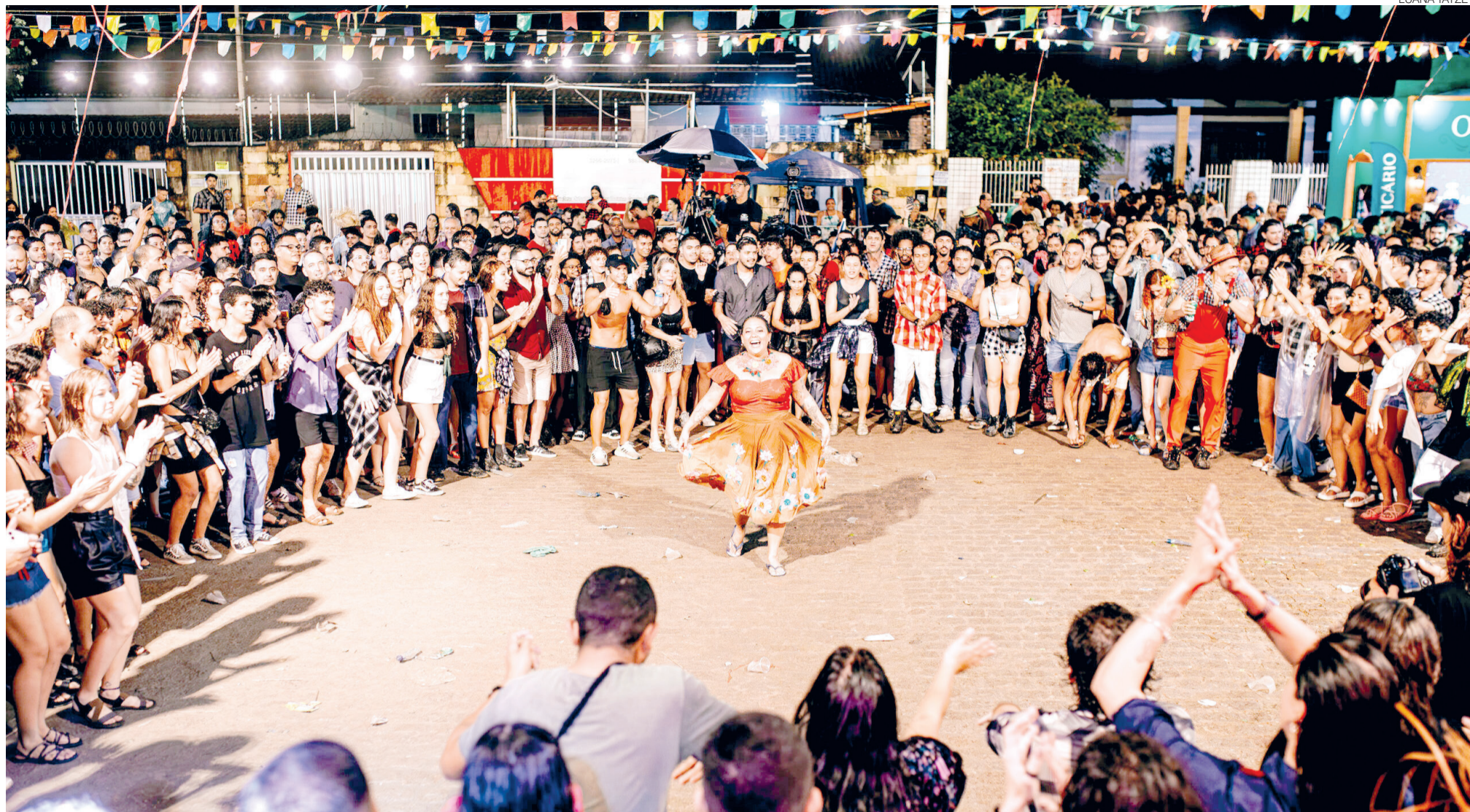
Potilândia recebe no dia 3 de junho a 9ª edição do aHAYá de Rua, um dos principais festejos juninos comunitários de Natal; evento gratuito terá cortejo cultural, apresentações musicais e arrecadação solidária