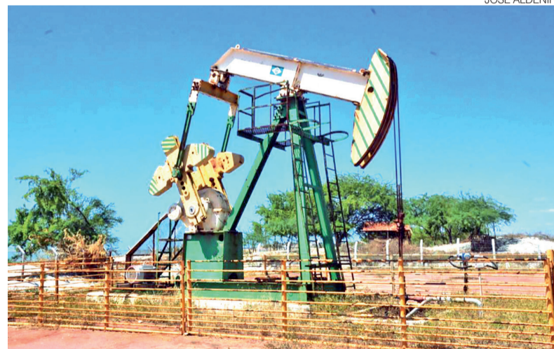
Houve redução na entrada de novos processos prioritários de exploração

O levantamento aponta ainda aumento no número de pedidos de prorrogação de licenças já emitidas, em substituição à abertura de novos processos de licenciamento ambiental, além do abandono temporário de deter-