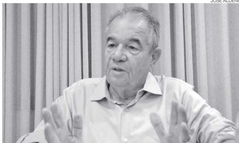
Laranjeiras prefere que parte dos recursos sejam para renovar frota de ônibus

Na avaliação da CNT, parte dos recursos previstos no pacote federal para veículos leves poderia ser direcionada para renovação da frota de ônibus, implantação de