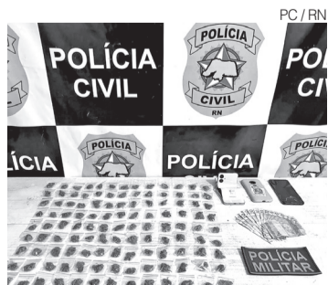
Maconha e dinheiro apreendidos

Nos últimos anos, a praia de Pipa tem recebido reforço de operações integradas das polícias Civil e Militar. ●