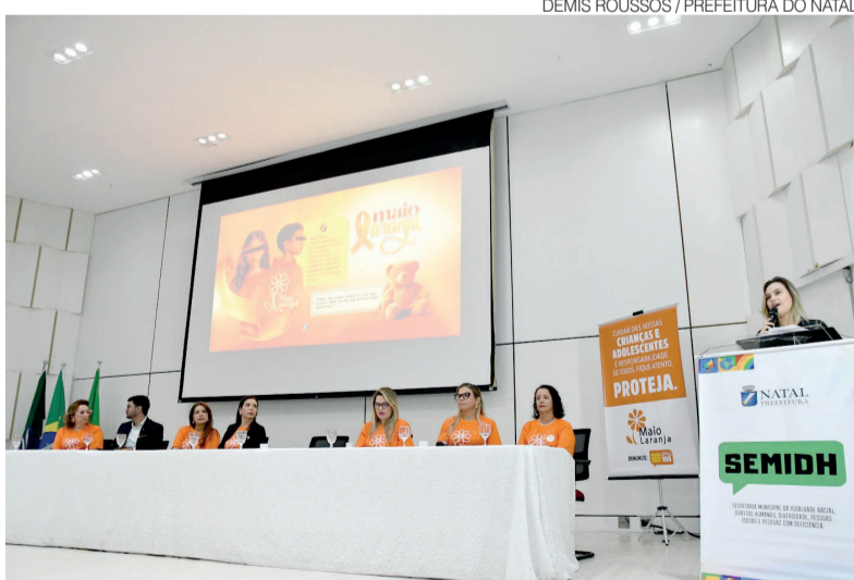
Cemure, na Zona Oeste de Natal, recebeu evento na última segunda-feira