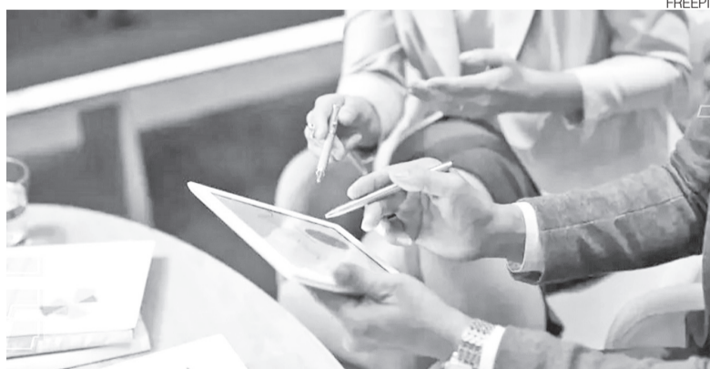
Plataforma oferece recursos voltados à tomada de decisões empresariais

mos em momentos de urgência, o empreendedor passa a estruturar a gestão financeira primeiro, tornando o crédito uma consequência natural de um negócio mais saudável e preparado para crescer”, afirmou.