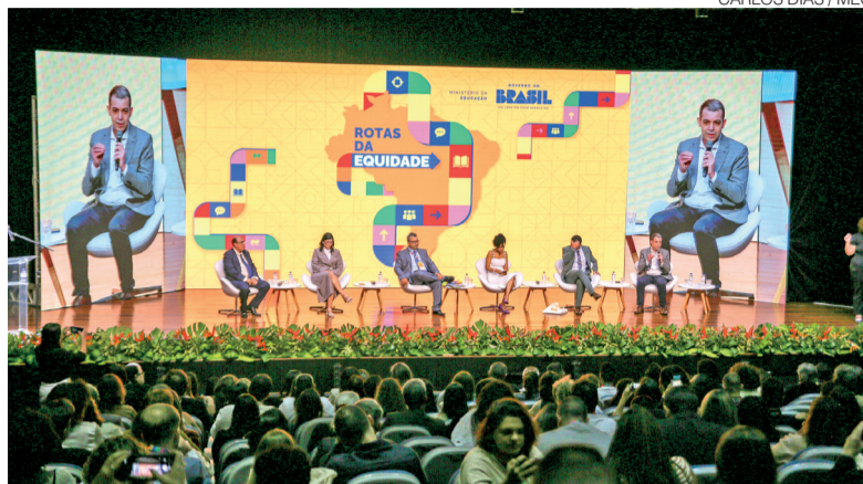
CARLOS DIAS / MEC