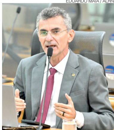
Deputado estadual Francisco do PT

de rastreabilidade e transparência”, afirmou Francisco do PT. “O tempo está passando. Esse ano é ano eleitoral e os prazos estão se encurtando cada vez mais.”