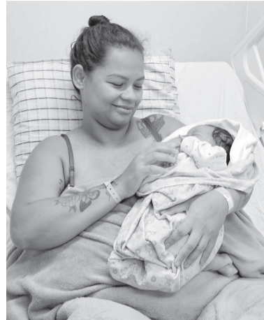
RN tem aumento em sub-registros

Lagoa de Velhos, Francisco Dantas e Patu aparecem entre os municípios com maiores percentuais de sub-registro de nascimento em 2024