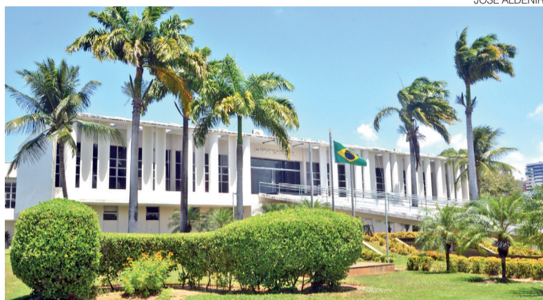
Governo do RN não pode pagar emendas nos três meses que antecedem a eleição

“Essas emendas agora estão sujeitas a um conjunto de regras