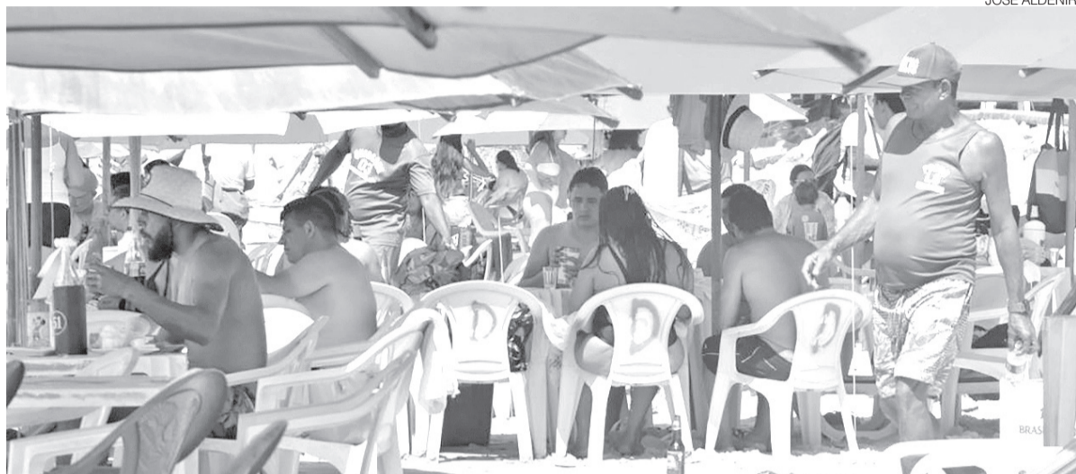
Turistas brasileiros e estrangeiros na praia de Ponta Negra em plena semana neste primeiro trimestre em Natal

Outro ponto destacado pelo instituto é que o avanço ocorreu sobre uma base elevada de comparação. Em março de 2025, o turismo potiguar já havia registrado crescimento de 16,3%, indicando continuidade do aquecimento da atividade eco-