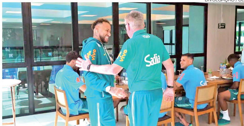
Técnico Ancelotti recebendo Neymar Jr na Granja Comary, em Teresópolis (RJ)

A Seleção Brasileira de Futebol iniciou, nesta quarta-feira 27, a preparação para a Copa do Mundo de 2026 com a apresentação dos jogadores convocados pelo técnico Carlo Ancelotti na Granja Comary, centro de treinamento da Confederação Brasileira de Futebol (CBF) em Teresópolis. O último atleta a chegar foi Neymar. O camisa 10 do Santos desembarcou na cidade em helicóptero