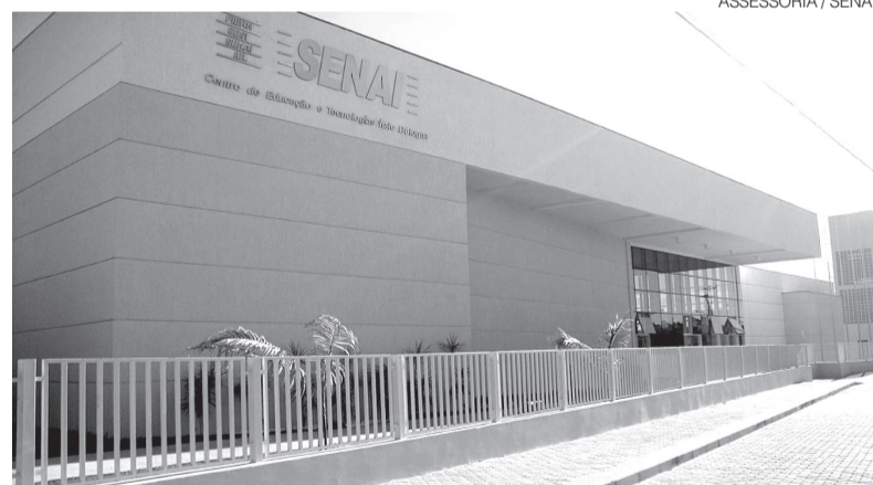
Inscrições podem ser feitas pelo site www.rn.senai.br/opportunidades/

O Senai integra o Sistema Federação das Indústrias do Estado do