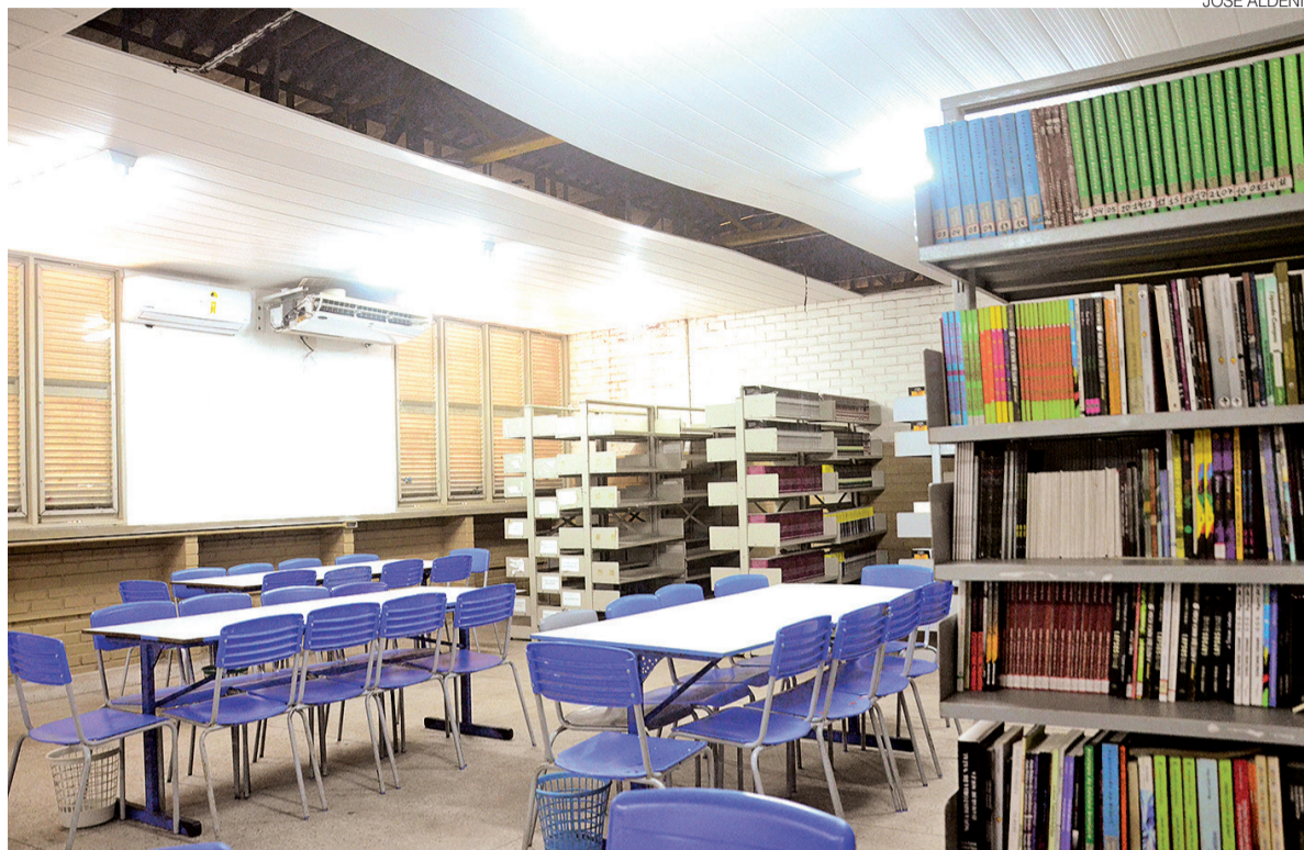
Legislação prevê fortalecimento de espaços de leitura e incentivo ao acesso a livros didáticos, literários e de pesquisa

Entre os objetivos previstos na lei estão a implantação de biblio-