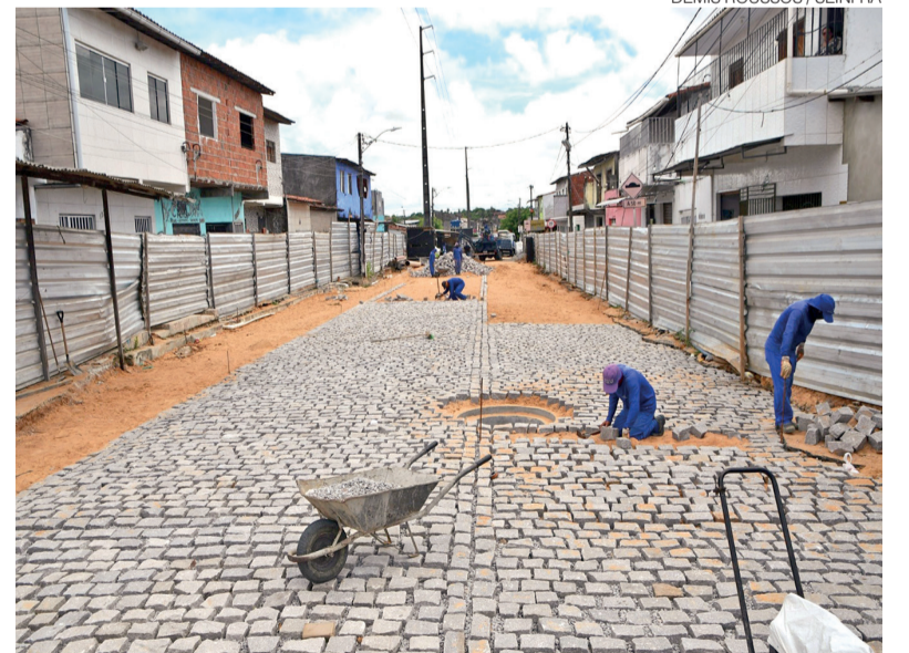
Buraco provocou obstrução na rede de drenagem, mas problema foi resolvido

Segundo a Prefeitura, a previsão é que a implantação do pavimento em paralelepípedo seja