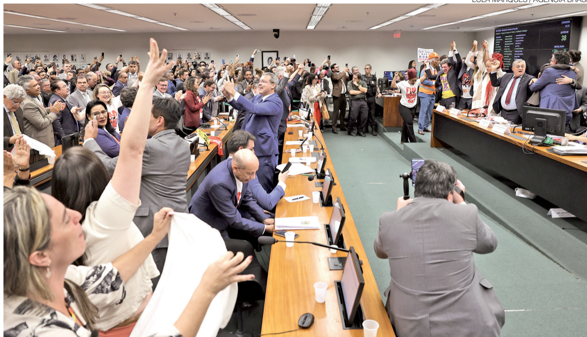
Parlamentares comemoram aprovação da PEC na comissão especial durante reunião realizada nesta quarta-feira 27

texto ainda aguardava votação no plenário da Câmara antes de ir ao Senado — o que pode ter acontecido na madrugada.