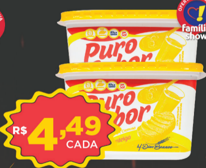
Margarina Puro Sabor 500g (C/ Sal)