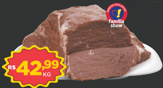
Chã de Fora de Sol