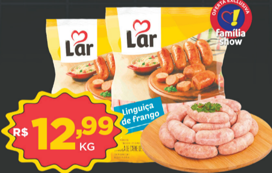
Linguiça de Frango Lar