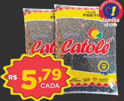
Feijão Catolé 1kg (Preto)