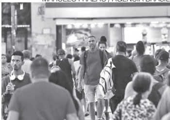
Desemprego sofre leve alta no País