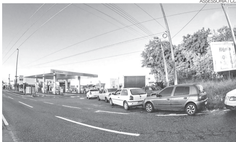
Muita gente aproveitou o dia para comprar combustíveis sem impostos

Além dos combustíveis, empresas de diversos segmentos ofereceram produtos e serviços sem repassar ao consumidor o valor correspondente aos impostos. Os descontos chegaram a até 70% em alguns casos. Entre os participantes estão centros comerciais, redes varejistas, lojas de acessórios, óticas, supermercados, empresas de tecnologia, clínicas, restaurantes, shoppings e prestadores de serviços.