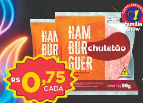
Hambúrguer Chuletão 56g (Misto)