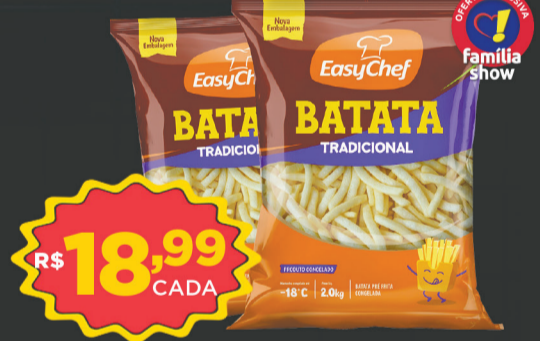
Batata Pré-Frita Easychef 2kg (Tradicional)