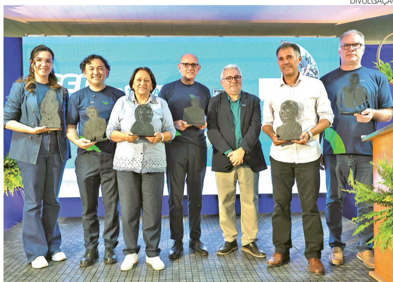
Fátima Bezerra participou do lançamento e falou sobre desenvolvimento social

“Este projeto mostra como a educação pode ser uma ferramenta decisiva para ampliar oportunidades de trabalho e renda. O Sesi é uma das maiores redes de educação de jovens e adultos no Brasil, e graças a essa parceria com todas as entidades envolvidas, junto ao governo federal, foi possível lançar esse projeto aqui hoje, com a missão de levar formação a trabalhadores que sustentam uma