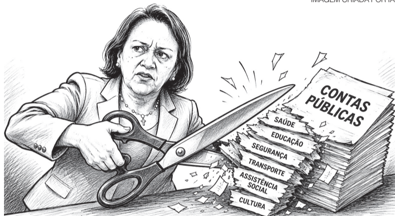
IMAGEM CRIADA POR IA

blogdodiogenes.com.br | fcodiogenes@hotmail.com