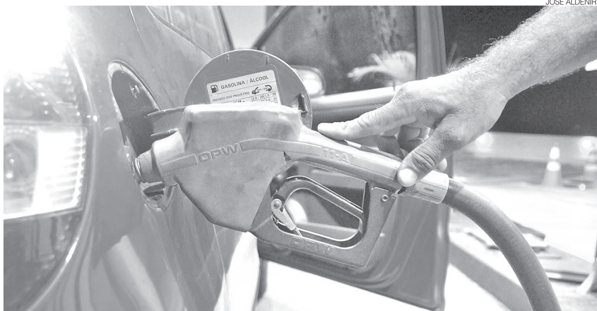
Redução ocorre em um momento de monitoramento do mercado por distribuidoras, que repassam custos ao consumidor

Os reajustes da Refinaria Clara Camarão são acompanhados de perto pelo mercado potiguar