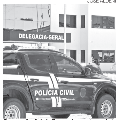
Operação foi deflagrada nesta quinta

De acordo com a apuração, a vítima contratou o advogado pa-