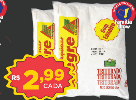
Açúcar Alegre 1kg (Triturado)