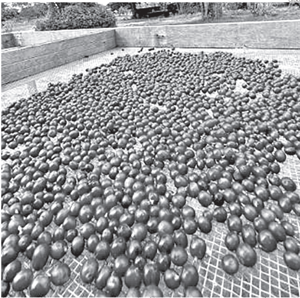
Grãos selecionados em um plantio desenvolvido em Ceará-Mirim, abrindo novas fronteiras do agronegócio para o RN

A estratégia adotada pelo Sebrae-RN vai além do estímulo ao plantio. O objetivo é construir uma cadeia produtiva estruturada desde a origem, envolvendo assistência técnica contínua, capacitação de produtores, articulação com universidades, validação de variedades adaptadas ao clima potiguar e práticas voltadas à sustentabilidade. A iniciativa inclui agricultores familiares e busca criar condições para o desenvolvimento de uma produção com identidade regional própria.