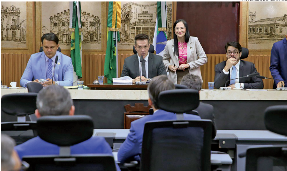
Vereadores aprovaram recomposição salarial para servidores da Saúde durante sessão ordinária da Câmara Municipal

Eles serão contemplados pela recomposição salarial que incidirá sobre todas as letras e níveis do