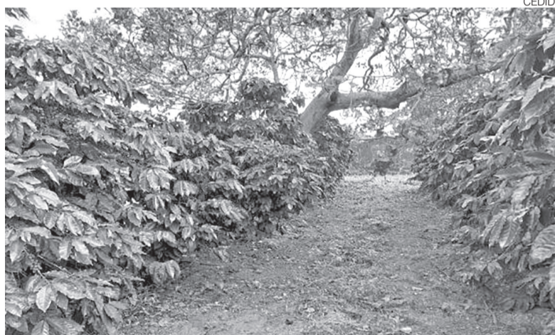
Plantio de café em Jaçanã, que foi iniciado em 2020, em plena pandemia

Sebrae-RN. Segundo ele, apesar de o setor ainda estar em estágio inicial, os resultados observados indicam potencial de crescimento. “O papel do Sebrae-RN tem sido justamente organizar esse ecossistema, conectar conhecimento técnico, promover capacitação e garantir que esse crescimento aconteça de forma estruturada e sustentável”, acrescenta.