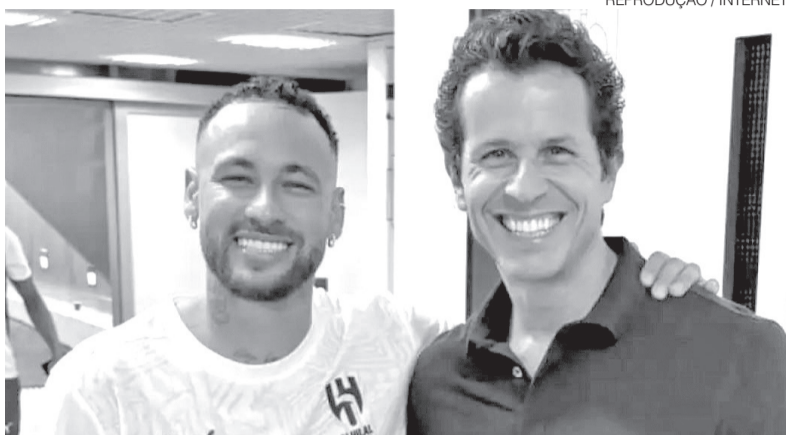
Neymar Jr e o médico da Seleção Brasileira, Rodrigo Lasmar, após exames

Regulamento da Fifa permite substituição até 24 horas antes da estreia do Brasil na Copa; entidade aposta na recuperação do atacante para a fase de grupos