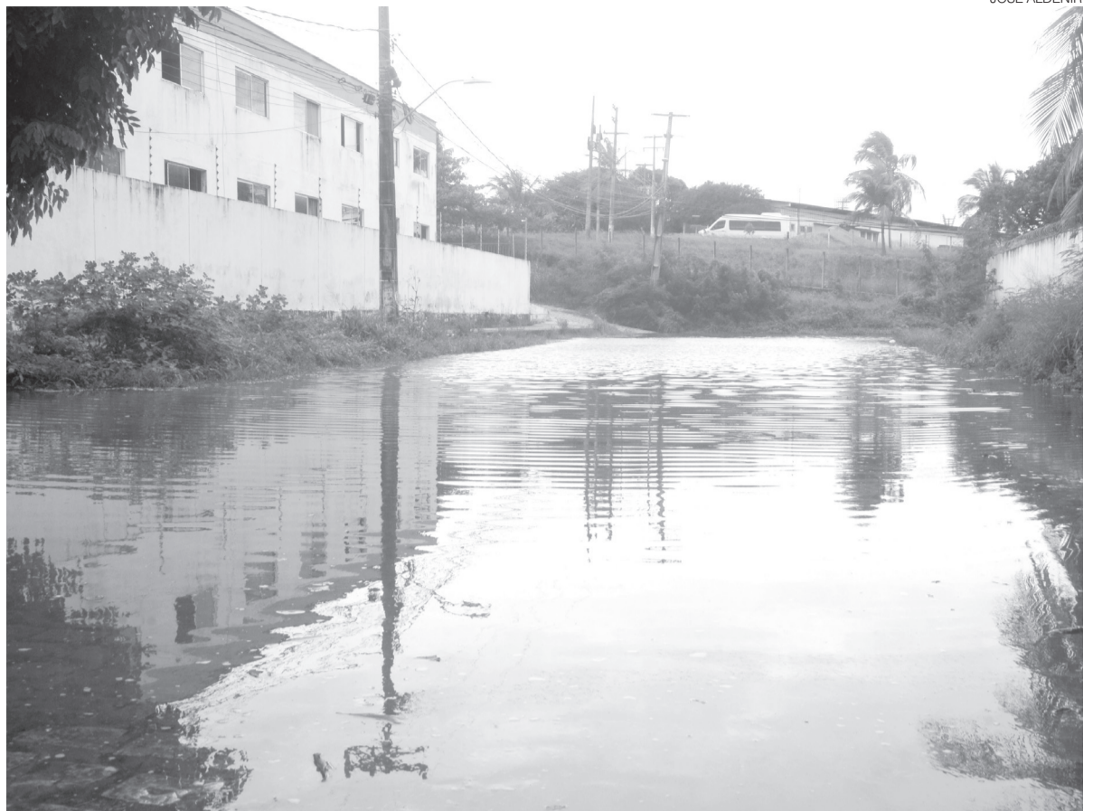
Água escorre pela Rua das Verbenas, em Mirassol, formando áreas alagadas e dificultando a circulação de moradores

A direção do Ipern informa que o pagamento dos servidores ativos, inativos e pensionistas do Estado está previsto para a manhã deste sábado 30. Estamos acompanhando!