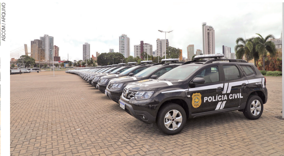
Aquisição de viaturas, equipamentos e sistemas tecnológicos está entre os investimentos