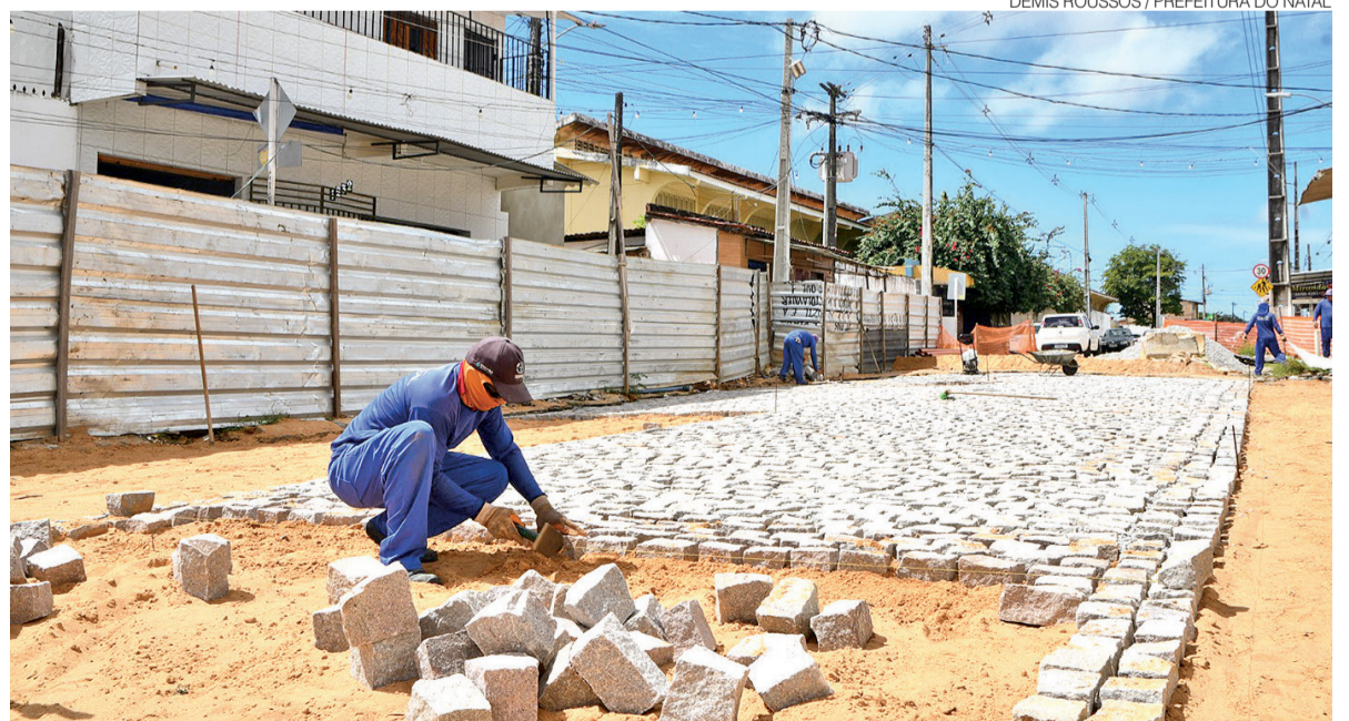
Equipes da Prefeitura executam fase final da drenagem da Rua José Luís da Silva, no bairro Nossa Senhora da Apresentação

A intervenção foi iniciada em janeiro deste ano, após a identificação de danos em uma tubulação situada a aproximadamente nove metros de profundidade. Em razão da complexidade do serviço e das dificuldades de acesso ao ponto afetado, foi necessária a execução de uma obra específica para garantir a recuperação definitiva da estrutura.