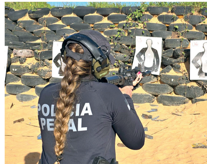
Políticas de prevenção, inteligência e repressão qualificada fazem diferença