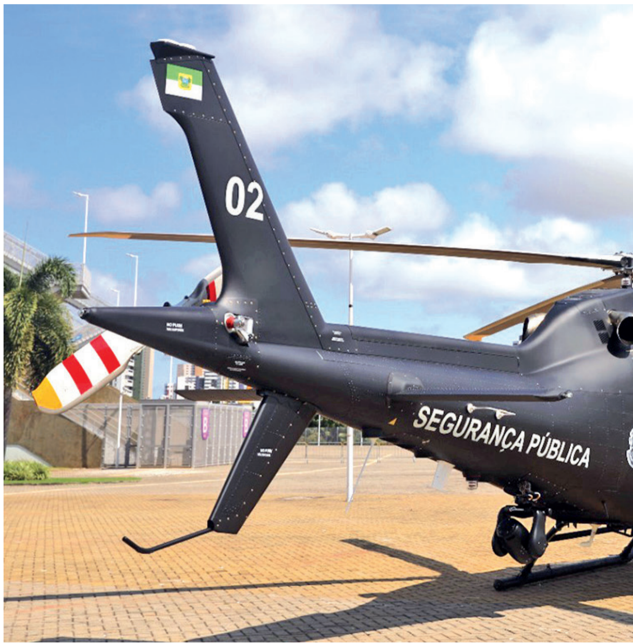
Forças de segurança do Estado atuam de forma integrada em operações de prevenção, patrulhamento e combate à criminalidade

O estado foi apontado pelo Ranking de Competitividade dos Estados como o que mais evoluiu em segurança pública no país entre 2023 e 2025, saltando da 14ª para a 3ª colocação nacional na área. Para a gestão da Sesed, o esforço é contínuo não apenas no combate, mas na prevenção a partir de parcerias também o combate ao crime organizado. Por isso, parte dos investimentos ocorre em tecnologia, capacitação profissional e inteligência. A integração das instituições, de acordo com a Sesed, tem sido essencial para reduzir desde o crime contra o patrimônio, contra a vida e contra a ordem financeira. ●