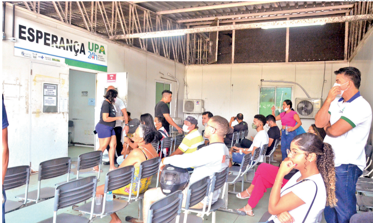
Pacientes aguardando atendimento na Unidade de Pronto Atendimento (UPA) de Cidade da Esperança, na Zona Oeste

A controvérsia envolve as UPAs Satélite, Esperança, Potengi e Pajuçara. Em julho de 2025, a Prefeitura lançou quatro editais para selecionar organizações sociais responsáveis pelo gerenciamento, operacionalização e execução dos serviços dessas unidades.