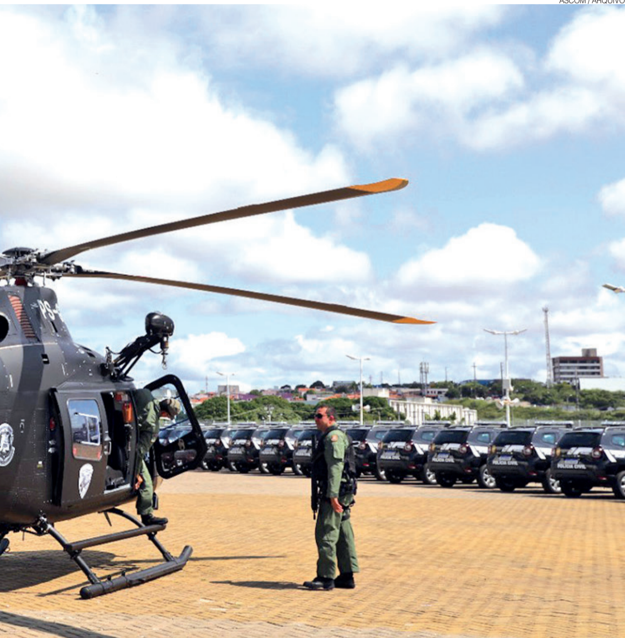
Operacionalidade em diferentes regiões do Rio Grande do Norte; dados oficiais apontam diminuição contínua de homicídios