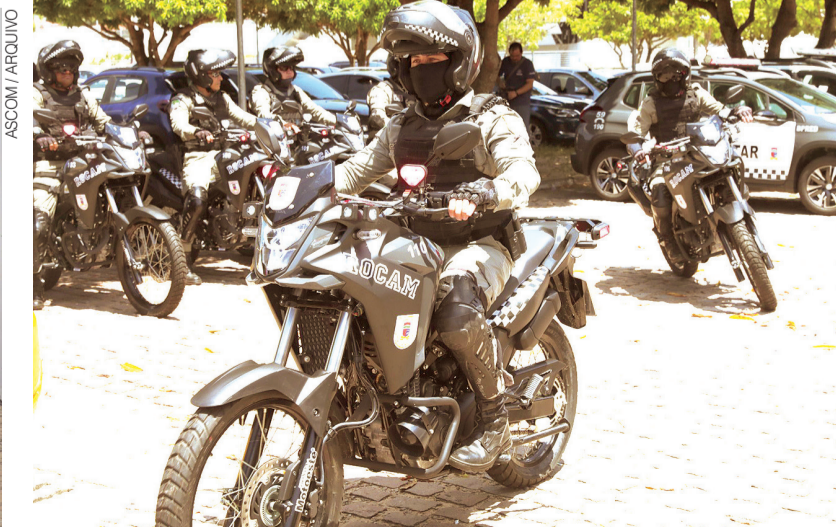
Integração entre órgãos estaduais e federais tem sido uma das bases da Segurança