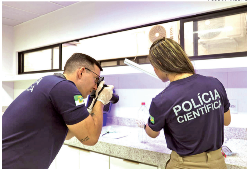
Resultados refletem política voltada ao combate dos crimes contra o patrimônio