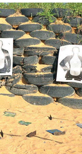
Parte das ações no RN