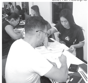
Candidatos têm de levar documentos