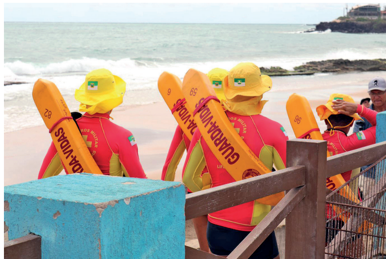
Planejamento e capacitação profissional compõem as medidas adotadas