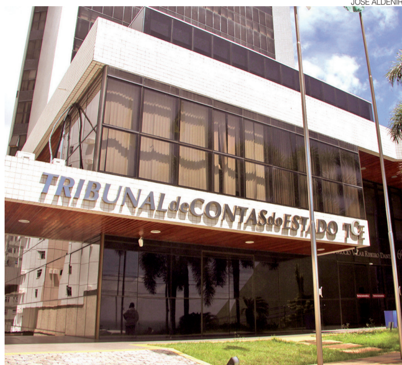
Aumento será incorporado às tabelas remuneratórias dos efetivos e comissionados

O projeto ressalta que o TCE-RN mantém compromisso com o equilíbrio das contas públicas e afirma que foi realizado estudo detalhado para demonstrar a compatibilidade financeira e fiscal da medida. Entre os argumentos apresentados, está a existência de dotação orçamentária