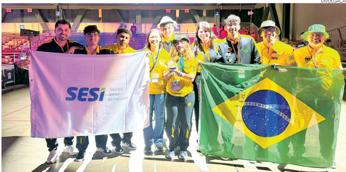
Estudantes da Bat Tech em participação no Western Edge Premier Event, uma das principais competições estudantis

ferência do RN e o alto nível dos nossos alunos. Parabéns a todos os que fazem o SESI, em especial aos professores e estudan-