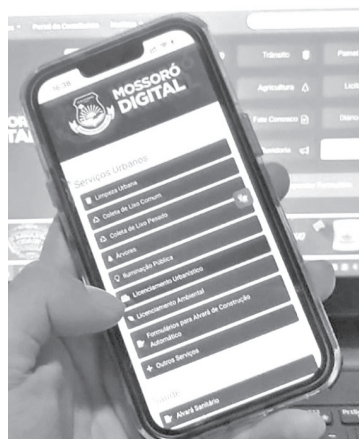
Processo pode ser feito pela internet