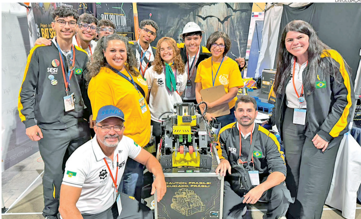
Conquista foi comemorada por alunos, professores e Sistema FIERN como resultado do investimento em educação