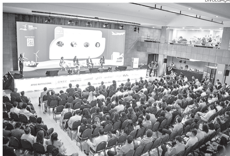
Evento acontece até amanhã no Serhs Natal Grand Hotel, na Via Costeira

Diante da crise financeira, a empresa buscou um empréstimo de R$ 12 bilhões junto a um consórcio de bancos, com garantia da União, para financiar um plano de reestruturação. Apesar do resultado, os Correios afirmam que o prejuí-