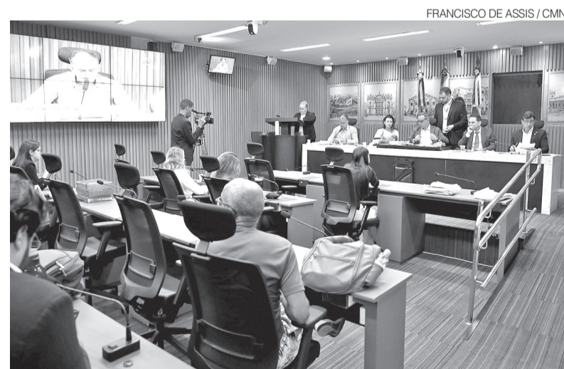
Vereadores durante reunião da Comissão de Legislação, Justiça e Redação