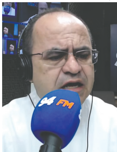
Padre Matias fala sobre comunicação

Segundo o sacerdote, o documento papal já mobiliza chefes de Estado, universidades e profissionais de diferentes áreas. “Esse texto do Papa Leão, que é a