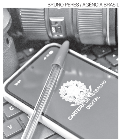
Pequenos garantiram saldo positivo

Apesar do resultado do mês, o acumulado do ano “destaca a capacidade dos empreendedores de menor porte de manter a atividade econômica e gerar oportunidades de trabalho em diferentes regiões do Estado”, afirma o relatório. O segmento concentra a maior parte dos estabelecimentos empresariais potiguares e segue sendo um dos principais motores