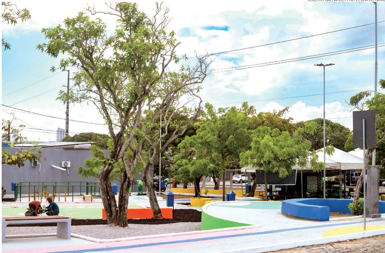
Mais recente entrega da gestão municipal foi a nova praça Vereador Souza Silva, em Candelária, no último sábado 30; local é conhecido como “Praça das Figurinhas”

O trabalho faz parte de um amplo programa de revitalização realizado pela Prefeitura e coor-