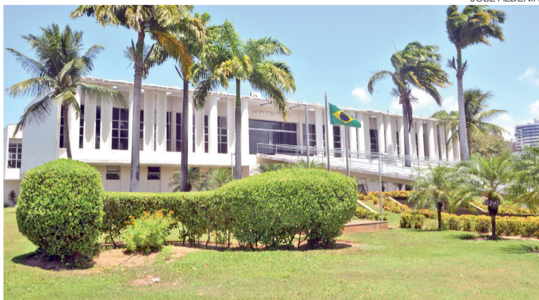
Limitação de empenho foi publicada pelo governo após relatório da Sefaz

Do total bloqueado no novo decreto, R$ 439,9 milhões correspondem ao Poder Executivo estadual. O restante deverá ser absorvido pelos demais poderes e órgãos autônomos, como Tribunal de Justiça, Assembleia Legislativa, Ministério Público, Defensoria Pública e Tribunal de Contas, que terão de adotar medidas pró-