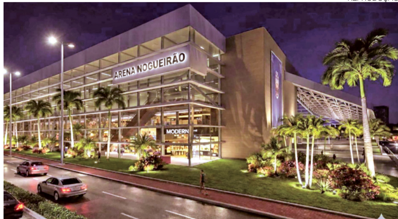
Projeto da nova Arena Nogueirão, que terá capacidade para 15 mil pessoas

Em abril, o estádio Nogueirão foi demolido. Desde então, uma nova arena está sendo erguida no local, através de uma parceria pú-