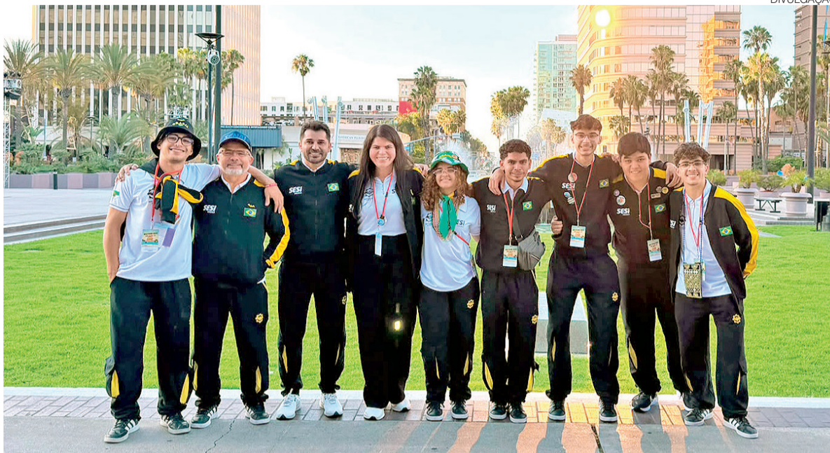
Projeto Bat Sertão, de estudantes do SESI-RN, foi reconhecido nos Estados Unidos por ampliar o acesso à robótica

“Essa premiação é motivo de muito orgulho e alegria para nós que fazemos o Sistema FIERN, e reconhece internacionalmente a excelência das SESI Escola de Re-