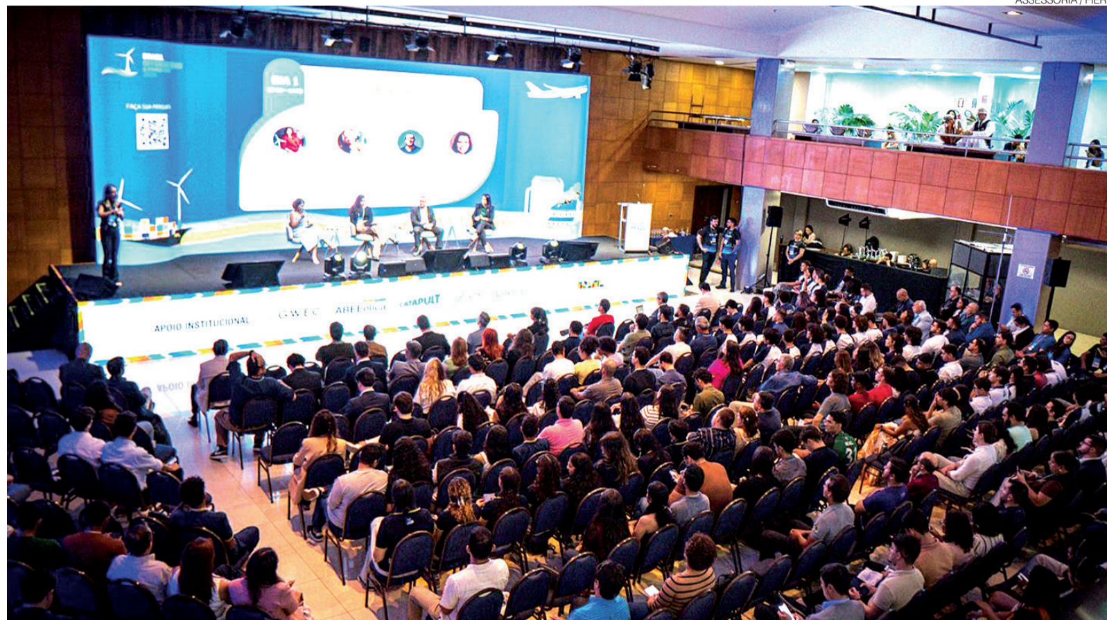
ASSESSORIA / FIERN