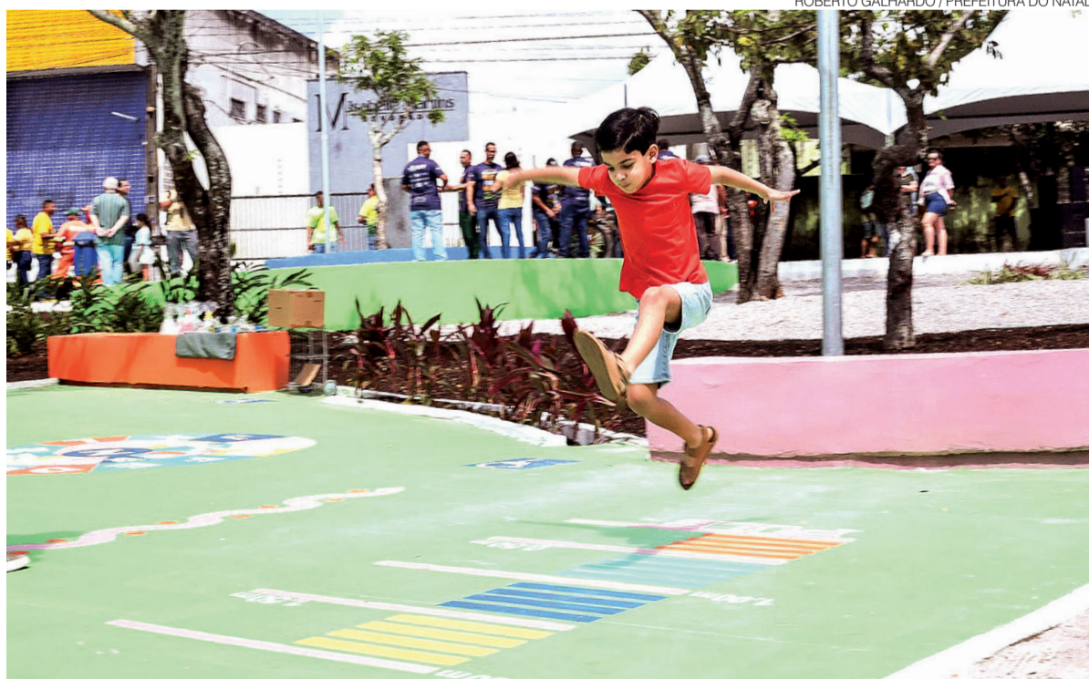
Prefeitura do Natal tem investido na recuperação de espaços de lazer e convivência em todas as regiões da capital potiguar