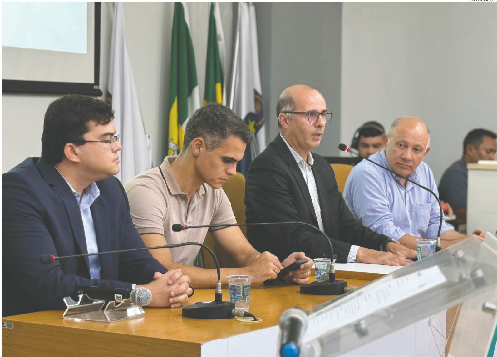
Representantes do Crea-RN, especialistas e profissionais participam de encontro que debate os impactos da nova Lei Federal de Licenciamento Ambiental