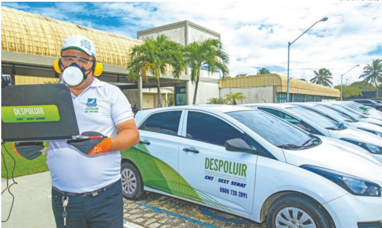
Iniciativa reconhece empresas dos estados do RN, PB e Pe que se destacam pela excelência em gestão ambiental, inovação e compromisso com a sustentabilidade

Coordenado nacionalmente pelo Sest Senat, o programa atua há mais de uma década promovendo a sustentabilidade no transporte brasileiro por meio de avaliações ambientais veiculares, educação ambiental, capacitação profissional e incentivo à adoção de práticas sustentáveis. Ao longo dos anos, o Despoluir vem ampliando sua atuação e fortalecendo a cultura da res-