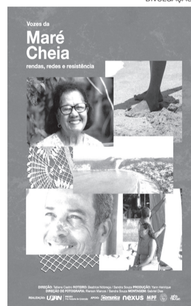
Cartaz do doc sobre Ponta Negra

a engorda da Praia de Ponta Negra foi uma obra de recuperação e ampliação da faixa de areia realizada pela Prefeitura de Natal para conter o avanço do mar e reduzir os processos de erosão costeira, especialmente na região do Morro do Careca. ●