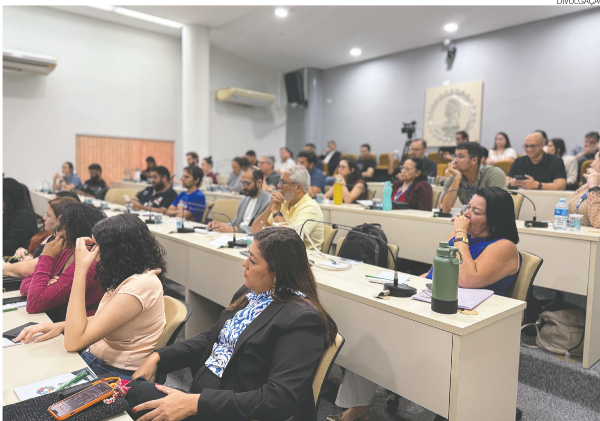
Projeto promove série de eventos para orientar engenheiros, agrônomos e geocientistas sobre setores produtivos

selho Regional de Engenharia e Agronomia do Rio Grande do Norte (CREA-RN) iniciou o pro-