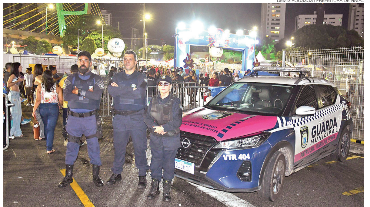
Além do reforço na segurança com atuação da Guarda Municipal, São João de Natal contará com sala de acolhimento

O espaço oferecerá acolhimento humanizado, escuta qualificada, orientação e encaminhamento adequado aos serviços da rede de proteção, garantindo suporte imediato às pessoas que vivenciarem situações de vulnerabilidade ou vio-