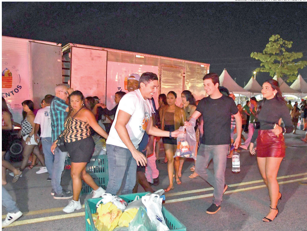
Público do São João de Natal é incentivado a doar alimentos não perecíveis nos polos Arena das Dunas e Nélio Dias

A iniciativa busca ampliar o alcance da campanha “Solidariedade por Toda a Cidade”, estimulando a participação da população durante os festejos juninos. Os alimentos arrecadados serão destinados às instituições cadastradas e atendidas pelo Banco de Alimentos.