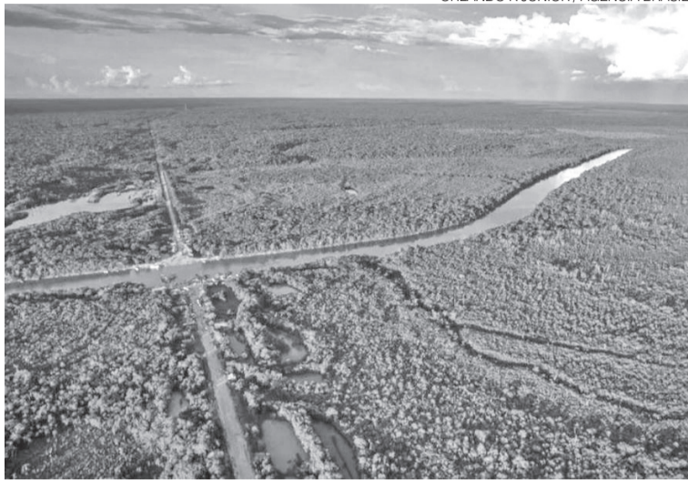
Trecho da Amazônia intacta por vista aérea mostra que os cuidados aumentaram

Relatório do MapBiomias aponta redução de 20,6% na área desmatada em 2025; governo atribui resultado a fiscalização, crédito rural e planos de preservação