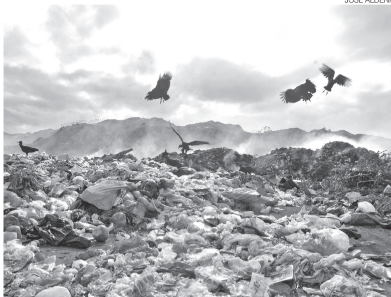
Preocupação com a destinação adequada é comum a todos municípios

A promotora relata que atualmente há uma melhor distribuição de aterros sanitários licenciados no Estado, além de alguns localizados na Paraíba, que atendem municípios potiguares. Ainda de acordo ela, a parte central do Estado, especialmente a região Seridó e o Vale do Açu, não possuem aterros licenciados em funcionamento nas proximida-