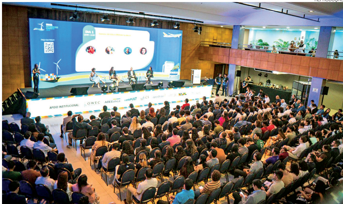
Tema esteve no centro dos debates do Brazil Offshore Wind & Power-to-X (BOWPX), realizado nesta semana em Natal

A lógica envolve também a criação de cadeias produtivas integradas. O pesquisador cita como exemplo a possibilidade de utilização do minério de ferro