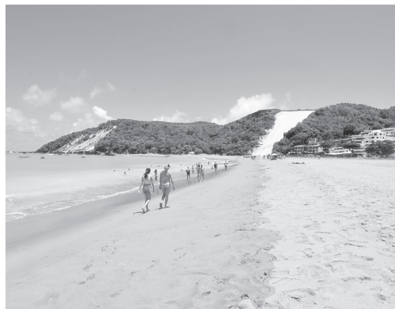
Produção destaca realidade de comunidades tradicionais da Vila de Ponta Negra