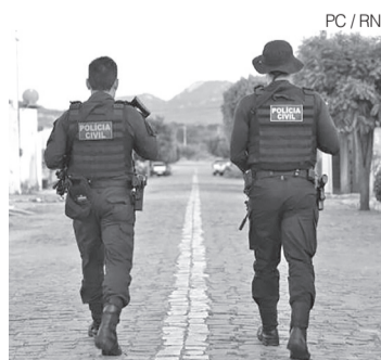
Agentes da Polícia Civil em ação

A Polícia Civil solicita que a população contribua com informações de forma anônima por meio do Disque Denúncia 181. Por todo o interior do Estado, a Polícia Civil tem investigado e prendido ladrões desta natureza. No entanto, apesar do trabalho de excelência dos policiais, torna-se reforço, principalmente para combater o tráfico de drogas, que se alastra por todos os lugares não só do Estado, mas em todo o País.