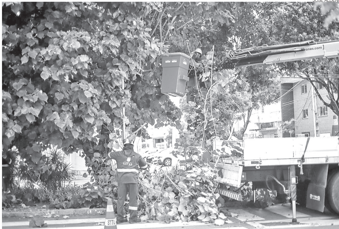
Podas em diferentes pontos de Natal reacendem o debate sobre arborização urbana e impactos no conforto térmico

A secretaria informa que o manejo é realizado mediante parecer técnico e segue critérios definidos pelo setor de paisagismo, responsável pela programação e execução dos serviços. Ainda segundo a Semsur, as equipes de poda são compostas por engenheiros agrônomos e arboricultores. A população pode solicitar poda ou retirada de árvores pelo telefone (84 3232-9845), pelo e-mail [setorarboreo@gmail.com] ou presencialmente no Departamento de Paisagismo, loca-