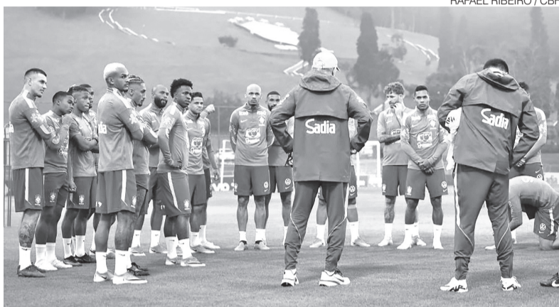
Jogadores de seleção ouvindo instruções de Carlo Ancelotti durante treino

A predominância do Sudeste acompanha a concentração histórica de investimentos, centros de formação e grandes clubes de futebol na região, responsável por revelar boa parte dos atletas que atuam atualmente nas principais ligas do mundo.