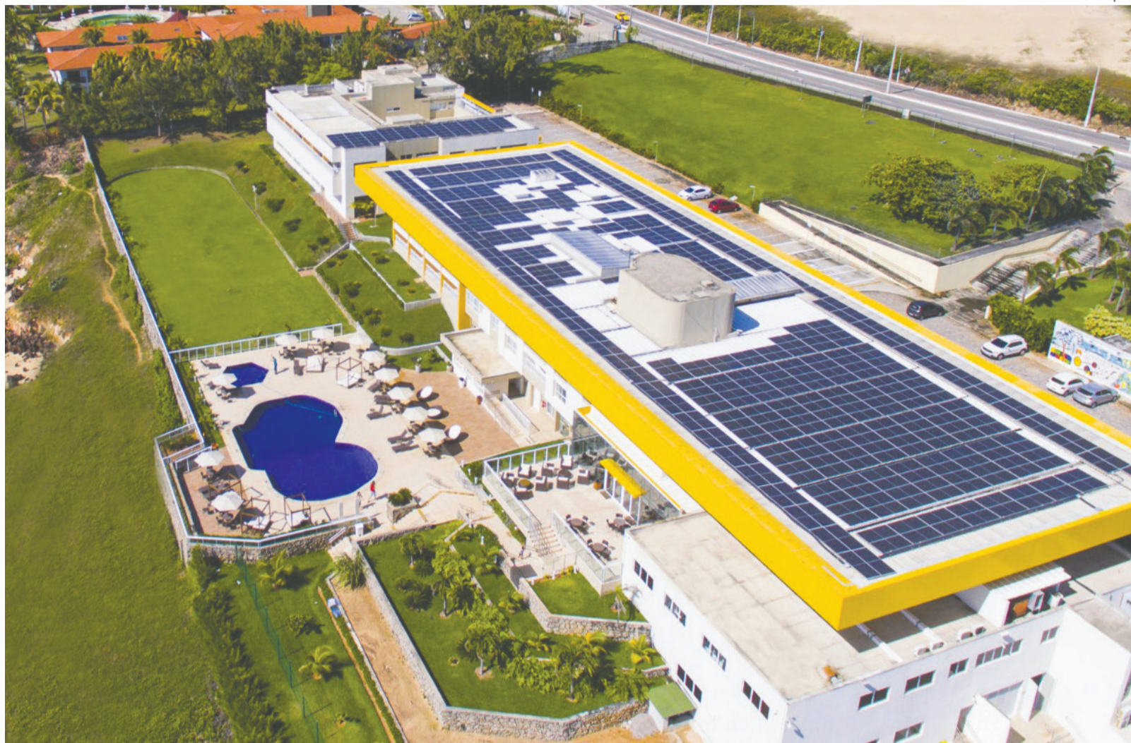
Empreendimento administrado pelo Sistema Fecomércio RN tornou-se referência no setor turístico ao incorporar práticas sustentáveis em sua rotina operacional

Entre os principais reconhecimentos está a certificação internacional ISO 21401, norma específica para sistemas de gestão da sustentabilidade em meios de hospedagem. O Hotel-Escola Senac Barreira Roxa foi pioneiro na América Latina ao conquistar o selo pela primeira vez em 2022 e, desde então, mantém a certificação renovada