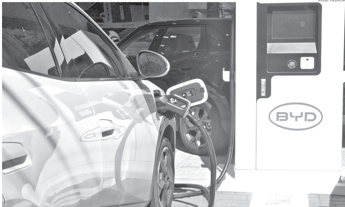
Maior parte da frota é composta por veículos elétricos com fonte externa de recarga, que somam 5.390 unidades

O crescimento desse tipo de veículo acompanha uma tendência observada em todo o país. A ampliação da oferta de modelos, a entrada de novas montadoras no mercado brasileiro e a expansão gradual da infraestrutura de recarga têm contribuído para o aumento da presença desses veículos nas