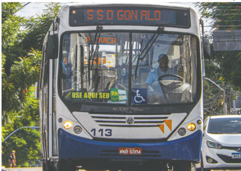
Prêmio da Fetronor vai reconhecer 33 empresas de transporte em duas categorias

ponsabilidade ambiental entre as empresas transportadoras. O crescimento do programa tem contribuído diretamente para a redução das emissões de poluentes nas estradas e nos grandes centros urbanos, estimulando investimentos em manutenção preventiva, eficiência energética e gestão ambiental.