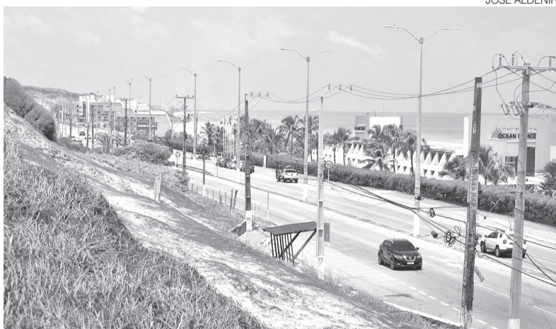
Áreas estão desocupadas em uma das localizações mais caras do RN

Processos administrativos atingem sete concessões após decisão cautelar do TCE-RN que apontou possíveis irregularidades em contratos de uso de terrenos públicos