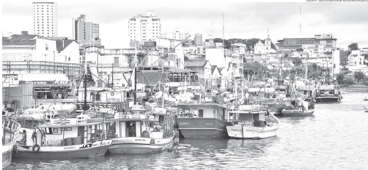
Barcos de pesca do RN estão voltados, por enquanto, ao consumo local porque tarifaço de Trump ainda atinge setor