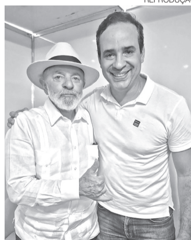
Pré-candidato do PT tem apoio de Lula

A combinação entre alto desempenho de Lula e baixo de-