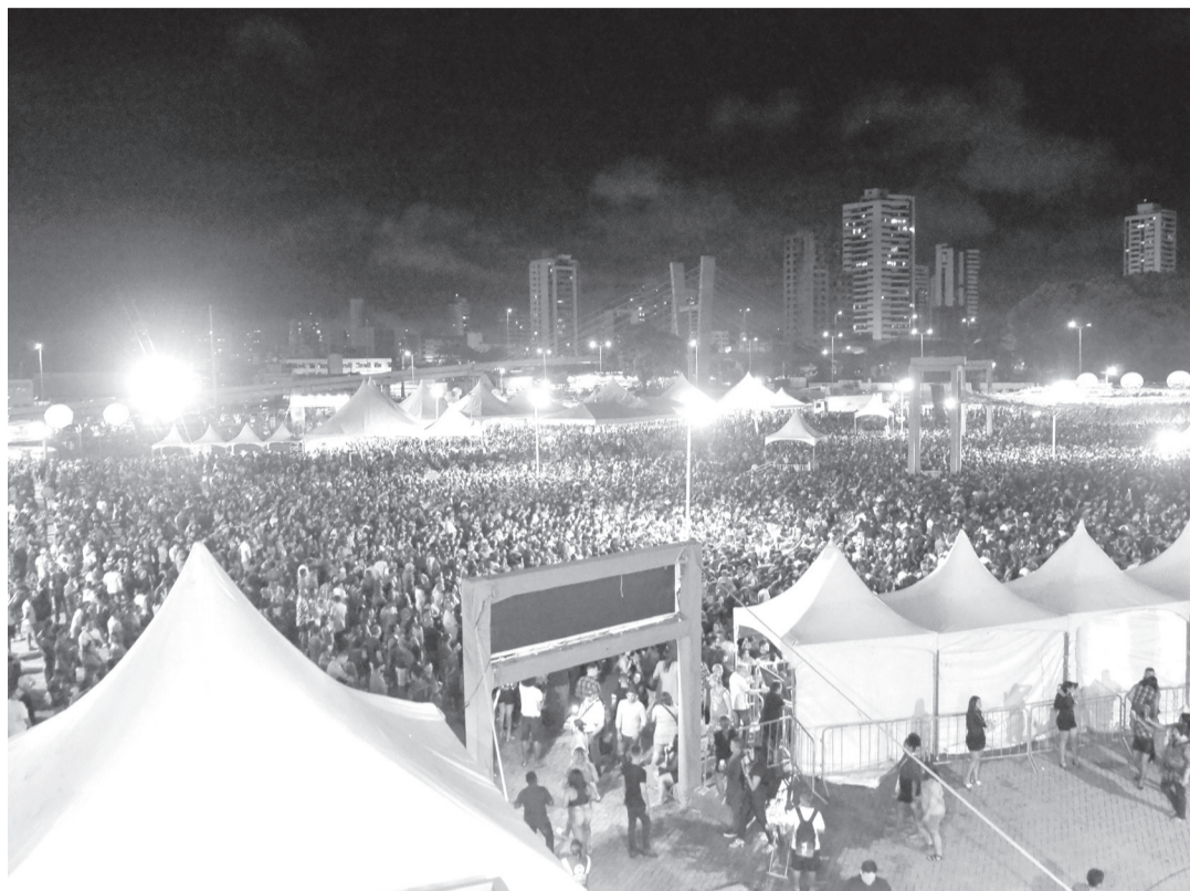
São João segue até 28 de junho com cerca de 40 atrações locais e nacionais na Arena e no Nélio Dias

A Prefeitura também incentiva a doação voluntária de 1 quilo de alimento não perecível durante os dias de programação. Os doativos serão encaminhados ao Banco de Alimentos de Natal por