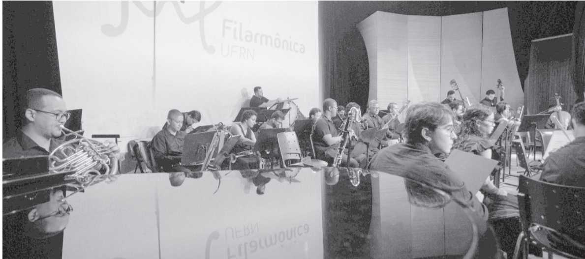
Filarmônica apresenta “América em Transe”, com obras de Astor Piazzolla, Alberto Ginastera e Silvestre Revueltas

Astor Piazzolla, Alberto Ginastera e Silvestre Revueltas em uma curadoria que aproxima diferentes experiências sonoras latino-americanas atravessadas por intensidade, deslocamento, ritual, violência e permanência histórica. As composições parecem compartilhar uma mesma atmosfera: cidades em convulsão, memórias interrompidas, pulsos coletivos e formas de existência em que beleza e brutalidade coexistem de maneira inseparável.