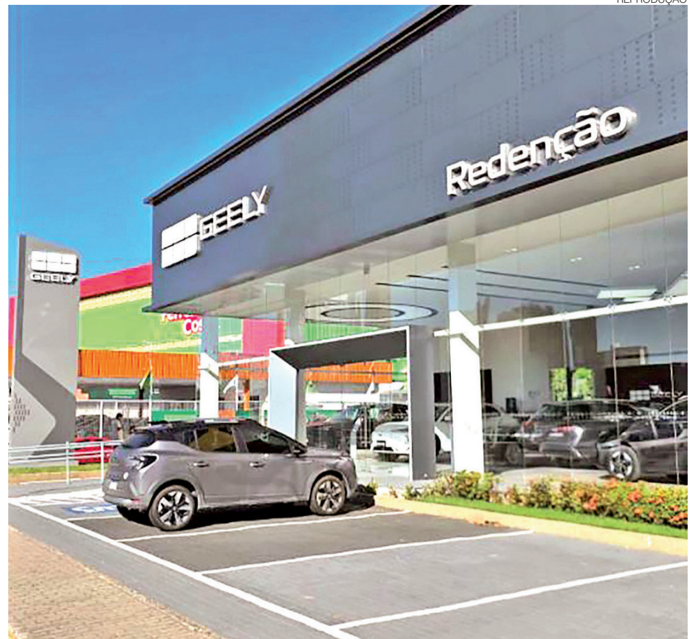
Concessionária Geely em Natal, localizada na Avenida Senador Salgado Filho, em Capim Maciço

Essa mudança também alcança a oficina. De acordo com o gerente, a mecânica pesada cede espaço crescente à eletroeletrônica e à tecnologia da informação. A oficina da concessionária foi reequipada com