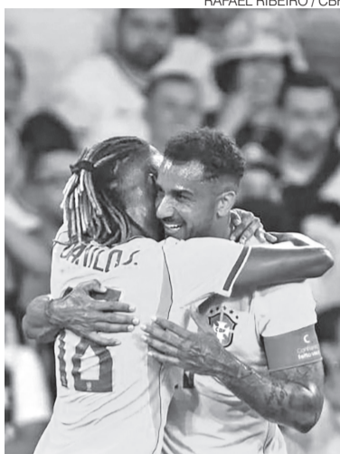
Xarás Danilos comemoram um gol

Nesse caso, a compensação será calculada com base em uma diária de US$ 2.360 por atleta, aproximadamente R$ 12 mil, referente aos períodos em que os