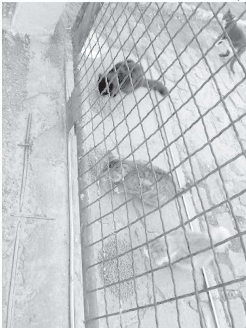
Cerca de 30 gatos vivem nas dependências da Cidade da Polícia, em Natal

Edna destaca que sempre utilizou ração seca para alimentar os