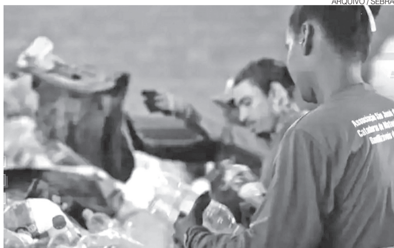
Encontro visa valorizar saúde física e emocional dos catadores de todo o RN

Segundo o Sebrae-RN, a proposta do encontro vai além da