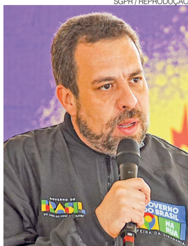
Ministro Guilherme Boulos (SGPR)

Apesar dos alertas, o esquema só foi desmantelado em abril de 2025, quando uma operação conjunta da PF e da Controladoria-Geral da União (CGU) revelou a existência das fraudes. Segundo as investigações, ao longo dos últimos anos, sindicatos e entidades associativas promoveram descontos ilegais deliberados e não autorizados em aposentadorias e pensões — tudo isso com anuência de servidores públicos ligados ao INSS. Pelo menos 4 milhões de beneficiários foram prejudicados.