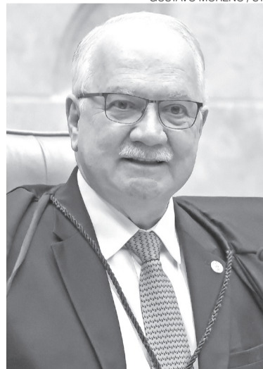
Pres. do Supremo, Edson Fachin

Segundo informações do próprio tribunal, 40 dessas medidas já foram pautadas, mas ainda não chegaram a ser apreciadas.