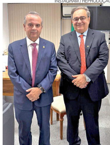
Rogério Marinho com Alvaro Dias

Na mesma gravação, Boulos também citou denúncias de que Rogério Marinho teria contratado funcionários fantasmas quando presidia a Câmara Municipal de Natal, há mais de 20 anos. “Ele foi condenado. Em 2004, tinha funcionários fantasmas”, afirmou Boulos.