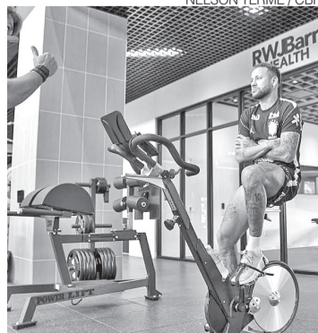
Neymar reforçando musculatura