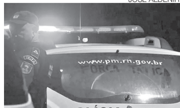
Polícia Militar chegou rápido ao sítio