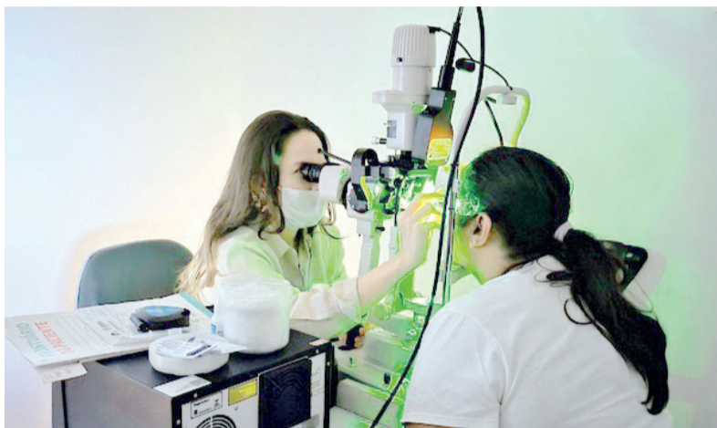
Equipamentos reforçarão atendimento a pacientes da rede pública do RN

Nesta fase, o Ministério da Saúde prevê a compra de 150