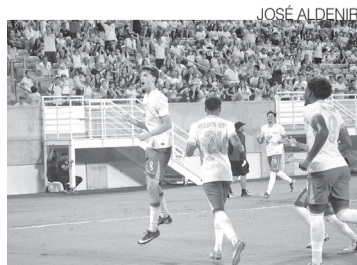
Sub-17 jogará de novo em Natal