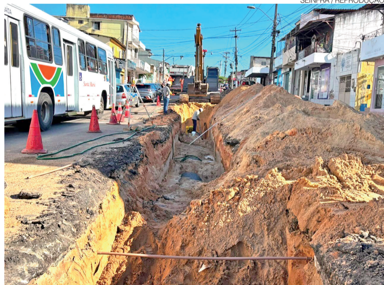
Obra realizada pela Seinfra representa solução definitiva para alagamentos na região