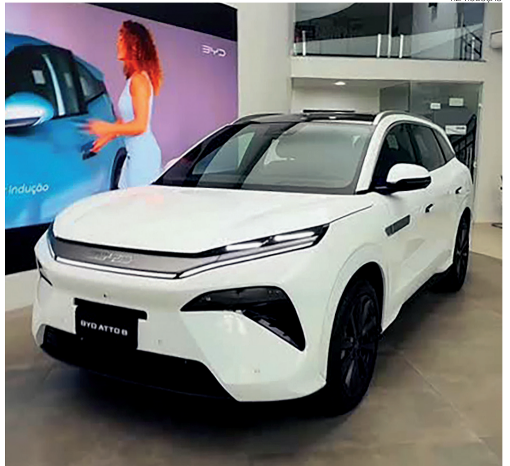
No RN, BYD Carmais já opera com loja na Avenida Prudente de Moraes e presença no Natal Shopping

Essa mudança envolve treinamento técnico, capacitação da equipe comercial, estrutura de oficina, ferramental específico, sistemas de diagnóstico avançados e atualização constante de software. O pós-venda também ganhou peso maior, especialmente no acompanhamento preventivo, nas atualizações eletrônicas e no suporte especializado. Em um carro cada vez mais conectado, parte da confiança do consumidor passa pela capacidade