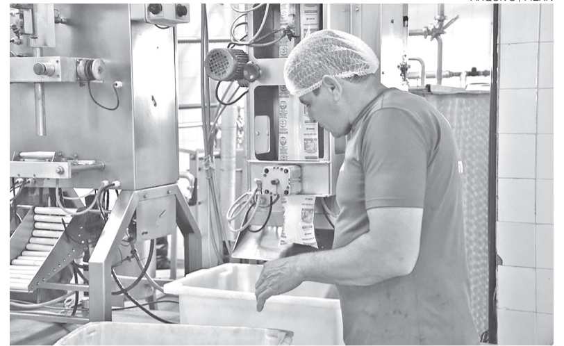
Indústria láctea no RN deve crescer, mesmo diante de desafios enfrentados

Em volume, a produção leiteira potiguar atingiu 394,5 milhões