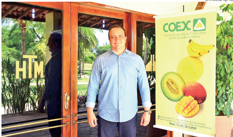
Representantes do agronegócio participarão de palestras e painéis sobre fruticultura

Fórum de Negócios da Fruticultura e o III Workshop de Monitoramento das Moscas-das-Frutas – Safra 2026 Terça 9 e quarta-feira 10 - Das 8h às 18h Auditório Amâncio Ramalho - Ufersa, Mossoró (RN) Gratuito | com certificado de participação | Inscrições: sigaa.ufersa.edu.br