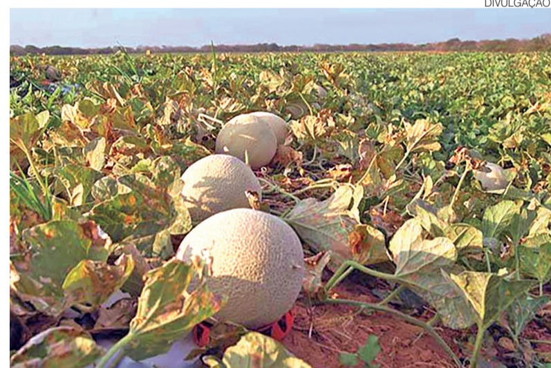
Evento em Mossoró reúne especialistas para discutir mercado da fruticultura

O segundo dia volta-se à internacionalização da agricultura familiar com cases reais de produtores e associações — e culmina no III Workshop de Monitoramento