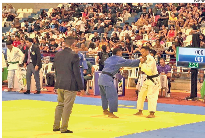
Judocas potiguares dominaram a competição, com grande número de medalhas

Nesta edição, além das delegações nordestinas, atletas do Paraná e do Rio Grande do Sul estiveram presentes, ampliando o alcance da competição e demonstrando o reconheci-