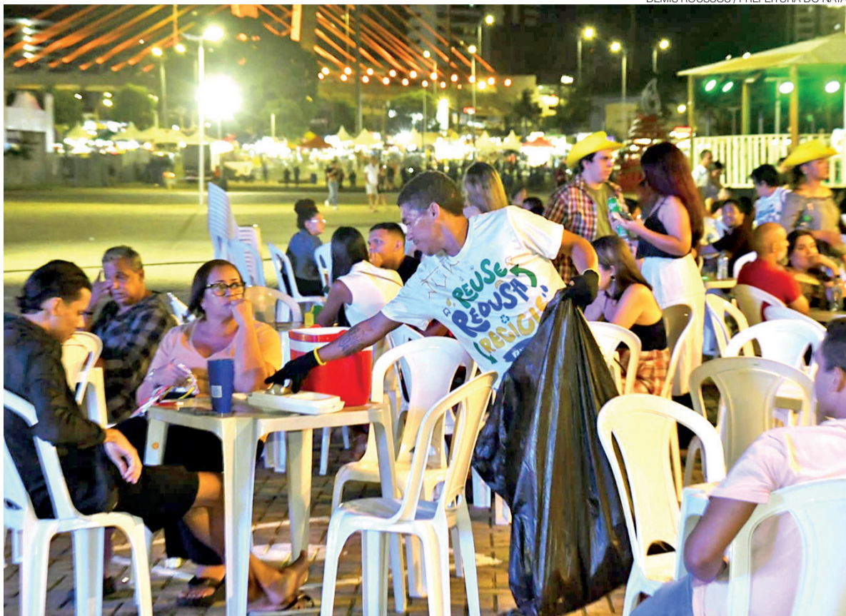
Catadores atuam na coleta seletiva durante o São João de Natal; projeto municipal alia geração de renda e reciclagem

O prefeito Paulinho Freire ressalta a importância ambiental e social da iniciativa. “O São João movimenta milhares de pessoas e gera quantidades significativas de resíduos. Por isso, criamos o projeto para transformar esse material descartável em recurso, além de orga-