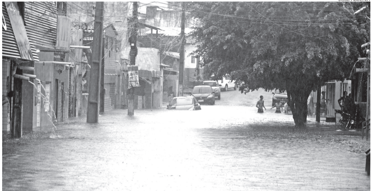
Moradores da Rua Vereador Cauby Barroca, nas Rocas, voltaram a enfrentar alagamentos após novas chuvas ontem

rua. Qualquer cidadão que tenha dúvidas ou precise de esclarecimentos pode procurar atendimento no Iern Zona Oeste, das 10h às 17h. Há também ações itinerantes.