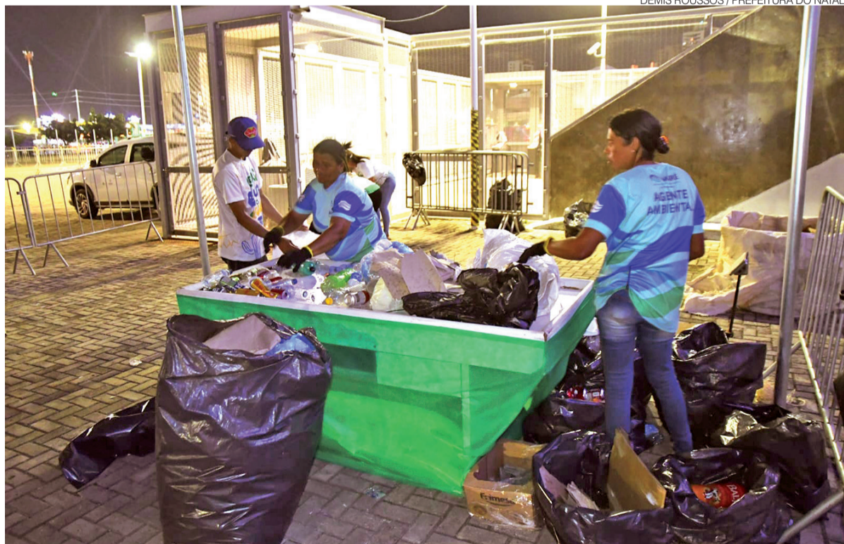
Estrutura instalada na Arena das Dunas recebe, faz a triagem e a pesagem dos materiais coletados durante o evento

recicláveis, os catadores deverão encaminhar os resíduos à Central do Catador, instalada