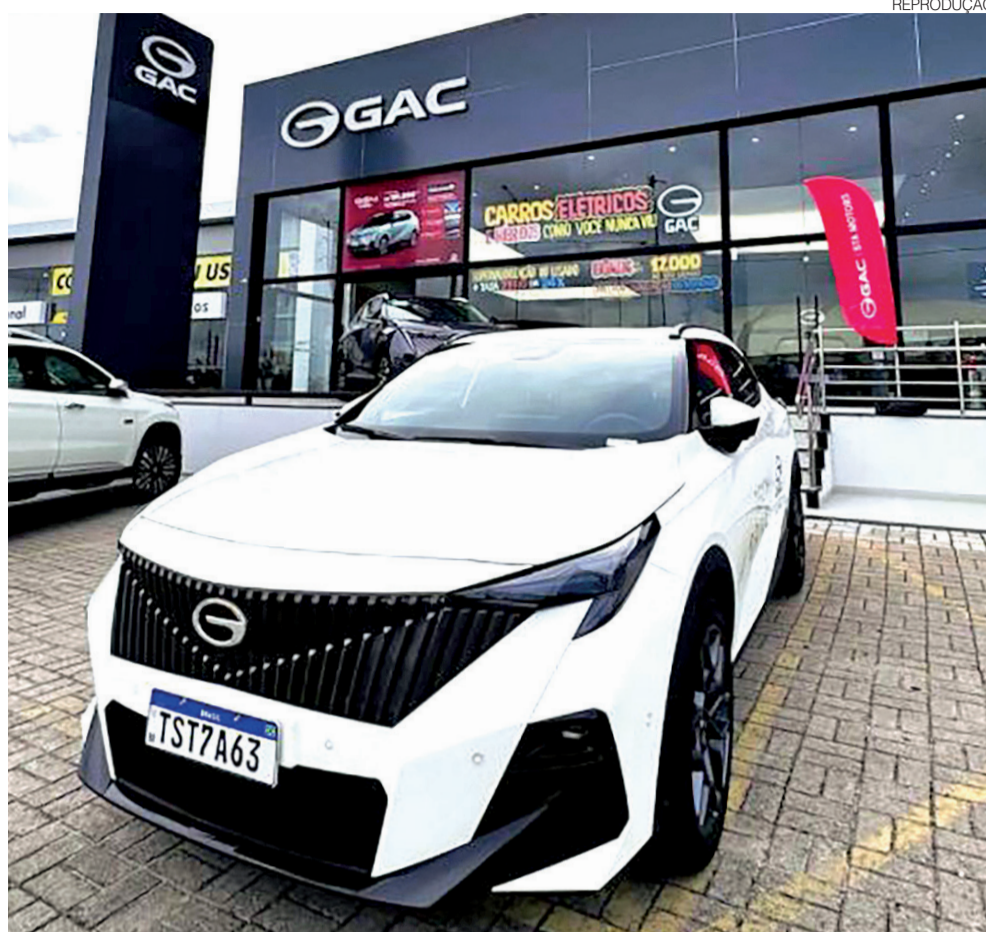
Concessionária GAC Motors em Natal, localizada na Avenida Prudente de Moraes, em Lagoa Nova

Para ele, o consumidor aceita conhecer uma marca nova quando percebe estrutura, transparência, pós-venda forte, garantia cla-