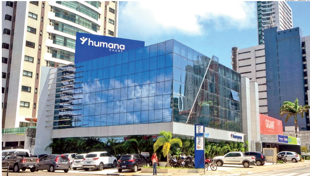
Sede administrativa da Humana Saúde em Natal, localizada na Avenida Prudente de Moraes, no bairro do Tirol

O executivo enfatiza que, em um mercado marcado por forte concorrência e alta exigência regulatória, a principal entrega de uma operadora não é um produto físico, mas a confiança. “O que nós vendemos no plano de