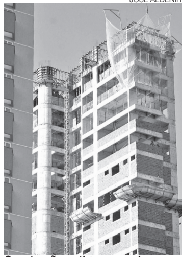
Construção potiguar quer inovar