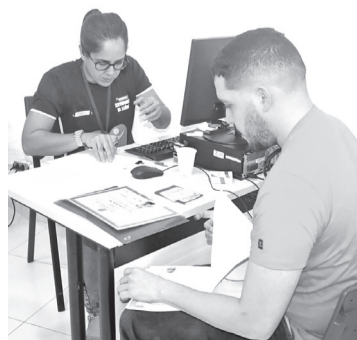
Documentos devem ser entregues na SMS