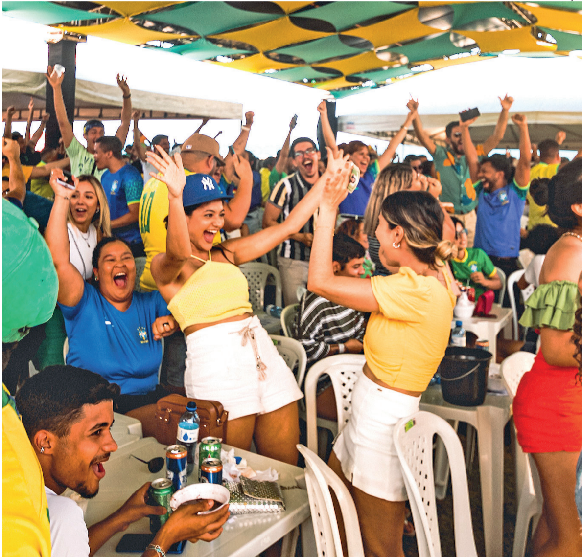
Complexo Rampa recebe edição especial da Patuscada na Copa, com transmissão da estreia da Seleção Brasileira

Com o lema "samba, suor, gela e gol", a proposta da festa é unir o público em uma