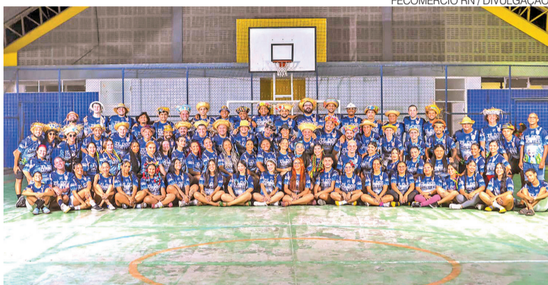
Apresentação dos grupos visa a incrementar vendas no comércio natalense