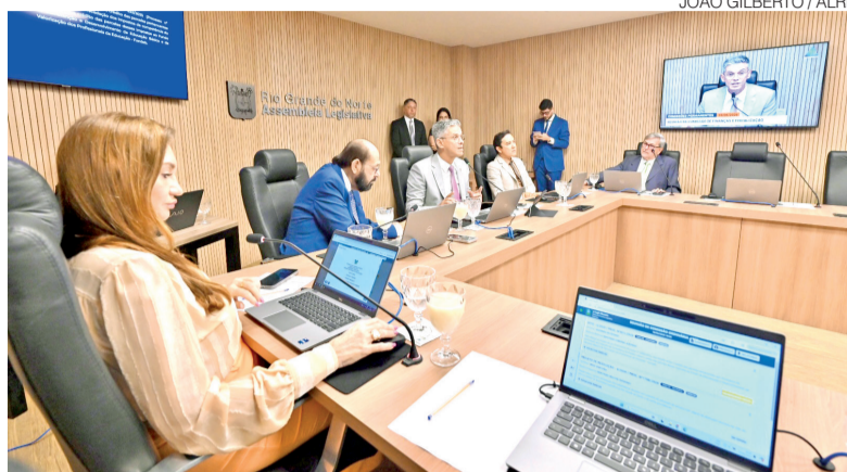
Reunião da Comissão de Finanças e Fiscalização da Assembleia nesta quarta

O veto da governadora foi publicado em janeiro, sob o argumento de que a proposta apresentava riscos à gestão financeira do Estado e invadia competências do Poder Executivo. Em parecer elaborado pela Secretaria Estadual da Fazenda (Sefaz), o governo sustentou que o projeto criava um modelo rígido de fluxo financeiro, interferindo na administração da Conta Única do Tesouro, na autonomia administrativa do Executivo e até mesmo no contrato de centralização da arrecadação fir-