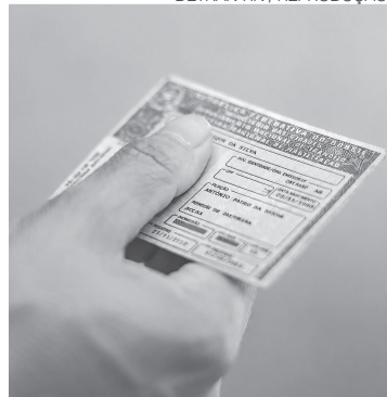
Exigência para CNH é prevista em lei