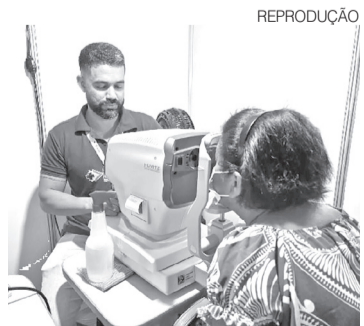
Carreta vai atender durante 45 dias

No RN, a Unidade Móvel de Oftalmologia iniciou suas atividades em fevereiro de 2026 e já contabiliza mais de 3,2 mil cirurgias de catarata e cerca de 4,5 mil consultas realizadas nas regiões do Trairi, Potengi e Vale do Açu. ●