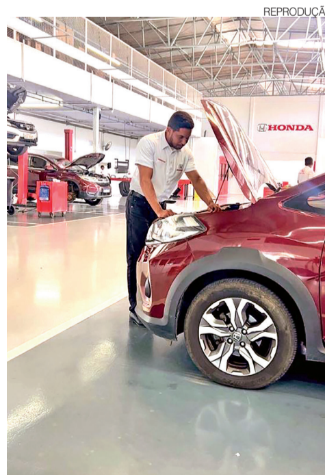
Marca oferece garantia total de fábrica de 6 anos

Para a Motoeste Honda, esse novo cenário aumenta o valor da rede autoriza-