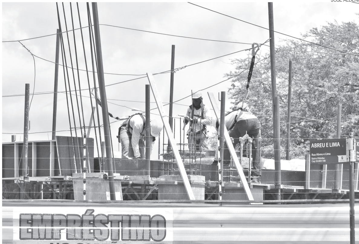
Números mostram um espelho de 2024, de acordo com pesquisa realizada pelo IBGE e trazem importância do setor no RN

O levantamento mostra que o setor mantinha 976 empresas em