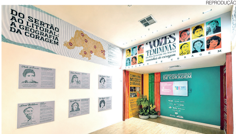
Mostra é gratuita e está aberta no Natal Shopping até o dia 30 de junho

A literatura e a cultura popular são representadas por Auta de Souza, uma das grandes vozes da po-