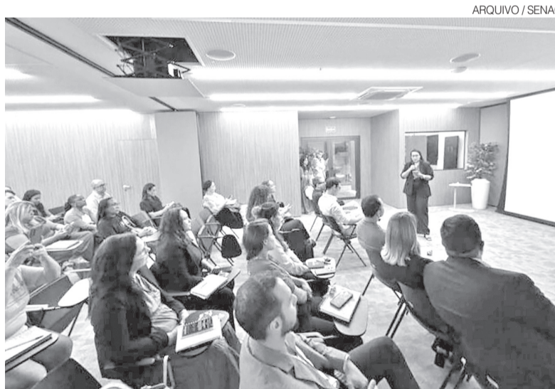
Cursos da Faculdade do Senac RN são voltados para necessidades do mercado

Segundo o presidente do Sistema Fecomércio RN e chanceler