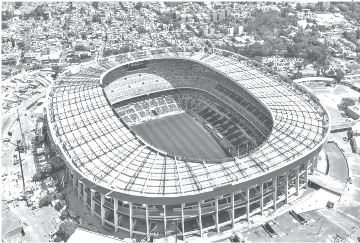
Estádio Azteca, no México, viu Pelé e Maradona brilharem nas copas de 1970 e 1986 e será palco de abertura hoje