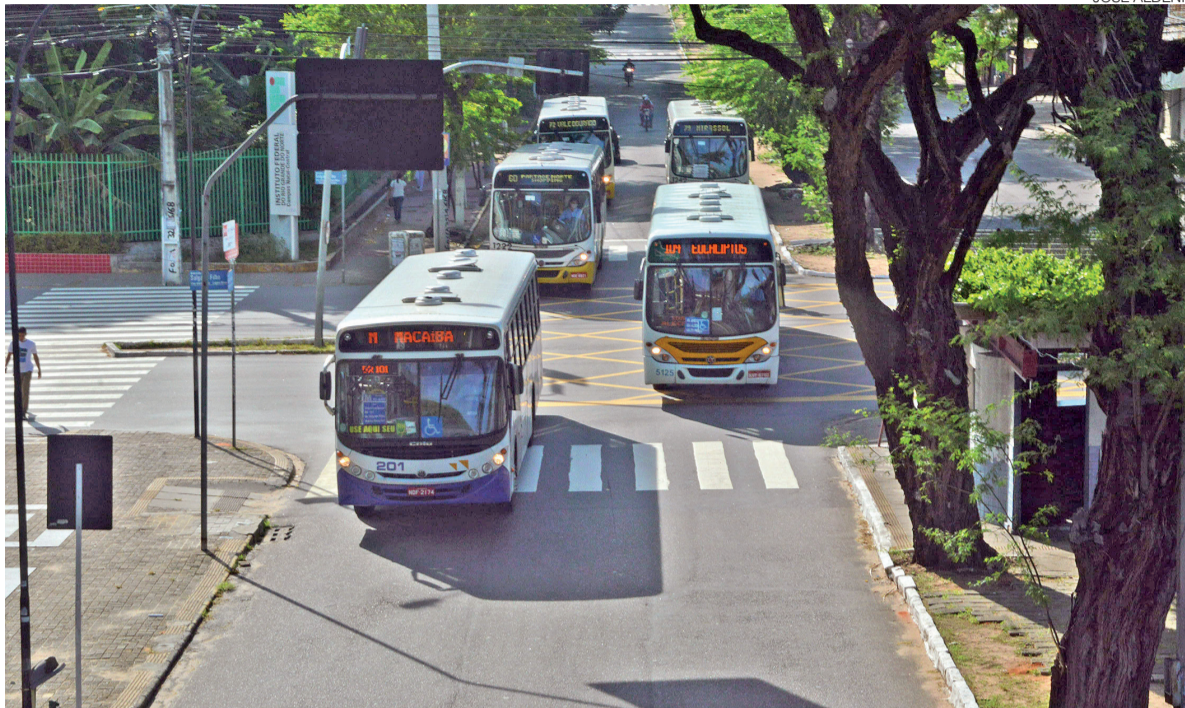
Novo modelo vai diferenciar tarifa pública, paga pelo passageiro, da tarifa técnica, que é o custo efetivo de operação do sistema

De acordo com a secretária, um dos principais fatores que motivaram essa revisão foi a sanção do pacote de benefícios aprovado pela Prefeitura do Natal para incentivar o uso do transporte coletivo. A nova legislação, que entrou em vigor em abril, criou medidas como a gratuidade dos ônibus aos domingos, o cashback das passagens aos sábados após o 5º dia útil, a gratuidade para estudantes da rede municipal e be-