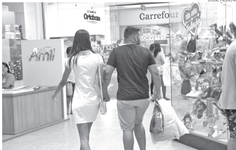
Em Natal, Mossoró e Parnamirim, maior parte da população vai às compras

Em Mossoró, segundo maior polo econômico do Estado, a expectativa é de movimentação de R$ 42,1 milhões, crescimento de 5,3% em relação ao ano anterior. O percentual supera a média estadual e confirma a consolidação