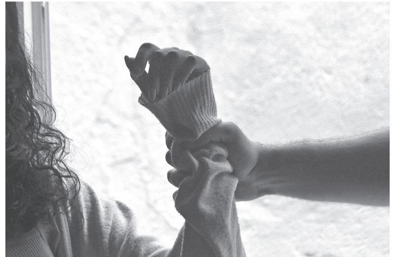
Estudo avaliou ações voltadas à proteção de crianças e adolescentes vítimas

A preocupação está alinhada à Lei Federal nº 13.431/2017, co-