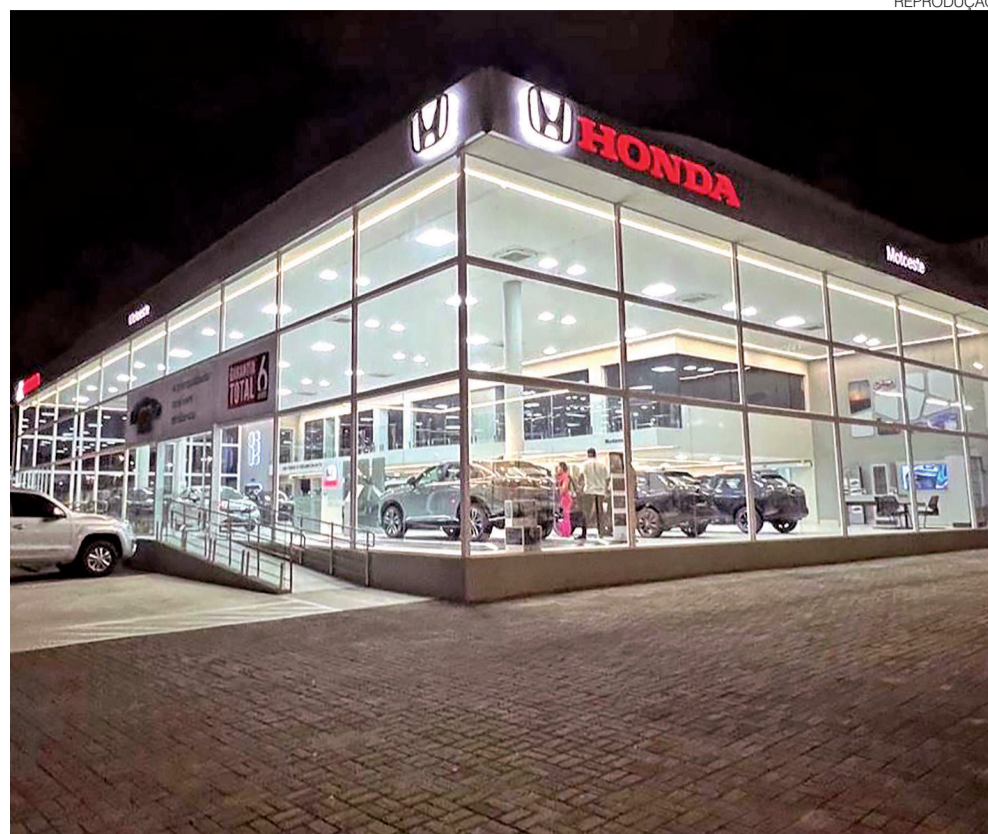
Concessionária Motoeste Honda: Chegada dos eletrificados exige mudança na estrutura das lojas