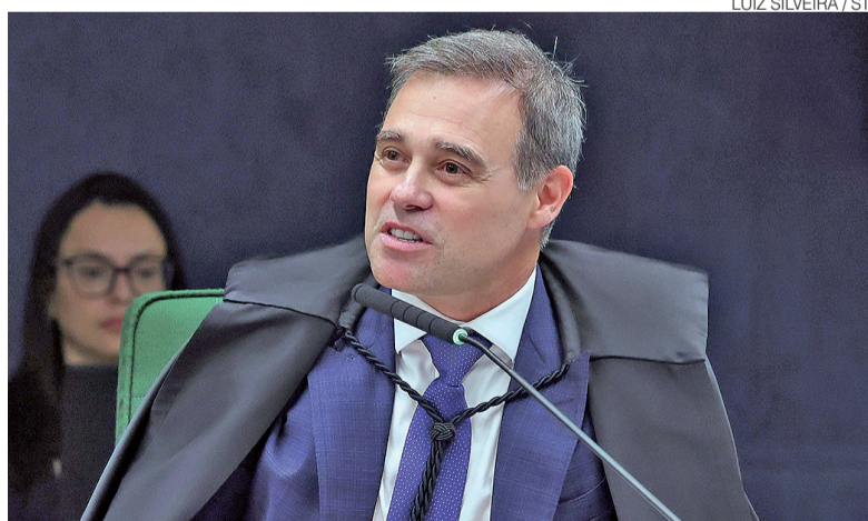
Nos bastidores, medida é atribuída ao avanço de ações de André Mendonça