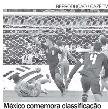
México comemora classificação

Os Estados Unidos, considerados o principal anfitrião da competição por receberem a maioria dos jogos e a final, apresentam a campanha mais consistente até o momento. A seleção norte-americana estreou com vitória por 4 a 1 sobre o Paraguai e chegou aos seis pontos após derrotar a Austrália por 2 a 0. O resultado deixou a equipe isolada na liderança do Grupo D e praticamente garantiu a classificação na próxima fase. ●