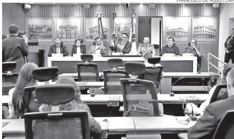
Autoridades reunidas em audiência pública na Câmara Municipal nesta sexta-feira

Na avaliação do representante do Sinduscon, a complexidade das normas atuais acaba estimulando a irregularidade urbanística. “A maioria dos imóveis de Natal, do ponto de vista urbanístico,