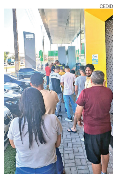
Motoristas de app fizeram fila em Natal

Para participar, os motoristas de aplicativo devem comprovar pelo menos 12 meses de atuação