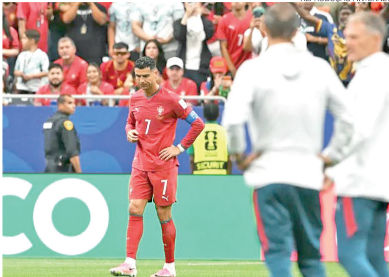
Cristiano Ronaldo teve atuação abaixo da média na estreia diante do Congo

A repercussão ganhou força nos dias seguintes à partida, especialmente após veículos portugueses, espanhóis e ingleses levantarem dúvidas sobre o ambiente interno da seleção. O histórico recente contribuiu para o cenário de tensão. Desde a Eurocopa de 2024 e as últimas edições da Liga das Nações, o debate sobre a dependência de Portugal em relação a Cristiano tornou-se recorrente, com parte da imprensa defendendo uma renovação mais acelerada da equipe e maior protagonismo para atletas como Rafael Leão, João Neves, Gonçalo Ramos, Vitorinha e Bernardo Silva.