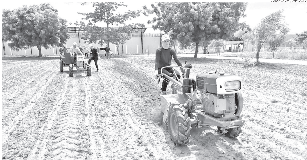
Tratoritos, ou pequenos tratores, vêm sendo desenvolvidos por fábrica chinesa especificamente para o bioma da caatinga

A possibilidade de instalação de uma fábrica ocorre em um momento em que a mecanização da