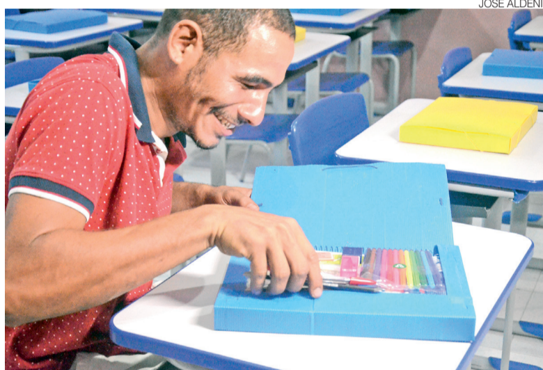
Governo do RN atribui resultado a ampliação da Educação de Jovens e Adultos

A estratégia conta com uma rede de articuladores estaduais, regionais e municipais responsáveis pelo acompanhamento das ações pedagógicas. Entre as medidas implementadas estão a distribuição de materiais complementares para mais de 190 mil estudantes, a implantação de Cantinhos de Leitura nas escolas e a concessão de bolsas voltadas à formação continuada de profissionais da educação e à mobiliza-