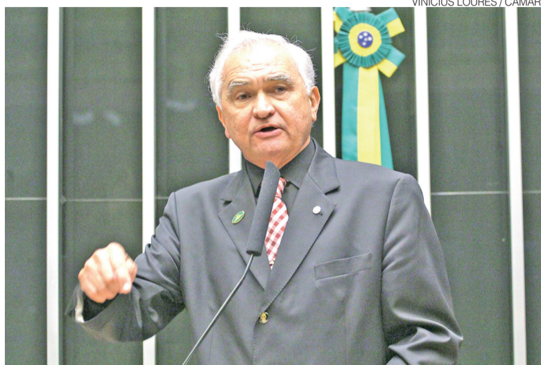
Deputado federal do PL diz que governo atrasou emendas nas últimas eleições

O parlamentar também apresentou um balanço das ações realizadas durante seus primeiros