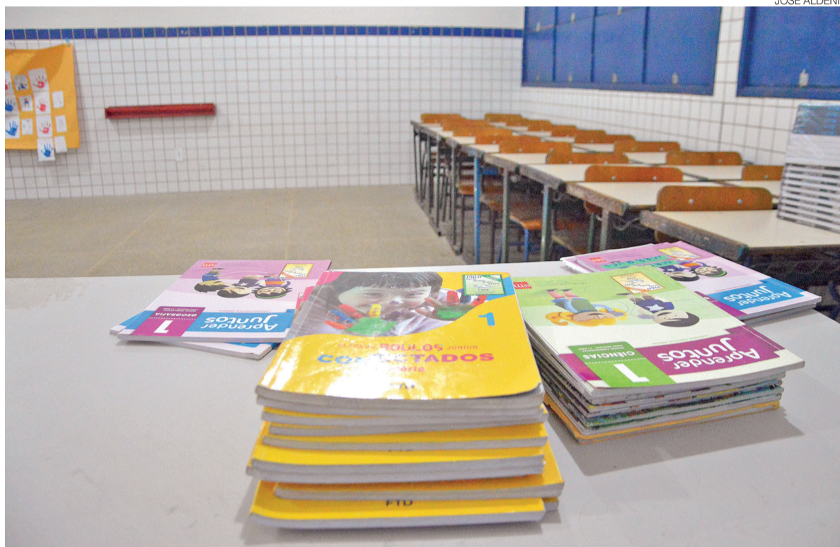
Pela primeira vez na série histórica da Pnad Contínua, taxa de analfabetismo do RN ficou abaixo de 10%, atingindo 9,3%

“Pela primeira vez, o Rio Grande do Norte reduz sua taxa de analfabetismo para menos de 10%, um marco que demonstra que investir em educação pública, com planejamento, compromisso e parceria com os municípios, produz resultados concretos na vida das pessoas. Esses números refletem o trabalho diário de professores, gestores, servidores, estudantes e famílias, além dos investimentos que estamos realizando desde a alfabetização das crianças até a Educação de Jovens e Adultos. Avançamos na permanência dos estudantes na escola, ampliamos o acesso à educação e fortalecemos políticas que garantem o direito de aprender em todas as etapas da vida. Ainda temos desafios importantes pela frente, mas os da-