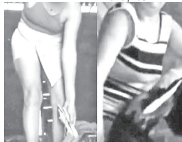
Caso aconteceu em Marcelino Vieira