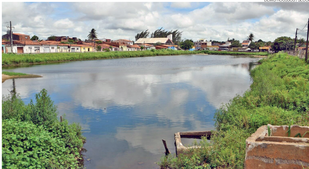
Moradores afetados pelo transbordamento da lagoa de captação poderão ser beneficiados com isenção de tributos

A proposta tem como objetivo minimizar os impactos enfrentados pelas famílias afetadas pelas fortes chuvas que atingiram a região. A iniciativa beneficia proprietários de imóveis edificadas