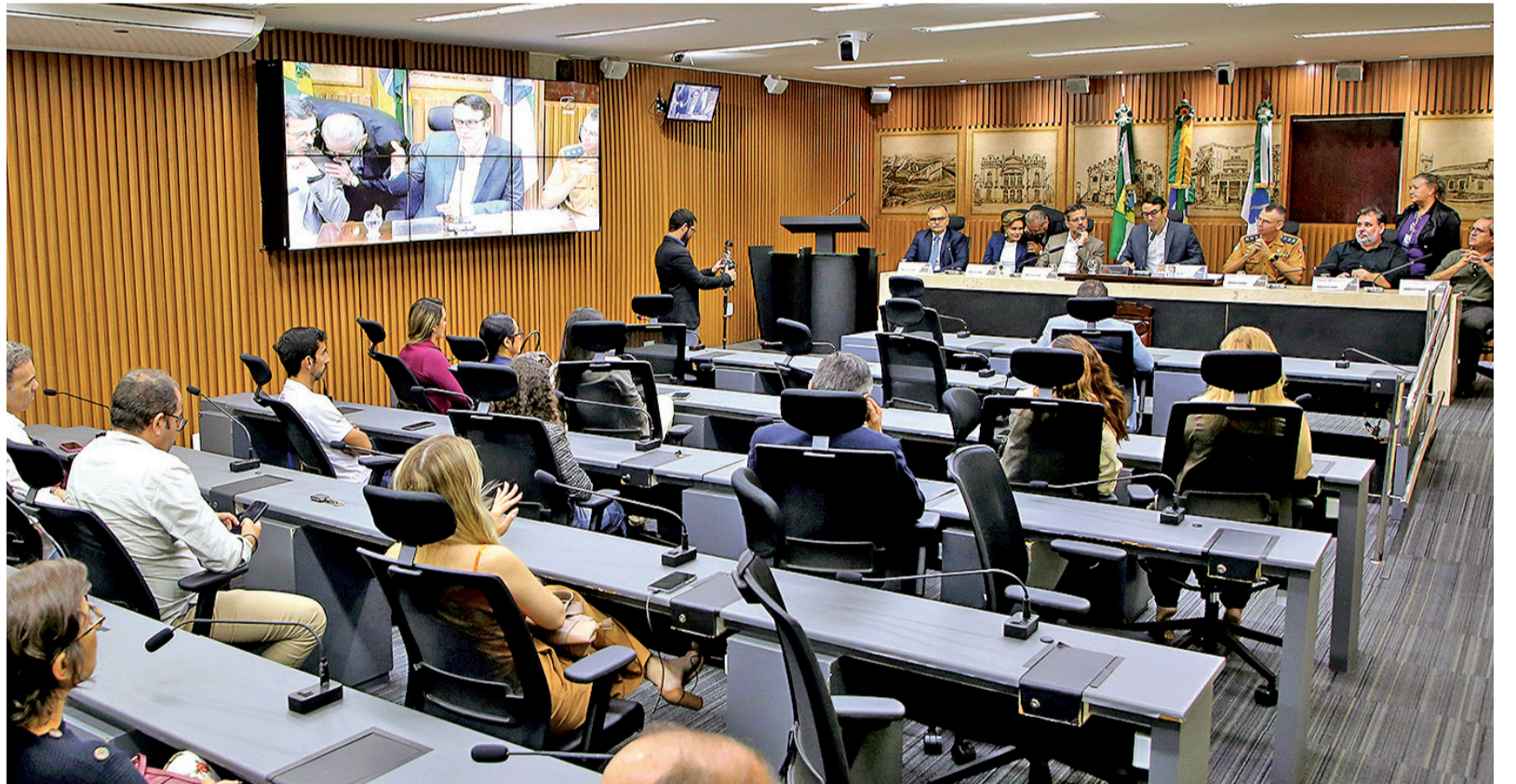
FRANCISCO DE ASSIS / CMN

para mais de 190 mil estudantes, a implantação de Cantinhos de Leitura e a Política de Superação do Analfabetismo, que já alfabetizou mais de 10 mil pessoas.