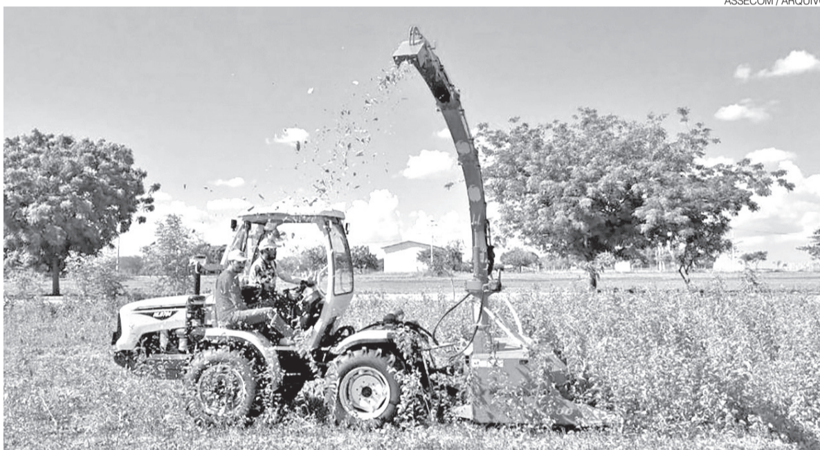
Pequenas máquinas que preparam solo para plantio, além de colheitadeiras menores, também estão em fase de teste

agricultura familiar ganha espaço nas políticas públicas voltadas ao desenvolvimento rural. Segundo dados do Instituto Brasileiro de Geografia e Estatística (IBGE), a agricultura familiar é a principal atividade econômica em 139 municípios potiguares, o equivalente a 83% das cidades do Estado. Apesar disso, a utilização de máquinas agrícolas ainda é limitada.