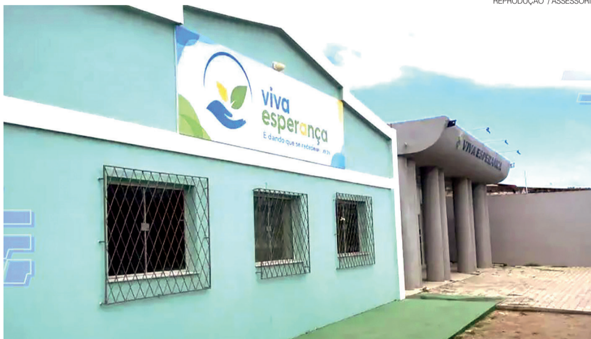
Ação acontecerá na sede do Instituto Viva a Esperança, com atendimentos nos dois turnos pela equipe do Sebrae-RN

Durante a ação, equipes técnicas do Sebrae-RN prestarão atendimento individualizado sobre formalização de