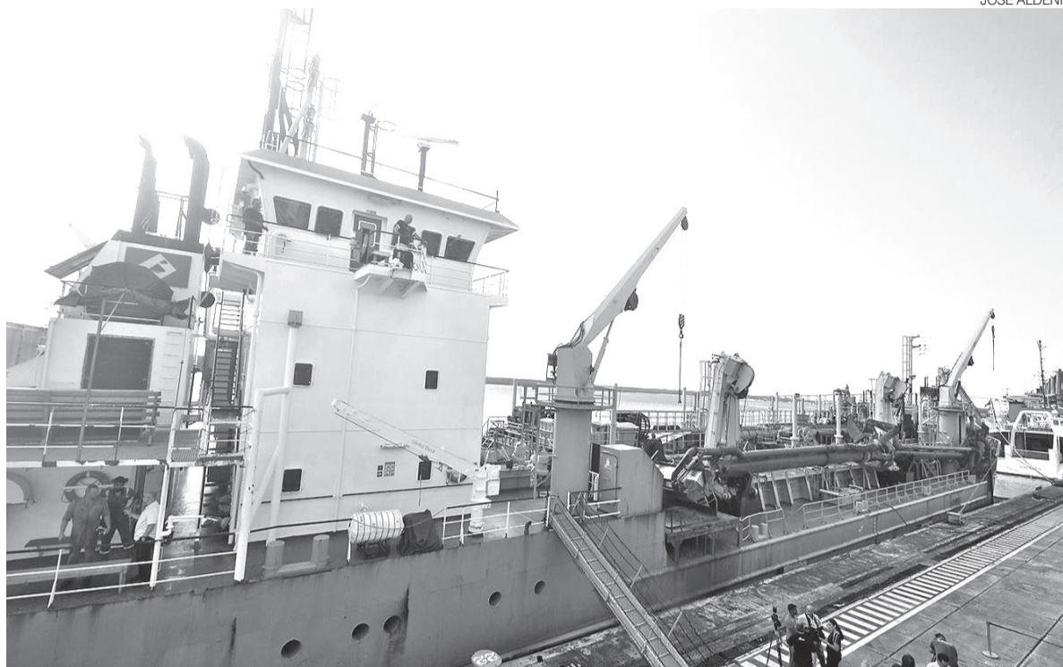
Custo total da obra de dragagem será de R$ 60 milhões e a modernização do porto faz de um conjunto de obras do PAC

Com investimento estimado em R$ 60 milhões, a intervenção tem como principal objetivo res-