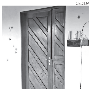
Marcas de tiros na entrada da casa

A versão apresentada pela família diverge do relato policial. Segundo a policial militar que estava na casa, ela se encontrava no imóvel com o marido e o irmão quando o pai percebeu movimentação do lado de fora. Conforme o relato, ele dormia em uma área externa e acordou após ouvir o portão ser derrubado, correndo para alertar os demais ocupantes da residência. A defesa sustenta que o casal não identificou os agentes como policiais e acreditou estar diante de uma ação criminosa. ●