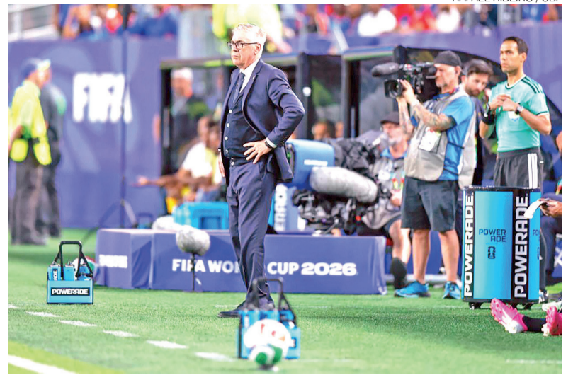
Ancelotti garante que Neymar Jr. enfrenta a Escócia, porém, no 2º tempo

Martinelli afirmou estar preparado para atuar em qualquer função necessária. "Eu, particularmente, prefiro jogar pela esquerda, mas no Arsenal já fiz a direita. Estamos todos dando o melhor para estarmos preparados. A decisão é do mister",