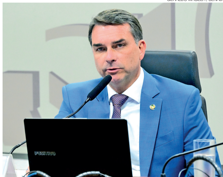
Flávio Bolsonaro pretende apresentar defesa contra tarifaço em 5 minutos

A proposta de criação da tarifa surgiu após a conclusão de uma investigação conduzida pelo Escritório do Representante de Comércio dos Estados Unidos (USTR), com base na chamada Seção 301 da legislação comercial ame-