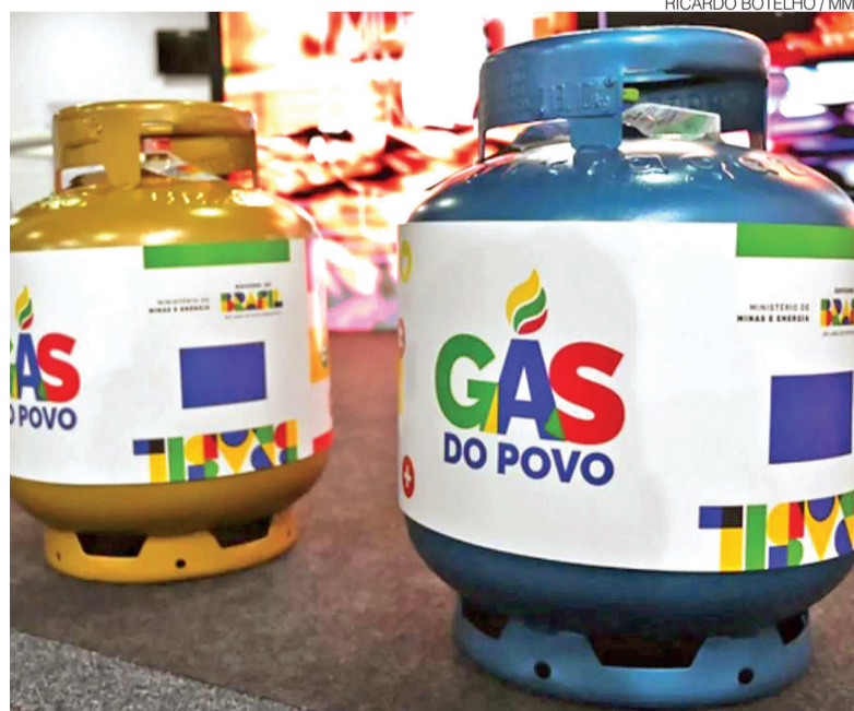
Distribuidoras de GLP e indústrias siderúrgicas em atrito no Programa Gás do Povo

A proposta provocou reação de fabricantes de botijões, for-