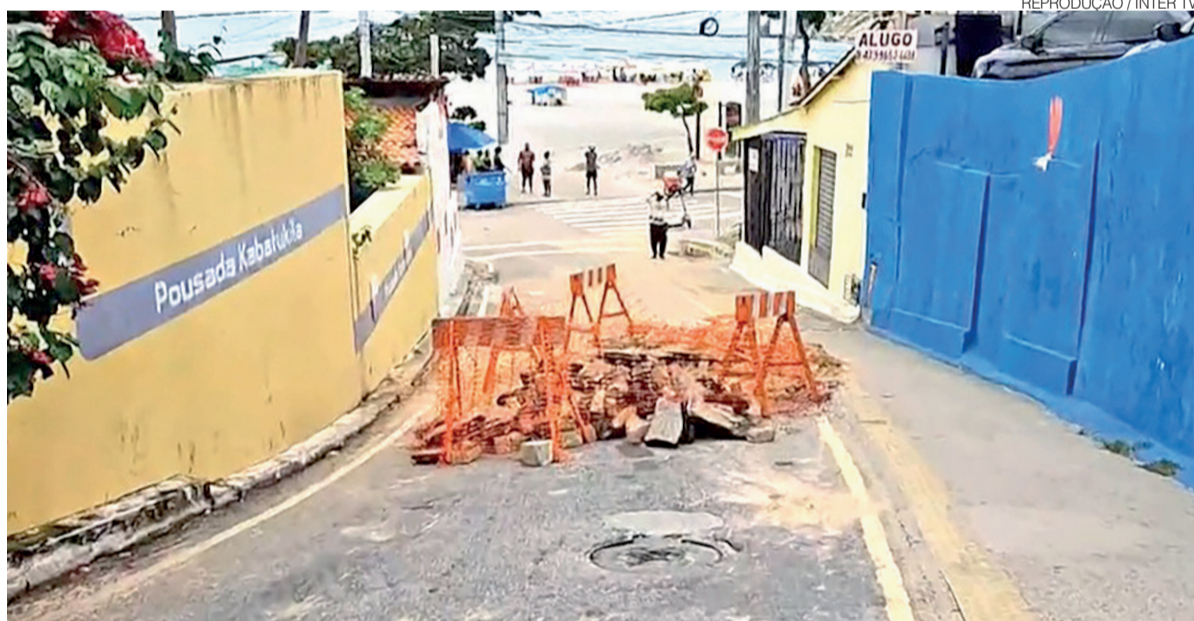
Enquanto a obra segue em andamento, veículos são desviados pela Avenida Augusto Magalhães para chegar à orla

Os motoristas estão sendo direcionados para realizar retorno pela Avenida Augusto Magalhães. Com isso, o acesso de carros, caminhões e veículos de maior por-