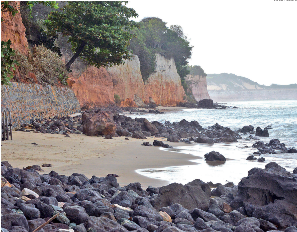
Parte de uma falésia desabou na madrugada desta terça-feira na Praia de Pipa, em Tibau do Sul; ninguém ficou ferido

A Prefeitura informou que mantém ações permanentes de orientação e conscientização junto a moradores, comerciantes e turistas que frequentam a área. O objetivo é reforçar a prevenção