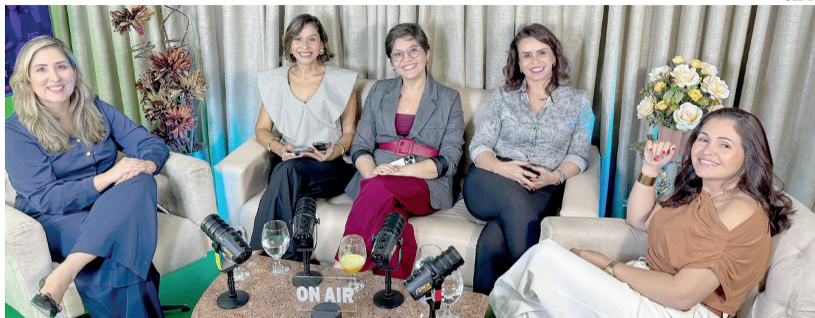
Evento na capital potiguar reunirá especialistas das áreas de psicologia, direito, compliance e segurança do trabalho

A NR-1 trata das disposições gerais e do Gerenciamento de Riscos Ocupacionais (GRO), que deve se materializar no Programa de Gerenciamento de Riscos (PGR). O Ministério do Trabalho e