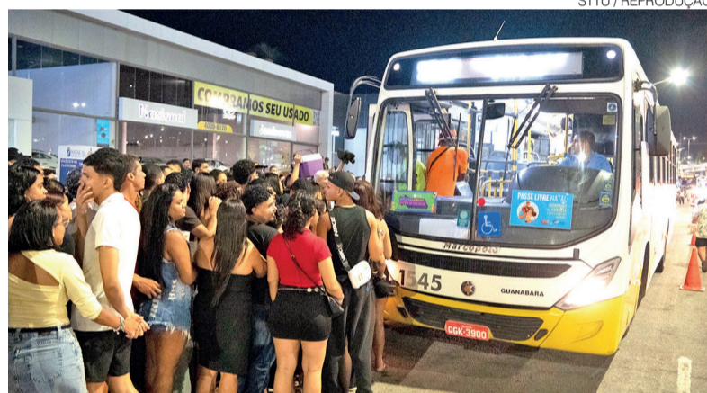
Mais de 16 mil passageiros utilizaram linhas especiais disponibilizadas