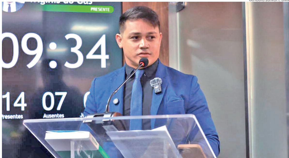
Vereador Cabo Deyvison vinha publicando conteúdos nas redes sociais enfrentando facções criminosas em Mossoró