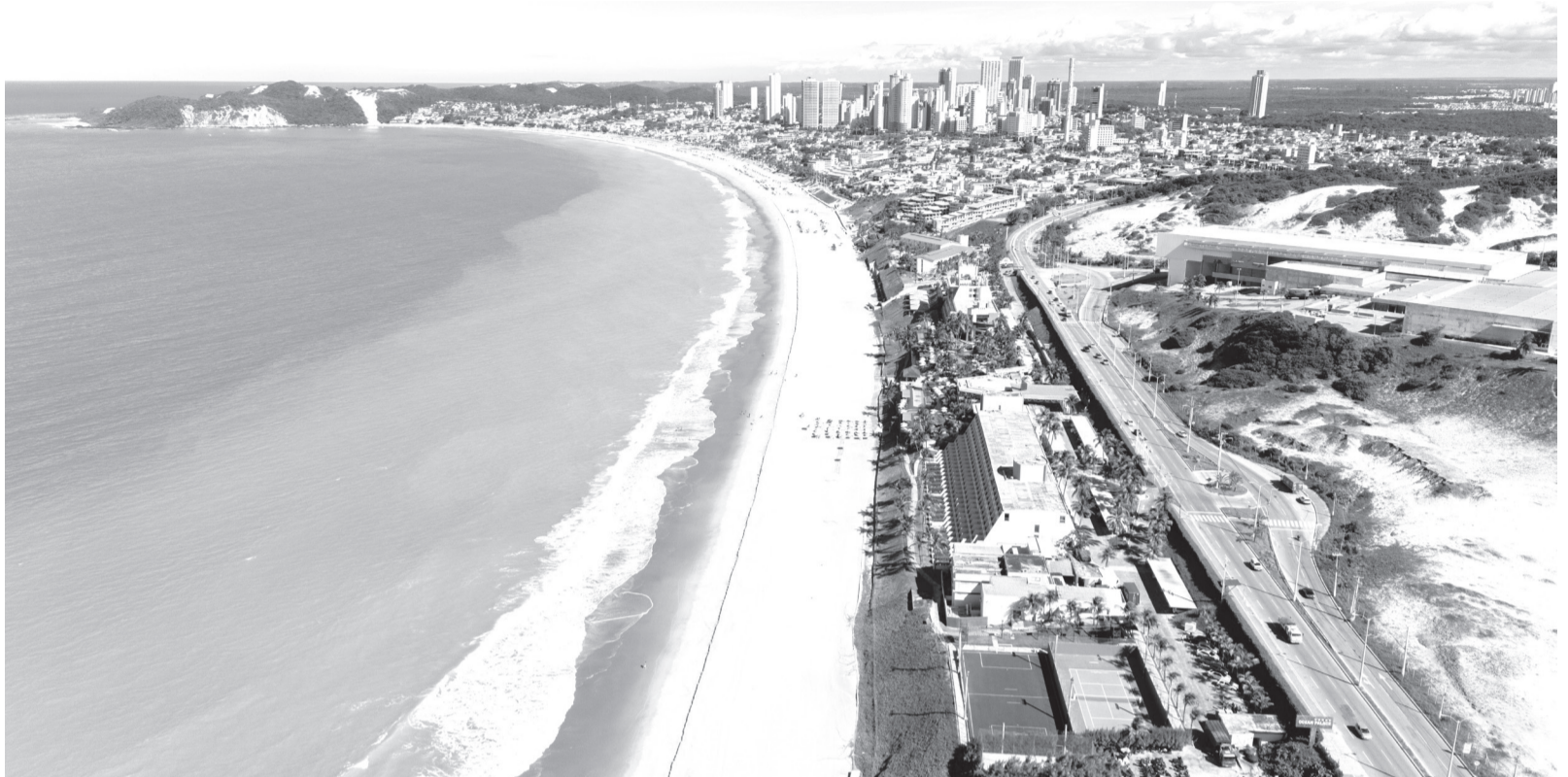
Vídeos com vista aérea das praias urbanas de Natal, como a Via Costeira, além dos litorais Norte e Sul, estão atraindo turistas do mundo inteiro para Natal

Entidade investe em conteúdo audiovisual e banco de imagens para fortalecer divulgação do Estado em meio à expansão da malha aérea e ao crescimento da atividade turística