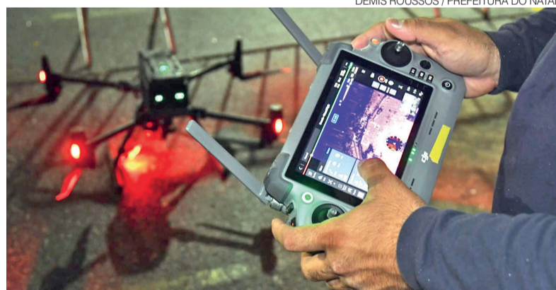
Com apoio dos drones, foram realizadas 294 operações durante o evento