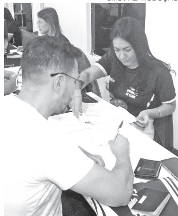
Candidatos devem ir à SMS

USINA DE ENERGIA EÓLICA SÃO JOÃO SPE S.A. – SUBSIDIÁRIA INTEGRAL CNPJ/MF 14.535.646/0001-88 - NIRE 24.300.005.644