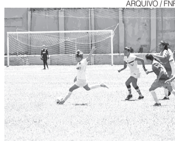
Sistema de disputa será definido

A confirmação dos participantes ocorre em um momento de expansão da modalidade no país. Nos últimos anos, a CBF ampliou o calendário nacional, criou novas divisões do Campeonato Brasileiro Feminino e retomou a Copa do Brasil Feminina, aumentando as oportunidades esportivas e de visibilidade para clubes de mercados regionais. ●