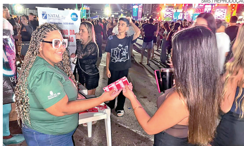
SMS distribuiu mais de 97 mil insumos de prevenção às ISTs no polo Arena

Como estratégia de sensibilização e divulgação dos canais de atendimento, a Semul distribuiu 1.500 leques informativos ao público em cada fim de semana na Arena das Dunas. Os banheiros químicos instalados nos espaços de festa também receberam adesivos com informações sobre os serviços disponíveis e orientações para que mulheres em situação de violência ou vulnerabilidade saibam onde buscar ajuda.