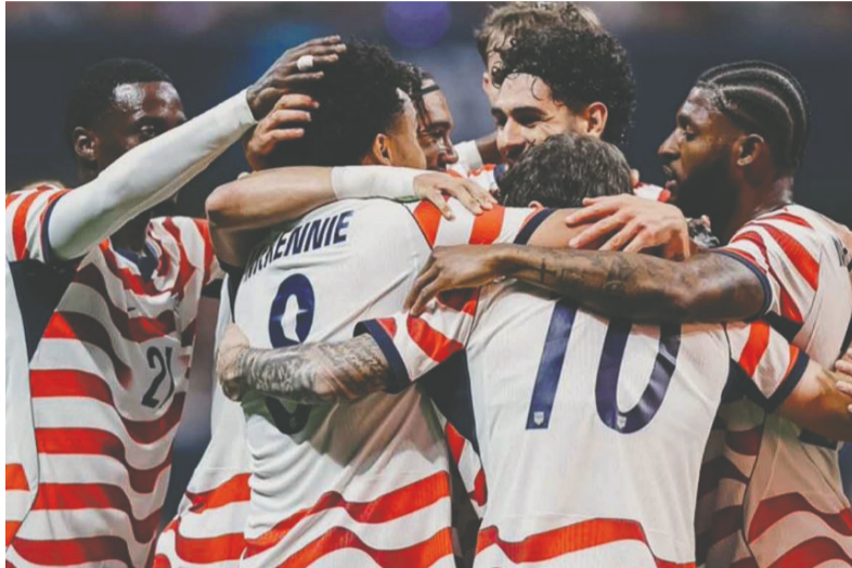
Seleção norte-americana comemorando mais um gol em partida desta Copa

A seleção dos Estados Unidos chega à última rodada da fase de grupos da Copa do Mundo de 2026 com um objetivo que vai além da classificação à fase 16 avos de final. A equipe comandada por Mauricio Pochettino pode encerrar a primeira etapa da competição com a melhor campanha geral entre as 48 seleções participantes caso confirme o favoritismo diante da Turquia, nesta quinta-feira 25, e mantenha o desempenho que a co-