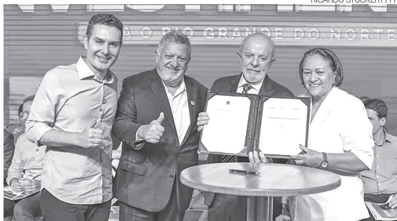
Presidente Lula, governadora Fátima Bezerra e ministros em Brasília

Entre os empreendimentos anunciados, o sistema de esgotamento sanitário de Apodi recebe-