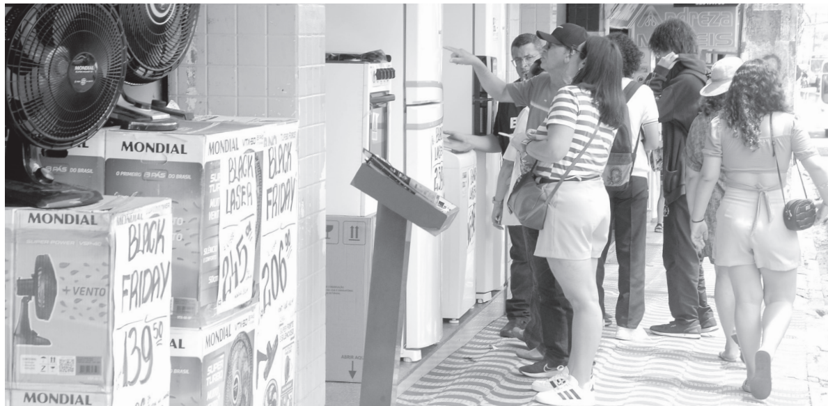
Comércio terá horários especiais na próxima segunda-feira para os jogos da Seleção Brasileira pela Copa do Mundo