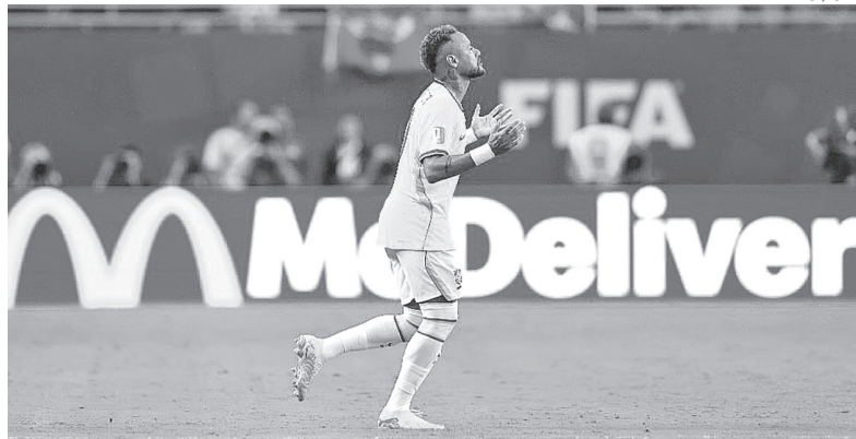
Neymar entrando em campo no segundo tempo da partida contra a Escócia

O novo recorde amplia também a lista de marcas acumuladas por Neymar com a camisa da Seleção. O atacante integra o seleto grupo de brasileiros convocados para quatro Copas do Mundo, ao lado de Castilho, Nilton Santos, Djalma Santos, Pelé, Emerson