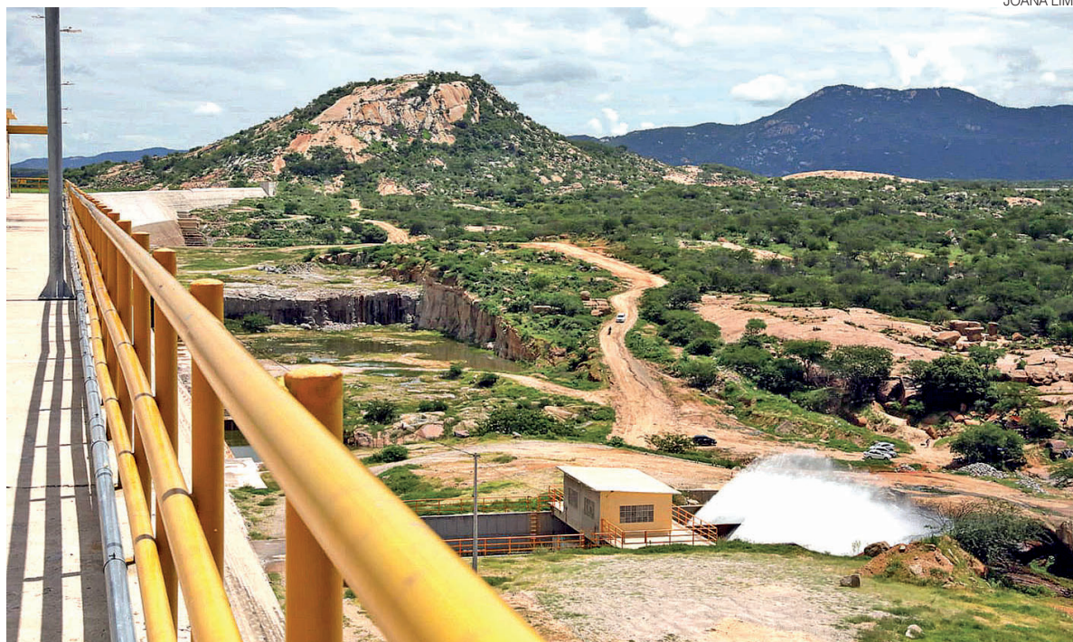
Transferência gradual da água entre Oiticica e Armando Ribeiro Gonçalves ocorrerá ao longo dos próximos meses

“Se eu pudesse definir a Lei das Águas, ou a Lei 9.433, eu faria dizendo que é a lei do diálogo. Um dos instrumentos que mais me enchem de alegria é exatamente a alocação negociada de águas. A gente está muito acostumado com as coisas autocráticas. É o secretário que define no birô, é a Agência Nacional de Águas que decreta lá de Brasília. A Lei das Águas vem rompendo esse processo e propõe exatamente que, em conjunto, os órgãos gestores, a Secretaria, o Igarn, a