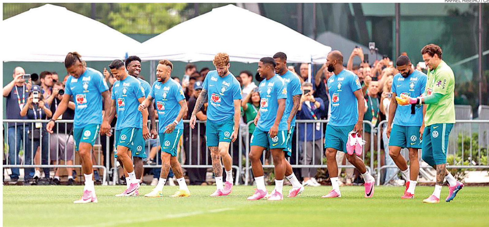
Jogadores da Seleção Brasileira participaram de um treino descontraído já na preparação para o jogo decisivo contra o Japão na próxima segunda-feira, 29

Não participaram do treinamento com bola o goleiro Alisson, o lateral Danilo, os zagueiros Marquinhos e Gabriel Magalhães, os meio-campistas Casemiro, Bruno Guimarães e Lucas Paquetá, além do atacante Matheus Cunha. Segundo a comissão técnica, nenhum deles apre-