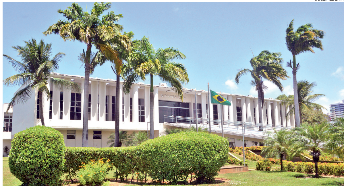
RN comprometeu 56,12% da receita com despesa total de pessoal do Poder Executivo no 1º quadrimestre deste ano

O relatório do Tesouro também mostra que o Rio Grande do Norte lidera o País no peso dos precatórios. Até o primeiro quadrimestre, o estoque dessas dívidas judiciais representava 36,1% da Receita Corrente Líquida do Estado, maior proporção nacional. Em seguida, aparecem Rio Grande do Sul, com 25%, e Paraíba, com 22%. Na outra ponta, Pará e Pernambuco registraram apenas 0,4%, enquanto o Espírito Santo apresentou 0,6%. O indicador reforça uma pressão adicional sobre as contas públicas potiguares, mesmo em um estado que não está entre os mais endi-