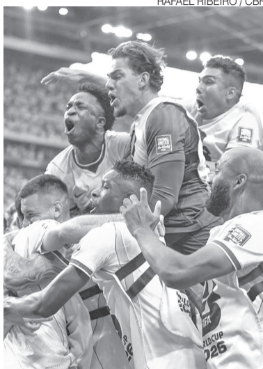
Jogadores comemoraram muito

finiu o confronto como "épico" e destacou o drama vivido pela Seleção até os acréscimos, quando Gabriel Martinelli marcou o gol da vitória. A publicação ressaltou que o Brasil encontrou dificuldades diante da organização defensiva japonesa, mas conseguiu transformar o domínio territorial em classificação nos instantes finais. O jornal também apontou a recuperação de Casemiro, que falhou no lance do gol de Kaishu Sano, mas empatou a partida de cabeça no segundo tempo.