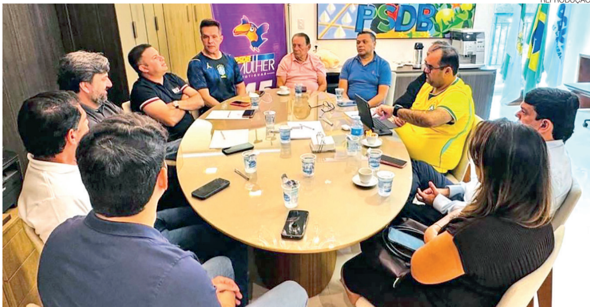
Reunião dos dirigentes da federação PSDB/Cidadania: grupo é cortejado por pré-candidatos ao Governo do RN