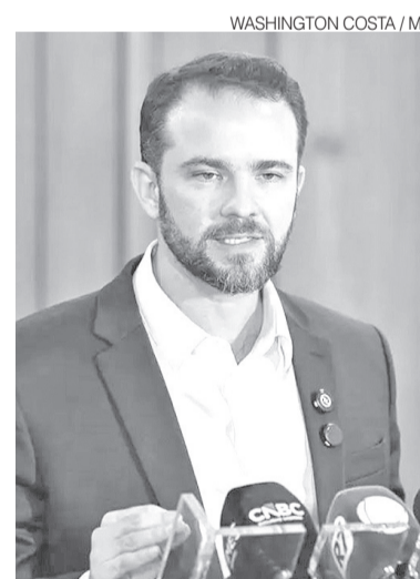
Dario Durigan, ministro da Fazenda

Segundo Dario Durigan, a ampliação do programa representa uma mudança de foco em relação ao Desenrola original, lançado em 2023 para renegociar dívidas de inadimplentes. "Quando a gente está falando de um país que tem uma economia forte, uma economia organizada e que trouxe para o debate econômico do País a justiça social e a justiça tributária, nós temos que fazer