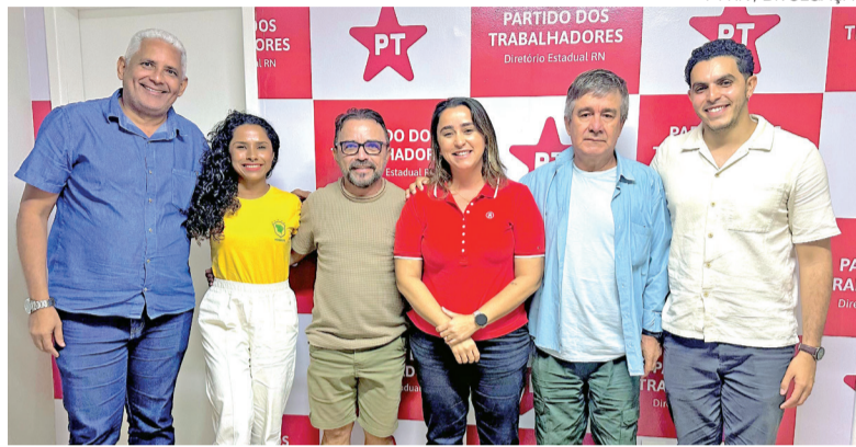
Dirigentes das duas siglas se reuniram nesta segunda-feira na sede do PT

A carta destaca a parceria construída entre PT e Psol no cenário na-