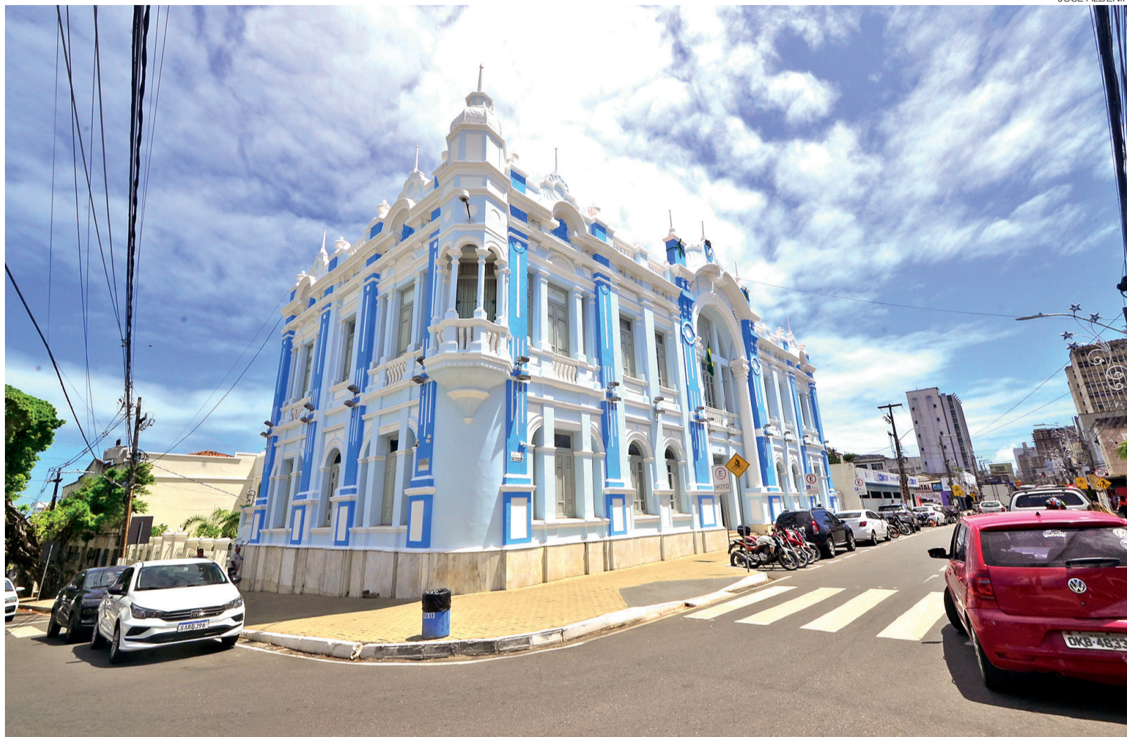
Novo Código de Ética dos Agentes Públicos do Executivo de Natal estabelece regras para servidores, prestadores de serviço, estagiários e colaboradores

As denúncias e comunicações de violações ao código deverão ser feitas pelos canais institucionais da Prefeitura. O decreto, publicado semana passada no Diário Oficial do Município, assegura ainda a preservação da identidade do denunciante e proíbe qualquer medida