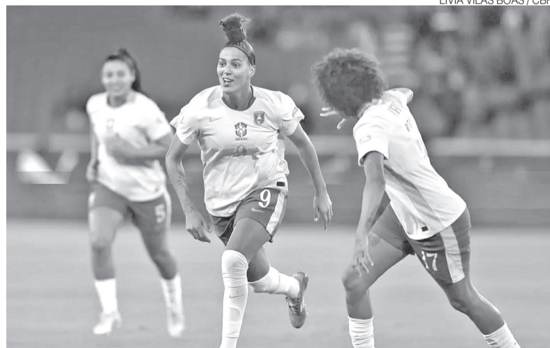
Brasil sediará Copa do Mundo da Fifa de futebol feminino no próximo ano

A publicação da lei faz parte da preparação institucional para a realização do Mundial, cuja organização envolve adequações tributárias, operacionais e de infraestrutura exigidas pe-