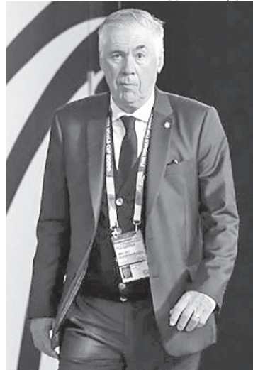
Ancelotti mudou de opinião no jogo