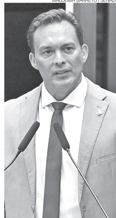
Senador Styvenson Valentim (Podemos)

Em despacho assinado na última quinta-feira 25, a juíza Sulamita Bezerra Pacheco, do Tribunal Regional Eleitoral (TRE-RN), determinou que o senador se manifeste, no prazo de um dia, sobre uma possível falta de legitimidade para propor esse tipo de ação. A magistrada observou que, seguindo a jurisprudência do TRE-RN e de outros tribunais, pré-candidatos, atuando isoladamente, não possuem legitimidade para propor ações por propagan-