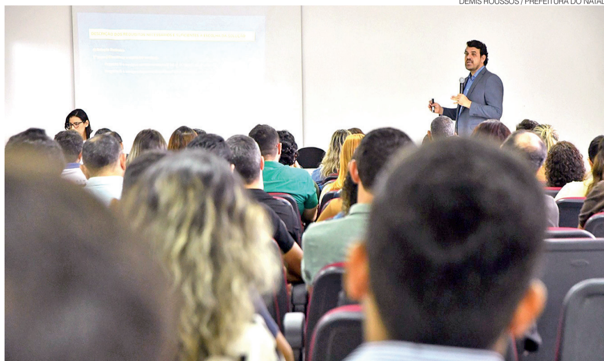
Prefeitura prevê capacitação das equipes; decreto determina assegura proteção ao denunciante de irregularidades

brindes sem valor comercial ou aqueles cujo valor de mercado seja inferior a 1% do teto do subsídio municipal, desde que distribuídos de forma generalizada a título de cortesia ou propaganda. Presentes recebidos por protocolo diplomático ou cerimonial que superem esse valor deverão ser incorporados ao acervo do patrimônio público do Município.