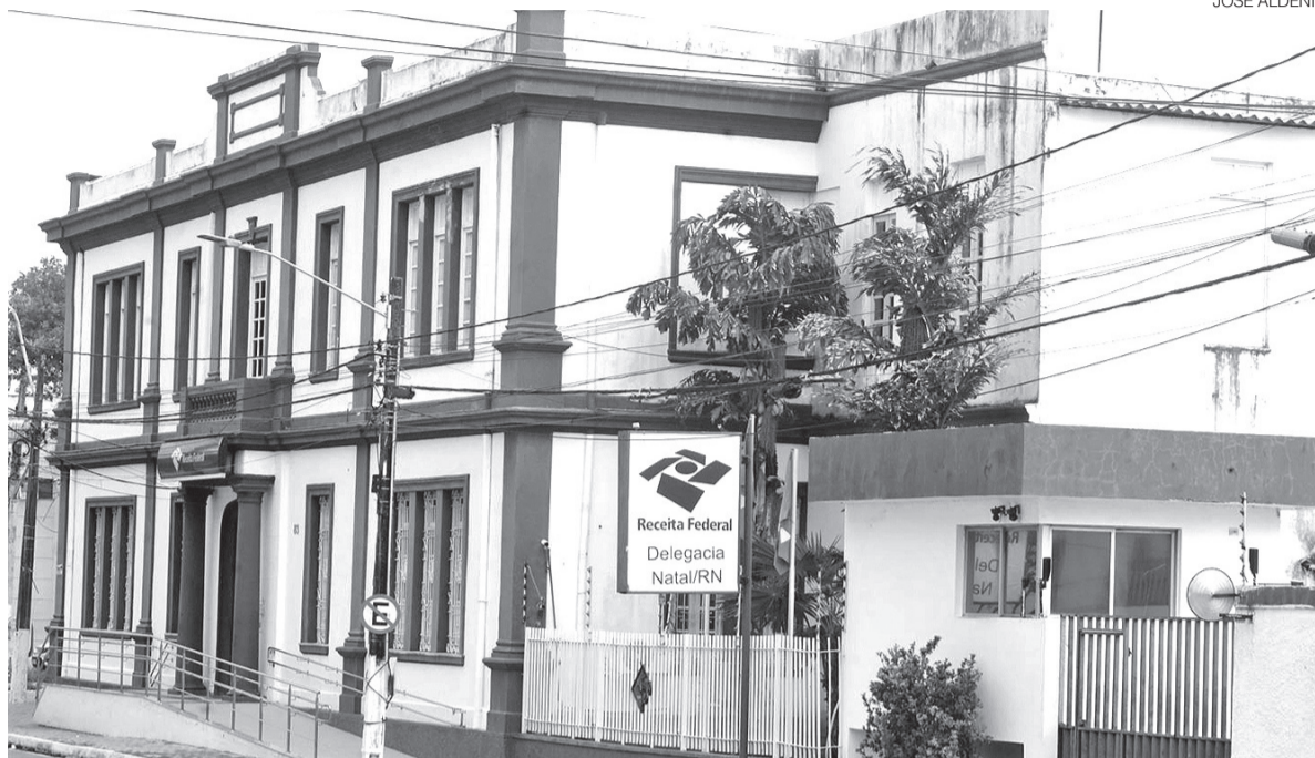
Chamado CNPJ alfanumérico, que combina letras e números, será válido para as novas empresas abertas no País

O novo formato foi criado para ampliar a capacidade de emissão de cadastros diante do crescimento contínuo do número de empresas no país. Segundo a Receita Federal, a estrutura exclusivamente numérica caminhava para o esgotamento das combinações possíveis, tornando necessária a adoção de um modelo