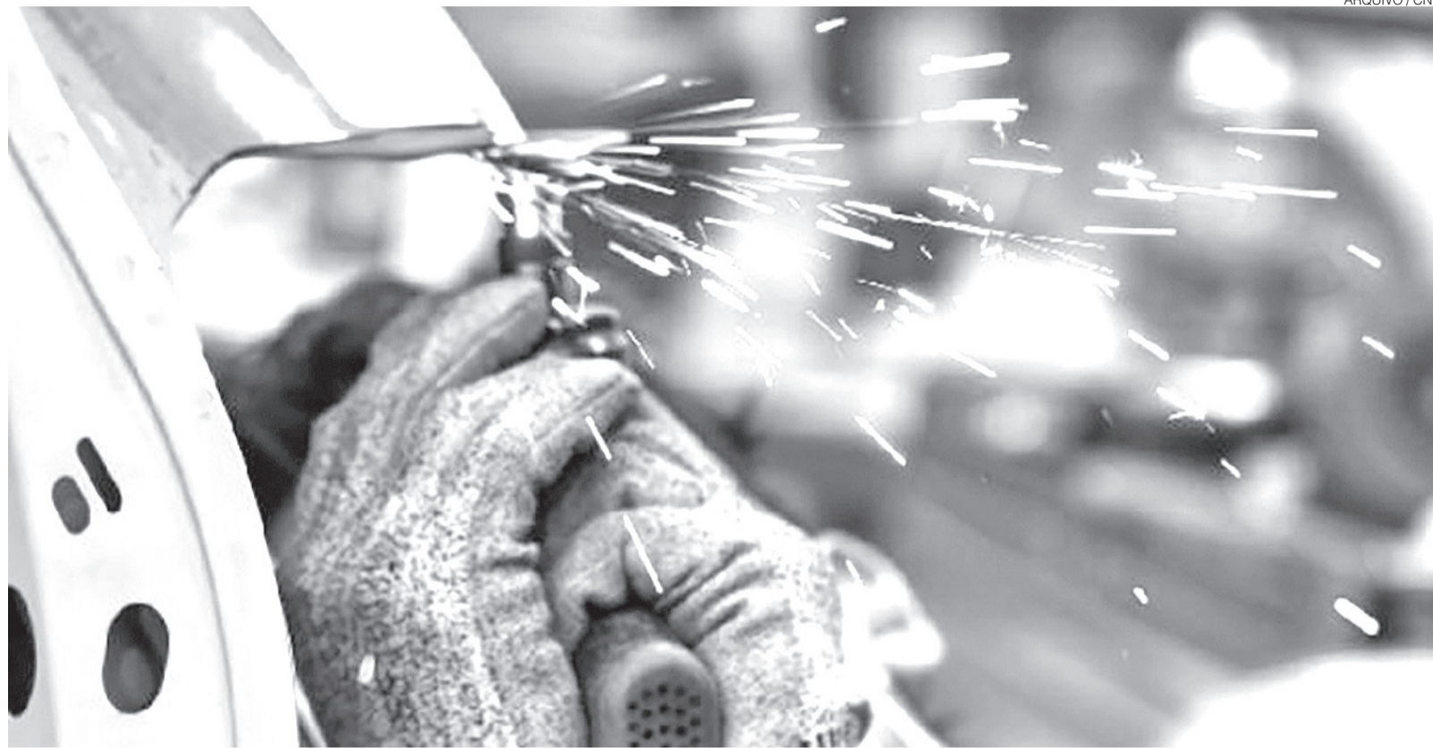
Apesar da queda do Icei no Nordeste, indicador ficou acima dos 50 pontos, o que significa otimismo, enquanto que nas demais regiões do País o pessimismo persiste

Os empresários mais pessimistas são os dos segmentos de biocombustíveis, metalurgia, madeira, couros e artefatos de couro. Em sentido oposto, apenas cinco setores seguem demonstrando confiança: farmacêuticos e químicos, perfumaria, limpeza e higiene pessoal, produtos diversos, impressão e