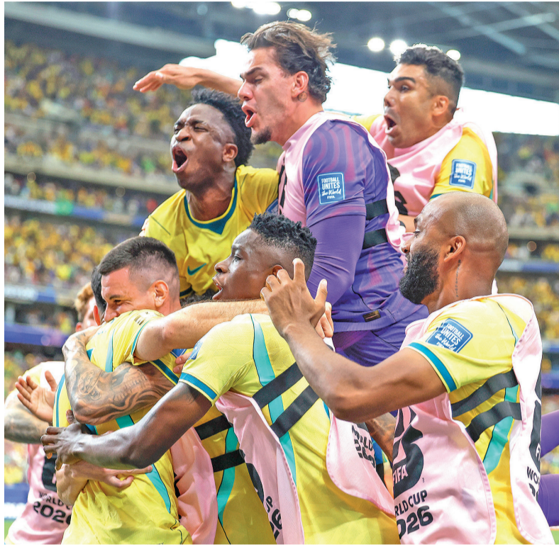
Brasil conquistou vaga nas oitavas com gol praticamente no lance final em Houston