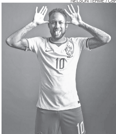
Neymar tirou "onda" após o jogo

após vencer o Japão por 2 a 1 de virada. A equipe asiática saiu na frente com gol de Kaishu Sano ainda no primeiro tempo. Na etapa final, Casemiro empatou de cabeça, e Gabriel Martinelli marcou o gol da vitória aos 49 minutos do segundo tempo, praticamente no último lance da partida, evitando a prorro-