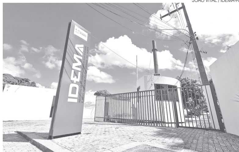
Diretor do Idema ressalta debates sobre a proposta ao longo dos últimos dois anos

Outra inovação é a regulamentação do licenciamento ambiental corretivo. O projeto cria a Licença de Operação Corretiva (LOC), destinada à regularização de empreendimentos que estejam funcionando sem licença ambiental válida. Em determinadas situações, essa regularização também poderá ocorrer por