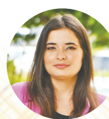
Nathallya Macedo Editora